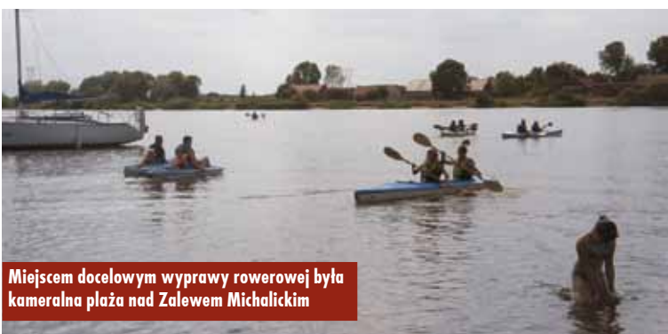
Miejscem docelowym wyprawy rowerowej była kameralna plaża nad Zalewem Michalickim

Celem rajdu rowerowego była wspólna, rodzinna i grupowa podróż jednośladami połączona ze zwiedzaniem terenów położonych na południe od Trębaczowa. Geodezyjny obszar tej miejscowości jest jednocześnie granicą województwa wielkopolskiego, które w tych okolicach graniczy z województwami dolnośląskim i opolskim. Miejscem