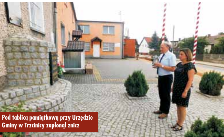
Pod tablicą pamiątkową przy Urzędzie Gminy w Trzcínicy zapłonął znicz

Wniosek na funkcjonowanie i doposażenie żłobka w Trzcínicy uzyskał wymaganą liczbę punktów w trakcie oceny merytorycznej i został skierowany do kolejnego etapu, którym są negocjacje