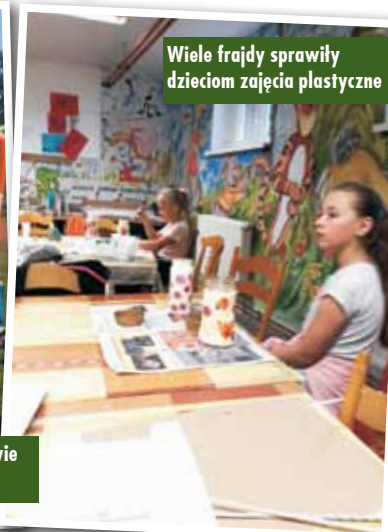
Wiele frajdy sprawiły dzieciom zajęcia plastyczne

Organizatorzy starali się, żeby żadne dziecko nie nudziło się podczas zajęć, dlatego przygotowali szeroką gamę aktywności.