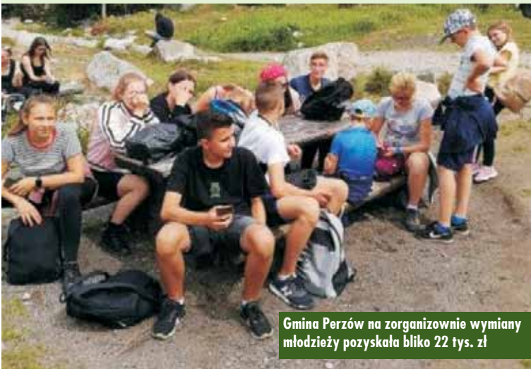
Gmina Perzów na zorganizowanie wymiany młodzieży pozyskała blisko 22 tys. zł

VI Trębaczowski Rajd Rowerowy zorganizowany przez Towarzystwo Sympatyków Trębaczowa