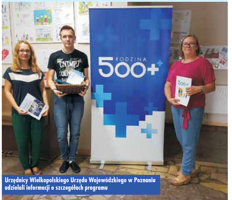
Urzednicy Wielkopolskiego Urzedu Wojewodzkiego w Poznaniu udzielali informacji o szczegolach programu

25 lipca 2019 r. w godzinach od 12:00 do 13:00 została przeprowadzona akcja promocyjno-informacyjna programu „Rodzina 500 plus”.