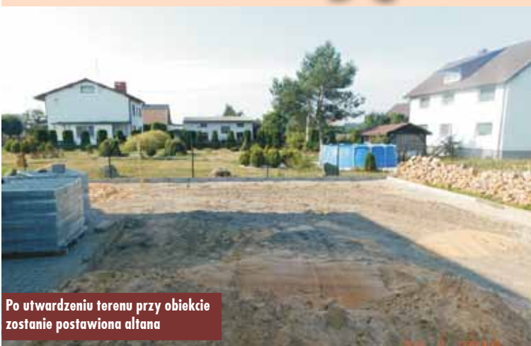
Po utwardzeniu terenu przy obiekcie zostanie postawiona altana

Wykonywane prace polegają na utwardzeniu kostką betonową wjazdu oraz terenu za budynkiem Domu Ludowego. Następnie na tym terenie zostanie postawiona altana. Na wykonanie i montaż altany została już zawarta umowa z wykonawcą z terminem realizacji do 27 września 2019 r. Zmodernizowany został także komin kotłowni.