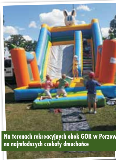
Na terenach rekreacyjnych obok GOK w Perzowie na najmłodszych czekały dmuchańce