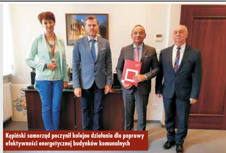
Kępiński samorząd poczynił kolejne działania dla poprawy efektywności energetycznej budynków komunalnych