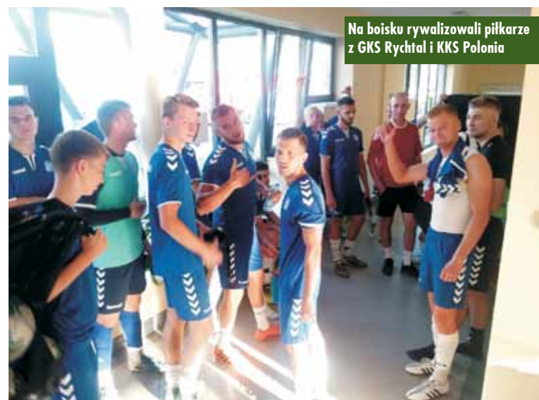
Na boisku rywalizowali piłkarze z GKS Rychtal i KKS Polonia