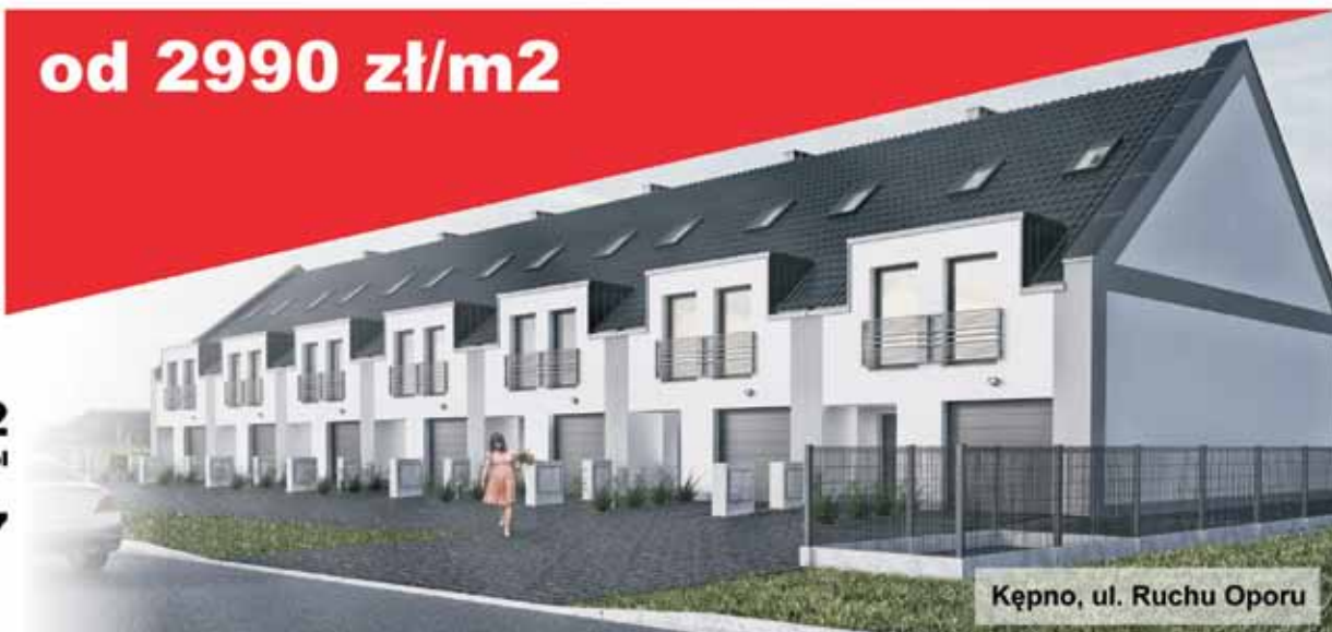
Kępno, ul. Ruchu Oporu