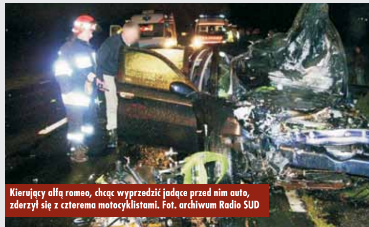
Kierujący alfą romeo, chcąc wyprzedzić jadące przed nim auto, zderzył się z czterema motocyklistami.

Dopiero teraz sprawca wypadku wpadł w ręce niemieckiej policji, która przekazała go stronie polskiej