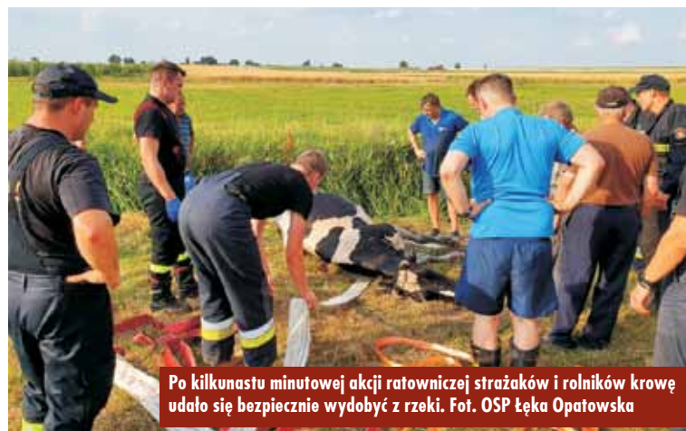
Po kilkunastu minutowej akcji ratowniczej strażaków i rolników krowę udało się bezpiecznie wydobyć z rzeki.