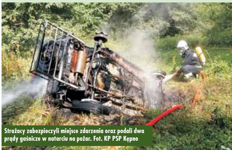
Strażacy zabezpieczyli miejsce zdarzenia oraz podali dwa prądy gaśnicze w natarciu na pożar.

ciwpożarowej stwierdzono pożar samochodu znajdującego się na zewnątrz i nie wymagał pomocy medycznej. Działania strażaków polegały na zabezpieczeniu miejsca zdarzenia oraz podaniu dwóch prądów gaśniczych w natarciu, co doprowadziło do ugaszenia pożaru – relacjonuje oficer prasowy KP PSP Kępno kpt. Paweł Michalski. Oprac. KR