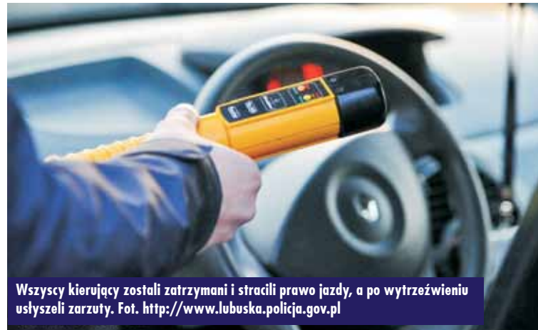
Wszyscy kierowcy zostali zatrzymani i stracili prawo jazdy, a po wytrzeźwieniu usłyszeli zarzuty.

Kolejny pijany kierowca został zatrzymany 3 sierpnia br. Kępińscy funkcjonariusze na Os. Kopa w Kępnie zatrzymali do kontroli samochód osobowy marki Opel Astra. Przyczyną kontroli było popełnienie wykroczenia w ruchu drogowym. Oplem kierował 23-letni obywatel Ukrainy.