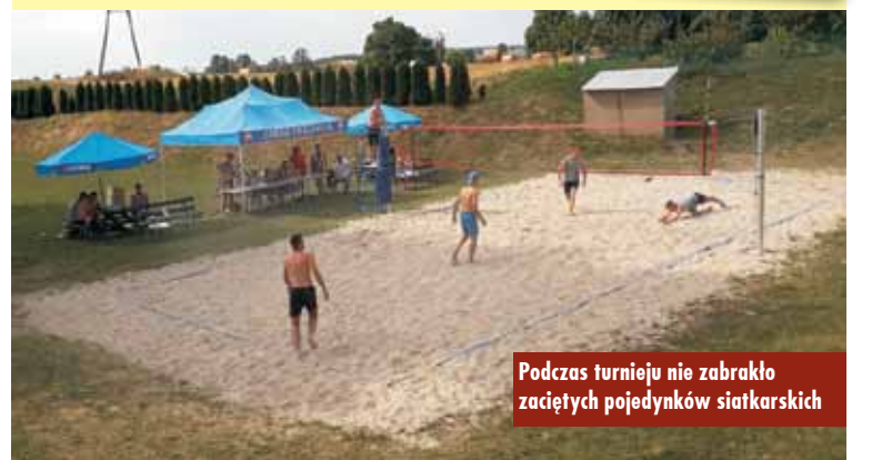
Podczas turnieju nie zabrakło zaciętych pojedynków siatkarskich

wodno-ściekowa” Poddziałanie 4.3.1 „Gospodarka wodno-ściekowa” Wielkopolskiego Regionalnego Programu Operacyjnego na lata 2014-2020.