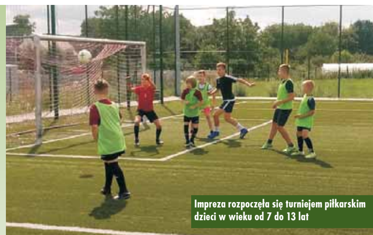
Impreza rozpoczęła się turniejem piłkarskim dzieci w wieku od 7 do 13 lat

Impreza rozpoczęła się turniejem piłkarskim dzieci w wieku od 7 do 13 lat. Młodzi piłkarze jak zwykle nie zawiedli, a animatorzy – Domi-