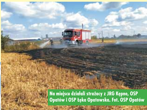
Na miejscu działali strażacy z JRG Kępno, OSP Opatów i OSP Łęka Opatowska.

2 sierpnia br., około godziny 11.00, do Stanowiska Kierowania Komendanta Powiatowego Państwowej Straży Pożarnej w Kępnie wpłynęło zgłoszenie o pożarze ścierniska w Opatowie. Na miejsce zadysponowane zostały zastępy z Jednostki Ratow-