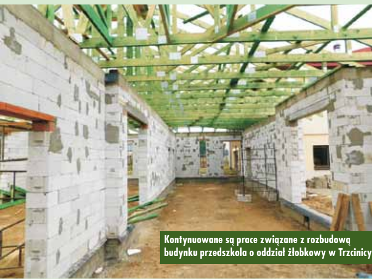
Kontynuowane są prace związane z rozbudową budynku przedszkola o oddział żłobkowy w Trzcínicy

Przypomnijmy, iż uruchomienie oddziału żłobkowego planowane jest na 1 grudnia 2019 r. Oprac. bem