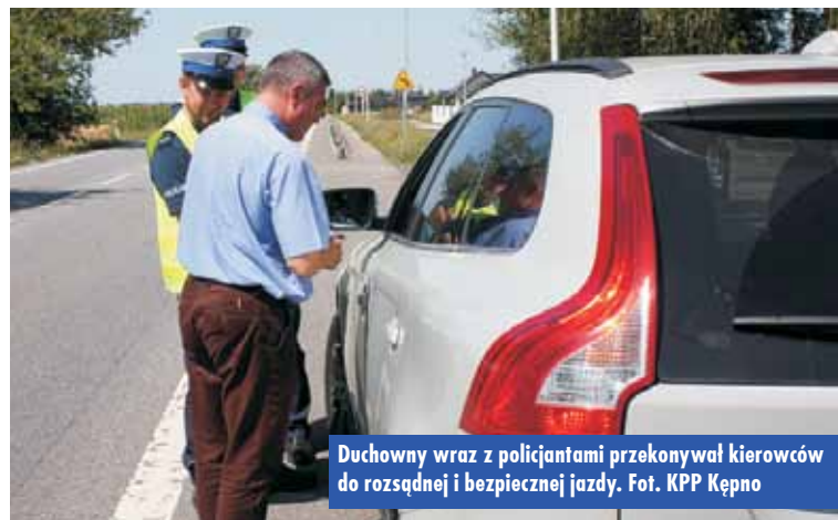
Duchowny wraz z policjantami przekonywał kierowców do rozsądnej i bezpiecznej jazdy.

cjonariusze Wydziału Ruchu Drogowego Komendy Powiatowej Policji w Kępnie wraz z kapelanem na drogach powiatu kępińskiego przeprowadzili