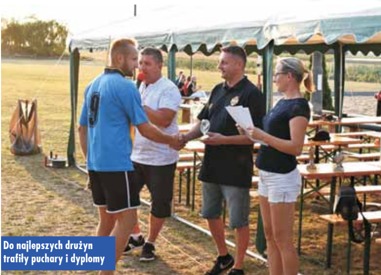
Do najlepszych drużyn trafiły puchary i dyplomy

Do tegorocznych rozgrywek beach soccera, które odbyły się 27 lipca 2019 r. w Piaskach, przystąpiło siedem drużyn: Biadaszki, Czarne Konie, Kuźnica Słupska, Piaski, Raków, Słupia oraz Trzebień.