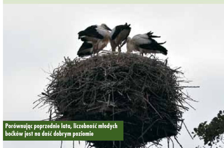
Porównując poprzednie lata, liczebność młodych boćków jest na dość dobrym poziomie

wrącą. Gniazda powoli zarastają. Porównując poprzednie lata, liczebność młodych boćków jest na dość dobrym poziomie. Więcej młodych odnotowano tylko w ubiegłym roku – 25. Wcześniejsze lata były mniej korzystne dla tych sympatycznych ptaków. SP Kierzno