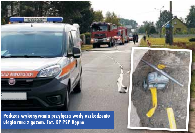
Podczas wykonywania przyłącza wody uszkodzeniu uległa rura z gazem.

W czwartek, 1 sierpnia br., około godziny 9.20, dyżurny Stanowiska Kierowania Komendanta Powiatowego Państwowej Straży Pożarnej w Kępnie otrzymał zgłoszenie o uszkodzeniu gazociągu w miejscowości Osiny. Do zdarzenia zadysponowano zastępy z Jednostki Ratowniczo-Gaśniczej w Kępnie. - Po przybyciu na miejsce pierwszych jednostek ochrony przeciwpożarowej stwierdzono, że podczas wykonywania przyłącza wody uszkodzeniu uległa rura z gazem. Rozszczelnienie zo-