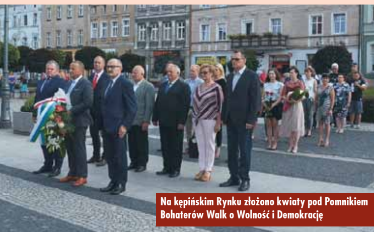
Na kępińskim Rynku złożono kwiaty pod Pomnikiem Bohaterów Walk o Wolność i Demokrację