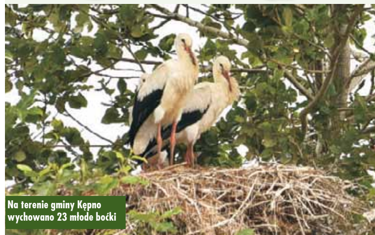
Na terenie gminy Kępno wychowano 23 młode boćki

W lipcu br., jak co roku, dokonano inwentaryzacji bocianich gniazd na terenie gminy Kępno. Odwiedzając miejsca gniazdowania tego sympatycznego ptaka, rozmawiano z gospodarzami posesji, na których zamieszkują. Były to bardzo miłe spotkania, bowiem gospodarze interesu-