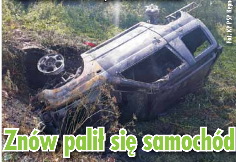
Fot. KP PSP Kępno