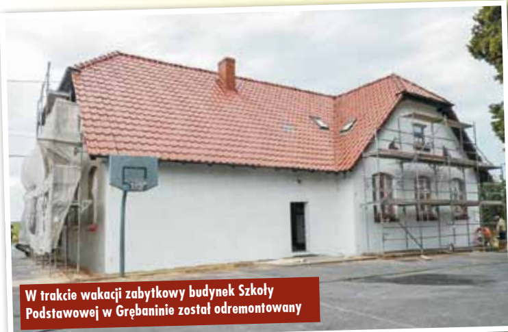
W trakcie wakacji zabytkowy budynek Szkoły Podstawowej w Grębaninie został odremontowany

Na początek zagadka. Otóż, kto nam powie, ile w gminie jest Baranów szkół podstawowych? Jesteśmy przekonani, że wielu wykreśliło z tej listy Grębanin. To duży błąd. Otóż Szkoła Podstawowa w Grębaninie istnieje jak najbardziej, tyle, że uczyć się w niej będą już tylko najmłodsze dzieci (kl. I-IV). W trakcie wakacji zabytkowy budynek został odremontowany, położono nowe tynki (baranek!), pomalowano, zainstalowano nową instalację ogromową, zamontowano również nowe rynny. A obok szkoły wyrósł piękny plac zabaw dla najmłodszych. ems