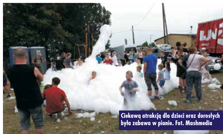
Ciekawą atrakcją dla dzieci oraz dorosłych była zabawa w pianie.