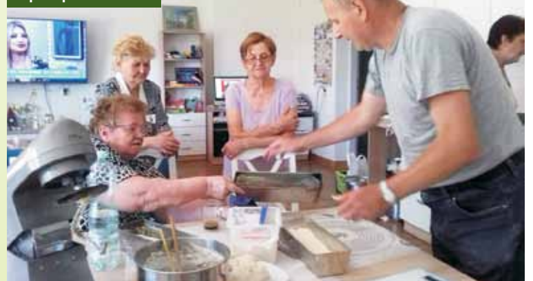
Wspólne pieczenie chleba