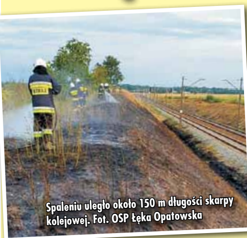
Spaleniu uległo około 150 m długości skarpy kolejowej.