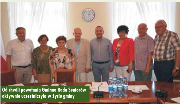
Od chwili powołania Gminna Rada Seniorów aktywnie uczestniczyła w życiu gminy