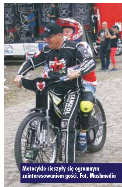
Motocykle cieszyły się ogromnym zainteresowaniem gości.

Wieczorem wystąpiły zespoły rockowe: „Ostatnie świnię”, „Anielski Orszak”, „Cicho”, „Apokalipsa” oraz