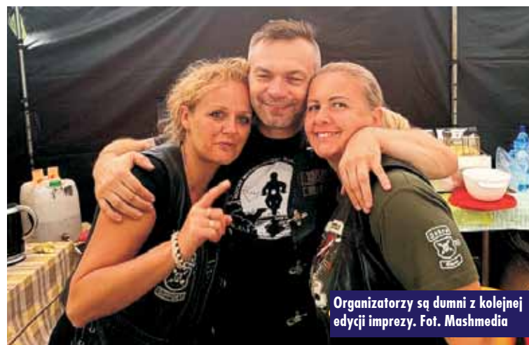
Organizatorzy są dumni z kolejnej edycji imprezy.