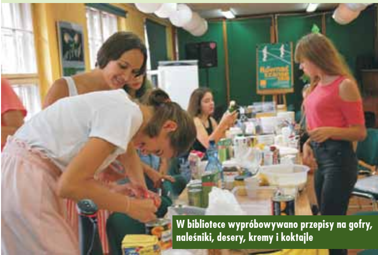
W bibliotece wypróbowywano przepisy na gofry, naleśniki, desery, kremy i koktajle

Partnerem medialnym projektu jest „Tygodnik Kępiński”. Oprac. bem