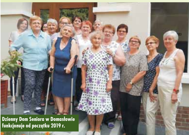
Dzienny Dom Seniora w Domasławie funkcjonuje od początku 2019 r.

Po jej likwidacji w związku z reformą szkolnictwa budynek stał pusty. - W setną rocznicę odzyskania niepodległości oddajemy mieszkańcom odnowiony budynek. Udało nam się go wyremontować i oddać do użytku seniorom. Ma to bardzo symboliczny wymiar - podkreślała podczas uroczystości otwarcia Dziennego Domu