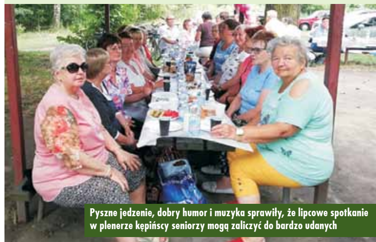
Pyszne jedzenie, dobry humor i muzyka sprawiły, że lipcowe spotkanie w plenerze kępińscy seniorzy mogą zaliczyć do bardzo udanych