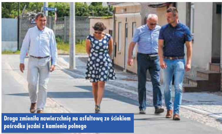
Droga zmieniła nawierzchnię na asfaltową ze ściekiem pośrodku jezdni z kamienia polnego

Wykonawcą robót było Kępińskie Przedsiębiorstwo Drogowo-Mostowe SA. Wartość całego zadania to 561.632,65 zł. ems