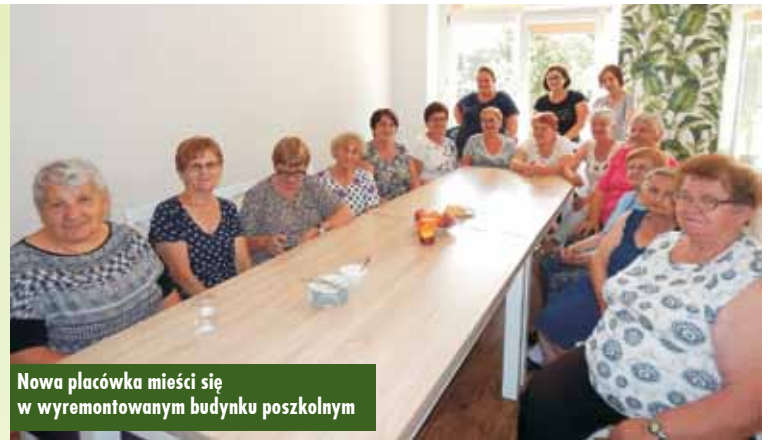
Nowa placówka mieści się w wyremontowanym budynku poszkolnym

Wspólnie spędzony czas zagospodarowany jest również przez samych seniorów, którzy, dzieląc się swoimi pasjami, organizują lekcje historii, gotowania czy robótek ręcznych. Wspólnie przyrządzano już takie przysmaki jak: pierogi i pampuchy z jagodami, pieczono też chleb i robiono przetwory. Odbywają się spotkania edukacyjne w ramach współpracy z jednostkami organizacyjnymi gminy. Bibliotekarka z Biblioteki Publicznej w Perzowie przywozi książki, a zajęcia plastyczne prowadzone są przez instruktorkę z Gminnego Ośrodka Kultury. Organizowane są także biśiady urodzinowe i okolicznościowe: Dzień Babci i Dziadka, Dzień Kobiet czy Walentynki. W sposób wyjątkowy seniorzy świętowały tegoroczny Dzień Matki. Panie poddane zostały metamorfozom wykonanym przez Atelier Staszak z Kępna, a profesjonalny makijaż, stylizacja włosów, odpowiednio dopasowana kreacja przyniosły spektakularne efekty.