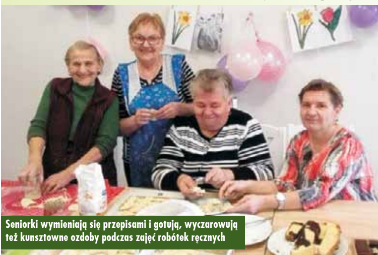
Seniorzy wymieniają się przepisami i gotują, wycarowują też kunsztowne ozdoby podczas zajęć robótek ręcznych

gramu Gmina pozyskała dodatkowe środki na jego funkcjonowanie w wysokości 50.400,00 zł.