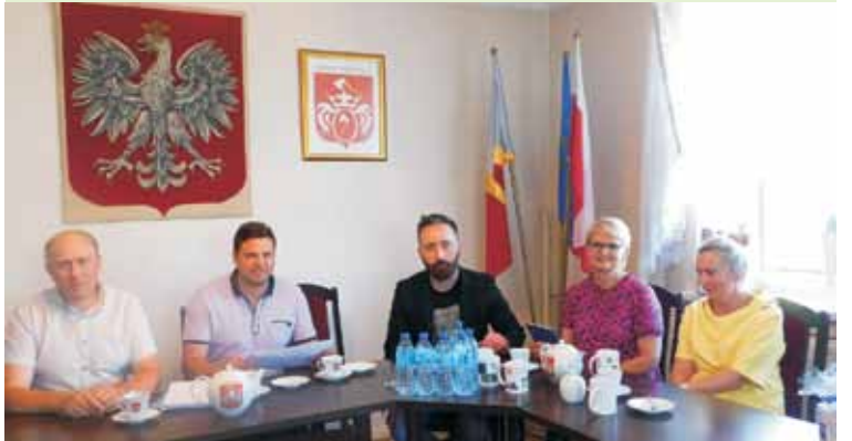
Sędziowie konkursu „Działania proekologiczne i prokulturowe w ramach strategii rozwoju województwa wielkopolskiego” oceniali zgłoszone przez Gminę Trzcinica przedsięwzięcie

Laureaci mają możliwość zaprezentowania swoich fotografii podczas różnych imprez i uroczystości gminnych. Prace, biorące udział w konkursach, wykorzystywane są również do realizacji gminnych materiałów promocyjnych, takich jak okolicznościowe pocztówki i kalendarze,