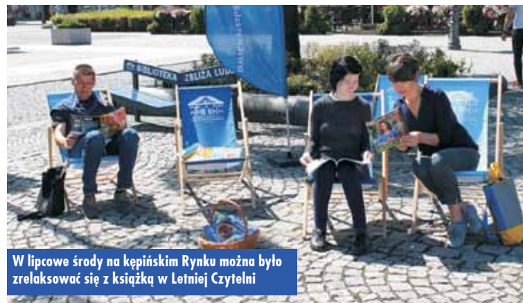
W lipcowe środy na kępińskim Rynku można było zrelaksować się z książką w Letniej Czytelni

Zajęcia plastyczne z ilustratorką książek, warsztaty usprawniające motorykę dłoni osób niepełnosprawnych, a także warsztaty czerpania