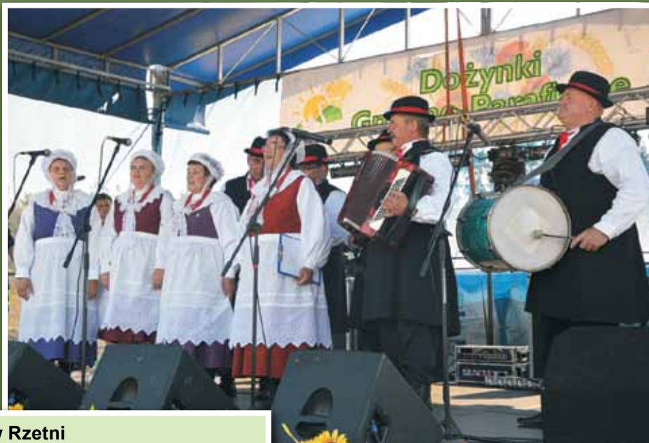
Dożynki Gminno-Parafialne w Rzetni