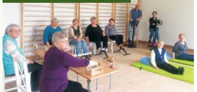
W budynku znajduje się m.in. salka wyposażona w akcesoria do ćwiczeń rehabilitacyjnych i sprzęt gimnastyczny

czy: - Kiedy wiem, że tu przyjadę, to czuję się bardziej ożywiona i weselsza, cieszę się po prostu.