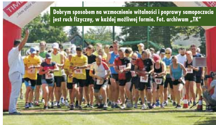
Dobrym sposobem na wzmocnienie vitalności i poprawy samopoczucia jest ruch fizyczny, w każdej możliwej formie.

miejsca, środowiska, budujemy w sobie świeższe spojrzenie na to, co robiliśmy dotychczas. Zastanawiamy się wówczas nad przeprogramowaniem swoich działań, tworząc nowe oblicze sensowności własnych poczynąń prywatnych, zawodowych czy szukając nowych sposobów poprawy relacji w sytuacjach rodzinnych. Musimy jednak pamiętać, że to my sami musimy chcieć otworzyć się na te zmiany i dążyć do osiągnięcia zamierzonego celu. Często w takich sytuacjach sprawdza się metoda małych kroków i dotyczy ona również naszego zdrowia. Dobrym sposobem na wzmocnienie vitalności i poprawy samopoczucia jest ruch fizyczny, w każdej możliwej formie. Zadajemy sobie pytanie – po co potrzebny jest mi wysiłek fizyczny skoro ciężko pracuję zawodowo, a i po pracy też jest ogrom zajęć?