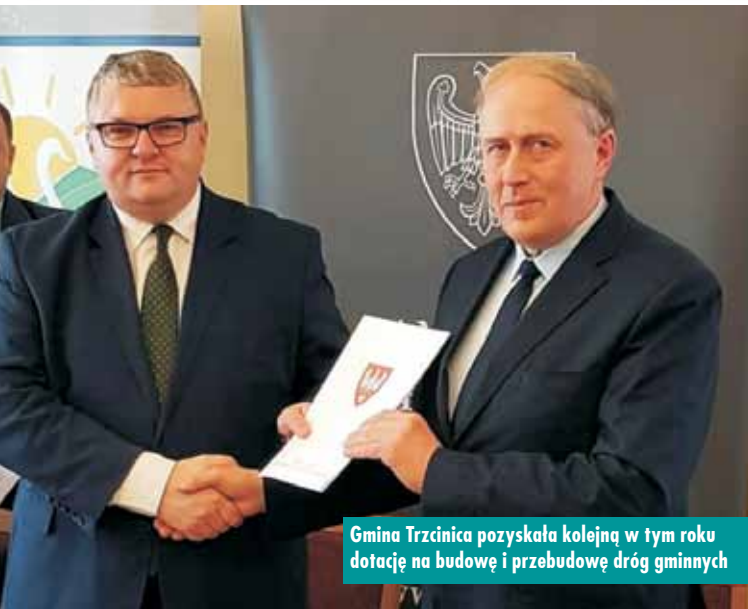
Gmina Trzcinica pozyskała kolejną w tym roku dotację na budowę i przebudowę dróg gminnych

Gmina Trzcinica otrzymała środki finansowe w wysokości 97.600,00 złotych na budowę i przebudowę dróg gminnych. Sejmik Województwa Wielkopolskiego podjął uchwałę w sprawie udzielenia pomocy finansowej jednostkom samorządu terytorialnego 15 lipca 2019 r.