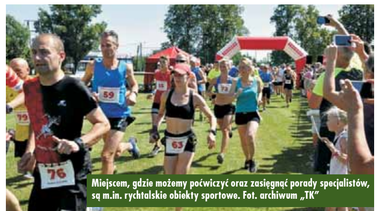
Miejsce, gdzie możemy poćwiczyć oraz zasięgnąć porady specjalistów, są m.in. rychtałskie obiekty sportowe.

izometrycznym skurczu mięśni, czyli napięciem mięśni, któremu nie towarzyszą ruchy kończyn. Przykładami statycznego wysiłku fizycznego są: przenoszenie, podtrzymywanie lub przesuwanie ciężkich przedmiotów, utrzymywanie wymuszonej pozycji ciała itp. Wysiłek ten jest niekorzyst-