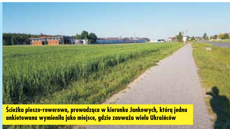
Ścieżka pieszo-rowerowa, prowadząca w kierunku Jankowich, którą jedna ankietowana wymieniła jako miejsce, gdzie zauważa wielu Ukraińców

„Nie studiowałam nigdy na Ukrainie, ale wydaje mi się, że studia w Polsce są bardziej ukierunkowane profilowo. Słyszałam, że ukraińscy studenci się skarżą, że mają dużo pobocznego materiału do przyswojenia”.