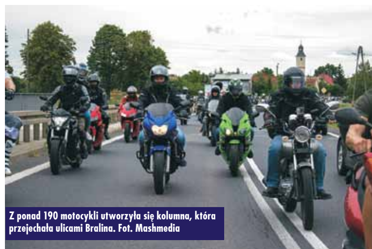
Z ponad 190 motocykli utworzyła się kolumna, która przejechała ulicami Bralina.

do Bralina już w piątkowe przedpołudnie. Rozstawione na parkingu tuż przy klubie motocykle cieszyły się ogromnym zainteresowaniem gości i zapierały dech w piersiach, a ich właściciele z dumą chwalili się swoimi „skarbami” i miło spędzali czas w gronie motocyklowej rodziny. W