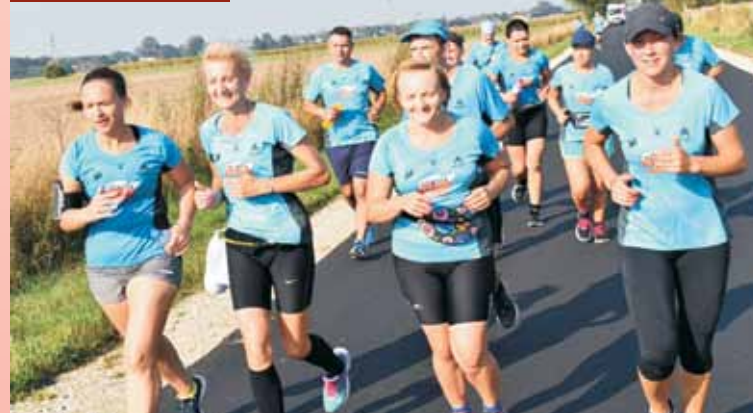
Na trasie Sztafety Pokoju

ków biegło dalej, aniżeli początkowo zakładali, co świadczyć może o ich ogromnej determinacji.