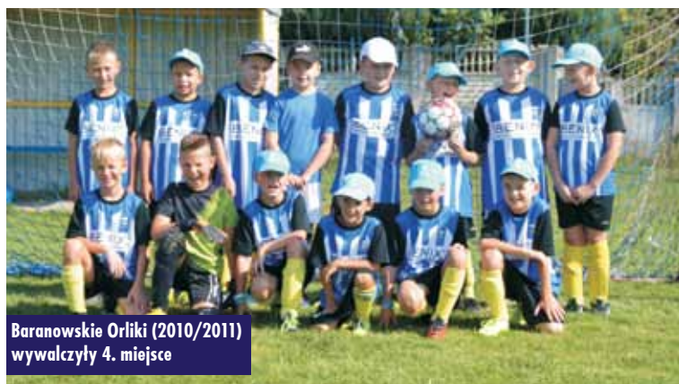
Baranowskie Orliki (2010/2011) wywalczyły 4. miejsce