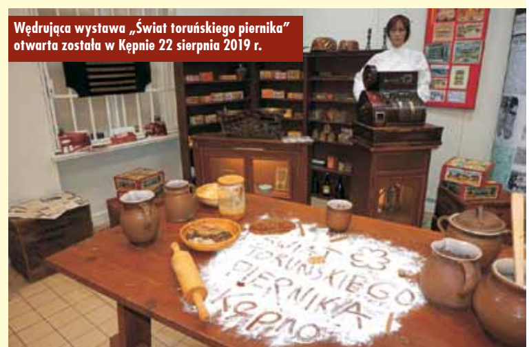
Wędrująca wystawa „Świat toruńskiego piernika” otwarta została w Kępnie 22 sierpnia 2019 r.

Toruń założony w 1233 roku położony nad Wisłą, od samego początku stanowił ważny ośrodek handlowy. Do dzisiaj miasto sławę swoją