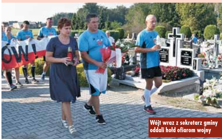
Wójt wraz z sekretarzem gminy oddali hołd ofiarom wojny

w latach 1939-45. To są niewielkie pomniki symbolizujące wielką tragedię, jaka dotknęła wówczas tysiące niewinnych ludzi – relacjonował Wojciech Murański.