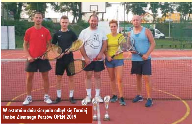
W ostatnim dniu sierpnia odbył się Turniej Tenisa Ziemnego Perzów OPEN 2019