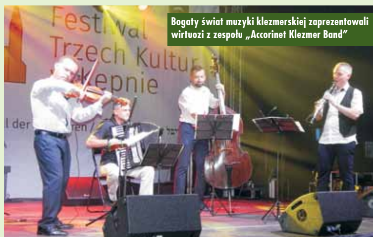
Bogaty świat muzyki klezmerskiej zaprezentowali wirtuozzi z zespołu „Accorinet Klezmer Band”