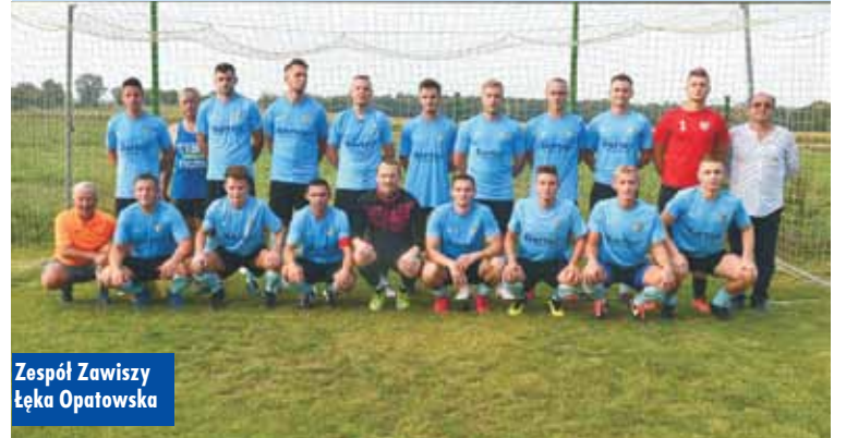
Zespół Zawiszy Łęka Opatowska

w tym zespole rozbłysła zatruta iskra altruizmu. Zamiast spokojnie dobić przynębionego rywala, Zawiszanie postanowili pomóc mu podnieść się z kolan. Oto w 61. minucie za faul na leżącym już zawodniku sędzia wyrzucił z boiska Kurkiewicza. Jeśli trenerzy „Zawiszy” mieli jakiś plan na ostatnie pół godziny meczu, to po tym zdarzeniu raptownie musieli go zmienić. Utrata doświadczonego stopera i perspektywa walki w obezwładniają-