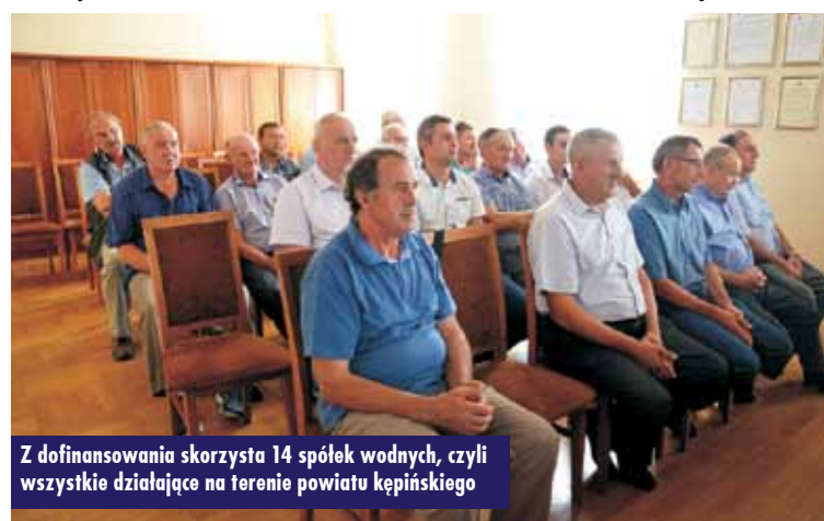
Z dofinansowania skorzysta 14 spółek wodnych, czyli wszystkie działające na terenie powiatu kępińskiego

ści spółek wodnych z terenu powiatu kępińskiego z ich władzami. Dofinansowanie z budżetu Województwa przeznaczone zostanie na realizację robót, w tym bieżące utrzymanie wód