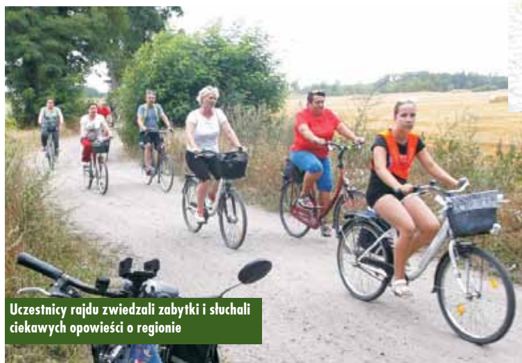
Uczestnicy rajdu zwiedzali zabytki i słuchali ciekawych opowieści o regionie

Samorząd gminny zadbał o organizację letniego wypoczynku dzieci i młodzieży z gminy Trzcinica