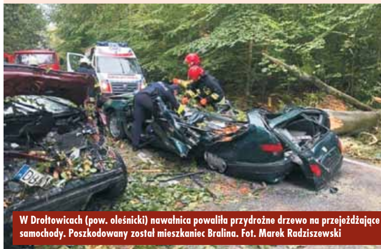
W Droltowicach (pow. oleśnicki) nawałnica powaliła przydrożne drzewo na przejeżdżające samochody. Poszkodowany został mieszkaniec Bralina.

Natomiast w godzinach 15.45 – 22.45 dyżurny SKKP PSP Kępno odebrał 12 zgłoszeń dotyczących połamanych drzew, uszkodzonych budynków, zerwanych dachów oraz zalanych posesji. - Najpoważniejsze zdarzenie miało miejsce w Rakowie, gdzie drzewo przewróciło się na stodołę, w wyniku czego uszkodzony został dach oraz konstrukcja budynku – poinformował asp. J. Sobczak.