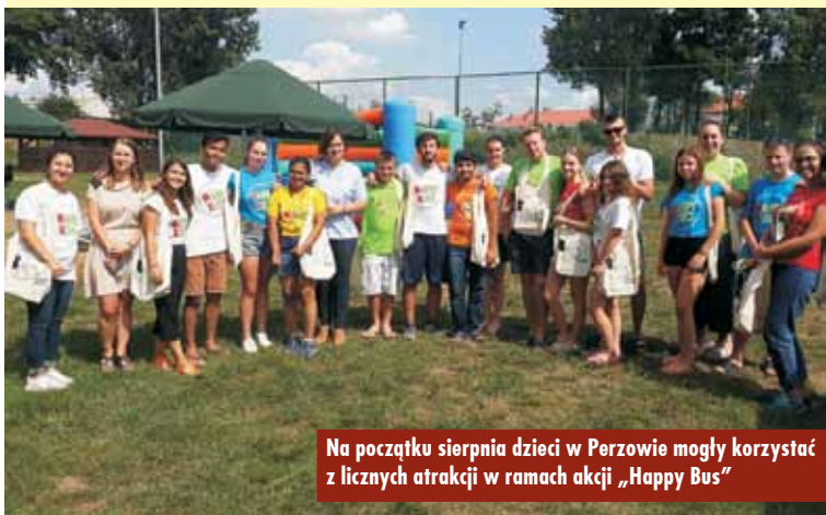
Na początku sierpnia dzieci w Perzowie mogły korzystać z licznych atrakcji w ramach akcji „Happy Bus”

Punktem kulminacyjnym letniej oferty, który zakończył tegoroczne wakacje, było kino plenerowe. Wy-