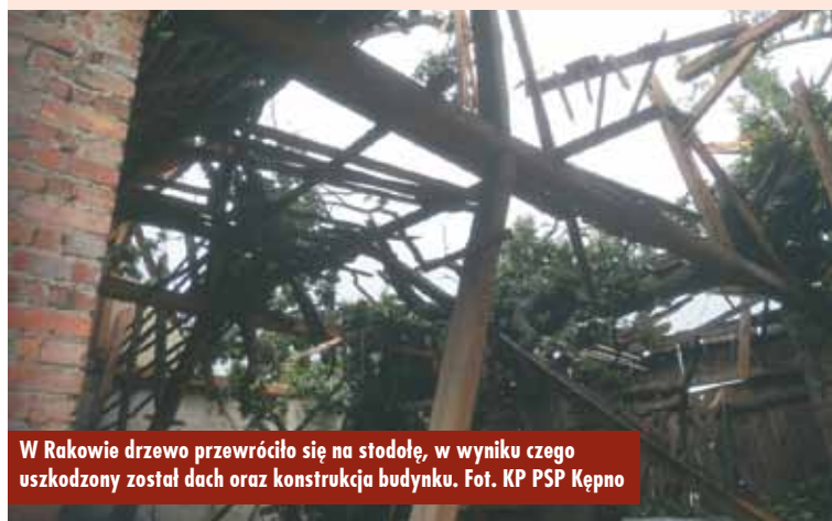
W Rakowie drzewo przewróciło się na stodołę, w wyniku czego uszkodzony został dach oraz konstrukcja budynku.

Zdarzenie na drodze technicznej prowadzącej wzdłuż drogi S8 w Myjomicach