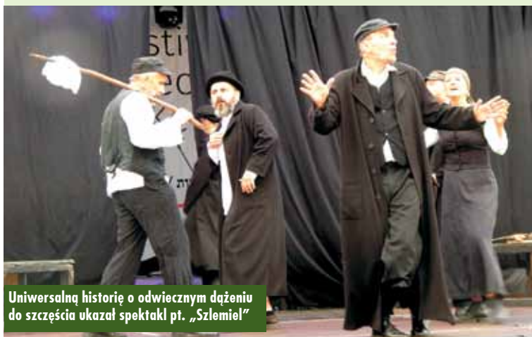
Uniwersalną historię o odwiecznym dążeniu do szczęścia ukazał spektakl pt. „Szlemiel”