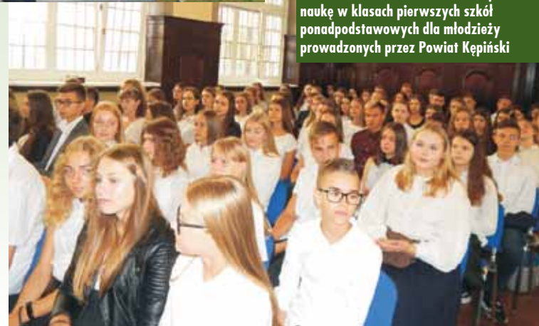
910 uczniów w 34 oddziałach rozpocznie naukę w klasach pierwszych szkół ponadpodstawowych dla młodzieży prowadzonych przez Powiat Kępiński

Na początku uroczystości upamiętniano 80. rocznicę wybuchu II wojny światowej. Starosta kępiński