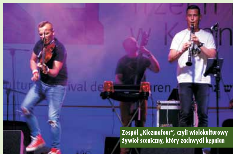
Zespół „Klezmafour”, czyli wielokulturowy żywioł sceniczny, który zachwycił kępnian

III Festiwal Trzech Kultur zainaugurowany został w niedzielę, 25 sierpnia 2019 r., w kinie „Sokolnia” projekcją filmu „Austeria” (1982 r.) w reżyserii Jerzego Kawalerowicza oraz spotkaniem z Tomaszem Raczkim , teatrologiem, krytykiem filmowym i publicystą. Publiczność