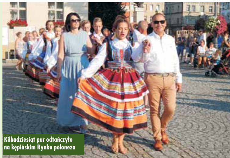
Kilkadziesiąt par odtńczyło na kępińskim Rynku poloneza

Artystyczne walory spektaklu dodatkowo wzbogaciła tradycyjna muzyka klezmerska, która na dłużej zagościła na kępińskiej scenie. Po przedstawieniu widzowie zaproszeni zostali bowiem na koncert w wykonaniu artystów Filharmonii Kaliskiej, występujących pod szyldem „Accorinet Klezmer Band”. Zespół złożony z czterech muzyków grających na