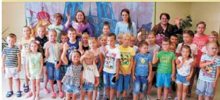
Tym razem najmłodsi mieszkańcy gminy zaproszeni zostali do wspólnego obejrzenia perypetii słynnego dzwonnika z Notre Dame

Aktorzy za swą wspaniałą grę zostali nagrodzeni brawami oraz kwiatami,