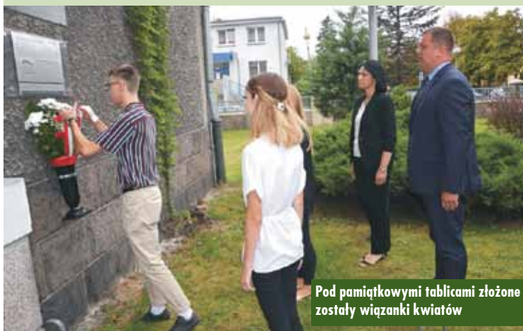
Pod pamiątkowymi tablicami złożone zostały wiązanki kwiatów