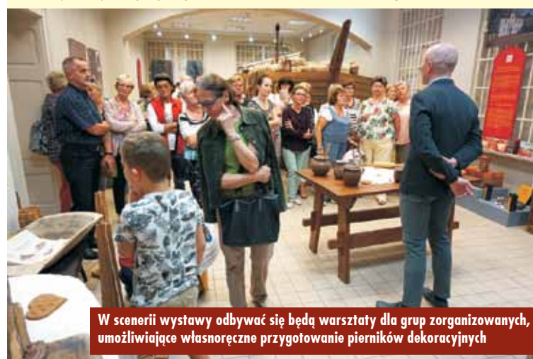
W scenarii wystawy odbywać się będą warsztaty dla grup zorganizowanych, umożliwiające własnoręczne przygotowanie pierników dekoracyjnych

zeum Toruńskiego Piernika (Oddział Muzeum Okręgowego w Toruniu).