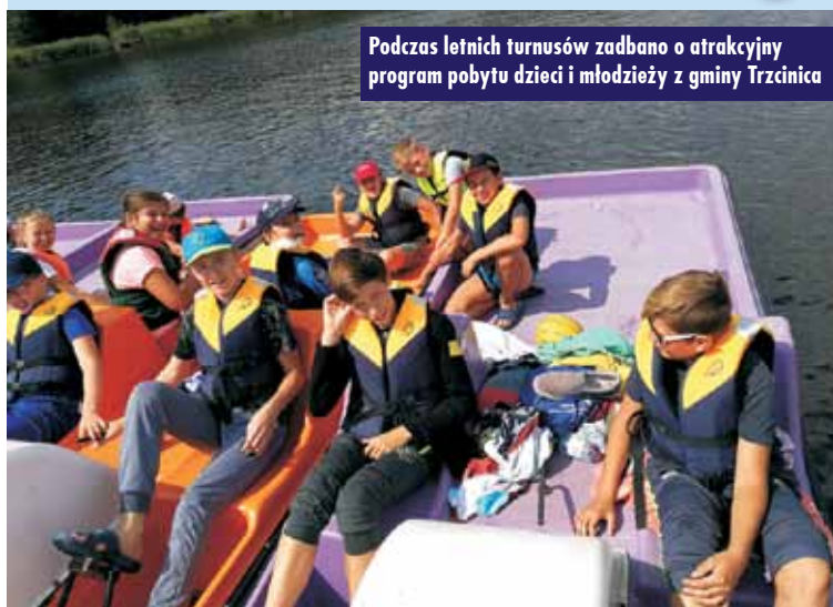
Podczas letnich turnusów zadbano o atrakcyjny program pobytu dzieci i młodzieży z gminy Trzcinica

21 lipca 2019 r. 30 dzieci i młodzieży z terenu gminy Trzcinica wyjechało na 15-dniowy turnus do Wieleń na Pojezierzu Leszczyńskim. Dla 20 dzieci wypoczynek zorganizowany został w ramach Gminnego Programu Profilaktycznego. Podczas turnusu, który trwał do 4 sierpnia, zorganizowano wiele atrakcji, takich