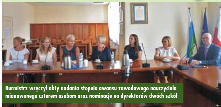
Burmistrz wręcza akty nadania stopnia awansu zawodowego nauczyciela mianowanego czterem osobom oraz nominacje na dyrektorów dwóch szkół

27 sierpnia br. w Urzędzie Miasta i Gminy w Kępnie odbyła się uroczystość wręczenia nominacji dla nowo wybranych dyrektorów szkół oraz aktów nadania stopnia awansu zawodowego nauczycielom.