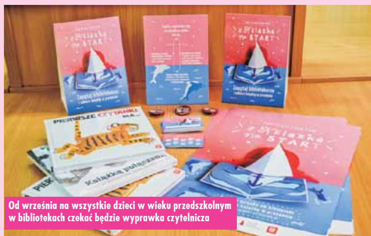
Od września na wszystkie dzieci w wieku przedszkolnym w bibliotekach czekać będzie wyprawka czytelnicza

Grupa piłkarzy baranowskiego Pioniera wzięła udział w Turnieju o Puchar Wójta Gminy Trzcinica