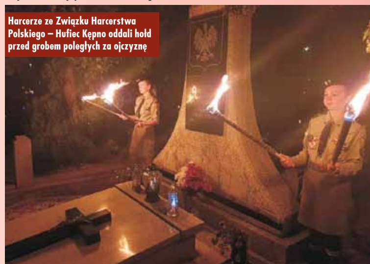
Harcerze ze Związku Harcerstwa Polskiego – Hufiec Kępno oddali hołd przed grobem poległych za ojczyznę

nej, jeśli nie śmiercią i terrorem, to głodem i biedą? Trudno nam, mieszkańcom Kępna XXI wieku, znaleźć dziś odpowiedź na to pytanie. Ale na pewno możemy odpowiedzieć sobie na inne pytanie: dlaczego tutaj przyszlismy? Czy jedynie na pamiątkę, bo jest kolejna rocznica wybuchu II wojny światowej? Jestem przekonany, że jesteśmy tu, aby wypełnić pewne zobowiązanie, oddać cześć tym, którzy od 1 września 1939 r. walczyli w Polsce. Świadomie mówię o walczących w Polsce, ponie-