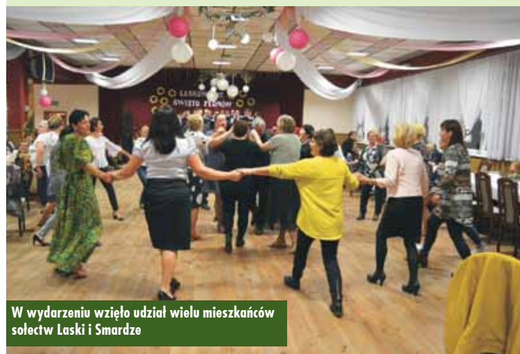
W wydarzeniu wzięło udział wielu mieszkańców sołectw Laski i Smardze

Trwa realizacja projektu „Akademia wesołego przedszkolaka w Publicznym Przedszkolu Samorządowym w Laskach”