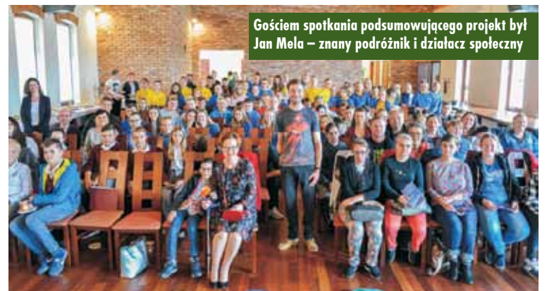
Gościem spotkania podsumowującego projekt był Jan Mela – znany podróżnik i działacz społeczny

pocztówką przedstawiające różne zakątki świata, stworzone przez dzieci z pomocą autorki. W zrealizowanych działaniach uczestniczyły głównie dzieci i młodzież z terenu gminy Baranów. W ramach zadania zostały również zakupione sztalugi. 17 września br. w „Chacie Baranowskiej” odbyło się uroczyste podsumowanie projektu. Gościem spotkania był Jan Mela – znany podróżnik i działacz społeczny. Duże zainteresowanie wśród zgromadzonych mieszkańców wzbudził pokaz jego zdjęć z wielu wypraw podróżniczych. Wydarzeniu