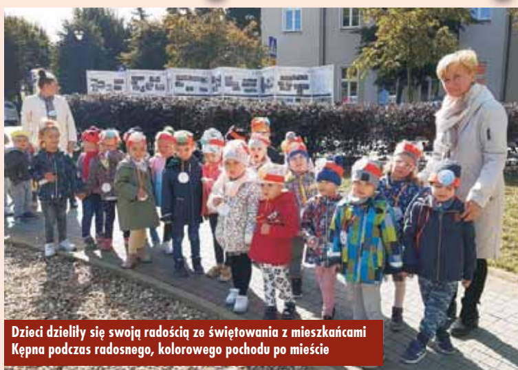
Dzieci dzieliły się swoją radością ze świętowania z mieszkańcami Kępna podczas radosnego, kolorowego pochodu po mieście

Również dzieci z Przedszkola Samorządowego nr 2 w Kępnie świętowały swój dzień. Z tej okazji