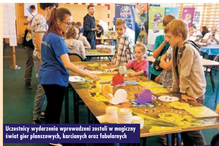
Uczestnicy wydarzenia wprowadzeni zostali w magiczny świat gier planszowych, karcianych oraz fabularnych

Jako pierwszy podczas wrześniowego weekendu rozegrany został Planszowy Turniej Międzyszkolny. Wzięło w nim udział aż 9 reprezen-