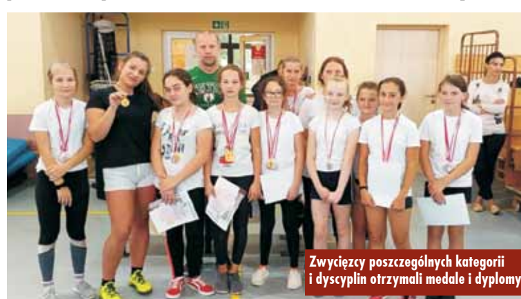
Zwycięzcy poszczególnych kategorii i dyscyplin otrzymali medale i dyplomy

Tydzień zakończyły Igrzyska Sportowe Przedszkolaków, które odbyły się 27 września br. W rywalizacji biegowej z elementami skoków, przenoszenia przedmiotów, ćwiczeń