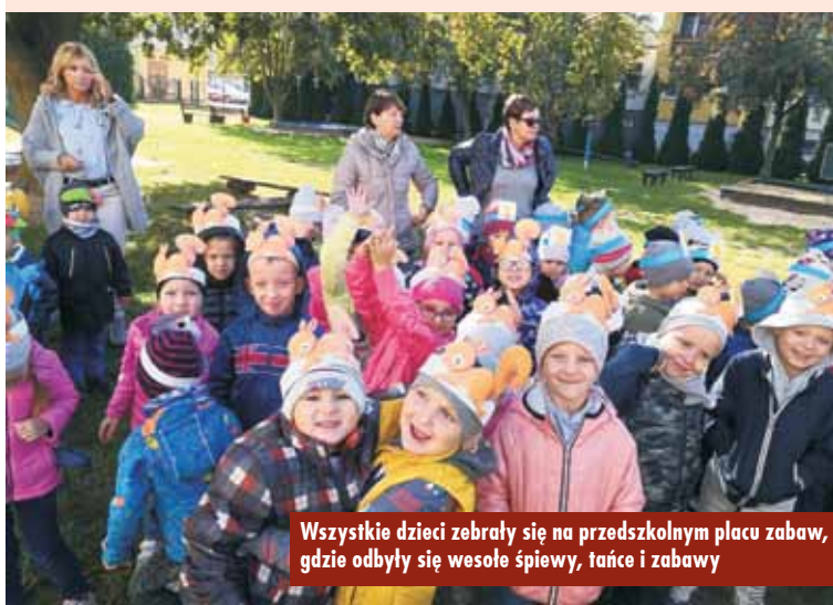
Wszystkie dzieci zebrały się na przedszkolnym placu zabaw, gdzie odbyły się wesołe śpiewy, tańce i zabawy

wszystkie dzieci zebrały się na przedszkolnym placu zabaw, gdzie odbyły się wesołe śpiewy, tańce i zabawy. Punktem obowiązkowym obchodów było wspólne odśpiewanie hymnu przedszkolaka. Dzieci dzieliły się również swoją radością ze świętowania z mieszkańcami Kępna podczas radosnego, kolorowego pochodu po mieście. W salach na maluchy czekał poczęstunek. Wszyscy bawili się znakomicie, a uśmiechy nie zniknęły z twarzy przedszkolaków. Z pewnością ten radosny dzień pozostanie na długo w pamięci każdego dziecka.