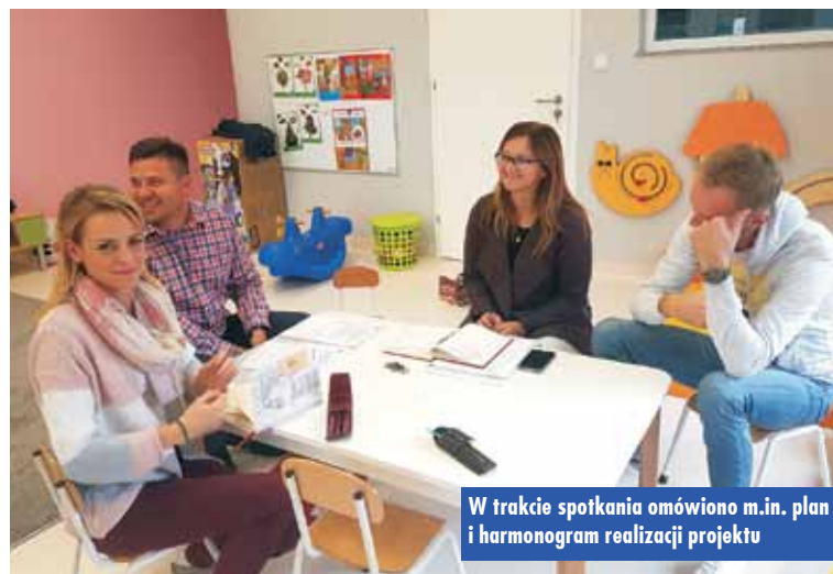
W trakcie spotkania omówiono m.in. plan i harmonogram realizacji projektu

szkolu Samorządowym w Laskach”, współfinansowanego ze środków Unii Europejskiej z Europejskiego