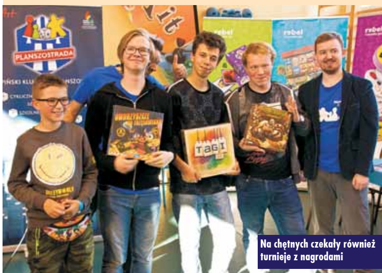
Na chętnych czekały również turnieje z nagrodami