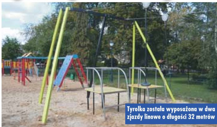
Tyrolka została wyposażona w dwa zjazdy linowe o długości 32 metrów

Uczniowie Szkoły Podstawowej nr 1 w Kępnie włączyli się w akcję Sprzątania Świata