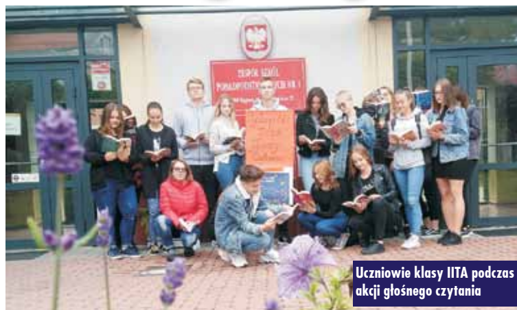
Uczniowie klasy II TA podczas akcji głośnego czytania

Święto głośnego czytania zostało ogłoszone z inicjatywy Polskiej Izby Książki, a jego celem jest promowanie zalet głośnego czytania, które rozwija wyobraźnię, język i pamięć. Uczy myślenia, poprawia koncentrację, poszerza wiedzę i ułatwia naukę. W końcu to dobry pomysł na spędzenie wolnego czasu. 29 września odnosi się do urodzin Janiny Porazińskiej, autorki książek dla dzieci i młodzieży, m.in. „Szewczyk Dratewka”, „Kozucha Kłameczucha”, „Kto mi dał skrzydła?”.