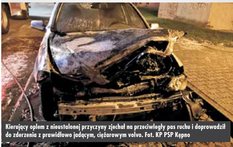
Kierujący oplem z nieustalonej przyczyny zjechał na przeciwległy pas ruchu i doprowadził do zderzenia z prawidłowo jadącym, ciężarowym volvo.

Na miejsce zdarzenia udali się także funkcjonariusze Komendy