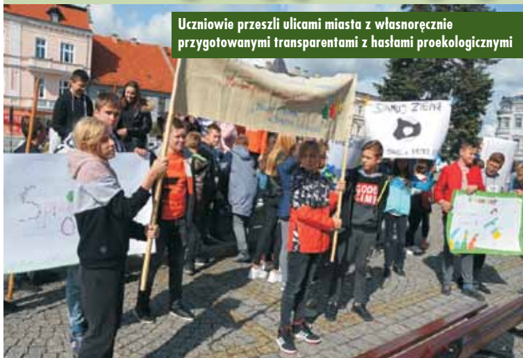
Uczniowie przeszli ulicami miasta z własnoręcznie przygotowanymi transparentami z hasłami proekologicznymi

Od 20 do 22 września br. trwała akcja Sprzątania Świata. W przedsięwzięcie aktywnie włączyli się uczniowie Szkoły Podstawowej nr 1 w Kępnie, którzy zorganizowali happening ekologiczny, nawołujący do ochrony środowiska. Część uczniów przeszła ulicami miasta z własnoręcznie przygotowanymi transparentami. Pozostała młodzież wraz z nauczycielami sprzątała teren szkoły i uczestniczyła w quizie wiedzy, a młodszy wzięli udział w poznawaniu przyrody w parku i na terenach zielonych miasta.