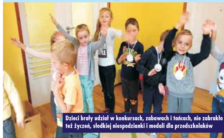
Dzieci brały udział w konkursach, zabawach i tańcach, nie zabrakło też życzeń, słodkiej niespodzianki i medali dla przedszkolaków

„Wszyscy swoje święto mają, tańczą, skaczą i śpiewają. Przedszkolaki przykład dają i też swoje święto mają.” 20 września – to dzień ważny dla wszystkich przedszkolaków w całej Polsce, bowiem właśnie wtedy obchodzimy Ogólnopolski Dzień Przedszkolaka.