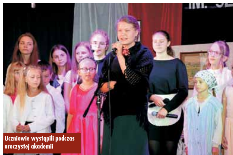
Uczniowie wystąpili podczas uroczystej akademii

uczniowie, ale też pracownicy szkoły, rodzice i mieszkańcy. Wybrano rodzinę Szembeków, której członkowie byli nie tylko lokalnymi patriotami związanymi z Siemianicami, ale też zasłużyli się dla Wielkopolski i na arenie ogólnokrajowej. Następnie