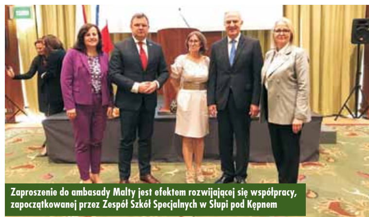
Zaproszenie do ambasady Malty jest efektem rozwijającej się współpracy, zapoczątkowanej przez Zespół Szkół Specjalnych w Słupi pod Kępem

Malta to jeden z najmniejszych krajów członkowskich Unii Europejskiej. Wyspa na Morzu Śródziemnym odzyskała niepodległość 21 września