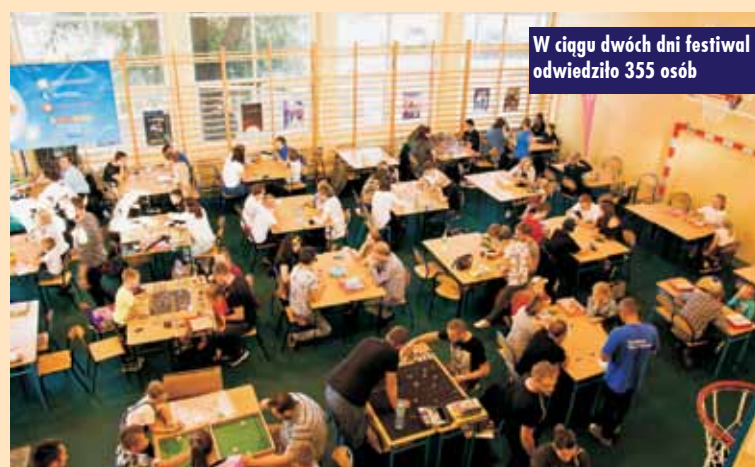
W ciągu dwóch dni festiwal odwiedziło 355 osób