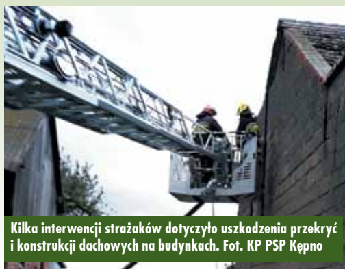
Kilka interwencji strażaków dotyczyło uszkodzenia przekryć i konstrukcji dachowych na budynkach.

Tragiczny w skutkach wypadek na drodze wojewódzkiej nr 482 („stara ósemka”) w Świbie