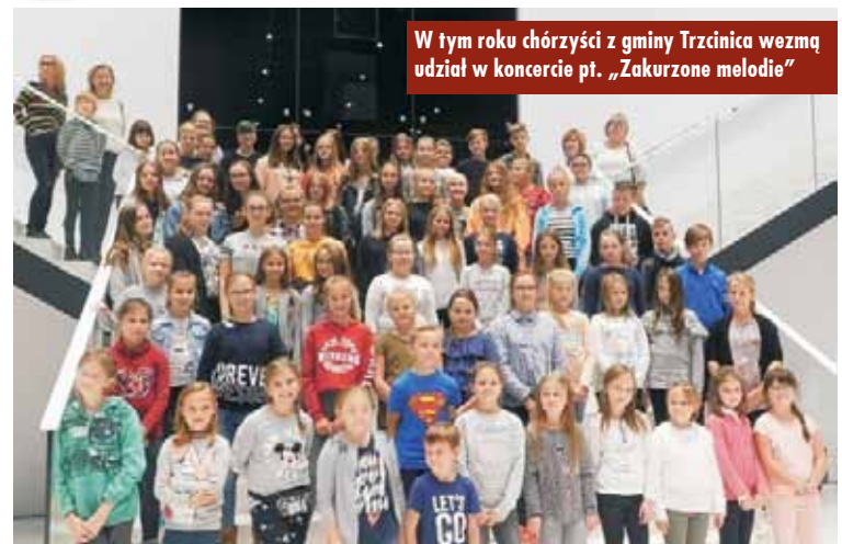
W tym roku chórzyści z gminy Trzcinnica wezmą udział w koncercie pt. „Zakurzone melodie”