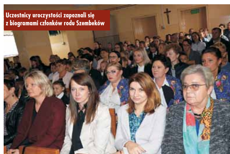
Uczestnicy uroczystości zapoznali się z biogramami członków rodu Szembeków

Dzień Przedszkolaka w Przedszkolu Samorządowym w Rychtalu