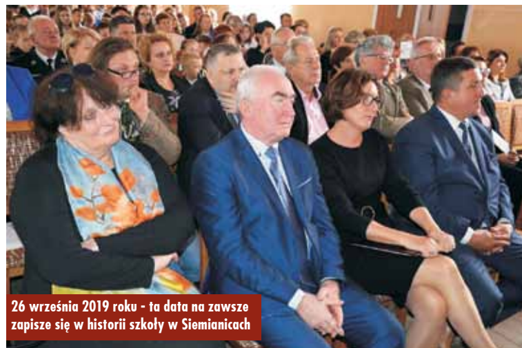
26 września 2019 roku - ta data na zawsze zapisze się w historii szkoły w Siemianicach

Przygotowania do tego szczególnego dnia, który z pewnością zapisze się w historii szkoły jako jeden z najważniejszych, trwały od ponad roku. - Zależało nam na tym, aby był to patronat osób cechujących się patriotyzmem i związanych z naszą lokalną historią - zaznacza dyrektor SP w Siemianicach. - Wytypowaliśmy kilka postaci i w przeprowadzonym głosowaniu wyboru dokonali