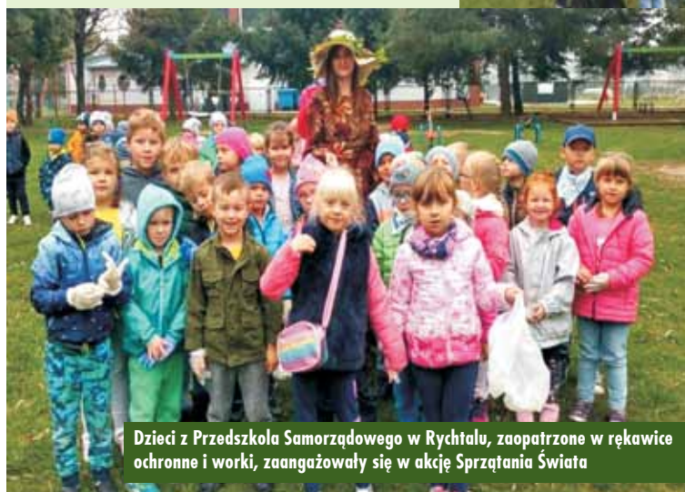
Dzieci z Przedszkola Samorządowego w Rychtalu, zaopatrzone w rękawice ochronne i worki, zaangażowały się w akcję Sprzątania Świata

Podczas akcji sprzątania świata do przedszkolaków przyszedł niezwykle gość – Pani Jesień, która poinformowała dzieci, że teraz ona będzie obecna w przyrodzie: w ogrodach, lasach, na polach, drzewach i kwiatkach. Podziękowała dzieciom, że tak pięknie posprzątały teren wokół przedszkola, dzięki czemu przyroda będzie jeszcze piękniejsza. Na zakończenie spotkania Pani Jesień obdarowała dzieci cukierkami. Oprac. KR