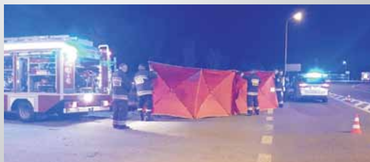
Motocykl wypadł z łuku drogi i uderzył w przepust w przydrożnym rowie. Pomimo prowadzonej akcji ratunkowej, lekarz stwierdził zgon poszkodowanego.

Z związku ze sprzyjającą aurą na koniec sezonu dla podróżujących jednośladami, policjanci apelują o zachowanie ostrożności, stosowanie się do ograniczeń prędkości i przestrzeganie zasad ruchu drogowego. Pamiętajmy, że bezpieczeństwo na drodze w dużej mierze zależy od nas samych. KR