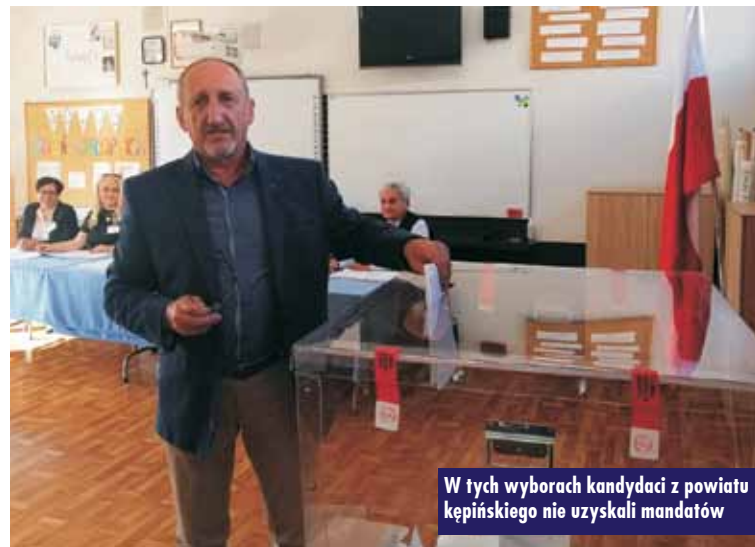
W tych wyborach kandydaci z powiatu kępińskiego nie uzyskali mandatów

1 października br., po godzinie 15.00, na drodze krajowej nr 11 w Słupi pod Kępem doszło do kolizji dwóch pojazdów osobowych. Jak się okazało, kierujący samochodem marki Audi A4, mieszkaniec powiatu kluczborskiego, nie zachował