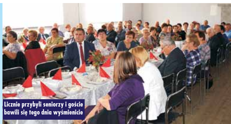
Licznie przybyli seniorzy i goście bawili się tego dnia wymiennie

Wszyscy byli pełni uznania dla organizatorów Dnia Seniora, który przebiegał we wspaniałej atmosferze z licznym udziałem ludzi złotego wieku.