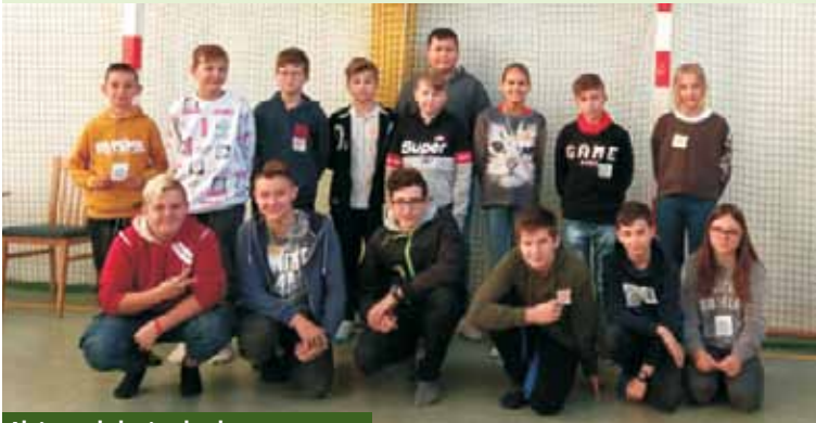
Akcja spotkała się z bardzo pozytywnym odzewem wśród uczniów

zachęcenie zarówno uczniów, jak i dorosłych, do przypomnienia sobie tabliczki mnożenia.