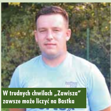
W trudnych chwilach „Zawisza” zawsze może liczyć na Bastka

Cóż pisać o meczu, w którym niewiele się działo. Gospodarze nastavili się bowiem raczej na przeszkadzanie liderowi w grze, natomiast goście włączyli tryb oszczędnościowy. Warto podkreślić, że „Zawisza” wystąpił