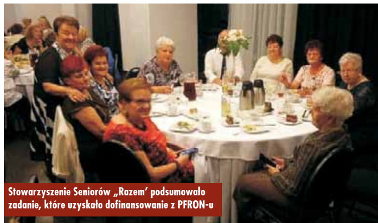
Stowarzyszenie Seniorów „Razem” podsumowało zadanie, które uzyskało dofinansowanie z PFRON-u

temat udzielania pierwszej pomocy w nagłych wypadkach. Oprac. bem