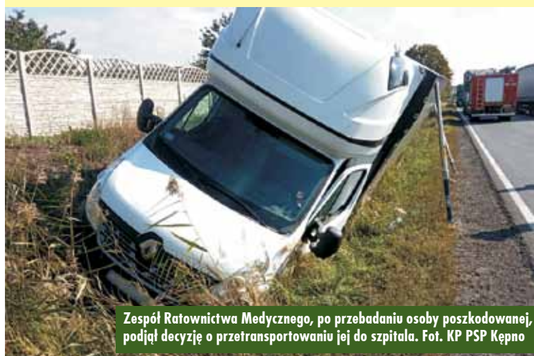
Zespół Ratownictwa Medycznego, po przebadaniu osoby poszkodowanej, podjął decyzję o przetransportowaniu jej do szpitala.

Kępińscy policjanci przypominali dzieciom podstawowe zasady i przepisy ruchu drogowego