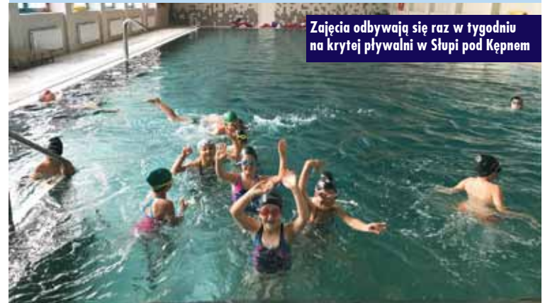
Zajęcia odbywają się raz w tygodniu na krytej pływalni w Słupi pod Kępem

Uczniowie przed rozpoczęciem nauki pływania tradycyjnie otrzymali czepki pływackie. Zajęcia odbywają się raz w tygodniu na krytej pływalni w Słupi pod Kępem. Zaplanowano 10 skumulowanych (2-godzinnych) zajęć dla wszystkich