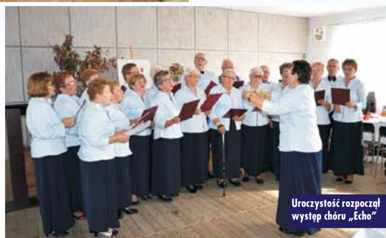
Uroczystość rozpoczął występ chóru „Echo”