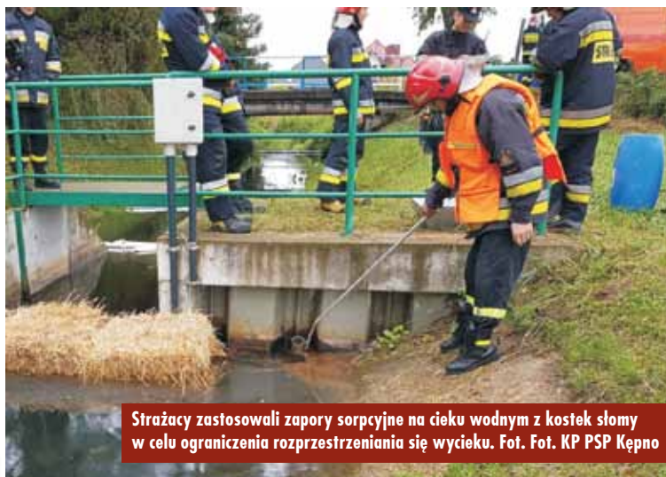
Strażacy zastosowali zapory sorpcyjne na ciekłu wodnym z kostek słomy w celu ograniczenia rozprzestrzeniania się wycieku.

cyjnej na ciekłu wodnym z kostek słomy) oraz ustalenie źródła wycieku. Po przybyciu na miejsce Specjalistycznej Grupy Ratownictwa Chemiczno-Ekologicznego zbudowano kolejne zapory sorpcyjne w celu niedopuszczenia, aby wyciek dotarł do większych cieków wodnych. Po