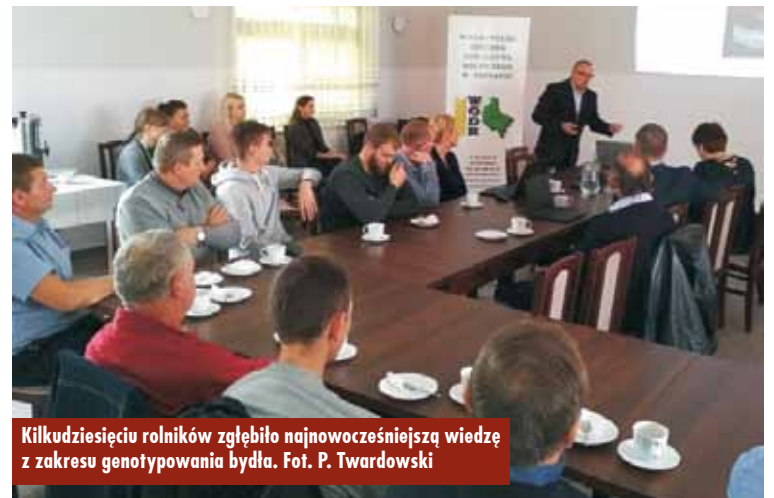
Kilkudziesięciu rolników zgłębiło najnowocześniejszą wiedzę z zakresu genotypowania bydła.

9 października br. w sali Domu Ludowego w Nosalach odbyła się specjalistyczna konferencja z udziałem wysokiej klasy specjalistów i zootechników z Polskiej Federacji Hodowców Bydła i Producentów Mleka, Wielkopolskiego Centrum Hodowli i Rozrodu Zwierząt i doradców Wielkopolskiego Ośrodka Doradztwa Rolniczego w powiecie kępińskim. Kilkudziesięciu rolników – hodowców bydła i producentów mleka – zgłębiło najnowocześniejszą wiedzę z zakresu genotypowania bydła. Wśród szeroko omawianych