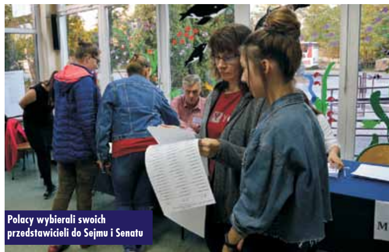
Polacy wybierali swoich przedstawicieli do Sejmu i Senatu