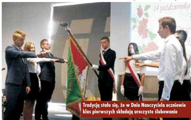
Tradycją stało się, że w Dniu Nauczyciela uczniowie klas pierwszych składają uroczyste ślubowanie

Tradycją stało się, że w tym dniu uczniowie klas pierwszych składają uroczyste ślubowanie. Młodzież przyrzekała sumiennie spełniać zadania ucznia, zdobywać wiedzę, doskonalić osobowość, być odpowiedzialną