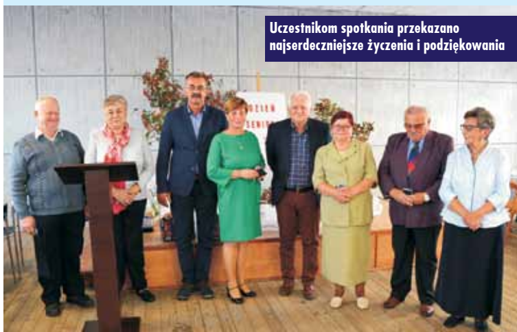
Uczestnikom spotkania przekazano najserdeczniejsze życzenia i podziękowania