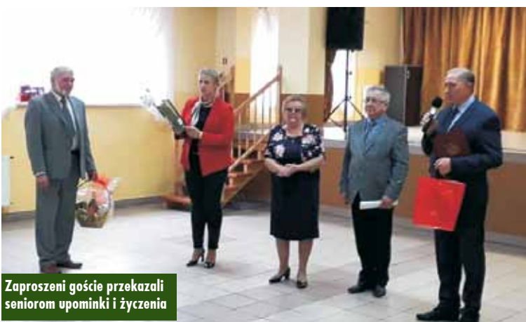
Zaproszeni goście przekazali seniorom upominki i życzenia

Gmina Trzcinica stara się o dofinansowanie projektu pn. „Wieczór integracyjny przy muzyce i śpiewie w Trzciny – jesień 2020”