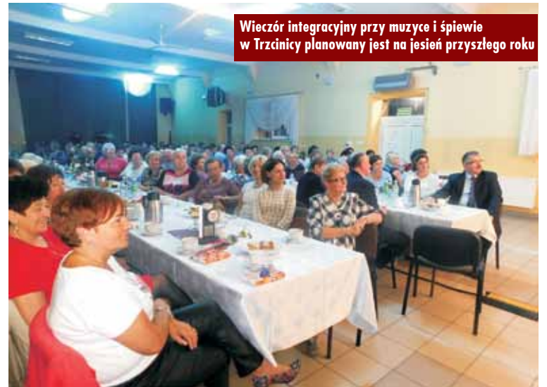
Wieczór integracyjny przy muzyce i śpiewie w Trzciny planowany jest na jesień przyszłego roku

społeczności z terenu całej gminy, w tym osób zrzeszonych i działających w organizacjach społecznych. Ma się ona odbyć w Domu Ludowym w Trzciny. Na potrzeby zadania zamówione zostaną sceniczne występy artystyczne, obsługa techniczna i na-