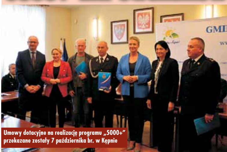
Umowy dotacyjne na realizację programu „5000+” przekazane zostały 7 października br. w Kępnie

W gminie Perzów dotacje w wysokości 5.000,00 zł otrzymały Ochotnicze Straże Pożarne: Perzów, Domasłów, Trębaczów, Miechów i Turkowy.