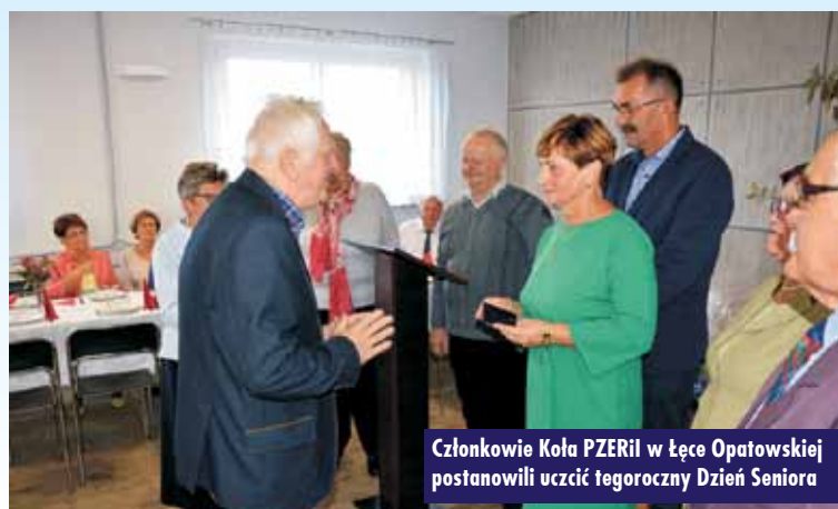
Członkowie Koła PZERI w Łęce Opatowskiej postanowili uczcić tegoroczny Dzień Seniora

Dobiegły końca kolejne dwie inwestycje drogowe realizowane na terenie gminy Łęka Opatowska