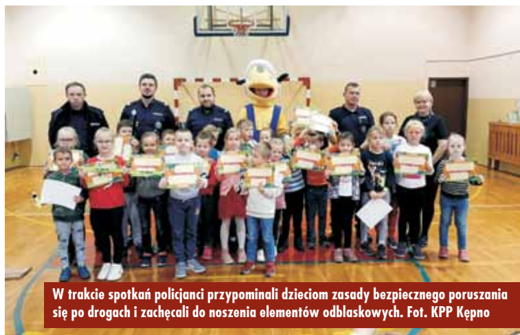
W trakcie spotkań policjanci przypominali dzieciom zasady bezpiecznego poruszania się po drogach i zachęcali do noszenia elementów odblaskowych.