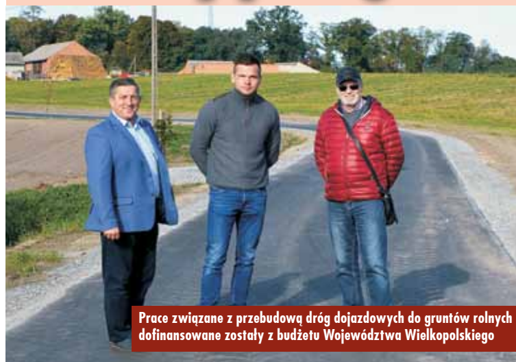
Prace związane z przebudową dróg dojazdowych do gruntów rolnych dofinansowane zostały z budżetu Województwa Wielkopolskiego

Sfinalizowane zostały: przebudowa drogi dojazdowej do gruntów rolnych, ul. Parkowej w Opatowie oraz przebudowa drogi dojazdowej do gruntów rolnych w Rakowie.