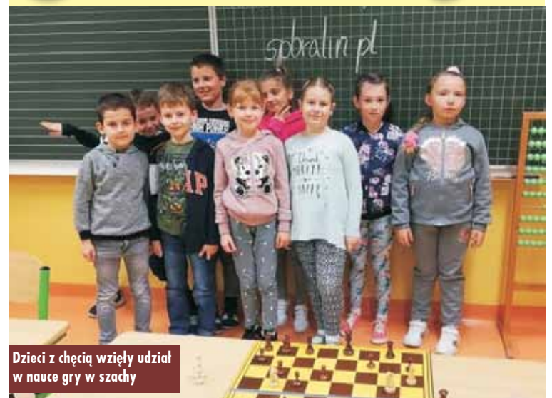
Dzieci z chęcią wzięły udział w nauce gry w szachy

W bieżącym roku szkolnym, tj. 2019/2020, w Szkole Podstawowej im. Mikołaja Kopernika w Bralinie udało się zorganizować wiele kół zainteresowań, zwłaszcza wśród najmłodszej części społeczności bralińskiej podstawówki. Klasom trzecim proponowano m.in. zajęcia nauki gry w szachy. Zainteresowanie wśród dzieci było ogromne, mimo bardzo wczesnej pory szkolenia.