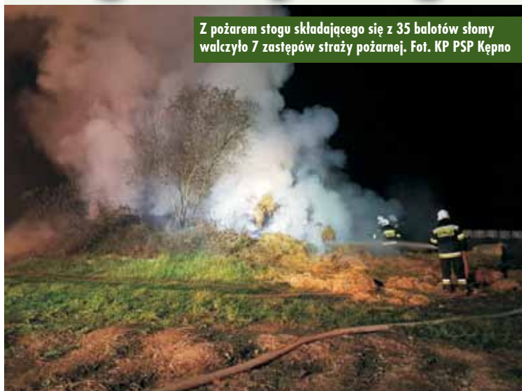
Z pożarem stogu składającego się z 35 balotów słomy walczyło 7 zastępów straży pożarnej.

22 października br., o godzinie 19.20, dyżurny Stanowiska Kierowania Komendanta Powiatowego Państwowej Straży Pożarnej w Kępnie odebrał zgłoszenie o pożarze balotów słomy w miejscowości Trzcinica. W chwili przybycia na miejsce zdarzenia pierwszych zastępów straży pożarnej, ogniem objęty był cały stóg składający się z 35