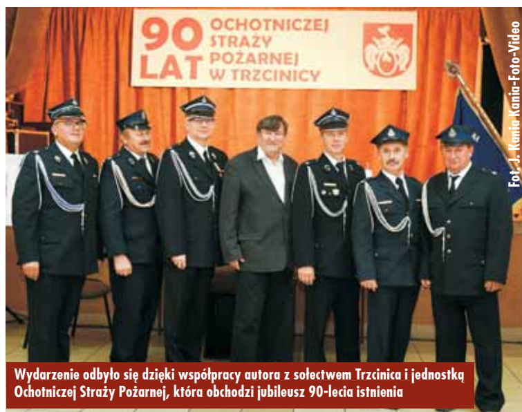
Wydarzenie odbyło się dzięki współpracy autora z sołectwem Trzcinica i jednostką Ochotniczej Straży Pożarnej, która obchodzi jubileusz 90-lecia istnienia

rzeczy niemożliwej: wydrukowali książkę - 120 stron wierszy, wystawili 19 obrazów i zgromadzili na uroczystości blisko stu mieszkańców Trzcinicy – podkreśla autor publikacji. - Książka poetycka „Trzcinica, strażacy - wiersze o ludziach, o ogniu, o świetle” okazała się sukcesem, podobnie jak kalendarz. Niech