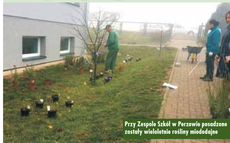
Przy Zespole Szkół w Perzowie posadzone zostały wieloletnie rośliny miododajne

Gmina Perzów otrzymała dofinansowanie z WFOŚiGW w Poznaniu na utworzenie ścieżki edukacyjno-przyrodniczej przy Zespole Szkół w Perzowie. Projektowana ścieżka nazwana została „My się pszczoł nie boimy i rośliny dla nich sadzimy”.