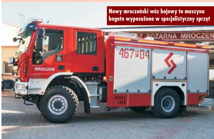
Nowy mroczeński wóz bojowy to maszyna bogato wyposażona w specjalistyczny sprzęt

reflektorami dalekosiężnymi, sygnalizację pojazdu uprzywilejowanego LED, dźwiękowy system ostrzegawczo-alarmowy, autopompę dwuza-