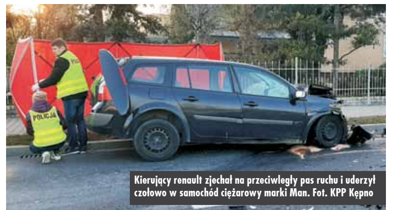
Kierujący renault zjechał na przeciwny pas ruchu i uderzył czołowo w samochód ciężarowy marki Man.

informował asp. Jakub Sobczak z Komendy Powiatowej Państwowej Straży Pożarnej w Kępnie.