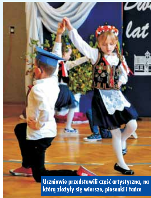
Uczniowie przedstawili część artystyczną, na którą złożyły się wiersze, piosenki i tańce