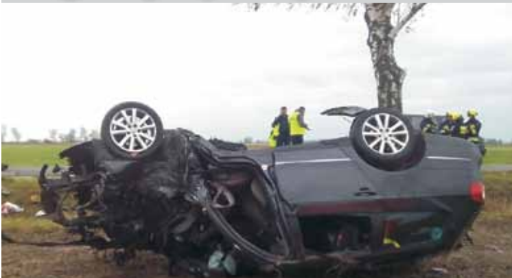
Z niewiadomych przyczyn volkswagen passat zjechał z drogi i z impetem uderzył w przydrożne drzewo.

3 listopada br., tuż po godzinie 8.00, dyżurny Komendy Powiatowej Policji w Kępnie otrzymał zgłoszenie o wypadku drogowym w miejscowości Lipie (gmina Łęka Opatowska). - Na drodze powiatowej między Rakowem a Łęką Opatowską, z niewiadomych na tę chwilę przyczyn, volkswagen passat, którym podróżowało trzech mężczyzn, zjechał z drogi i z impetem uderzył w przydrożne drzewo – mówi oficer prasowy KPP Kępno st. post. Rafał Stramowski. Wskazówka na prędkościomierzu zatrzymała się na wartości 140 km/h. Mężczyźni po uderzeniu w drzewo wypadli z pojazdu. W wyniku zdarzenia śmierć ponieśli dwaj mieszkańcy gminy Łęka Opatowska: 31- i 39-latek. Trzeci mężczyzna uczestniczący w wypadku – 21-letni obywatel Ukrainy – z ogólnymi obrażeniami ciała został przetransportowany śmigłowcem Lotniczego Pogotowia Ratunkowego do kępińskiego szpitala.