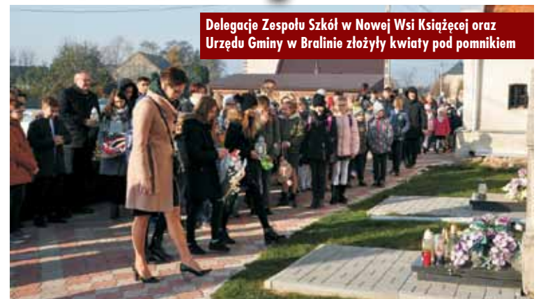
Delegacje Zespołu Szkół w Nowej Wsi Książęcej oraz Urzędu Gminy w Bralinie złożyły kwiaty pod pomnikiem