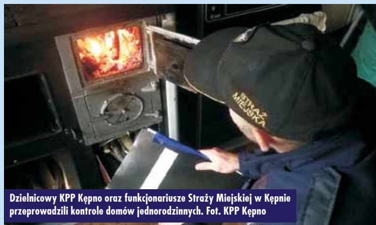
Dzielnicowy KPP Kępno oraz funkcjonariusze Straży Miejskiej w Kępnie przeprowadzili kontrole domów jednorodzinnych.

Komenda Powiatowa Policji w Kępnie prowadzi działania pod kątem ustalenia i zatrzymania osoby odpowiedzialnej za dokonanie rozboju