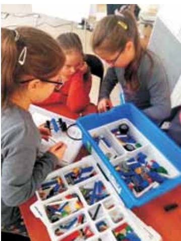
Uczniowie mieli możliwość udziału w zajęciach robotyki

W piątek, 4 października br., uczniowie z klas III, V a i V b Zespołu Szkół im. Ks. Michała Przywary i Rodziny Salomonów w Nowej Wsi Książęcej uczestniczyli w wycieczce do Laboratorium Szkoły Przyszłości w ramach realizacji projektu „Koder Junior”.