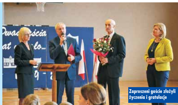
Zaproszeni goście złożyli życzenia i gratulacje

Uroczyste otwarcie szkoły miało miejsce 20 września 1999 roku. Cere-