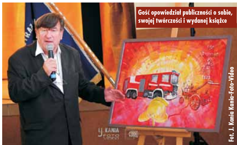
Gość opowiedział publiczności o sobie, swojej twórczości i wydanej książce