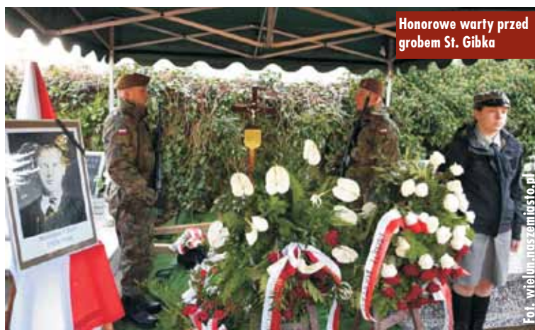
Honorowe warty przed grobem St. Gibka

Dom Pomocy Społecznej w Rzetni wzbogaci się o 27 nowych łóżek szpitalnych