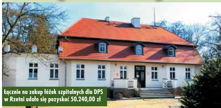
Łącznie na zakup łóżek szpitalnych dla DPS w Rzetni udało się pozyskać 50.240,00 zł

Zakup łóżek szpitalnych dla DPS możliwy będzie dzięki pozyskanej przez Powiat Kępiński dotacji ze środków dotacji celowej budżetu państwa. Stosowną umowę w tej kwestii podpisali w poniedziałek, 28 października br., starosta kępiński Robert Kieruzal i wicestarosta - Alicja Śniegocka .