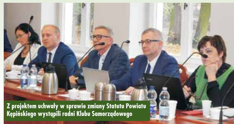
Z projektem uchwały w sprawie zmiany Statutu Powiatu Kępińskiego wystąpili radni Klubu Samorządowego

bądź części interpelacji lub zapytań w momencie, kiedy są one tu składane na sesji – mówił radny. - (...) Te interpelacje i zapytania też są na BIP-ie (w internetowym Biuletynie Informacji Publicznej Powiatu Kępińskiego – przyp. red.) i, jak słusznie zauważyła pani przewodnicząca, nie mamy niczego do ukrycia. W związku z tym mówimy to tutaj. (...) To jest sytuacja oczywista, niczego to nie zmienia, a jednak daje naszym mieszkańcom, którzy dzisiaj mogą nas oglądać poprzez bezpośrednią transmisję, taką możliwość usłyszenia tego podczas sesji i nie muszą sięgać dodatkowo po komputer, po internet. Nie muszą szukać tego w BIP-ie.