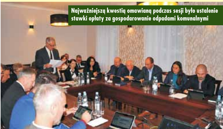
Najważniejszą kwestią omawianą podczas sesji było ustalenie stawki opłaty za gospodarowanie odpadami komunalnymi

Choć jest to decyzja niepopularna, podwyżek nie da się uniknąć. Prawdopodobnie wszystkie pozostałe gminy będą zmuszone po raz kolejny podnosić opłaty za odbiór odpadów. Pojawiła się propozycja, aby ujednolicić stawki we wszystkich gminach do poziomu 25 zł za osobę miesięcznie. Aby uszczelnić system i zapobiec podwyżkom w przyszłości, przeprowadzane będą kontrole posesji, aby wykryć, które osoby unikają opłat za śmieci. KR