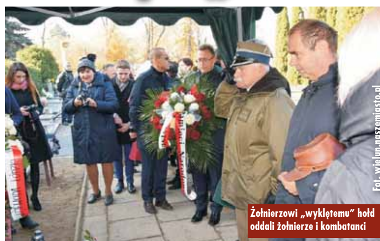
Żołnierzowi „wykłętemu” hold oddali żołnierze i kombatanaci

Po mszy kondukt udał się na miejsce pochówku. Do uczestników okolicznościowe listy wystosowali