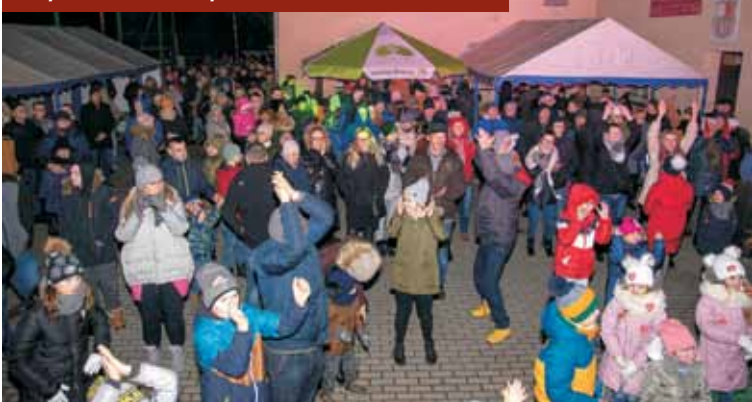
Ciekawe atrakcje przygotowane na niedzielę przyciągnęły tłumy osób, które okazały wielkie serca.