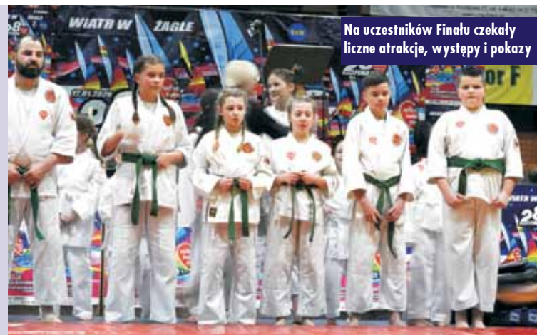
Na uczestników Finału czekały liczne atrakcje, występy i pokazy

Podczas niedzielnego grania udało się zebrać rekordową kwotę