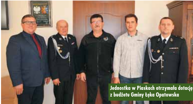
Jednostka w Piaskach otrzymała dotację z budżetu Gminy Łęka Opatowska