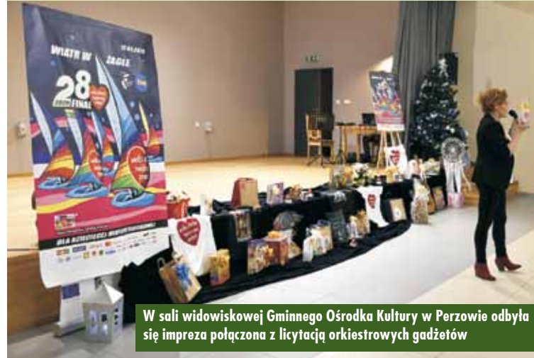
W sali widowiskowej Gminnego Ośrodka Kultury w Perzowie odbyła się impreza połączona z licytacją orkiestrowych gadżetów