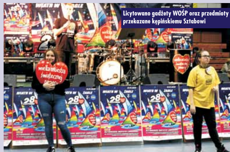
Licytowano gadzety WOŚP oraz przedmioty przekazane kępińskiemu Sztabowi