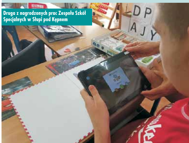
Dругą z nagrodzonych prac Zespołu Szkół Specjalnych w Słupi pod Kępem