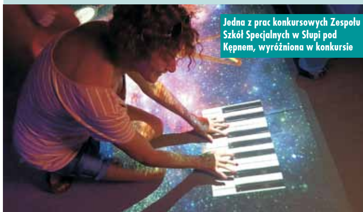
Jedną z prac konkursowych Zespołu Szkół Specjalnych w Słupi pod Kępem, wyróżnioną w konkursie

oraz międzynarodowa wymiana doświadczeń szansą na sukces uczniów z niepełnosprawnościami” oraz z projektu: „Rozwój kompetencji kadry Zespołu Szkół Specjalnych w Słupi pod Kępem w celu zwiększania szans na samodzielne funkcjonowanie uczniów z niepełnosprawnością intelektualną i przeciwdziałania wykluczeniu społecznemu tej grupy osób”.