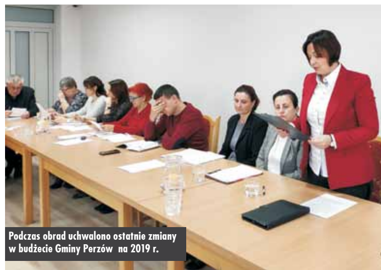
Podczas obrad uchwalono ostatnie zmiany w budżecie Gminy Perzów na 2019 r.

Gmina Perzów po raz kolejny włączyła się w organizację Finału Wielkiej Orkiestry Świątecznej Pomocy. W tym roku udało się zebrać blisko 13 tys. zł