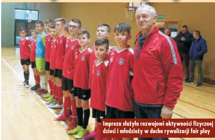
Impreza służyła rozwojowi aktywności fizycznej dzieci i młodzieży w duchu rywalizacji fair play

W poświęconą sobotę, 28 grudnia 2019 r., w Łęce Opatowskiej dwa zaprzyjaźnione kluby młodzieżowe rozegrały Halowy Turniej Piłki Nożnej o Puchar Przewodniczącego Rady Gminy. Zarówno LKS Wielkopola-nin Siemianice jak i GKS Trzcini-ca wystawiły po dwie drużyny w roczniku 2005 i młodszy.