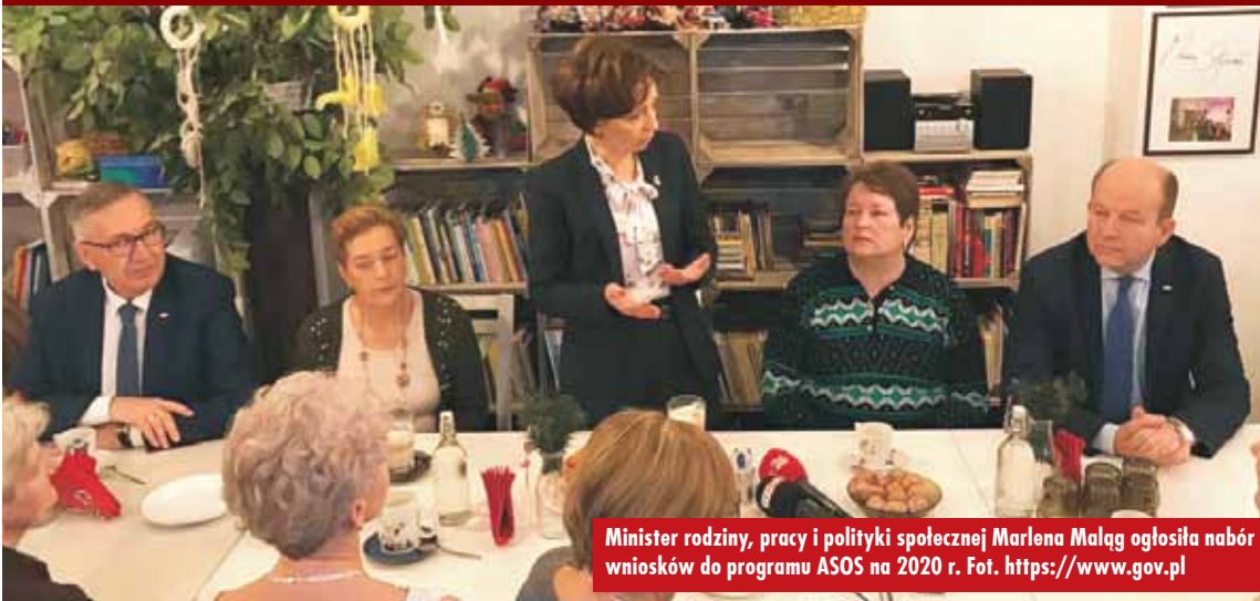
Minister rodziny, pracy i polityki społecznej Marlena Maląg ogłosiła nabór wniosków do programu ASOS na 2020 r.

Wspieranie aktywności seniorów, edukacja, integracja wewnątrz - i międzypokoleniowa, usługi społeczne dla osób starszych – to główne cele Rządowego Programu na rzecz Aktywności Społecznej Osób Starszych na lata 2014-2020. Minister rodziny, pracy i polityki społecznej Marlena Maląg ogłosiła konkurs ofert do programu ASOS w edycji na 2020 r. Termin składania ofert upływa 31 stycznia br., o godzinie 16.00.