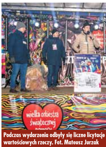
Podczas wydarzenia odbyły się liczne licytacje wartościowych rzeczy.

W sołectwie Olszowa po raz czwarty utworzono sztab Wielkiej Orkiestry Świątecznej Pomocy. W sobotę, 11 stycznia br., 50 osób zgłosiło się, aby honorowo oddać krew. Udało się zebrać ponad 22 litry krwi.