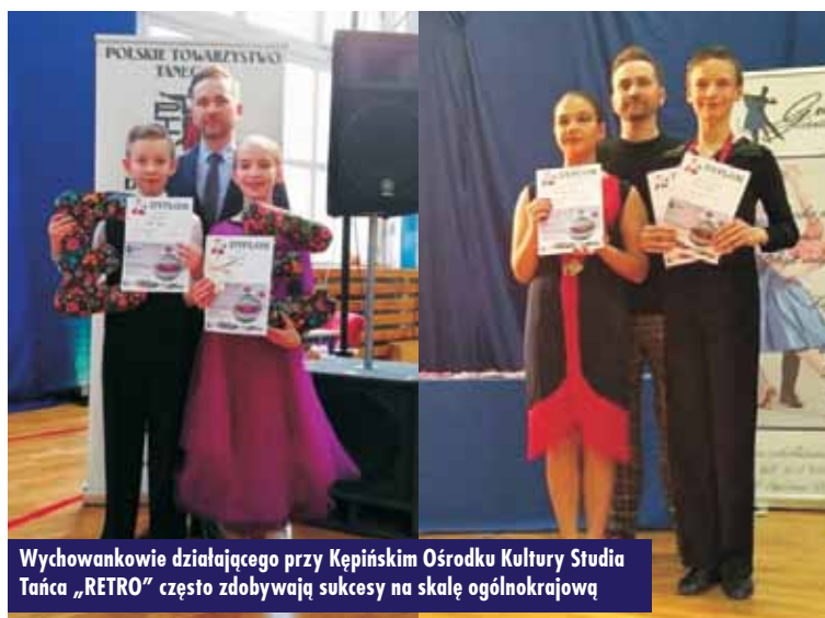
Wychowankowie działającego przy Kępińskim Ośrodku Kultury Studia Tańca „RETRO” często zdobywają sukcesy na skalę ogólnokrajową