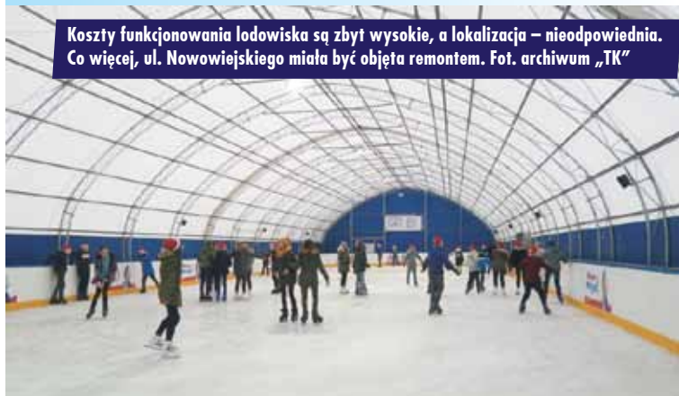
Koszty funkcjonowania lodowiska są zbyt wysokie, a lokalizacja – nieodpowiednia. Co więcej, ul. Nowowiejskiego miała być objęta remontem.

Czy Gmina Kępno i Spółka „Projekt Kępno” zamierzają zrekompenzować mieszkańcom brak lodowiska i zapewnić inne zimowe atrakcje? - W okresie ferii zimowych (przełom stycznia i lutego 2019 r.) Spółka „Projekt Kępno”, dysponując nie tylko zapleczem, ale kadrą z uprawnieniami, będzie organizatorem półkolonii zimowych dla dzieci szkolnych z terenu gminy Kępno na innych obiektach sportowo-rekreacyjnych, tj. hali widowiskowo-sportowej, krytej pływalni „Qarium Kępno” oraz – jeśli dopisze śnieg – także na terenach przyległych do tych obiektów – mówi wójt miasta i gminy.