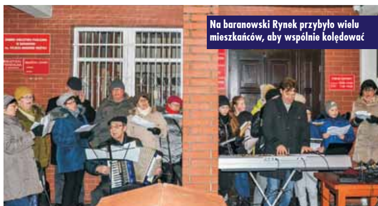
Na baranowski Rynek przybyło wielu mieszkańców, aby wspólnie kołęduć

nic ma również jesienno-zimową pluchę. I tak rok w rok, na baranowski Rynek licznie przybywają zacni