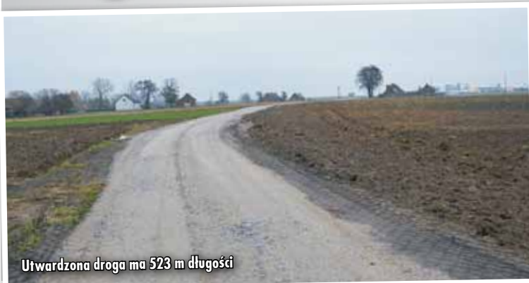
Utwardzona droga ma 523 m długości

Inwestycję wykonała firma „KRYSMAR-TRANS” z Bolesławca za kwotę 90.159,00 złotych brutto. Utwardzona droga ma 523 m długości i 3,00-3,50 m szerokości oraz pobocza o szerokości 2 x 0,5 m.