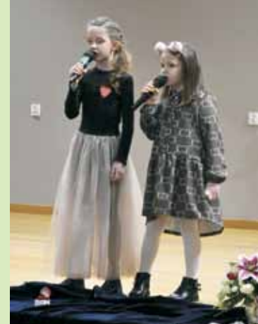
Na scenie wystąpili m.in. młodzi muzycy z sekcji gitarowej i wokalne działającej przy GOK

W sumie na terenie gminy udało się w tym roku zebrać 12.636,32 zł. Wolontariusze zebrali 8.781,32 zł, a zysk z licytacji wyniósł 3.855,00 zł. Licytowano m.in. tort, kalendarz z autografem Jerzego Owsiaka , oko-