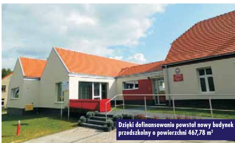
Dzięki dofinansowaniu powstał nowy budynek przedszkolny o powierzchni 467,78 m 2

to jadalnia wraz z holem i systemem drzwi rozsuwanych, umożliwiających stworzenie dużej powierzchni na spotkania integracyjne. W części przebudowanej umieszczono pokoje logopedy, pielęgniarki oraz personelu. W obiekcie jest wiele pomieszczeń technicznych oraz pomocniczych. Strych zaadaptowano na pomieszczenie centrali systemu odzysku ciepła, a obiekt zasilany jest w ciepło i wodę