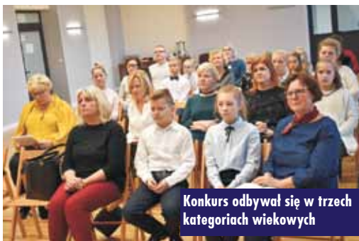
Konkurs odbywał się w trzech kategoriach wiekowych