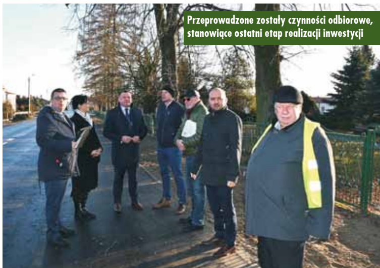
Przeprowadzone zostały czynności odbiorowe, stanowiące ostatni etap realizacji inwestycji

Lodowisko przy ul. Nowowiejskiego w Kępnie w tym roku nie będzie funkcjonować