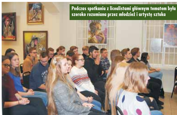
Podczas spotkania z licealistami głównym tematem była szeroko rozumiana przez młodzież i artystę sztuka

Podczas spotkania z licealistami głównym tematem była szeroko rozumiana przez młodzież i artystę sztuka. Rozmówcy skupili się na sztuce komercyjnej, wychodzącej z ram i kanonów, na sztuce do kupienia i sprzedania, a nie tylko do pokaza-