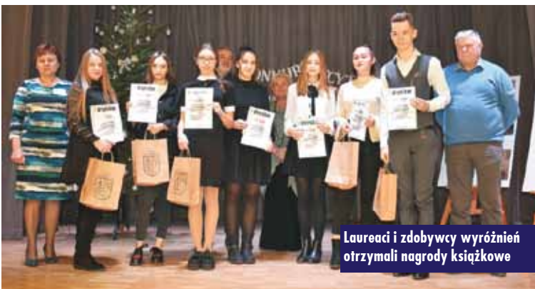
Laureaci i zdobywcy wyróżnień otrzymali nagrody książkowe

Organizatorem grudniowego konkursu był Urząd Gminy Łęka Opatowska, w którego sali widowiskowej odbyły się trzydniowe prezentacje recytatorskie dzieci i młodzieży.