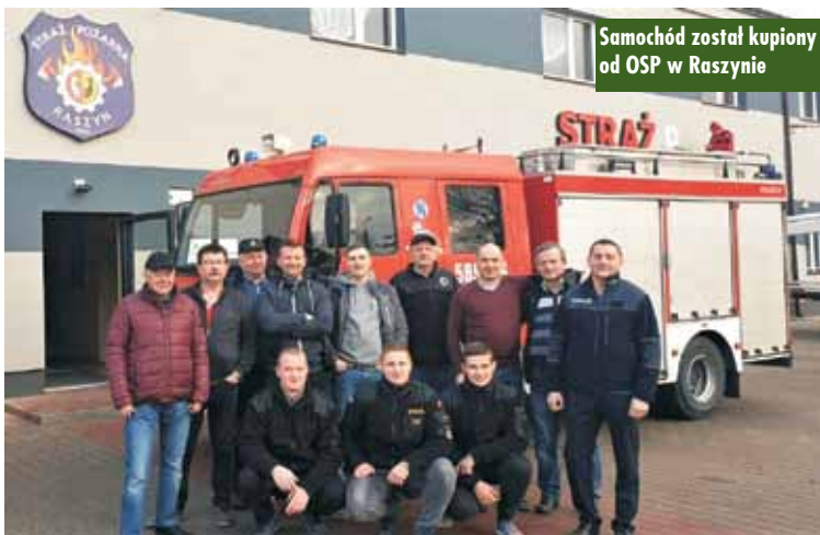
Samochód został kupiony od OSP w Raszynie

W przeprowadzonym przetargu nieograniczonym najkorzystniejszą ofertę przedstawiła Ochotnicza Straż Pożarna w Raszynie, która zaoferowała sprzedaż samochodu GBA-Rt 2,5/16 Star L 70 4173 LE 12.180 z 2004 roku za kwotę 202.950,00 zł.