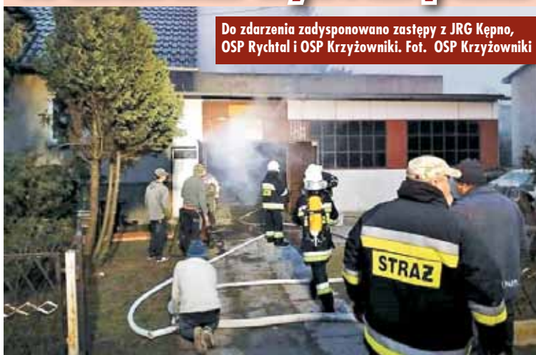
Do zdarzenia zadysponowano zastępy z JRG Kępno, OSP Rychtal i OSP Krzyżowniki.

14 stycznia br., tuż przed godziną 16.00, do Stanowiska Kierowania Komendanta Powiatowego Państwowej Straży Pożarnej w Kępnie wpłynęło zgłoszenie o pożarze warsztatu ślusarskiego przy ul. Lipowej w Rychtalu. Do zdarzenia zadysponowano zastępy z Jednostki Ratowniczo-Gaśniczej w Kępnie oraz OSP Rychtal i OSP Krzyżowniki. - Po przybyciu na miejsce pierwszych jednostek ochrony przeciwpożarowej stwierdzono pożar pomieszczenia kotłowni w nieczynnym zakładzie ślusarskim.