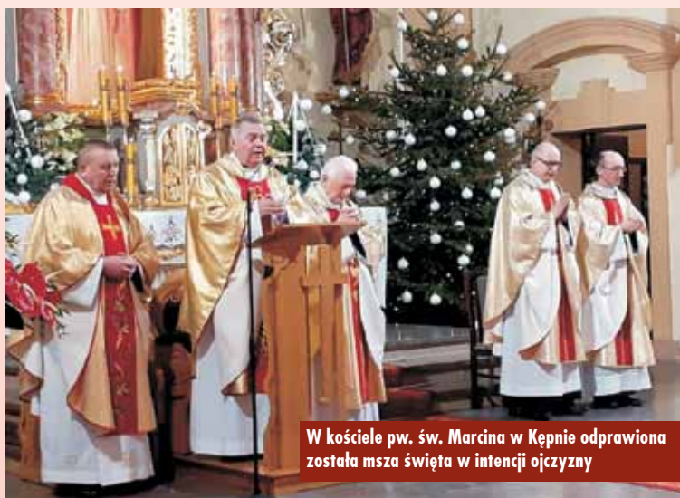
W kościele pw. św. Marcina w Kępnie odprawiona została msza święta w intencji ojczyzny

ców w tym okresie było wyjątkowe. (...) Byli to zwyczajni mieszkańcy, którzy zdobyli się na nieprzeciętne postawy. Dbali o mowę ojczystą i wskrzeszali ducha patriotyzmu (...). Niemcy zdierali odznaki narodowe, ograniczali działalność sklepów, przeprowadzali rewizje, konfiskaty i aresztowania członków rodzin, z