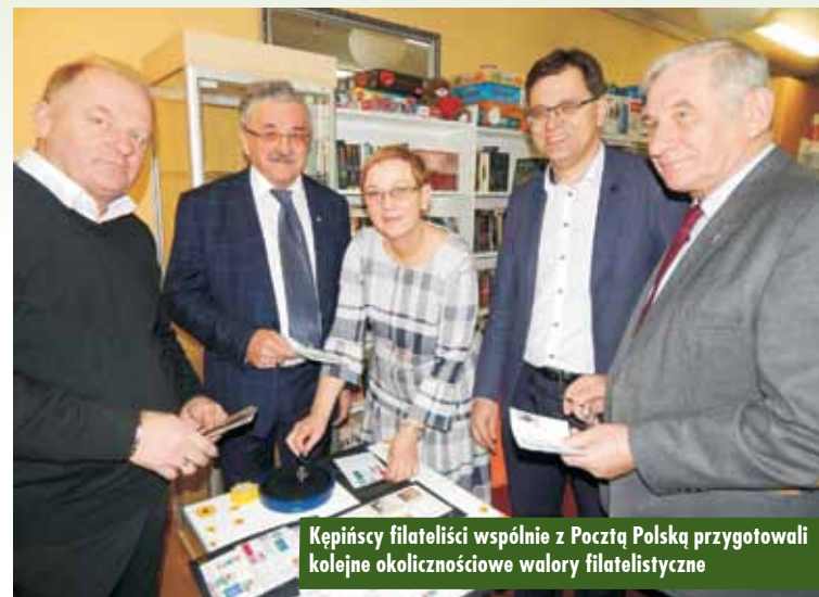
Kępińscy filatelisci wspólnie z Poczta Polską przygotowali kolejne okolicznościowe walory filatelistyczne