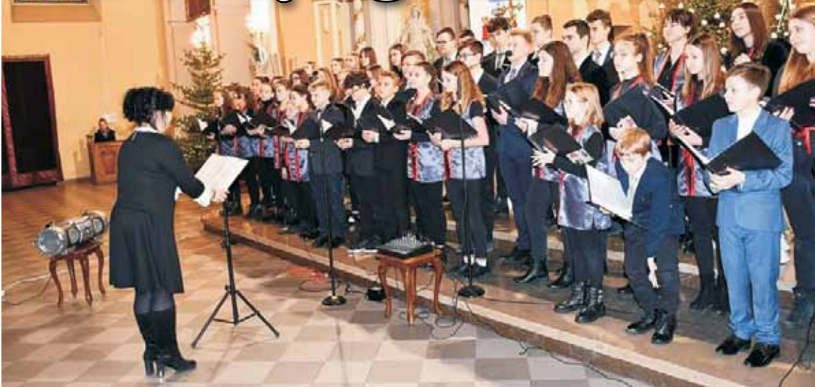
Mieszkańcy powiatu kępińskiego zapelnili kościelne ławki podczas powiatowego kolędowania