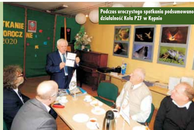
Podczas uroczystego spotkania podsumowano działalność Koła PZF w Kępnie