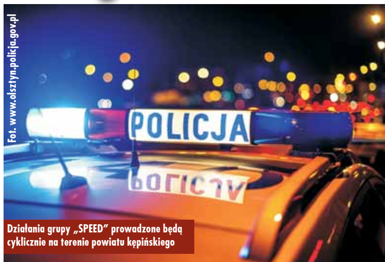
Działania grupy „SPEED” prowadzone będą cyklicznie na terenie powiatu kępińskiego

41 skontrolowanych pojazdów, 36 nałożonych mandatów karnych na kierowców, którzy nie stosowali się do ograniczeń prędkości, 10 mandatów za inne wykroczenia w ruchu drogowym, zatrzymane 2 dowody rejestracyjne – to wynik ostatnich działań grupy „SPEED” na drogach powiatu kępińskiego, która miała miejsce 17 stycznia br. W trakcie działań mundurowi zatrzymali też dwóch kierujących prawo jazdy za przekroczenie prędkości o ponad 50 km/h w terenie zabudowanym. W piątkowej akcji wymierzonej w piratów drogowych udział wzięli funkcjonariusze Komendy Powiatowej Policji w Kępnie oraz policjanci z Ostrzeszowa i Ostrowa Wielkopolskiego. Podczas działań wykorzystany był nieoznakowany radiowóz z wideorejestratorem.