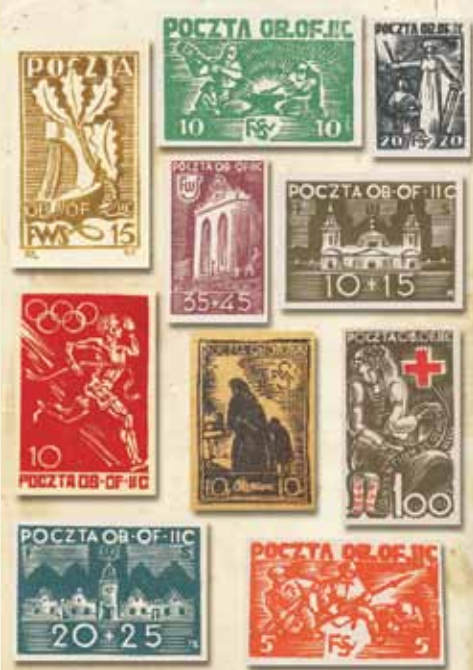
Wybrane znaczki woldenberskie

Wytwory pocztowe woldenskiej zostały docenione przez powojennych filatelistów i kolekcjonerów. Są prezentowane na wystawach, wystawiane na aukcjach, gdzie cieszą się