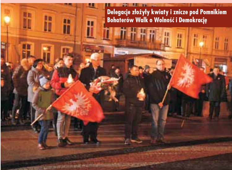
Delegacje złożyły kwiaty i znicze pod Pomnikiem Bohaterów Walk o Wolność i Demokrację