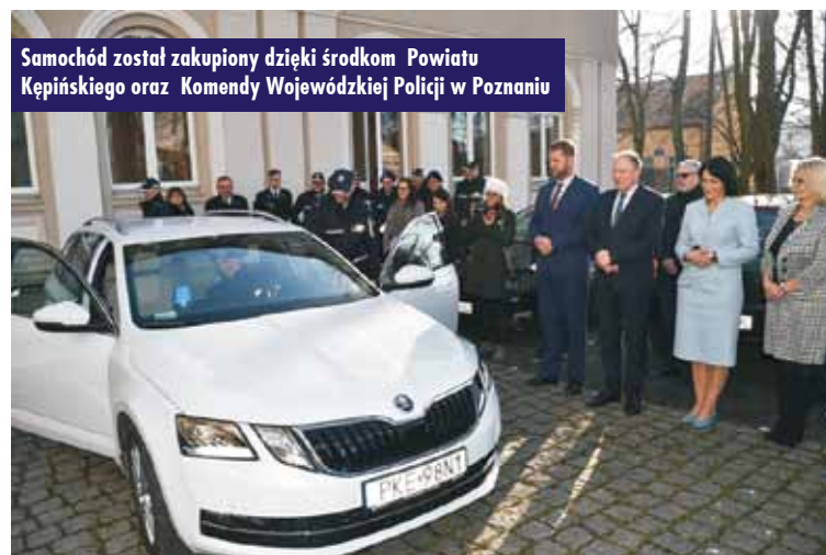
Samochód został zakupiony dzięki środkom Powiatu Kępińskiego oraz Komendy Wojewódzkiej Policji w Poznaniu

Koła Gospodyń Wiejskich, które skorzystały z finansowego wsparcia udzielonego przez ARiMR, do końca stycznia mają czas na złożenie sprawozdania rozliczającego