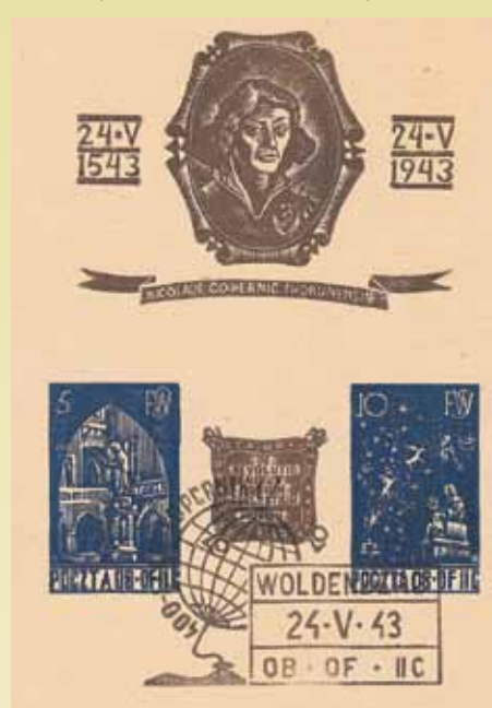
Okolicznościowa karta pocztowa wydana w Oflagu II C

W Woldenbergu oprócz urzędowej funkcjonowała także poczta wewnętrzna. Powstała ona w 1942 r. z inicjatywy Zarządu Funduszu Wdów i Sierot (pieniądze gromadzone na tym funduszu przekazywano najbardziej potrzebującym żonom poległych żołnierzy). Po akceptacji pomysłu przez władze niemieckie i Najstarszego Obozu uruchomiono działalność placówki oraz powołano do kierowania nią Komisję Pocztową. W początkowej fazie organizatorzy tego przedsięwzięcia musieli zmierzyć się z problemami związanymi z brakiem niezbędnych