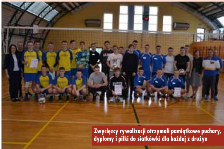
Zwycięzcy rywalizacji otrzymali pamiątkowe puchary, dyplomy i piłki do siatkówki dla każdej z drużyn

LOWE - szkolenia w Hiszpanii w ramach projektu ERASMUS+ dla nauczycieli ZSP nr 2 w Kępnie