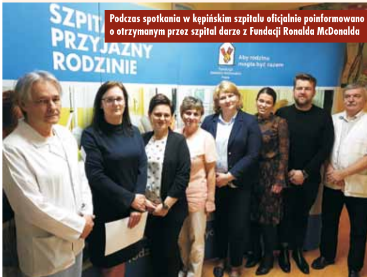
Podczas spotkania w kępińskim szpitalu oficjalnie poinformowano o otrzymanym przez szpital darze z Fundacji Ronalda McDonalda

Łóżko dla rodzica przy łóżku dziecka w wielu szpitalach wciąż jest marzeniem. Brak przestrzeni to najczęstszy powód tego, że rodzice czują się jak goście. Dlatego, wychodząc naprzeciw potrzebom rodziców, oddział dziecięcy szpitala w Kępnie otrzymał 10 wielofunkcyjnych łóżek oraz komplety pościeli od Fundacji Ronalda McDonalda. Zgodnie z misją Fundacji: „Aby rodzina mogła być razem” dar uzupełnia podstawowe wyposażenie oddziałów dziecięcych i służy rodzicom wspierającym dziecko w czasie pobytu w szpitalu.