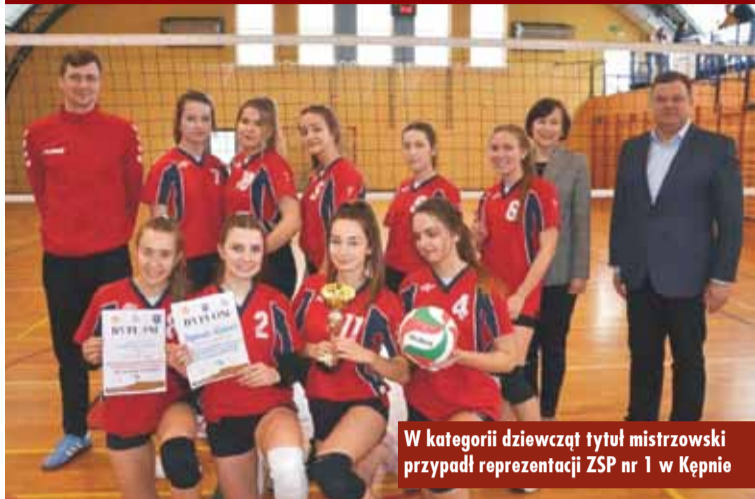
W kategorii dziewcząt tytuł mistrzowski przypadł reprezentacji ZSP nr 1 w Kępnie

3 i 4 marca br. w sali gimnastycznej Zespołu Szkół Ponadpodstawowych nr 1 w Kępnie odbyły się Mistrzostwa Powiatu w Siatkówce Dziewcząt i Chłopców Szkół Ponadpodstawowych. Do rywalizacji w kategorii dziewcząt i chłopców wystartowały wszystkie szkoły ponadpodstawowe z powiatu kępińskiego. Zawody przeprowadzono, rozgrywając turniej systemem „każdy z każdym” do dwóch wygranych setów. Wszystkie spotkania charakteryzowały się dużym zaangażowaniem sportowym zawodniczek i zawodników.