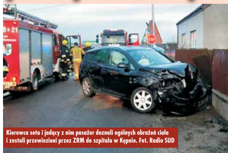
Kierowca seta i jadący z nim pasażer doznali ogólnych obrażeń ciała i zostali przewiezieni przez ZRM do szpitala w Kępnie.

26 lutego br., przed godziną 17.00, w Trzebieiniu doszło do zdarzenia z udziałem dwóch samochodów osobowych. Na miejsce zadysponowano Zespoły Ratownictwa Medycznego, funkcjonariuszy Komendy Powiatowej Policji w Kępnie oraz zastępy z: Jednostki Ratowniczo-Gaśniczej w Kępnie, OSP Łęka Opatowska, OSP Trzebień i OSP Opatów.