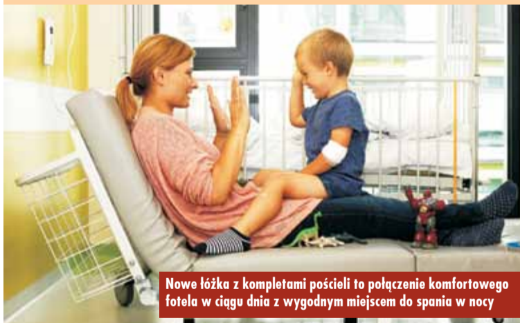
Nowe łóżka z kompletami pościeli to połączenie komfortowego fotela w ciągu dnia z wygodnym miejscem do spania w nocy

We współpracy dla Kępna włączył się także „Metalowiec” – firma produkująca łóżka, które Fundacja 5 lat temu wybrała do swoich programów. Łóżka zostały wykonane w sposób, który umożliwia bardzo wy-