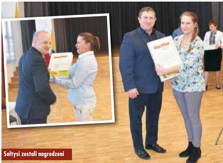
Sołtysi zostali nagrodzeni