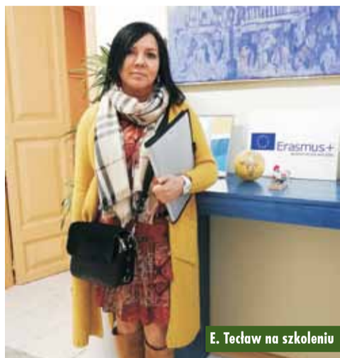
E. Teclaw na szkoleniu

Uczniowie Zespołu Szkół Specjalnych w Słupi pod Kępnem na IX Międzyszkolnym Konkursie z Języka Angielskiego