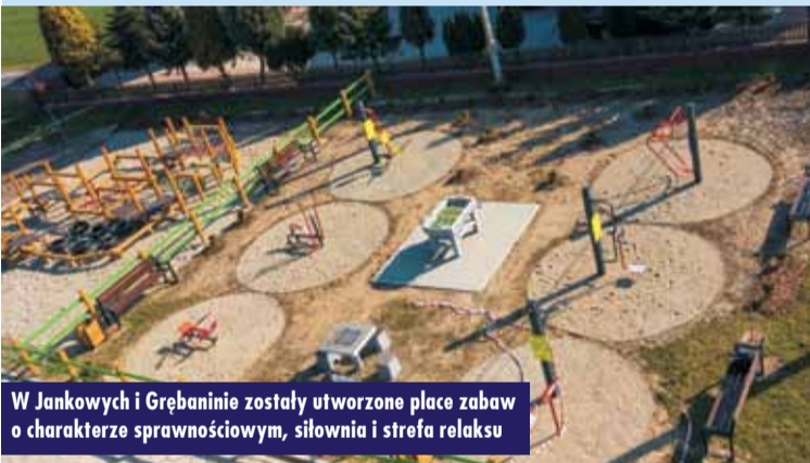
W Jankowych i Grębaninie zostały utworzone place zabaw o charakterze sprawnościowym, siłownia i strefa relaksu

Zarząd Województwa Wielkopolskiego przyjął listę podmiotów przewidzianych do dofinansowania w ramach trzeciej edycji programu „Szatnia na medal”