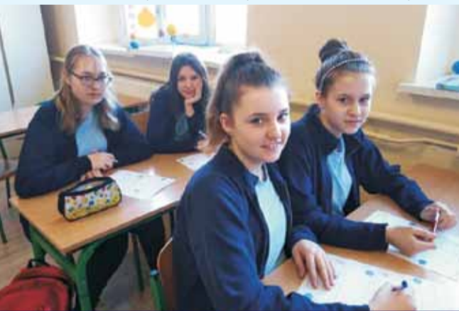
Podczas pierwszych zajęć uczniowie poznawali podstawowe zasady zdrowego stylu życia i omawiali zagadnienia związane z marnowaniem żywności

jeść i zdrowo żyć”. Podczas lekcji dowiedzieli się, w jaki sposób ułożyć jadłospis, aby zawierał on wszystkie produkty z podstawowych grup żywieniowych. Ponadto świetnie bawili się w trakcie gry dydaktycznej, a zwieńczeniem projektu edukacyjnego był klasowy konkurs „Zostań mistrzem kuchni”.