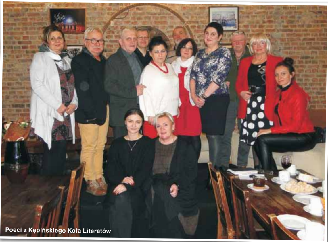
Poeci z Kępińskiego Koła Literatów