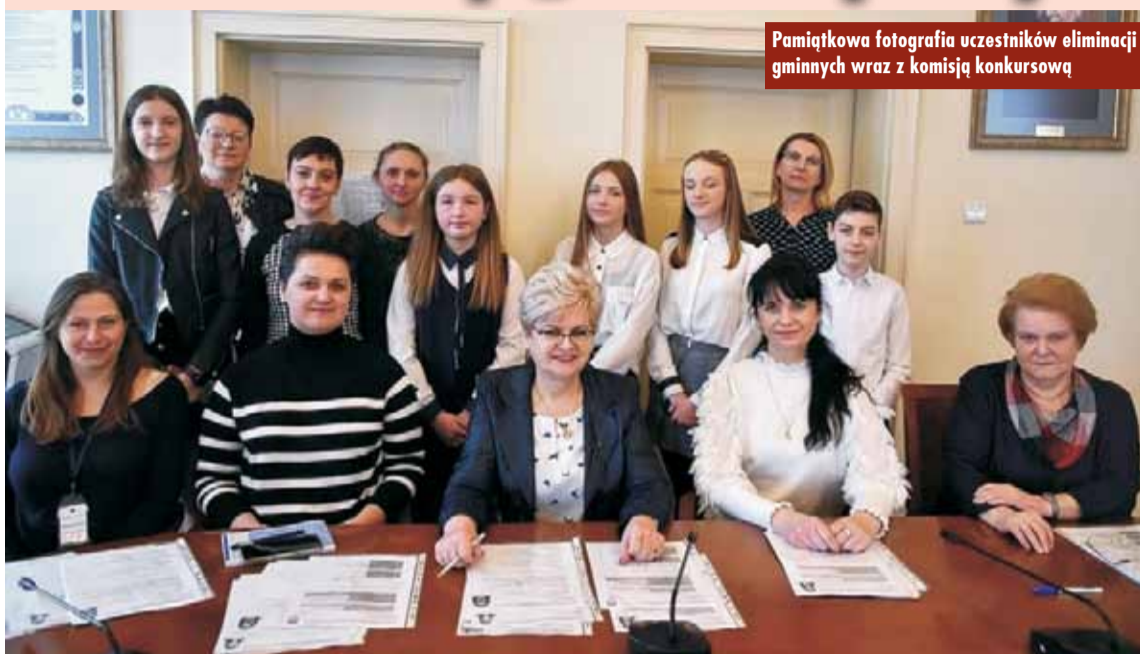
Pamiątkowa fotografia uczestników eliminacji gminnych wraz z komisją konkursową