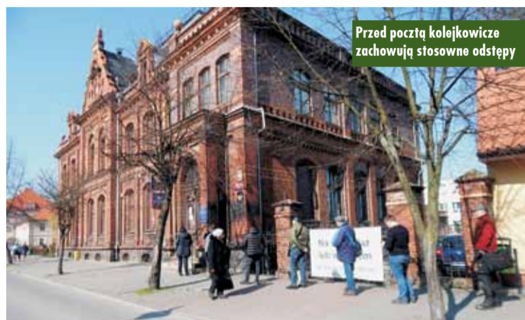
Przed pocztą kolejniczkę zachowują stosowne odstępy

konkretnego terminu, jednak może to nastąpić w każdej chwili. Wszystkie spotkania w grupach większych niż 50 osobowe zostają zawieszone. W ten sposób ograniczono możliwość uczestniczenia we mszach św. - Zachęcam do skorzystania z dyspensy od obowiązku uczestnictwa w niedzielnych i codziennych mszach świętych - sugerował biskup kaliski Edward Janiak. Msze są transmitowane za pośrednictwem internetu, telewizji i radia. Na czas stanu zagrożenia epidemiologicznego działalność barów, klubów, restauracji i kasyn będzie zawieszona. Spowodowało to, że w ubiegłą sobotę ruch w centrum Kępna był zdecydowanie mniejszy.