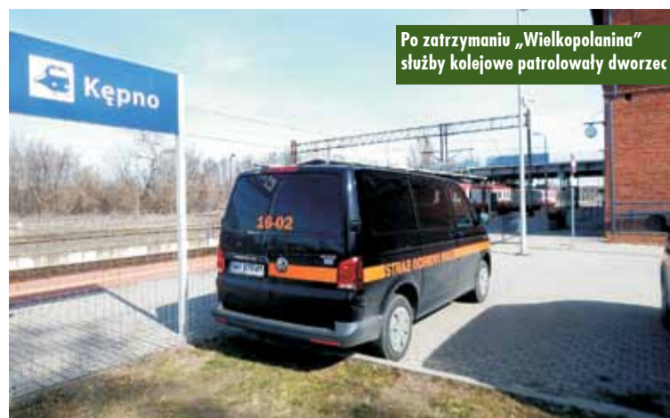
Po zatrzymaniu „Wielkopolanina” służby kolejowe patrołowały dworzec

W ubiegłym tygodniu na wniosek starosty Roberta Kieruzala odbyło