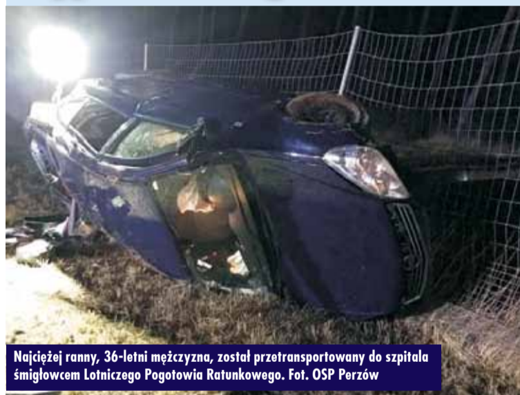
Najciężej ranny, 36-letni mężczyzna, został przetransportowany do szpitala śmigłowcem Lotniczego Pogotowia Ratunkowego.

8 marca br., tuż po godzinie 19.00, na trasie S8, na pasie w kierunku Wrocławia, na wysokości 87 kilometra między Kępem a Sycowem, doszło do zdarzenia drogowego.