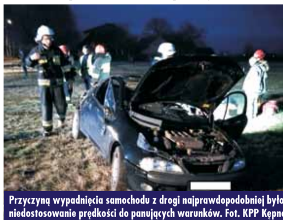
Przyczyną wypadnięcia samochodu z drogi najprawdopodobniej było niedostosowanie prędkości do panujących warunków.

przybyli na miejsce zdarzenia, zastali dwóch mężczyzn, którzy poruszali się tym pojazdem. To mieszkańcy Kępna w wieku 20 i 21 lat. - W pojeździe najprawdopodobniej znajdował się trzeci mężczyzna, który przed przybyciem funkcjonariuszy zbiegł z miejsca zdarzenia. Tożsamość tego obywatela jest w tej chwili ustalana – poinformował oficer prasowy KPP