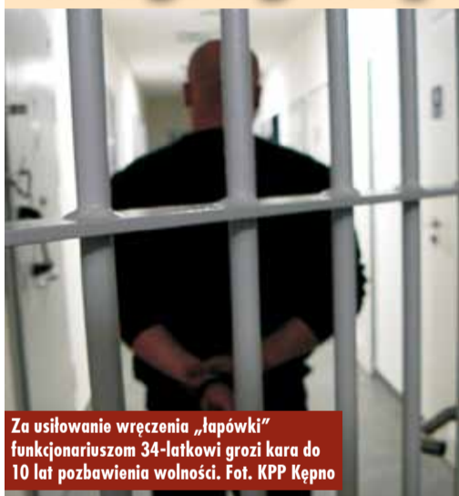
Za usiłowanie wręczenia „łapówki” funkcjonariuszom 34-latkowi grozi kara do 10 lat pozbawienia wolności.

1 marca br., po godzinie 16.00, na ul. Szkolnej w Łęce Opatowskiej, w rejonie boiska szkolnego, funkcjonariusze Posterunku Policji w Łęce Opatowskiej z siedzibą w Opatowie podjęli czynności służbowe wobec dwóch mężczyzn, którzy spożywali alkohol w miejscu niedozwolonym. Dwaj obywatele Ukrainy, 34- i 36-latek zostali wylegitymowani i poinformowani o popełnionym wykroczeniu. Wtedy 34-latek zaproponował policjantom korzyść majątkową w zamian za odstąpienie od ukarania. - Na taką propozycję reakcja naszych funkcjonariuszy mogła być tylko jedna – założyli mężczyźnie kajdanki i przewieźli prosto do kępińskiej jednostki – podkreślił oficer prasowy KPP Kępno st. post. Rafał Stramowski. Teraz 34-latek odpowie nie tylko za popełnione wykroczenie, ale również za usiłowanie wręczenia korzyści majątkowej funkcjonariuszom w zamian za odstąpienie przez nich od czynności służbowych, za co grozi kara do 10 lat pozbawienia wolności.