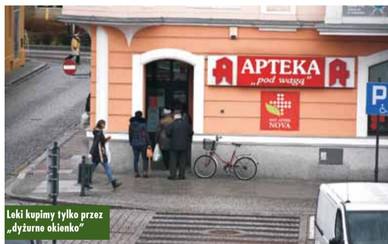
Leki kupimy tylko przez „dyżurne okienko”

że wymienione towary są przedmiotami zabronionymi do wystawiania na platformach. - Zasady te pomogą uchronić kupujących przed towarami niewiadomego pochodzenia i podlegają natychmiastowemu wykonaniu. Zakaz obejmuje m.in. żele i substancje o działaniu antybakteryjnym i przeznaczone do dezynfekcji, maseczki chirurgiczne i ochronne, fartuchy chirurgiczne, odzież operacyjną i medyczne ochraniacze na buty, rękawice chirurgiczne, czepki medyczne oraz produkty asypetyczne, jałowe albo sterylne - informuje Tomasz Stube, kierownik Oddziału Mediów i Komunikacji Społecznej Gabinetu Wojewody.