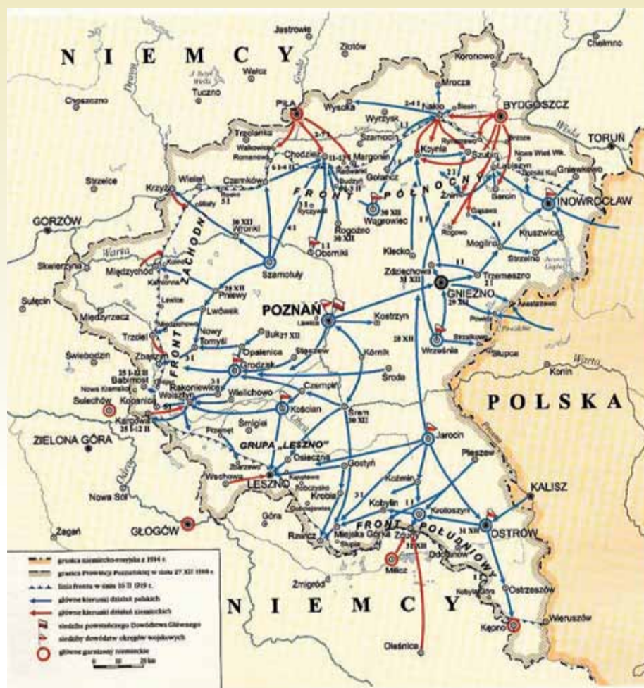
Rozwój Powstania Wielkopolskiego od 27 grudnia 1918 roku do 16 lutego 1919 roku