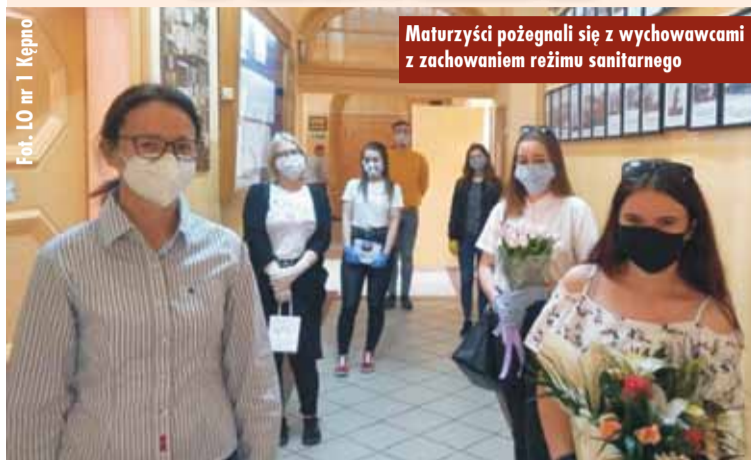
Maturzyści pożegnali się z wychowawcami z zachowaniem reżimu sanitarnego

24 kwietnia 2020 r. uczniowie klas trzecich, obecni absolwenci, w wyznaczonych godzinach i z zachowaniem reżimu sanitarnego, przybyli po świadectwa ukończenia liceum. Pożegnanie nie było łatwe dla uczniów i wychowawców. Nie- możliwe było uhonorowanie najlepszych uczniów na scenie auli, zorganizowanie tradycyjnych spotkań