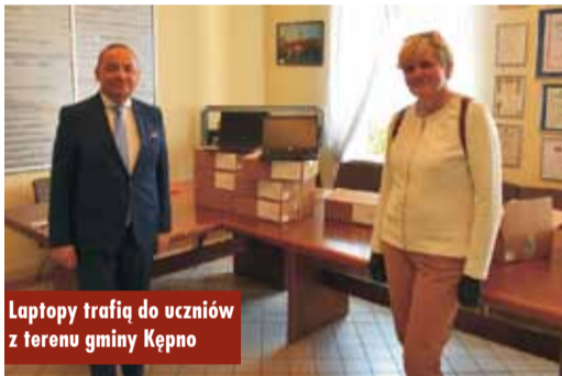
Laptopy trafią do uczniów z terenu gminy Kępno

w ramach Programu Operacyjnego Polska Cyfrowa na lata 2014-2020.