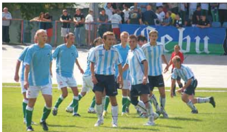
Polonia po raz pierwszy od... 20 lat pokonała przy Wał Matejki KKS Kalisz. W najstarszym mieście w Polsce kępnianie pokonali KKS 1:0 i była to ich pierwsza wyjazdowa wygrana z Dumą Kalisza od sezonu 1988/1989.

Począwszy od drugiej połowy meczu w Ostrzeszowie i całego meczu z Iskrą Sieroszewice wiedzieliśmy, że gramy w miarę przyzwoicie. Brakowało tylko punktów. Mecz w Kaliszu był najlepszym momentem i miejscem na przełamanie się. Jedyne co ciśnie mi się na usta to słowo dziękuję, chociaż wiem, że to i tak za mało.