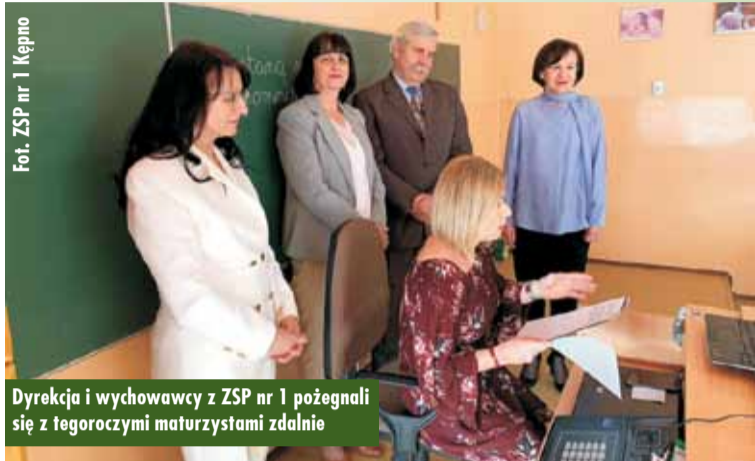
Dyrekcja i wychowawcy z ZSP nr 1 pożegnali się z tegorocznymi maturzystami zdalnie

Po części oficjalnej wychowankowie pozostali w kontakcie zdalnym z wychowawcami. Oprac. m