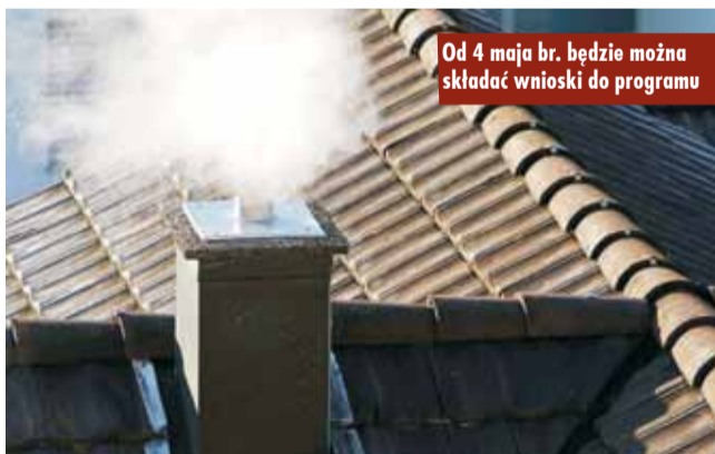
Od 4 maja br. będzie można składać wnioski do programu

programu. Pula środków przeznaczona na to zadanie w 2020 r. jest ograniczona, jednak, jak zapewnia wójt gminy Bralin Piotr Hołoś i Rada Gminy Bralin, program będzie kontynuowany w kolejnych latach.