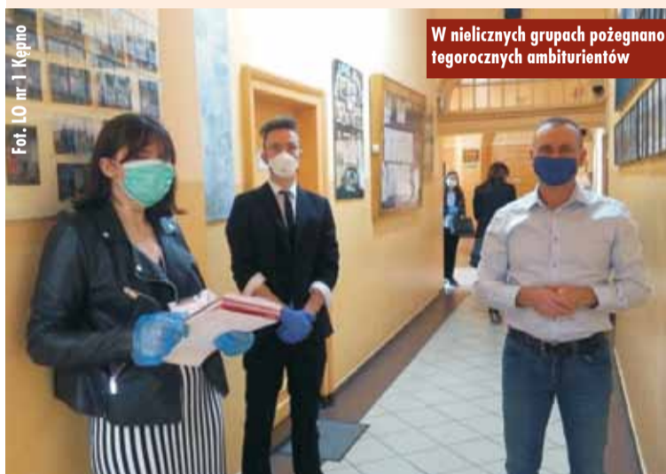
W nielicznych grupach pożegnano tegorocznych maturzystów

mądrzejszymi ludźmi, którzy równocześnie posiadli wiedzę na poziomie rozszerzonym z kilku przedmiotów ogólnokształcących naraz. Przez trzy lata mogliście w pełni korzystać z wiedzy nauczycieli, utrwalać zgromadzone wcześniej oraz na nowo wyuczone treści i umiejętności z różnych dyscyplin nauki. Życzę Wam, drodzy maturzyści, abyście