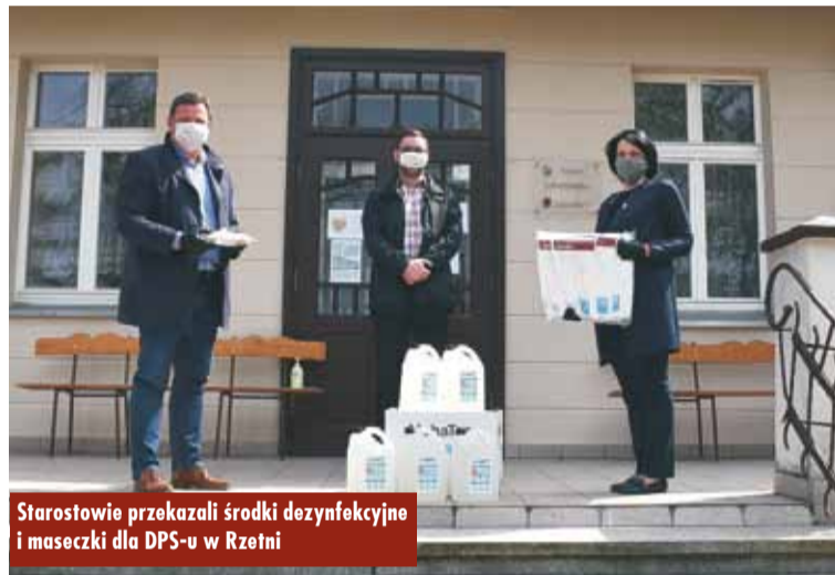
Starostowie przekazali środki dezynfekcyjne i maseczki dla DPS-u w Rzetni

Podjęmowane są również inne działania, np. oferta pomocy psychologicznej dla kadry domów pozostających w kwarantannie. Ich celem jest wsparcie samorządu w zapewnieniu ciągłości opieki osobom starszym i niepełnosprawnym przebywającym w domach pomocy społecznej. Sytuacja wszystkich wielkopolskich domów pomocy społecznej oraz innych jednostek organizacyjnych pomocy społecznej jest na bieżąco monitorowana. Placówki regularnie otrzymują