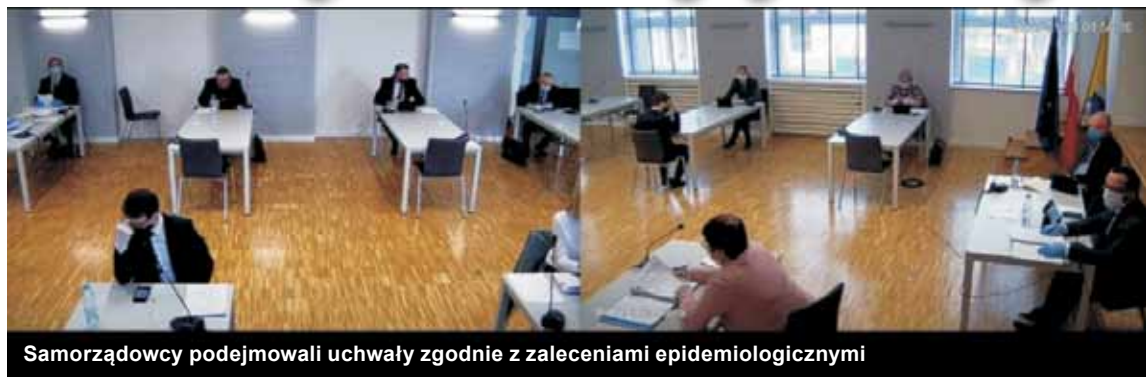
Samorządowcy podejmowali uchwały zgodnie z zaleceniami epidemiologicznymi

Na ostatniej sesji Rady Gminy samorządowcy zdecydowali o zwolnieniu z podatku od nieruchomości należnego za okres maj i czerwiec 2020 r. Dotyczy to podatników, których płynność finansowa uległa pogorszeniu na skutek spadku obrotów gospodarczych, w następstwie wystąpienia koronawirusa, z zastrzeżeniem, że nie posiadają zaległości w