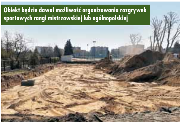
Obiekt będzie dawał możliwość organizowania rozgrywek sportowych rangi mistrzowskiej lub ogólnopolskiej

pomieszczenie nauczycieli wychowania fizycznego, sale fitness, siłownię oraz pomieszczenie techniczne (ko-