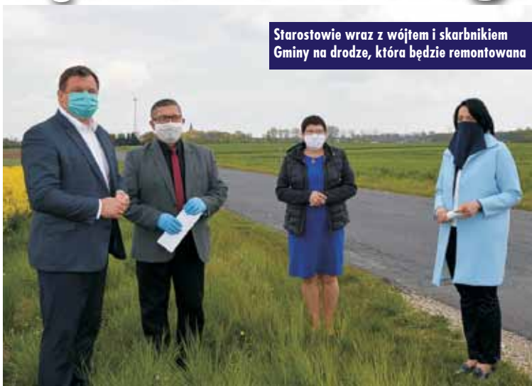
Starostwie wraz z wójtem i skarbnikiem Gminy na drodze, która będzie remontowana

4 maja br. podpisane zostało porozumienie pomiędzy Gminą Łęka Opatowska i Powiatem Kępińskim w celu wspólnej realizacji projektu inwestycyjnego na drodze powiatowej zlokalizowanej w obrębie gminy Łęka Opatowska.