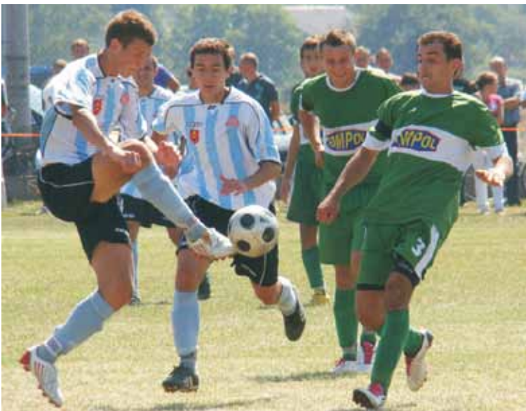
Po dwóch zwycięstwach na otwarcie sezonu przyszła pora na porażkę. W pierwszym meczu w roli gospodarza opatowianie nie dali rady Ostrovii 1909 Ostrów Wielkopolski, ulegając późniejszemu mistrzowi rozgrywek 1:3