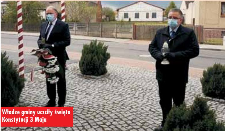
Władze gminy uczciły święto Konstytucji 3 Maja

Tegoroczne obchody 229. rocznicy uchwalenia Konstytucji 3 Maja były inne niż zwykle. Nie było uroczystych eucharystii, licznych pocztów sztandarowych ani żadnych uroczystości. Jednak władze samorządowe nie zapomniały o uczczeniu tej rocznicy. Majowe święto upamiętniono poprzez zło-