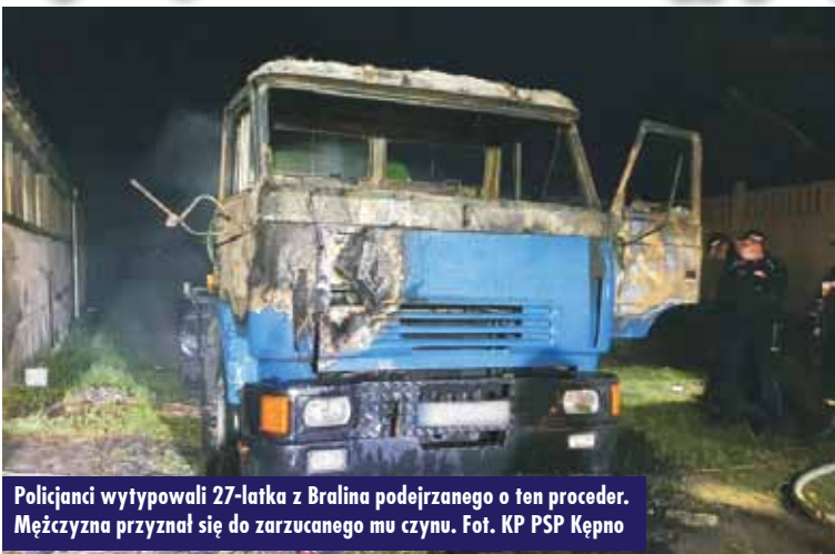
Policjanci wytypowali 27-latkę z Bralina podejrzaną o ten proceder. Mężczyzna przyznał się do zarzucanego mu czynu.

W sobotę, 25 kwietnia br., dyżurny Stanowiska Kierowania Komendanta Powiatowej Państwowej Straży Pożarnej w Kępnie otrzymał zgłoszenie o pożarze samochodu ciężarowego na ul. Lipowej w Bralinie. Do zdarzenia zadysponowano zastę-