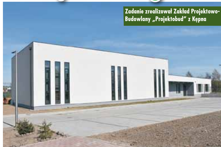
Zadanie zrealizował Zakład Projektowo-Budowlany „Projektobud” z Kępna

Zakończyła się budowa sali gimnastycznej w Krążkowach. Inwestycja polegała na rozbudowie Szkoły Podstawowej w Krążkowach o salę gimnastyczną wraz z zapleczem sanitarnym oraz dwoma salami dydaktycznymi. Zadanie zrealizował Zakład Projektowo-Budowlany