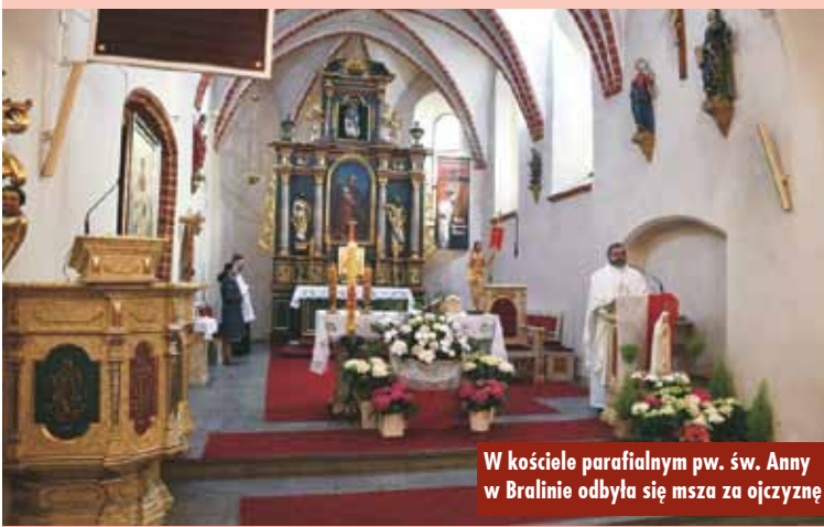
W kościele parafialnym pw. św. Anny w Bralinie odbyła się msza za ojczyznę

Święto uchwalenia Konstytucji 3 Maja każdego roku gromadzi na mszy świętej oraz okolicznościowej akademii wielu mieszkańców. W tym roku, ze względu na pandemię koronawirusa, uroczystość była obchodzona skromniej niż zwykle.