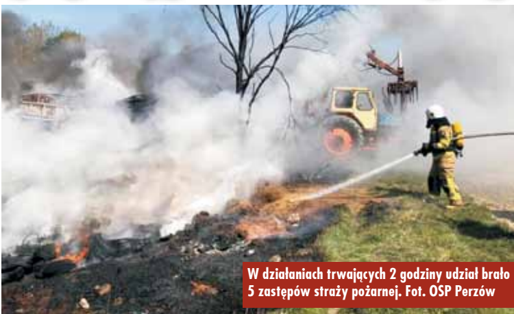
W działaniach trwających 2 godziny udział brało 5 zastępów straży pożarnej.

16 kwietnia br., tuż po godzinie 12.00, do Stanowiska Kierowania Komendanta Powiatowego Państwowej Straży Pożarnej w Kępnie wpłynęło zgłoszenie o pożarze w miejscowości Gęsia Górka (gmina Perzów).