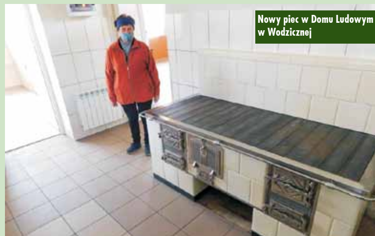
Nowy piec w Domu Ludowym w Wodziejcznej