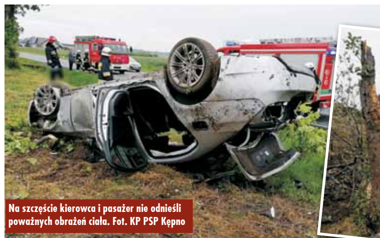
Na szczęście kierowca i pasażer nie odnieśli poważnych obrażeń ciała.

Działania strażaków polegały na zabezpieczeniu miejsca zdarzenia oraz odłączeniu zasilania w uszkodzonym pojeździe. W trakcie działań na miejsce zdarzenia przybył lawetą pomocy drogowej kierowca bmw oraz jego pasażer. Po zakończeniu czynności prowadzonych przez policję teren uprzątnięto – mówi oficer prasowy KP PSP Kępno kpt. Paweł Michalski.