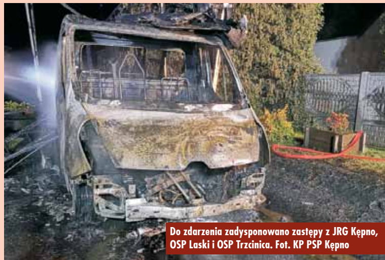
Do zdarzenia zadysponowano zastępy z JRG Kępno, OSP Laski i OSP Trzcinica.

Zdarzenie z udziałem samochodu osobowego na 92 km trasy S8 w kierunku Warszawy