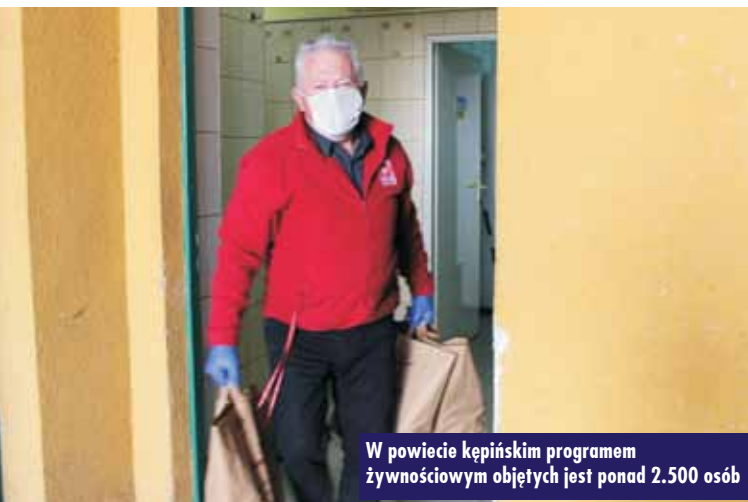
W powiecie kępińskim programem żywnościowym objętych jest ponad 2.500 osób

pracownicy we współpracy z Miejsko-Gminnym Ośrodkiem Pomocy Społecznej w Kępnie informowali poszczególnych osoby i przez cały dzień, tak, aby nie robić tłoku, przy Caritasie Diecezji Kaliskiej, w parku w Słupi pod Kępem, wydawali paczki żywnościowe. Osoby do otrzymania pomocy żywnościowej są kwalifikowane przez Ośrodki Pomocy Społecznej na podstawie skierowań. Osoby potrzebujące, których dochód nie przekracza 1.402 zł w przypadku osoby samotnie gospodarującej i 1.056 zł w przypadku osoby w rodzinie, powinny zgłaszać się do właściwego dla swojego miejsca zamieszkania Ośrodka Pomocy Społecznej. Skierowania są wydawane