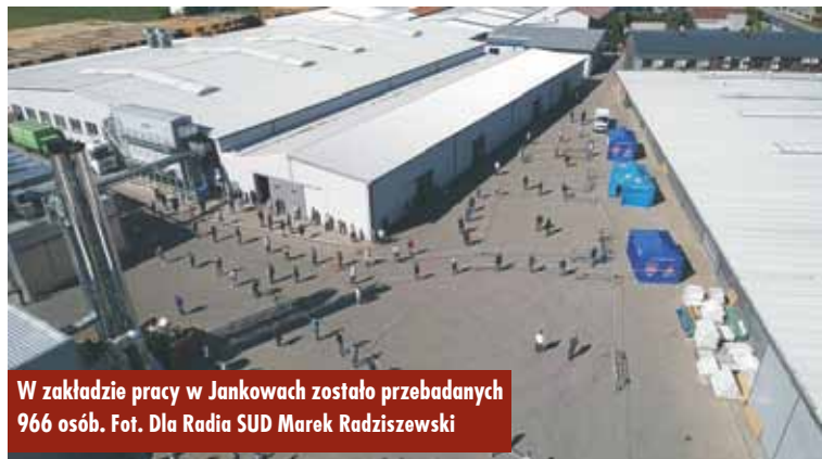
W zakładzie pracy w Jankowach zostało przebadanych 966 osób.

koronawirusem objętych nadzorem epidemiologicznym jest aktualnie 207 osób, hospitalizowane są 222 osoby, a poddane izolacji lub kwarantannie – 5.523 osoby. Odnotowano 2.059 przypadków zakażenia koronawirusem, z czego 147 osób zmarło (stan na 26 maja br.).