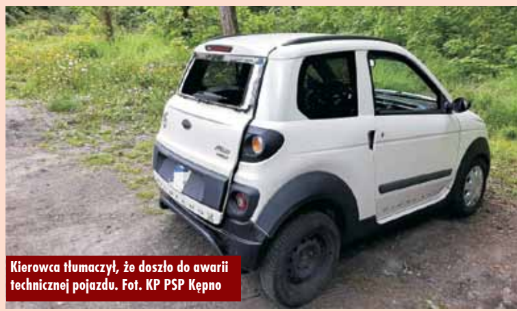
Kierowca tłumaczył, że doszło do awarii technicznej pojazdu.

ce do budynku Caritasu. Mężczyzna tłumaczył policji, że doszło do awarii technicznej pojazdu. Osoby poszkodowane – 29-letnia kobieta, 46-letnia kobieta i 46-letni mężczyzna, wszyscy mieszkańcy Nosal – stały wówczas na schodach – tłumaczy oficer prasowy KPP Kępno st. post. Rafał Stramowski. Oprac. KR