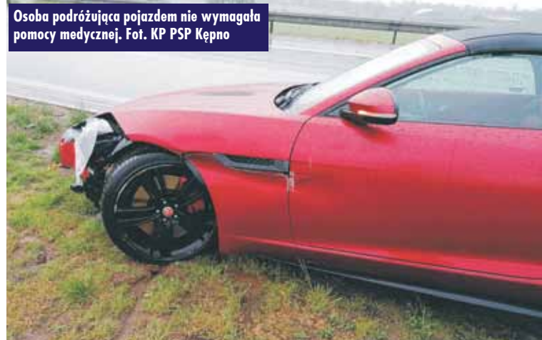
Osoba podróżująca pojazdem nie wymagała pomocy medycznej.

Ostatnie pożegnanie chórzysty Tadeusza Piecucha