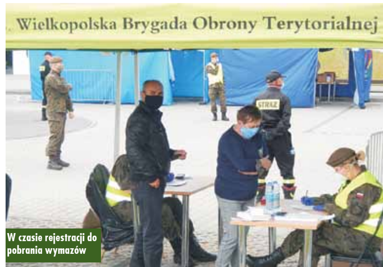
W czasie rejestracji do pobrania wymazów

rialnej, a jeden to zespół wymazowy utworzony przez SP ZOZ Kępno. W akcję zaangażowanych było wiele osób i instytucji, w tym Powiat Kę-