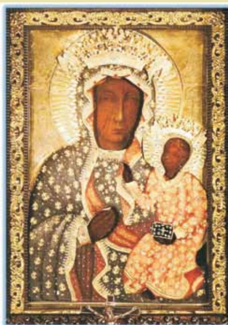
Cudowny Obraz Matki Bożej Częstochowskiej Królowej Polski z Jasnej Góry (fot. na podstawie książki Moniki Rogozińskiej pt. „Polowanie na Matkę”, Wydawnictwo „Paulinianum”, Częstochowa, 2018 r.)

Należy podkreślić, że ład jałtański nie zapewnił po II wojnie światowej oczekiwanego pokoju europejskiego ani światowego. Już wkrótce, bo w 1946 roku, Churchill mówi w Fulton o zapad-