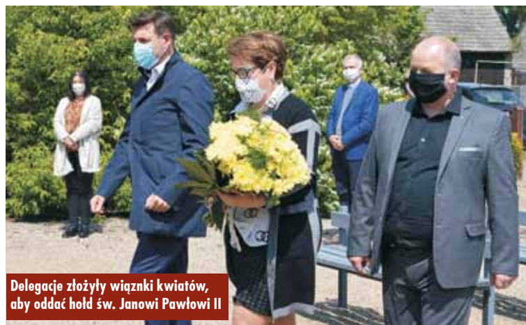
Delegacje złożyły wiązanki kwiatów, aby oddać hołd św. Janowi Pawłowi II

szawskie Centrum Myśli Jana Pawła II. Ekspozycja prezentuje najważniejsze momenty z życia Karola Wojtyły. Przed kościołem kwestowano też na budowę