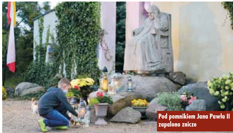
Pod pomnikiem Jana Pawła II zapalono znicze

Mikorzynie. Jan Paweł II jest bowiem patronem tamtejszej szkoły podstawowej.