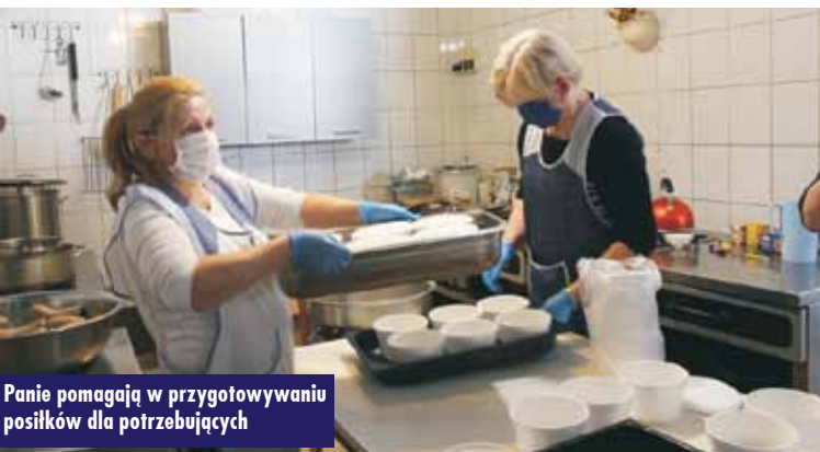
Panie pomagają w przygotowywaniu posiłków dla potrzebujących

się osoby potrzebujące pomocy. Tak samo sytuacja wyglądała w przypadku jadłodajni Caritas i PCK w całej Polsce, które były zamknięte. Jednak zadaliśmy sobie, aby pomimo tej trudnej sytuacji, wydawać potrzebującym jedzenie każdego dnia – zostały stworzone okienka podawcze, wychodzące na zewnątrz. Postaramy się, aby przy udziale firm budowlanych w szybkim tempie stworzyć takie okna i aby ci ludzie, z odległości ustalonych w obostrzeniach, czyli 2 metrów, mogli odbierać przygotowane już produkty. Przed świętami wielkanocnymi z pomocy żywnościowej przygotowanej przez Caritas Diecezji Kaliskiej skorzystało około 3 tysięcy osób.