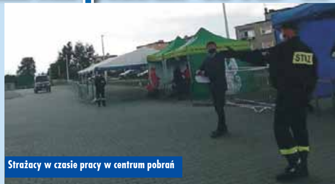
Strażacy w czasie pracy w centrum pobrań

Drugi etap inwestycji związany z budową kanalizacji rozliczony przez Urząd Gminy w Trzcinicy