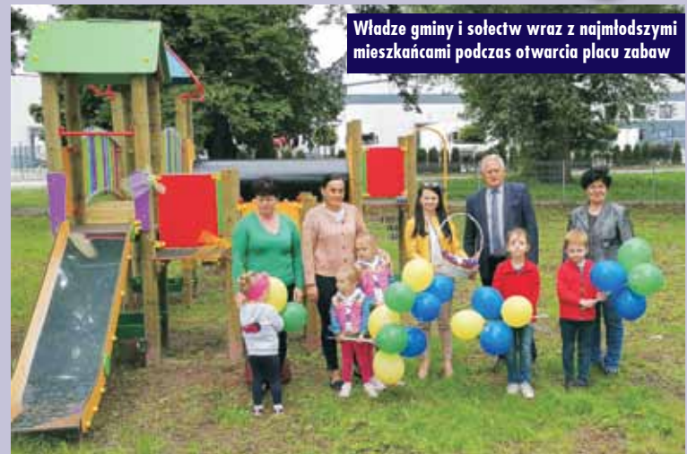
Władze gminy i sołectw wraz z najmłodszymi mieszkańcami podczas otwarcia placu zabaw

Uroczystego otwarcia placu zabaw dokonali sołtysi Chojęcina-Parceli, Chojęcina oraz Działoszy. Ze względu na panującą w kraju sytuację epidemiczną, uroczystość przebiegała w ograniczonej formie. - Pomimo wyjątkowej sytuacji, po raz kolejny pokazaliśmy, że złożone obietnice w pełni realizujemy.