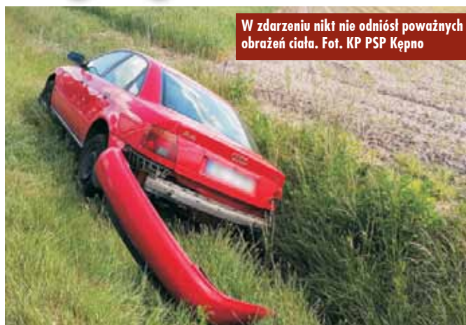
W zdarzeniu nikt nie odniósł poważnych obrażeń ciała.

Pobicie 16-lletniego mieszkańca Kępna na terenie kompleksu sportowego przy ul. Nowowiejskiego w Kępnie