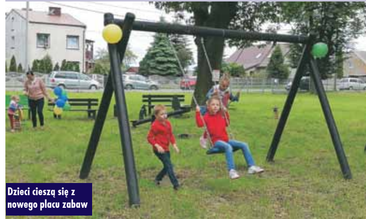
Dzieci cieszą się z nowego placu zabaw