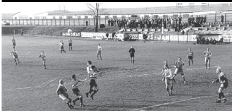
Starciem Lignomatu z Marko żył cały piłkarski region. Historyczne derby w trzeciej lidze przyciągnęły w listopadzie 1997 roku blisko tysięczną widownię.