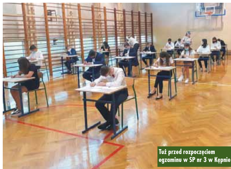
Tuż przed rozpoczęciem egzaminu w SP nr 3 w Kępnie