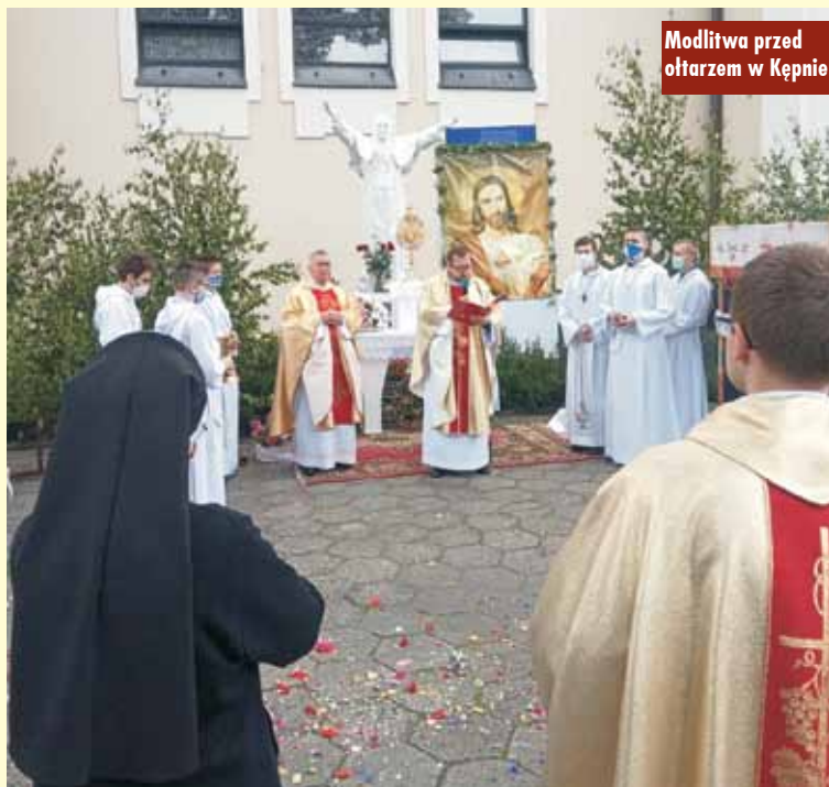
Modlitwa przed ołtarzem w Kępnie

W tym roku w procesji Bożego Ciała wzięło udział ponad 200 osób. m