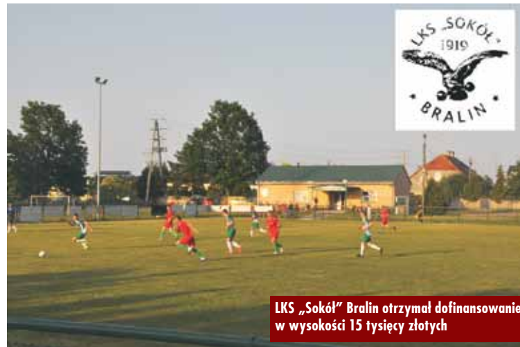
LKS „Sokół” Bralin otrzymał dofinansowanie w wysokości 15 tysięcy złotych