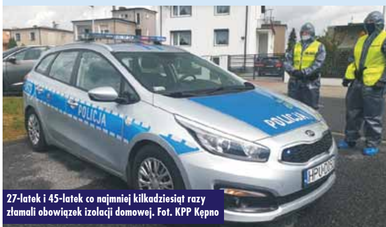
27-latek i 45-latek co najmniej kilkadziesiąt razy złamali obowiązek izolacji domowej.

W piątek, 12 czerwca br., funkcjonariusze Komendy Powiatowej Policji w Kępnie, w ramach pełnionej służby związanej z codzienną kontrolą osób poddanych kwarantannie,