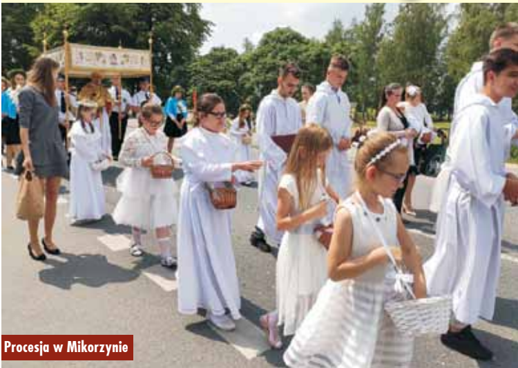
Procesja w Mikorzynie

Podczas tegorocznych uroczystości Najświętszego Ciała i Krwi Chrystusa wierni modlili się w intencji jak najszybszego ustania epidemii koronawirusa. Tak było i w czasie uroczystości w Kępnie.