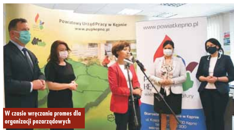
W czasie wręczania promes dla organizacji pozarządowych

W regionie kępińskim na projekty związane z seniorami, największą promesę w wysokości 100 000 złotych przyznano Caritas Diecezji Kaliskiej. Stowarzyszenie „Bractwo Świętego