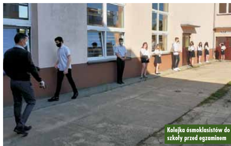
Kolejka ósmoklasistów do szkoły przed egzaminem

Największa grupa ósmoklasistów (95,7%) zadeklarowała przystąpienie do egzaminu z języka angielskiego. Drugim najczęściej wybieranym językiem jest język niemiecki. Do eg-