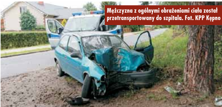
Mężczyzna z ogólnymi obrażeniami ciała został przetransportowany do szpitala.