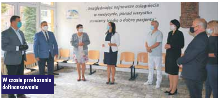
W czasie przekazania dofinansowania

Urząd Gminy w Łęce Opatowskiej otrzymał dotację z Rządowego Funduszu Inwestycji Lokalnych