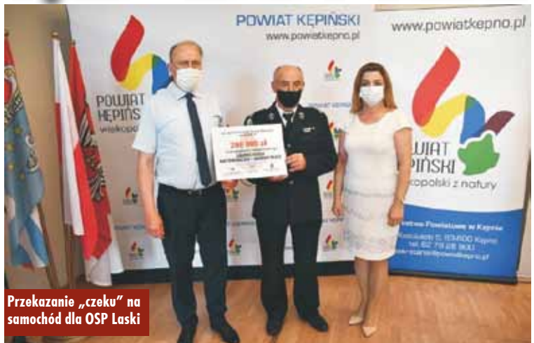
Przekazanie „czeku” na samochód dla OSP Laski

29 czerwca br. komendant główny Państwowej Straży Pożarnej poinformował o dofinansowaniu w kwocie 200 000 zł, pochodzącym z wpływów uzyskanych ze składek z tytułu obowiązkowego ubezpieczenia od ognia przekazanych przez zakłady ubezpieczeń z przeznaczeniem na zakup średniego samochodu ratowniczo-gaśniczego dla OSP Laski.