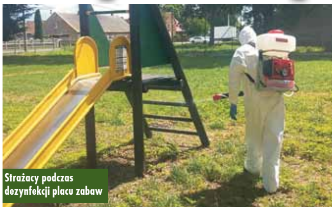
Strażacy podczas dezynfekcji placu zabaw