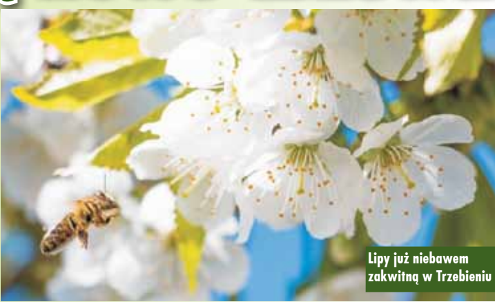
Lipy już niebawem zakwitną w Trzebieiniu