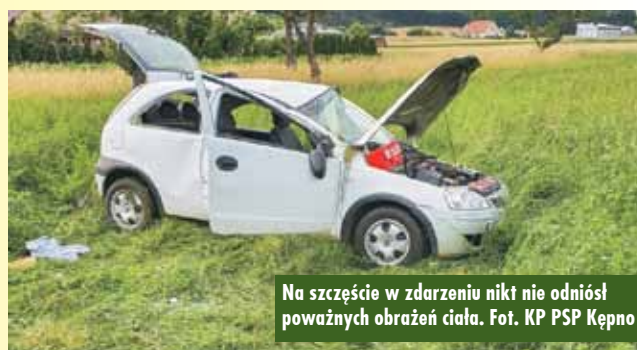
Na szczęście w zdarzeniu nikt nie odniósł poważnych obrażeń ciała.

2 lipca br., około godziny 18.40, dyżurny Stanowiska Kierowania Komendanta Powiatowego Państwowej Straży Pożarnej w Kępnie otrzymał zgłoszenie dotyczące zdarzenia drogowego w Rzetni. Samochód osobowy wypadł tam z jezdni. Pojazdem podróżowały cztery osoby, które, na szczęście, nie odniosły poważnych obrażeń ciała i nie wymagały hospitalizacji. - Działania strażaków polegały na zabezpieczeniu miejsca zdarzenia oraz udzieleniu kwalifikowanej pierwszej pomocy uczestnikom zdarzenia – mówi mł. kpt. Jakub Sobczak z KP PSP Kępno.