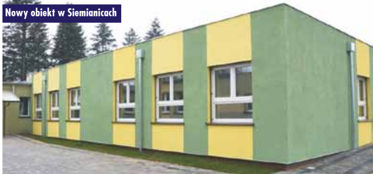
Nowy obiekt w Siemianicach