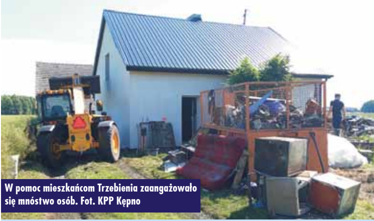
W pomoc mieszkańcom Trzebień zaangażowało się mnóstwo osób.

pod Kępem (Albertowska, Dworcowa, Katowicka, Kuźnicka, Kwiatowa, Leśna, Ogrodowa, Parkowa, Radosna, Słoneczna, Szeroka, Szkolna, Wąska, Wesoła, Wiatrakowa, Zielona), Trzebień, Białaszk i Młynarka.