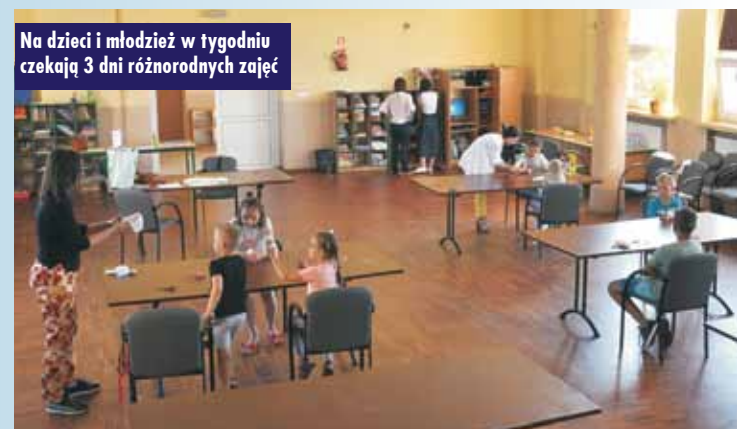
Na dzieci i młodzież w tygodniu czekają 3 dni różnorodnych zajęć

W tym dniu uczestnicy grają w planszówki i gry zręcznościowe, a na terenie zielonym przyległym do budynku prowadzone są zajęcia z siatkówki plażowej i piłki nożnej.