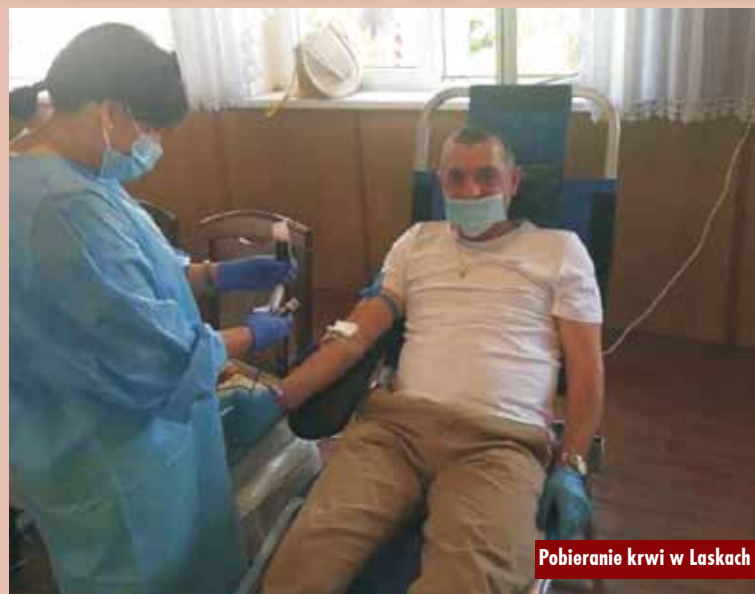
Pobieranie krwi w Laskach

Gmina powiększyła swoje udziały w Spółce „Oświetlenie uliczne i drogowe”