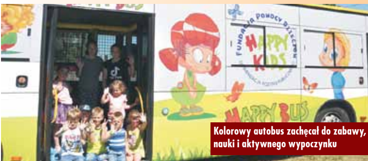
Kolorowy autobus zachęcał do zabawy, nauki i aktywnego wypoczynku

Tak zakończył się lipiec. Teraz przed dziećmi kolejny wakacyjny miesiąc i atrakcje, których na pewno nie zabraknie. Justyna Rojkiewicz