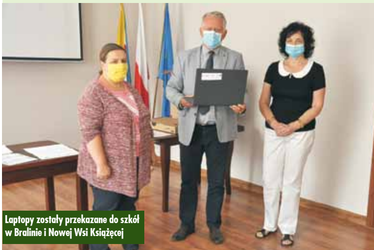
Laptopy zostały przekazane do szkół w Bralinie i Nowej Wsi Książęcej

które przekazane zostały do Szkoły Podstawowej w Bralinie i Zespołu Szkół w Nowej Wsi Książęcej. Szkoły, na podstawie wcześniej przeprowadzonego rozeznania, przekazały