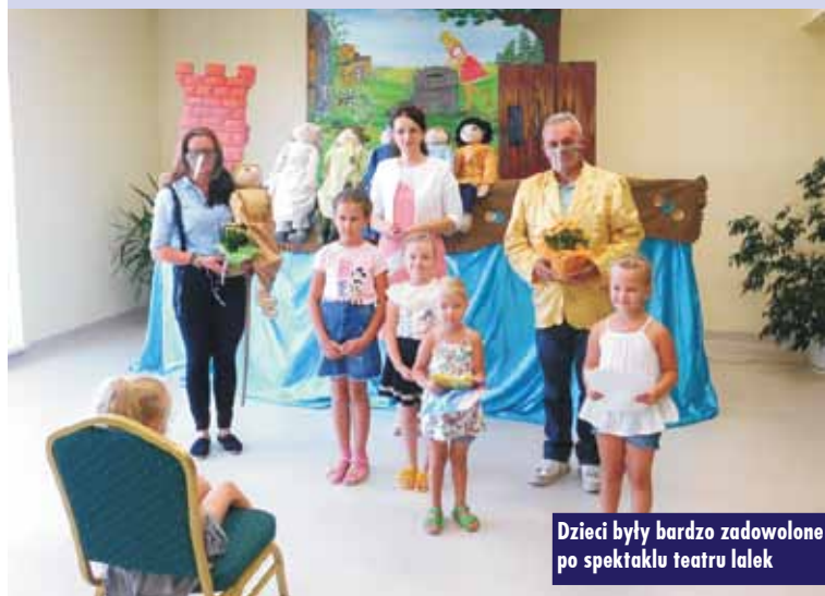
Dzieci były bardzo zadowolone po spektaklu teatru lalek

cej w złotym mieście i pomagającej biednym sierotom. Przedstawienie ukazało dzieciom, że im więcej w życiu uczynimy dobrego, tym więcej dobra do nas wróci, a wytrwała praca pozwoli zdobyć największą nagrodę.