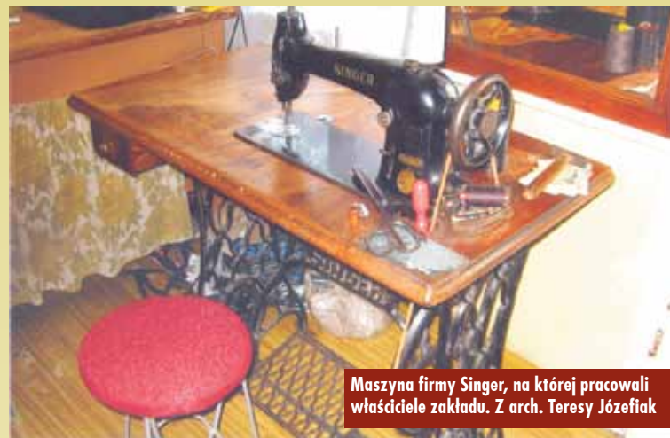
Maszyna firmy Singer, na której pracowali właściciele zakładu.

było tylko miejsce pracy, tu dorastało i uczyło się wiele pokoleń młodych ludzi. To oni teraz w różnych zakła-