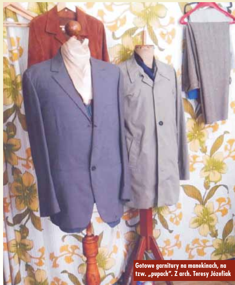
Gotowe garnitury na manekinach, na tzw. „pupach”.