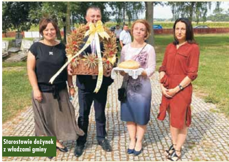
Starostwie dożynek z władzami gminy