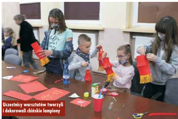
Uczestnicy warsztatów tworzyli i dekorowali chińskie lampiony

raju”, „Niebo w kolorze indygo” i „Chiny z dala od wielkiego miasta” była gościem Biblioteki Publicznej w Bralinie. Warsztaty odbyły się w