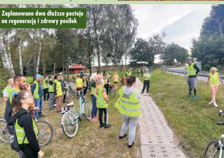
Zaplanowano dwa dłuższe postoje na regenerację i zdrowy posiłek

tomiast w Proszowie członkinie Koła Gospodyń Wiejskich przygotowały zdrowe, a zarazem pyszne kanapki i sałatki. Podczas przerw specjaliści z dziedziny sportu i zdrowia przekazali informację uczestnikom rajdu. Przeprowadzona została rozgrzewka oraz rozciąganie w celu uniknięcia kontuzji.