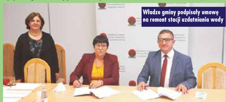
Władze gminy podpisały umowę na remont stacji uzdatniania wody

Zostały rozstrzygnięte przetargi nieograniczone na realizację dwóch inwestycji drogowych: przebudowy drogi gminnej w Piaskach oraz przebudowy ul. Reja i ul. Słowackiego w Opatowie