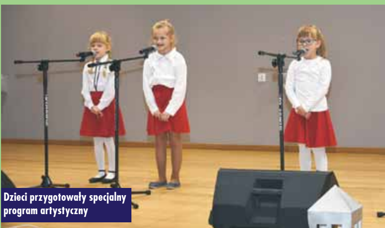
Dziewczyny przygotowały specjalny program artystyczny

Gmina Perzów otrzymała kolejne dofinansowanie z programu „Zdalna szkoła +” w ramach Ogólnopolskiej Sieci Edukacyjnej