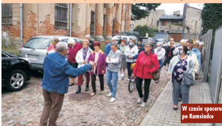
W czasie spaceru po Kamsiadce