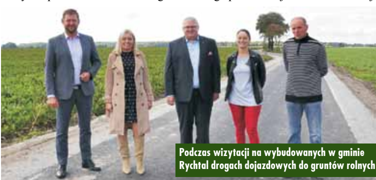
Podczas wizytacji na wybudowanych w gminie Rychtal drogach dojazdowych do gruntów rolnych

ni udział Gminy Rychtal wynosił 500 zł, co stanowiło 10% kosztów zadania. W ramach zadania posadzono 25 klonów i 25 lip. Nasadzenia wykonano przy drodze gminnej prowadzącej od drogi powiatowej w kierunku miej-