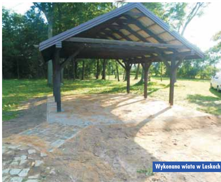
Wykonana wiatra w Laskach

W ostatnim czasie przeprowadzono kolejne prace remontowe i modernizacyjne w obiektach lub w ich otoczeniu. W Aniołce Pierwszej została wykonana nowa nawierzchnia z kostki betonowej pod altaną rekreacyjną. W Pomianach wymieniono kolejnych 12 okien w obiekcie pałacowym oraz zamontowano nową huśtawkę przy budynku nr 18. Przy Domu Ludowym w Piotrówie dokonano nasadzenia zieleni, ze środków gminnych zakupiono krzewy, folię oraz ozdobny kamień, natomiast prace ziemne i pielęgnacyjne wykonali mieszkańcy. Przy Domu Ludowym w Wodziejnej postawiono blaszane pomieszczenie gospodarcze. Na stadionie sportowym w Laskach postawiono altanę rekreacyjną, a w prace przygotowawcze włączyli się mieszkańcy.