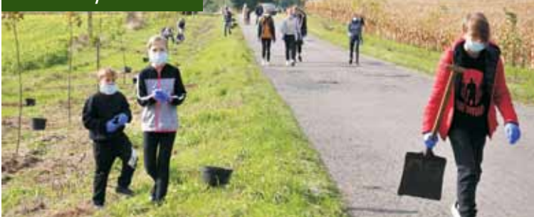
W nasadzeniu drzew udział wzięli uczniowie szkoły w Drożkach