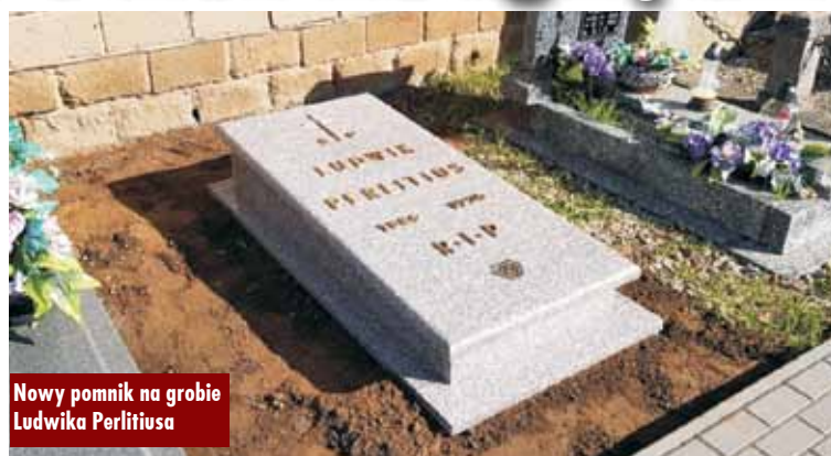
Nowy pomnik na grobie Ludwika Perlitiusa