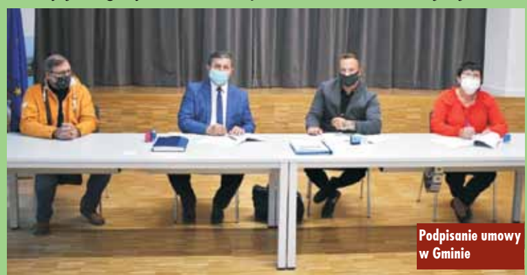
Podpisanie umowy w Gminie