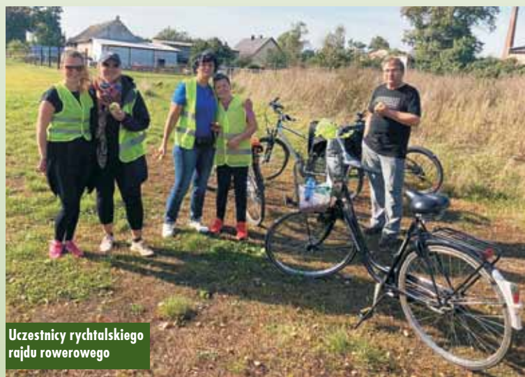
Uczestnicy rychtańskiego rajdu rowerowego

Celem rajdu było odwiedzenie na rowerze wszystkich miejscowości w gminie w ciągu jednego dnia oraz edukacja uczestników w zakresie zdrowego stylu życia, odżywiania, wpływu aktywności ruchowej na rozwój i samopoczucie człowieka, a także spędzenie czasu na świeżym powietrzu. Do pokonania była wymagająca trasa o długości blisko 60 km. Organizatorzy zaplanowali dla uczestników dwa dłuższe postoje na regenerację oraz zdrowe posiłki – w Drożkach na uczestników czekały owoce, na-