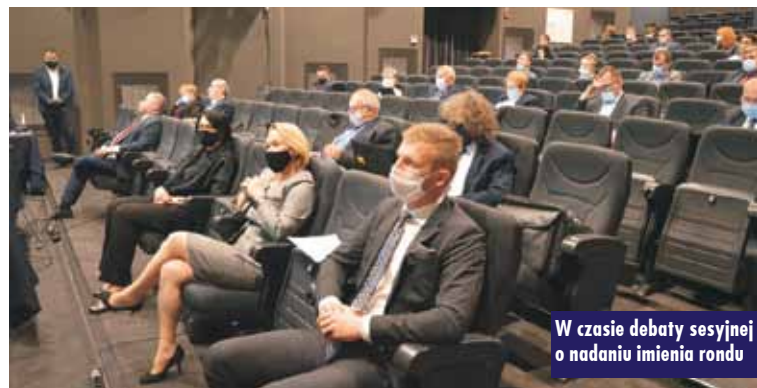
W czasie debaty sesyjnej o nadaniu imienia ronda