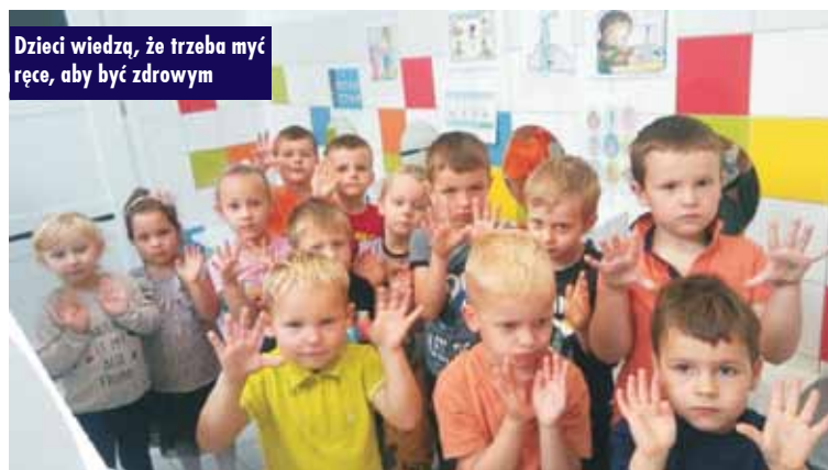
Dzieci wiedzą, że trzeba myć ręce, aby być zdrowym

domownikom przypominać o konieczności i zasadach częstego mycia rąk. Teraz już wszystkie przedszkolaki wiedzą o tym, że: kto chce zawsze zdrowym być, musi często ręczki myć! PS Rychtal