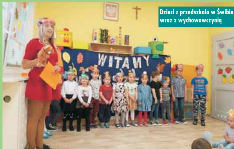
Dzieci z przedszkola w Świbie wraz z wychowawczynią

podsumowaniem bloku tematycznego o jesieni. Brawo dla pomysłowych przedszkolaków! Oprac. m