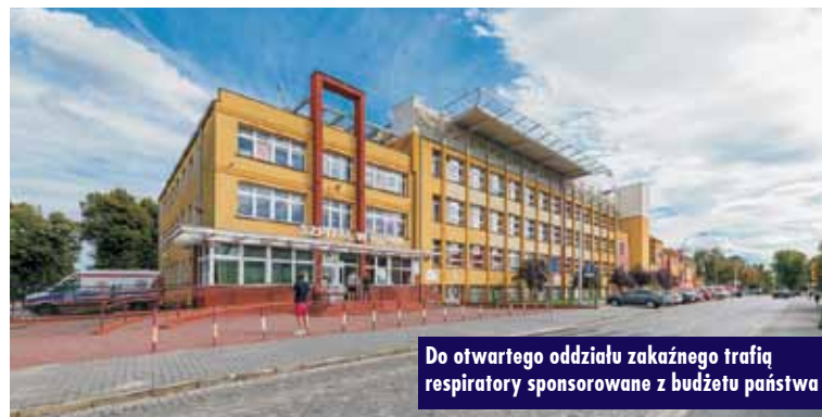
Do otwartego oddziału zakaźnego trafią respiratory sponsorowane z budżetu państwa