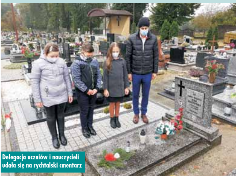
Delegacja uczniów i nauczycieli udala się na rychtański cmentarz