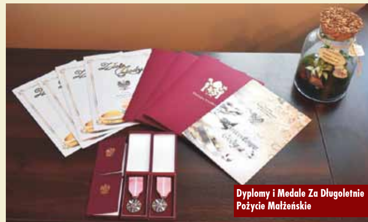
Dyplomy i Medale Za Długoletnie Pożycie Małżeńskie