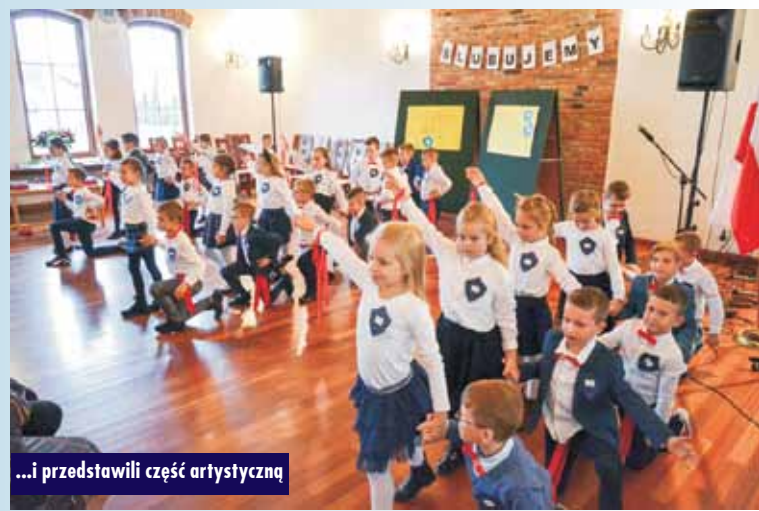
...i przedstawili część artystyczną

Uroczystość upłynęła w miłej atmosferze, choć, oczywiście, także w rygorze epidemicznym. Oprac. KR