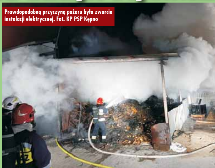
Prawdopodobną przyczyną pożaru było zwarcie instalacji elektrycznej.

Po przybyciu na miejsce zdarzenia potwierdzono pożar zabudowań gospodarczych. - Działania strażaków polegały na zabezpieczeniu i oświetleniu miejsca zdarzenia. Następnie podano cztery prądy gaśnicze w natarciu oraz obronie, co doprowadziło do ugaszenia pożaru. Na miejscu działało 7 zastępów (26 strażaków) – relacjonuje oficer prasowy KP PSP Kępno kpt. Paweł Michalezyk . Działania zakończono o godzinie 5.22. Prawdopodobną przyczyną zdarzenia było zwarcie instalacji elektrycznej. Oprac. KR