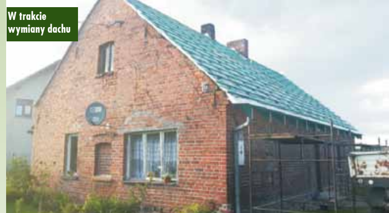
W trakcie wymiany dachu

gdzie standardem jest ciepłe, ogrzane mieszkanie, bieżąca woda, łazienka. Nie każdy bowiem jest w stanie samodzielnie zadbać o godność swoją i najbliższych. Dzięki dobrejmu sercu i państwu pomocy jesteśmy w stanie osiągnąć wyznaczony cel – apelowała. Zbiórka trwała pod adresem: pomagam.pl/basia3. Chętni