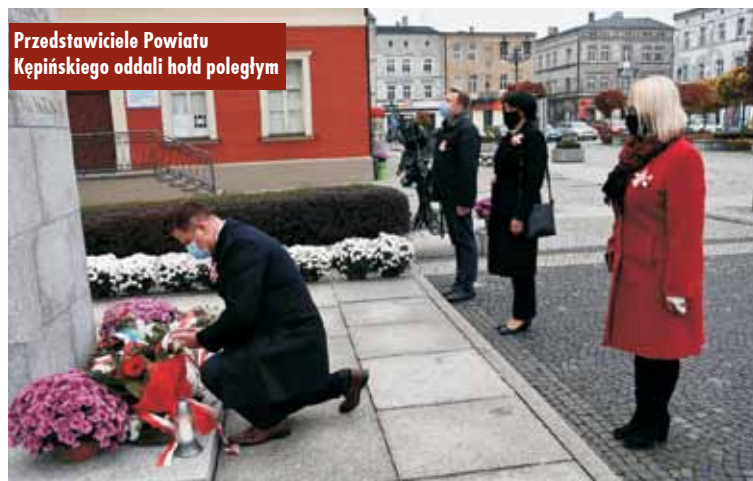
Przedstawiciele Powiatu Kępińskiego oddali hołd poległym

rowych. Mieszkańcy, którzy chcieli upamiętnić bohaterów walczących o niepodległą ojczyznę, mogli to zrobić indywidualnie.