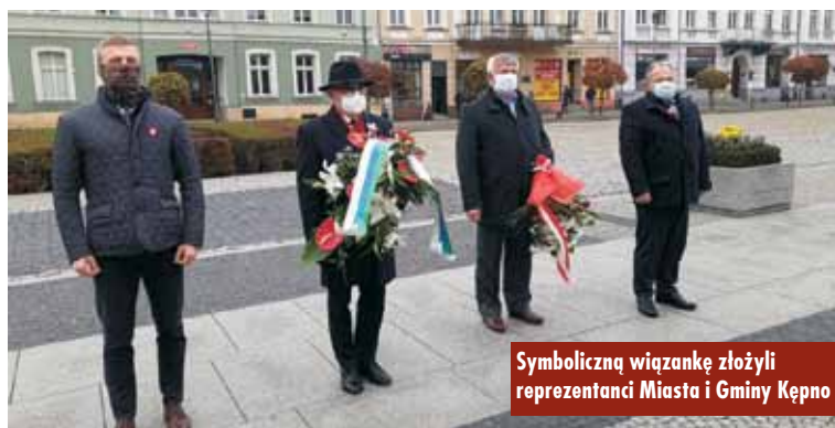
Symboliczną wiązkę złożyli reprezentanci Miasta i Gminy Kępno

łożenie kwiatów ze względu na sytuację epidemiczną odbyło się bez udziału delegacji i pocztów sztandaru