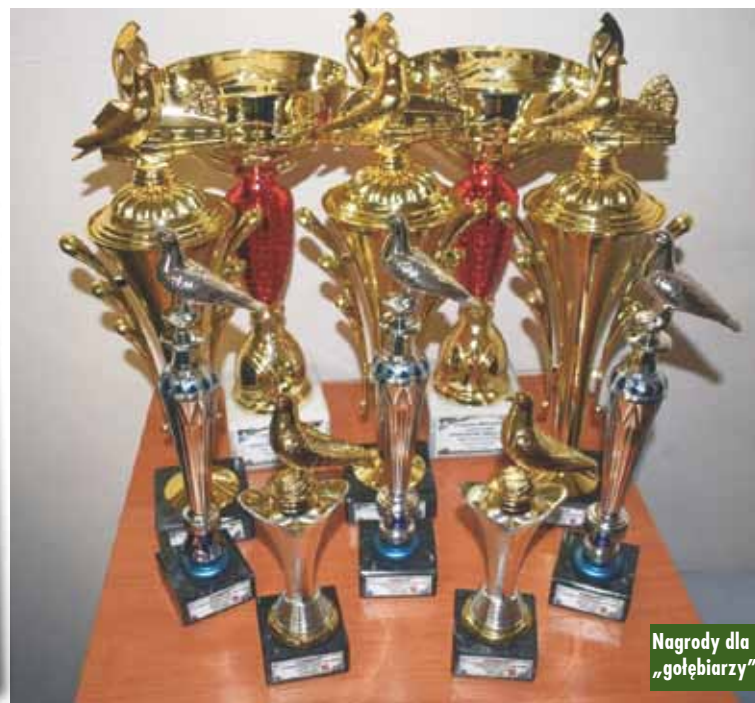
Nagrody dla „gołębiarzy”

Dobre wykorzystanie środków z funduszy Unii Europejskiej