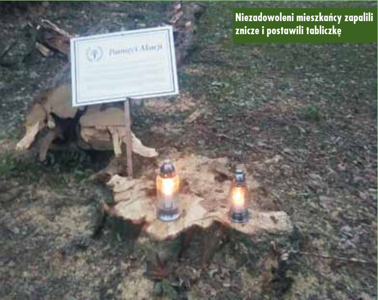
Niezadowoleni mieszkańcy zapalili znicze i postawili tabliczkę

naszych dzieci. Bez powiadomienia mieszkańców, pozbawiając nas głosu i możliwości ich ochrony, całkowicie samowolnie odebrano nam te piękne drzewa. Pograżeni w smutku zachowamy je w pamięci; podobnie jak aleję lipową przy ul. Nowowiejskiego, aleję kasztanowców białych i lip z ulic: Władysława Sikorskiego, Wrocławskiej, Tadeusza Kościuszki, Obrońców Pokoju, Powstańców Wielkopolskich; Aleję Topolową, aleję przy ul. Spółdzielczej, topole przy ul. Sportowej i wiele innych starych drzew. Tekst podpisany został: „Pograżeni w smutku kępnianie”. KR