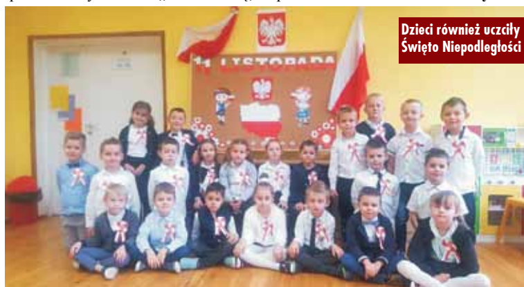
Dzieci również uczą się Święta Niepodległości

Dzień, który w placówce przeżyto dumnie i z uśmiechem na twarzach, na pewno przyczyni się do kształtowania patriotycznych postaw przedszkolaków. UG Rychtal