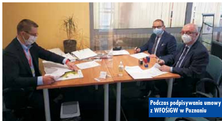
Podczas podpisywania umowy z WFOŚiGW w Poznaniu

się wymianę źródła ciepła na nowy kocioł olejowy kondensacyjny o mocy do 53,7 kW z wymianą całej instalacji przesyłowej i grzejników wraz z montażem zaworów termostatycznych. W ramach instalacji ciepłej wody użytkowej zakłada się montaż pompy ciepła powietrze-woda o mocy 1,8 kW z zasobnikiem o pojemności 300 l oraz wymianą całej instalacji wodnej wraz z montażem baterii z perlatorami w celu uzyskania oszczędności w zakresie wody. W ramach instalacji oświetlenia zakłada się wymianę istniejących opraw na