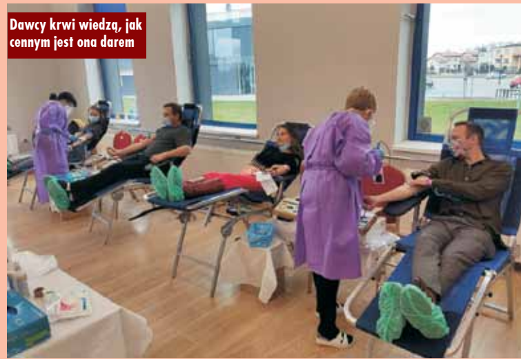
Dawcy krwi wiedzą, jak cennym jest ona darem