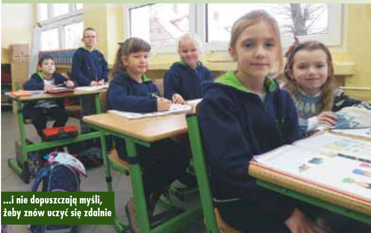
...i nie dopuszczają myśli, żeby znów uczyć się zdalnie

Wszystkie dzieci, z którymi rozmawiałem, cieszyły się, że wróciły do szkoły. Mówiły też, że miały już dosyć nauczania zdalnego. Nieco innego zdania było kilkoro rodziców, ale i oni przyprowadzili swoje pociechy do szkoły. m