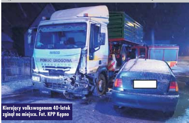
Kierujący volkswagenem 40-latek zginął na miejscu.

Na miejscu pracowała Grupa Dochodzeniowo-Śledcza KPP Kępno pod nadzorem prokuratora. Postępowanie w tej sprawie prowadzi KPP Kępno. KR