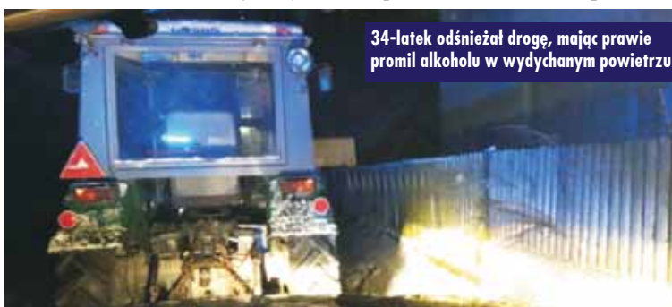
34-latek odśnieżał drogę, mając prawie promil alkoholu w wydychanym powietrzu

34-latek został osadzony w pomieszczeniu dla osób zatrzymanych.