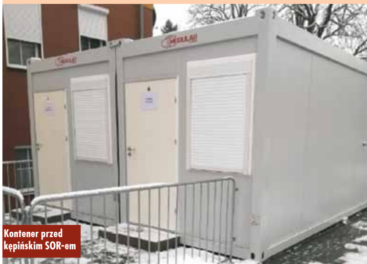
Kontener przed kępińskim SOR-em

20 stycznia br. rozpoczęto szczepienia pensjonariuszy DPS Rzetnia przeciwko COVID-19