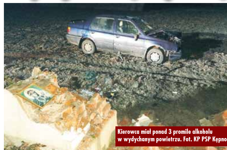
Kierowca miał ponad 3 promile alkoholu w wydychanym powietrzu.

1 stycznia br., przed godziną 18.00, dyżurny Stanowiska Kierowania Komendanta Powiatowego Państwowej Straży Pożarnej w Kępnie otrzymał zgłoszenie o dachowaniu samochodu osobowego marki Volkswagena w miejscowości Chojęcin. Do zdarzenia zadysponowano zastępy z Jednostki Ratowniczo-Gaśniczej w Kępnie, OSP Chojęcin i OSP Bralin.