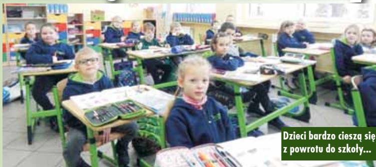
Dzieci bardzo cieszą się z powrotu do szkoły...

Inaczej na powrót do szkół patrzą rodzice, zdaniem niektórych jest jeszcze na to za wcześnie. - Jestem trochę zaniepokojona tym powrotem do szkół. Mój mąż jest nauczycielem, uczy starsze klasy, więc pracuje w domu, ja również pracuję zdalnie. Mamy jeszcze najmłodszą córkę i nie chcemy narażać naszej rodziny na