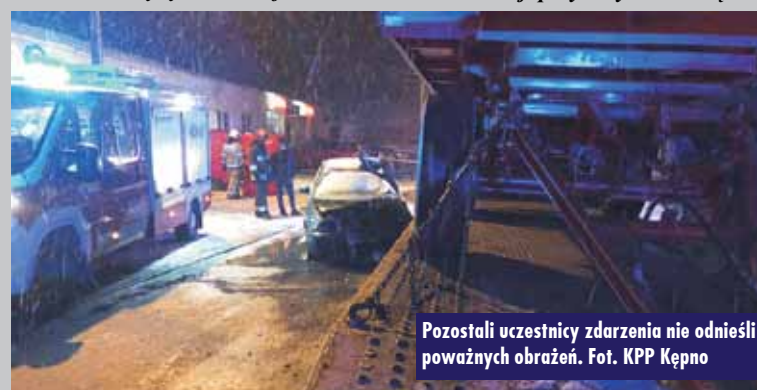
Pozostali uczestnicy zdarzenia nie odnieśli poważnych obrażeń.

pojeżdżie. Działania polegały na zabezpieczeniu miejsca zdarzenia, wykonaniu dostępu do osoby poszkodowanej przy użyciu narzędzi