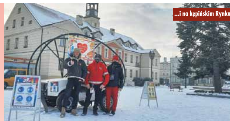
...i na kępińskim Rynku

Dokładna suma zebranych podczas Finału WOŚP środków będzie znana w późniejszym terminie, po przeliczeniu kwot z licytacji. W ubiegłym roku zebrano ponad 196.000 zł. W tym roku każdy grosz skrupulatnie przeliczali wolontariusze Spółdzielczego Banku Ludowego w Kępnie. - Cieszymy się, że tak wiele osób odniosło się życzliwie do działań związanych z organizacją 29. Finału WOŚP. Dziękujemy sponsorom,