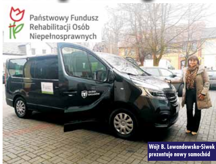
Państwowy Fundusz Rehabilitacji Osób Niepełnosprawnych