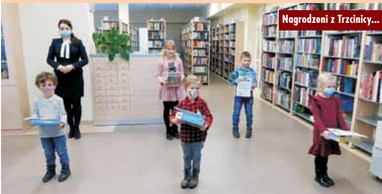
Nagrodzeni z Trzcinicy...

Wręczenie nagród odbyło się z zachowaniem reżimu sanitarnego (zachowanie limitu osób, mogących jednocześnie przebywać w bibliotece,