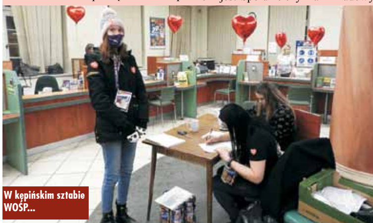
W kępińskim sztabie WOŚP...

Niestety, w tym roku, ze względu na pandemię i związane z nią obostrzenia, nie było części koncertowej, organizowanej cyklicznie w