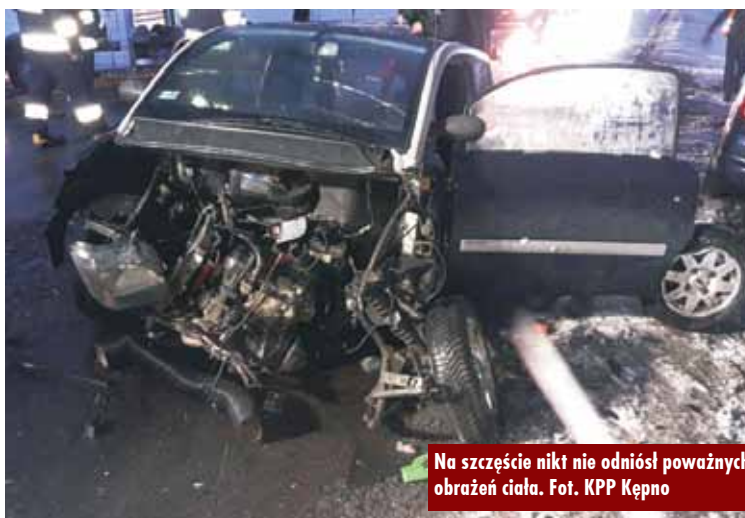
Na szczęście nikt nie odniósł poważnych obrażeń ciała.