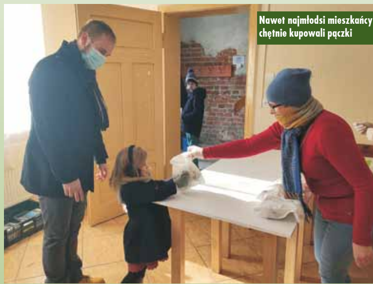
Nawet najmłodsi mieszkańcy chętnie kupowali pączki