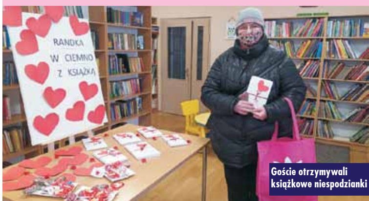
Goście otrzymywali książkowe niespodzianki

Dotacje na zadania publiczne w 2021 roku rozdysponowane