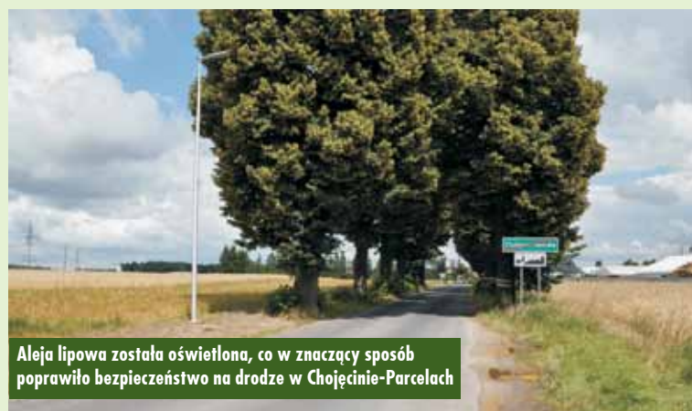
Aleja lipowa została oświetlona, co w znaczący sposób poprawiło bezpieczeństwo na drodze w Chojećcinie-Parcelach

Kolejnym istotnym – i, co najważniejsze, zrealizowanym – projektem sołectwa Mnichowice jest zadanie pn. „Wykonanie utwardzenia terenu po zbiorniku p-poż i wyeksponowanie sikawki konnej”. Dzięki wykonaniu tego zadania w sołectwie powsta-