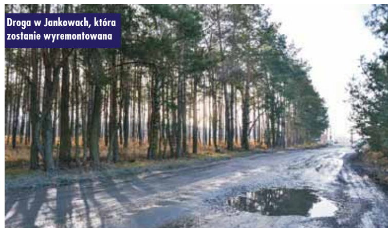
Droga w Jankowach, która zostanie wyremontowana