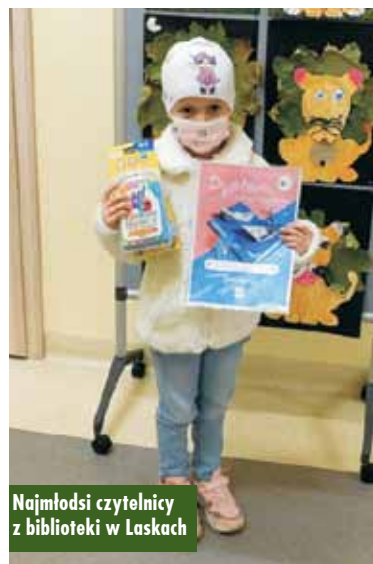
Najmłodsi czytelnicy z biblioteki w Laskach