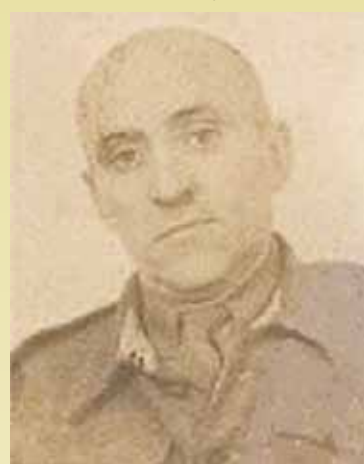
L. Salmonowicz.

5 KDP dotarła w okolice frontu w marcu 1944 roku. Po przybyciu, zluzowano marokańską 2 Dywizję Piechoty przy obronie rzeki Sangro. Żołnierze przechodzili okres zaprawy oraz przyzwyczajania się do trudnych warunków górskich, odbywało się to dodatkowo w zimowej aurze.