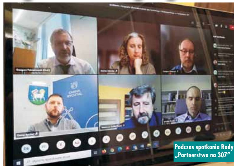
Podczas spotkania Rady „Partnerstwa na 307”

Przypomnijmy, że „Partnerstwo na 307” tworzy układ osadniczy ciągle przestrzennie i złożony z od-