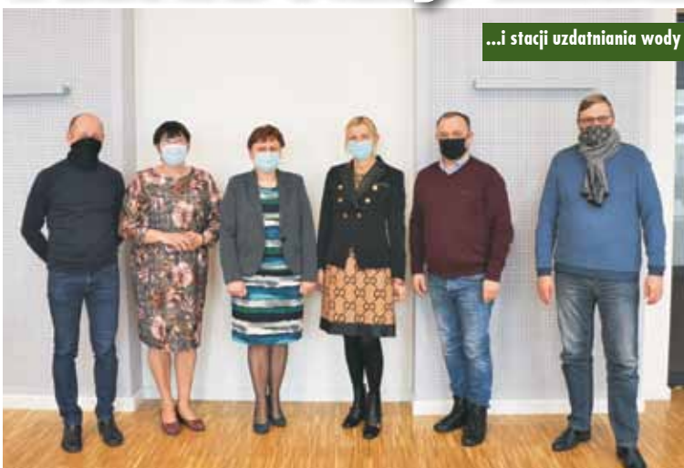
...i stacji uzdatniania wody

Wyłoniony w przetargu nieograniczonym wykonawca - firma HYDRO- MARKO z Jarocina - zgodnie z podpisaną umową zobowiązany jest