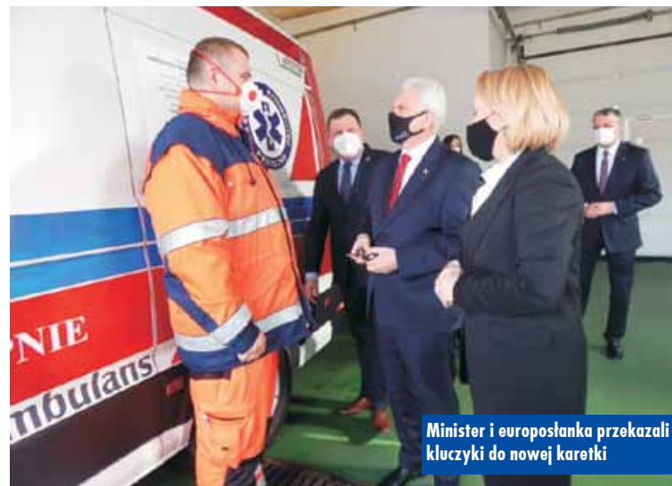
Minister i europosełka przekazali kluczyki do nowej karetki

Cyfrowy aparat mammograficzny GE Senographe Crystal Nova to nowoczesny w pełni cyfrowy (DR) aparat, posiadający ergonomiczną obudowę, dzięki której potrafi „dopasować” się do budowy anatomicznej pacjentki. Dedykowany jest dla badań przesiewowych. Posiada automatyczną optymalizację parametrów (AOP), co pozwala na dobór odpowiedniego kV i mAs w oparciu o gęstość radiologiczną i grubość piersi, co gwarantuje wyjątkową jakość obrazu przy ograniczonej dawce promieniowania. Dodatkowo aparat pozwala zwiększyć wykrywalność raka piersi o 21% w porównaniu do aparatów posiadających pośrednią radiografię cyfrową (CR). - Otwarcie dwóch nowych pracowni i zakup tej jakości sprzętu jest wielkim sukcesem kępińskiego szpitala i Zarządu Powiatu Kępińskiego. Realizacja tej inwestycji to kolejny przełomowy etap w rozwoju kępińskiego szpitala, gwarantujący podniesienie jakości i dostępności do diagnostyki na poziomie europejskim. Cyfrowe aparaty to także ochrona środowiska poprzez wyeliminowanie ciemni, odczynników chemicznych i klisz