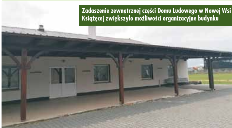
Zadaszenie zewnętrznej części Domu Ludowego w Nowej Wsi Książęcej zwiększyło możliwości organizacyjne budynku