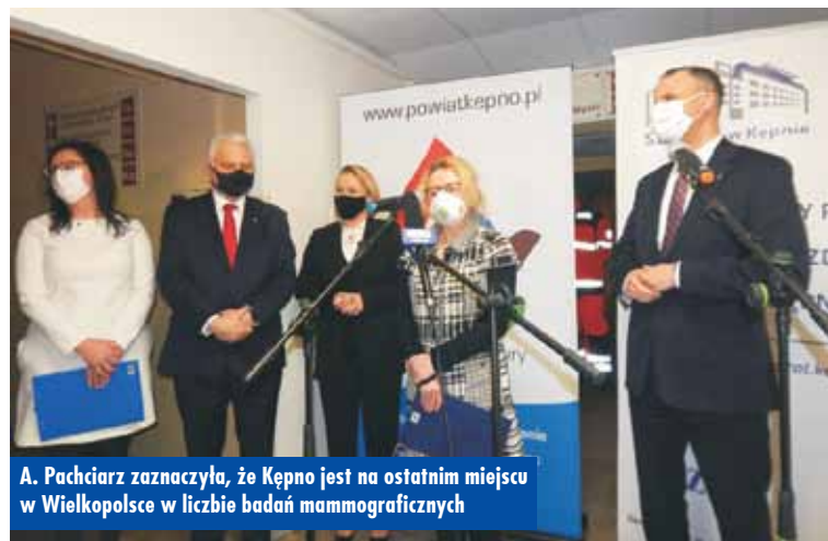
A. Pachciarz zaznaczyła, że Kępno jest na ostatnim miejscu w Wielkopolsce w liczbie badań mammograficznych

Aparat kolumnowy kostno-płucny z funkcją Auto-Tracking to niezwykle użyteczne narzędzie diagnostyczne w pomocy pacjentom