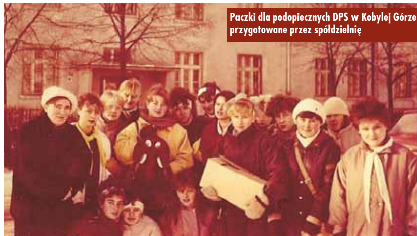
Paczki dla podopiecznych DPS w Kobylej Górze przygotowane przez spółdzielnię

Światowe obchody Dnia Poezji z Cyprianem Kamilem Norwidem