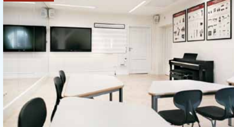
... sala rytmiki

ki działowe wykonane z podwójnego materiału i wełny izolacyjnej.