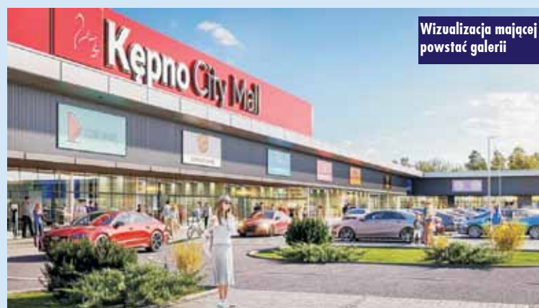
Wizualizacja mającej powstać galerii