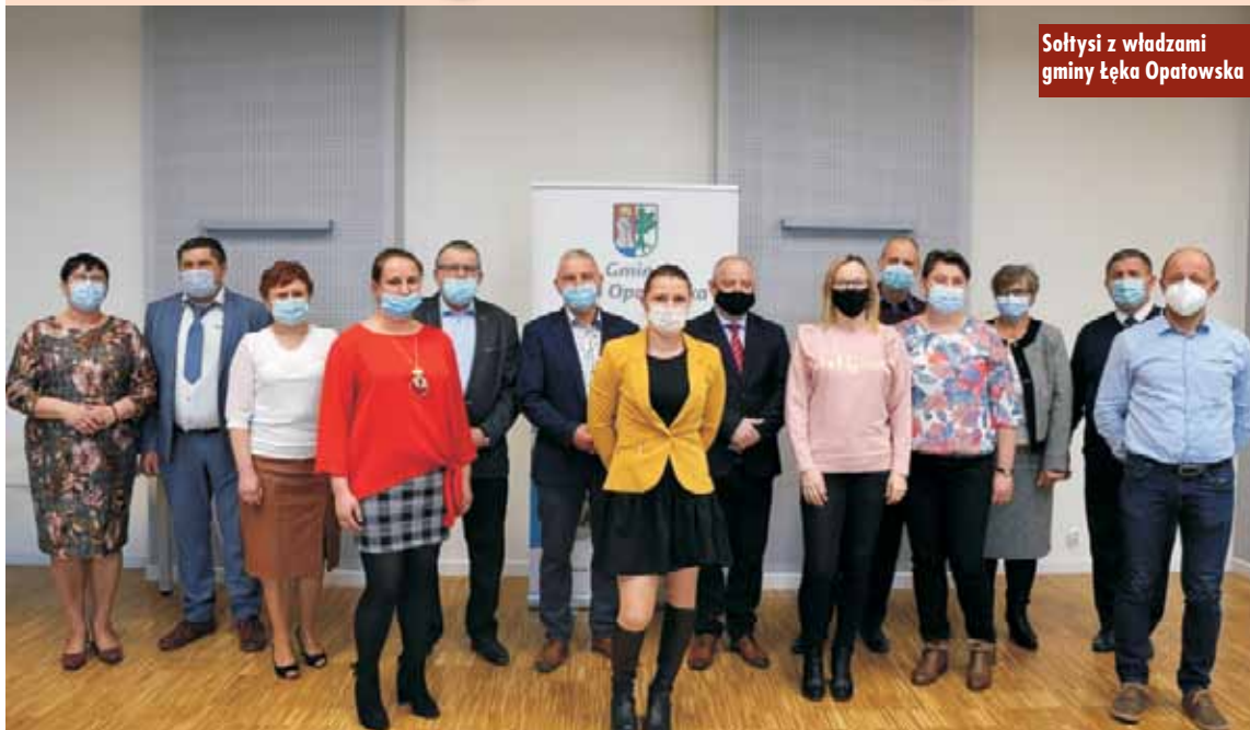
Sołtysi z władzami gminy Łęka Opatowska