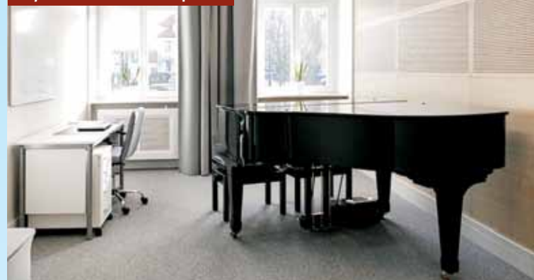
Wyremontowana klasa fortepianu...

zostało całkowicie przebudowane i docieplone, a nieużytkowa dotąd jego część zaadaptowana na sale lekcyjne. W toaletach na parterze przeprowadzony został kapitalny remont wraz z wymianą białego montażu. W piwnicy wykonano ocieplenie wraz z izolacją fundamentów i podłóg. W całej szkole zamontowane zostały osłony na grzejniki, karnisze okienne i rolety tkaninowe. Szkoła została wyposażona w nowe meble kuchenne i zmywarkę pod zabudowę, dwa monitory wysuwany ekran z rzutnikiem, monitor interaktywny i kotary zaciemniające.