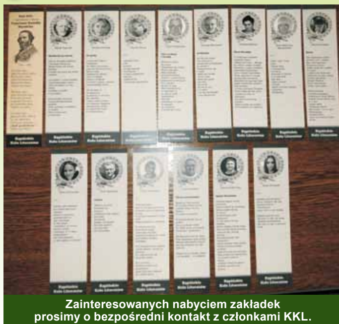
Zainteresowanych nabyciem zakładek prosimy o bezpośredni kontakt z członkami KKL.