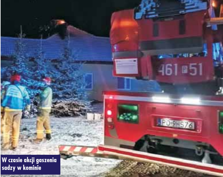
W czasie akcji gaszenia sadzy w kominie

19 marca br. około godziny 19:48 dyżurny SKKP w Kępnie otrzymał zgłoszenie o pożarze sadzy w przewodzie kominowym budynku mieszkalnego w Trębaczowie. Do zdarzenia zadysponowano zastępy z OSP Trębaczów, OSP Perzów oraz JRG Kępno.