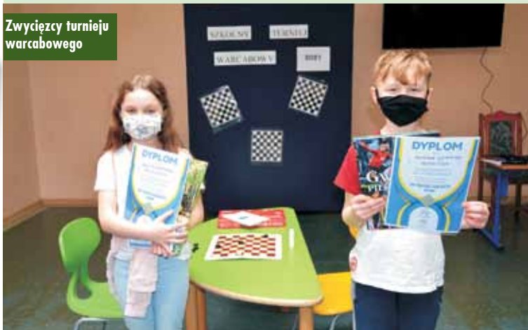
Zwycięzcy turnieju warcabowego

dale stoczyło 20 zawodników. Nikt nie pozostał niepokonany, co jeszcze bardziej świadczy o zaciętej walce w duchu fair-play. O kolejności gier decydował specjalny system komputerowy, co znakomicie usprawniło przebieg imprezy. Ta innowacja wprowadziła dodatkowe emocje, ponieważ do samego końca wynik rywalizacji był dla wszystkich wielką niewiadomą. Skomplikowany przelicznik okazał się jednak sprawiedliwy.