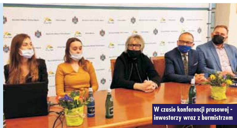
W czasie konferencji prasowej - inwestorzy wraz z burmistrzem

Na powierzchni 12,5 tys. m 2 będą punkty usługowe, automaty pocztowe i bankomaty, jak również wielkopowierzchniowy market Lidl. Już dziś zapowiedź otwarcia marketu tej firmy wzbudza duże zainteresowanie mieszkańców regionu. Inwestor jest bliski osiągnięcia porozumienia. - Rozmawiałem z osobami z Lidla i na 99% to ten market tutaj wejdzie - dodał inwestor. Planowany termin otwarcia galerii to 3 kwartał 2021 r. Największą część z 27 hektarów gruntów w tej okolicy z zasobów