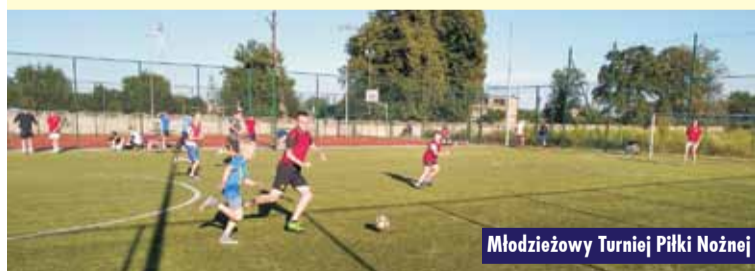
Młodzieżowy Turniej Piłki Nożnej

w tygodniu) treningi piłkarskie GKS Rychtal seniorów i junióra młodszego, treningi orlików z AP Czech (głównie dzieci z gminy) oraz zajęcia dla dzieci i młodzieży ze szkoły podstawowej w ramach SKS. W sobotnie popołudnia sympatycy piłki nożnej uczestniczyli w ligowych rozgrywkach lokalnego zespołu GKS. Swoje udział w usprawnianiu fizycznym miały również grupy niezrzeszone, trenujące systematycznie, głównie w poniedziałki, środy czwartki i piątki. Do tego dochodzą ćwiczenia na siłowni (była taka możliwość z ograniczeniami), spontaniczne gierki dzieci i młodzieży oraz częste przebywanie sporych grup na skate parku. - Pandemia koronawirusa spowodowała, że były tygodnie, w których obiekty sportowe były zamknięte dla użytkowników. Wiele inicjatyw udało się jednak zorganizować – podsumowuje P. Nasiadek. Animatorzy mają wiele kolejnych pomysłów i zapewne zrealizują je w najbliższym możliwym czasie. Oprac. KR