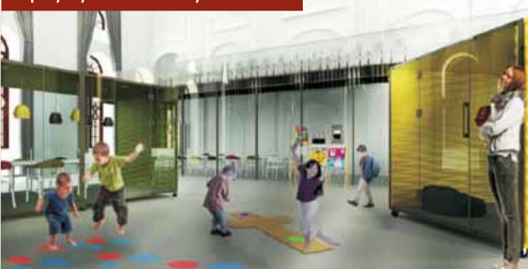
Widok na salę wielofunkcyjną zaaranżowaną salami terapeutycznymi w formie mobilnych boksów

6 kwietnia br. odbyło się kolejne posiedzenie Rady Muzeum im. T. P. Potworowskiego