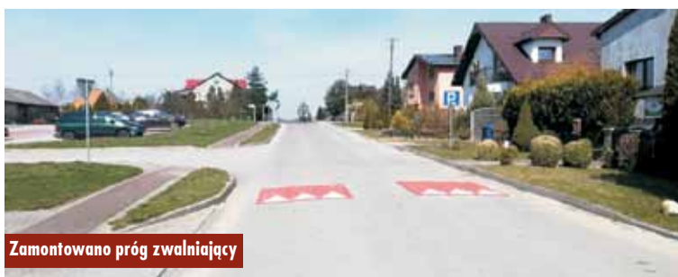
Zamontowano próg zwalniający