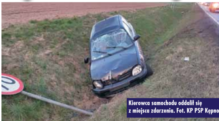
Kierowca samochodu oddalił się z miejsca zdarzenia.

10 kwietnia br., o godzinie 5.53, do Stanowiska Kierowania Komendanta