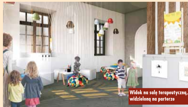
Widok na salę terapeutyczną, widzieloną na parterze

przewidziane są prace naprawcze i ratownicze zniszczonych fragmentów oraz badania archeologiczno-architektoniczne w obiekcie i jego bezpośrednim sąsiedztwie. Wyko-