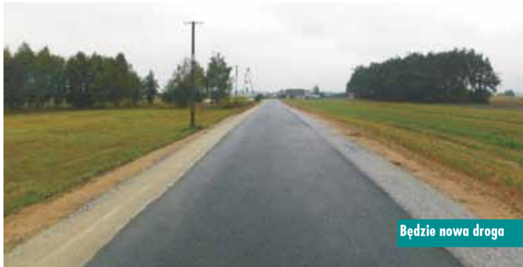
Będzie nowa droga

sokości 83 250 złotych z przeznaczeniem na budowę dróg dojazdowych do gruntów rolnych. Przekazane środki zostaną wykorzystane do realizacji tegorocznych inwestycji drogowych Gminy Trzcinita. Oprac. m