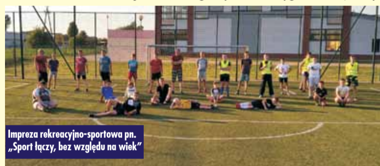
Impreza rekreacyjno-sportowa pn. „Sport łączy, bez względu na wiek”

25 i 26 lutego – XXI Igrzyska Dzieci Szkół Podstawowych Powiatu Kępińskiego w Piłce Koszykowej Chłopców i Dziewcząt; w kwietniu i maju zostały nakręcone filmy autorstwa gminnego koordynatora sportu z ćwiczeniami dla różnych grup wiekowych, począwszy od przedszkolaków, na seniorach kończąc, jeden z filmów dostępnych w sieci – „Test Ruffiera” – pokazał, w