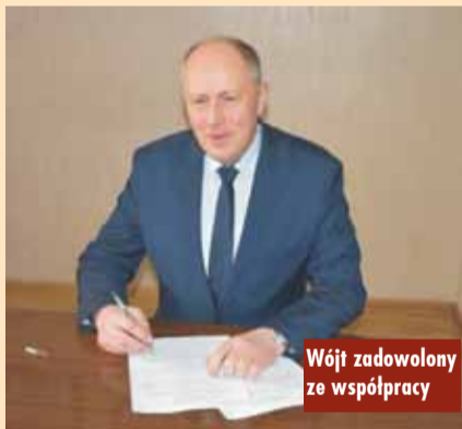
Wójt zadowolony ze współpracy

- To jest partnerstwo, którego motywem przewodnim jest próba przywrócenia rozwoju obszaru w oparciu o ciąg pieszo-rowerowy na śladzie byłej linii kolejowej nr 307. W tej chwili już też wiemy, że to nie tylko ścieżka pieszo-rowerowa po tym torowisku jest jakby zadaniem, które będzie inicjatywą