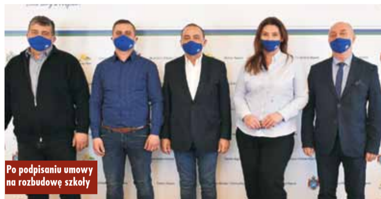
Po podpisaniu umowy na rozbudowę szkoły