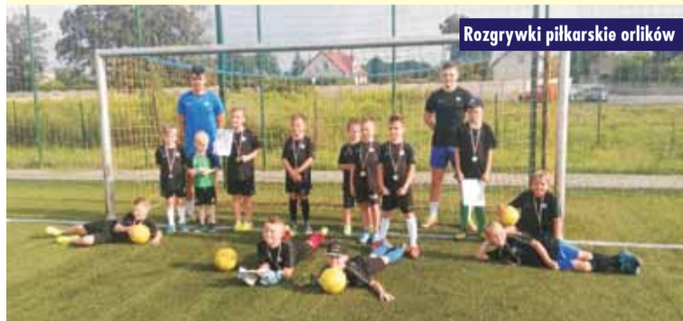
Rozgrywki piłkarskie orlików

Uprawianie sportów na rychtalskich obiektach sportowych wzbogacały także cotygodniowe (2 razy