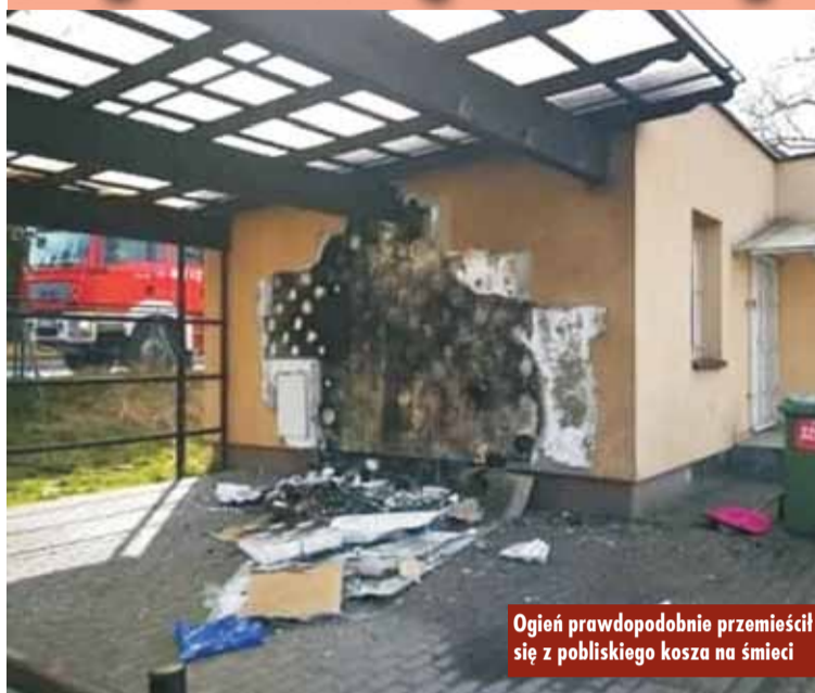
Ogień prawdopodobnie przemieścił się z pobliskiego kosza na śmieci

9 kwietnia br., po godzinie 15.00, Spółka „Projekt Kępno” została powiadomiona przez straż pożarną o akcji, która miała miejsce na należących do spółki obiektach. Do aktów wandalizmu doszło na „Orliku” przy ul. Nowowiejskiego w Kępnie. - To nie pierwszy i nie drugi incydent niszczenia naszego wspólnego mienia! Nigdy, ale to nigdy nie będziemy mogli cieszyć się w pełni obiektami, jeśli ciągle będziemy zmuszeni naprawiać zniszczenia. Gdzie sens? Wszyscy za to płacimy – czytamy na Facebookowym profilu Gminy Kępno. Jak podkreślają autorzy postu,