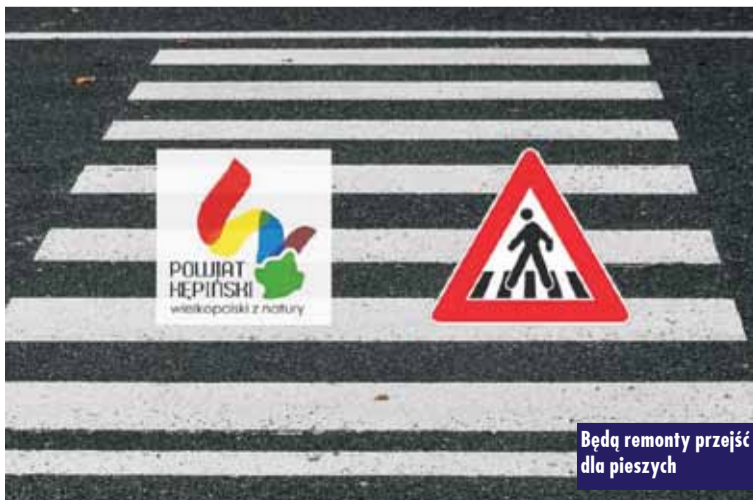
Będą remonty przejść dla pieszych

Rozstrzygnięto konkurs pt. „Wielkanoc w ekologię przystrojona”, zorganizowany przez Samorządową Bibliotekę Publiczną im. Marii z Fredrów hr. Szembekowej w Kępnie – Filię w Olszowie