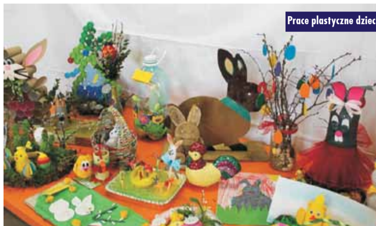
Prace plastyczne dzieci

nych oraz zdobycie umiejętności wtórnego wykorzystania odpadów jako tworzywa artystycznego.