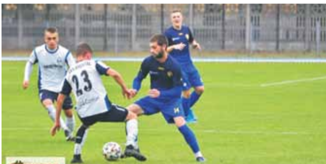
Piłkarze z niższych lig i klas rozgrywkowych najprawdopodobniej w następnym weekend (24-25 kwietnia) powrócą na ligowe boiska

momencie całemu środowisku piłkarskiemu, bez dalszego rozdzielania na zawodowców, stypendystów,