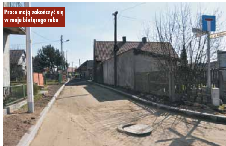
Prace mają zakończyć się w maju bieżącego roku

Dodatkowo nawierzchnia odcinka drogi równoległego do ul. Polnej o długości 42 m zostanie wykonana z kamienia polnego ze względu na swój zabytkowy charakter. Planuje się, że inwestycja zostanie oddana do użytku już w maju bieżącego roku. Oprac. KR