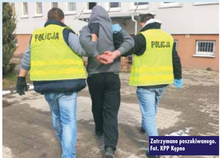
Zatrzymano poszukiwanego.

osadzony w pomieszczeniu dla osób zatrzymanych. Sąd Rejonowy w Kępnie Wydział do Spraw Nieletnich zajmie się postępowaniem w sprawie 14-latka. Oprac. m