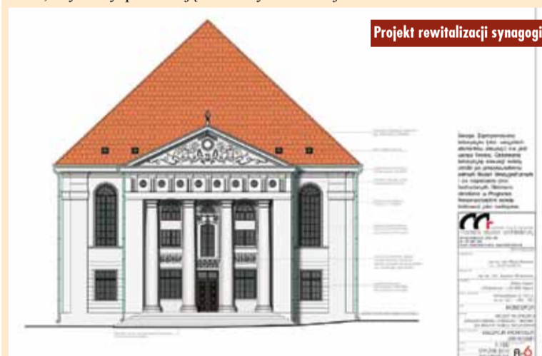
Projekt rewitalizacji synagogi

prowadzonych zajęć edukacyjnych, terapeutycznych i kulturalnych.