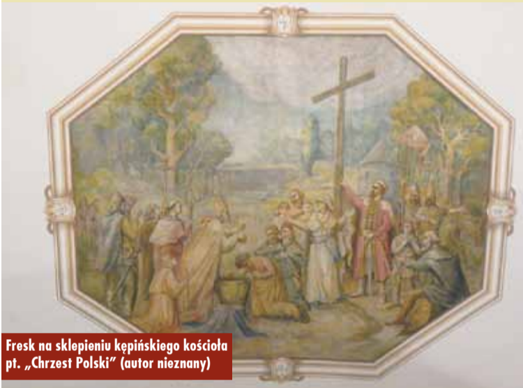
Fresk na sklepieniu kępińskiego kościoła p.t. „Chrzest Polski” (autor nieznan)

Starostwo złożyło wnioski do Wielkopolskiego Urzędu Wojewódzkiego na przebudowę przejść dla pieszych