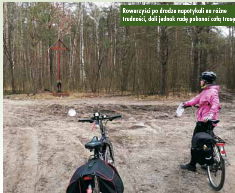
Rowerzyści po drodze napotykali na różne trudności, dali jednak radę pokonać całą trasę