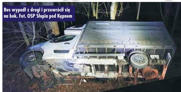
Bus wypadł z drogi i przewrócił się na bok.

W środę, 31 marca br., o godzinie 2.17, dyżurny Stanowiska Kierowania Komendanta Powiatowego Państwowej Straży Pożarnej w Kępnie otrzymał zgłoszenie o zdarzeniu drogowym w Słupi pod Kępnem. Do zdarzenia zadysponowano zastępy z Jednostki Ratowniczo-Gaśniczej w Kępnie i OSP Słupia pod Kępnem.