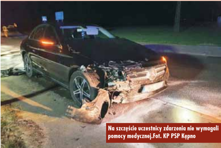
Na szczęście uczestnicy zdarzenia nie wymagali pomocy medycznej.

7 kwietnia br., tuż po godzinie 21.00, dyżurny Stanowiska Kierowania Komendanta Powiatowego Państwowej Straży Pożarnej w Kępnie