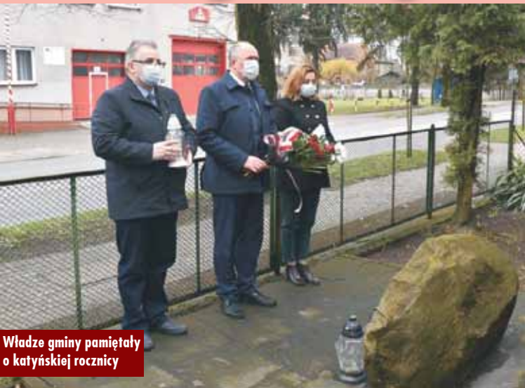
Władze gminy pamiętają o katyńskiej rocznicy

By oddać hołd pomordowanym Sejm Rzeczypospolitej Polskiej, 14 listopada 2007 roku, uchwalił poprzez aklamację Dzień Pamięci Ofiar Zbrodni Katyńskiej, który obchodzony jest 13 kwietnia.