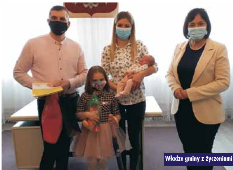
Władze gminy z życzeniami