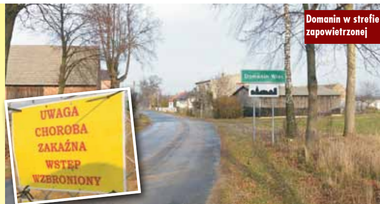
Domanin w strefie zapowietrzanej

tów ostrowskiego i ostrzeszowskiego. Powiatowy Lekarz Weterynarii w Ostrowie zdecydował o utylizacji prawie 5.5 tysiąca ptaków w gospodarstwie w Masanowie. Jest podej-