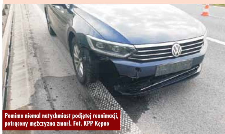
Pomimo niemal natychmiast podjętej reanimacji, potrącony mężczyzna zmarł.