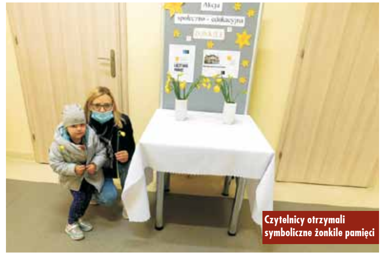
Czytelnicy otrzymali symboliczne żonkile pamięci