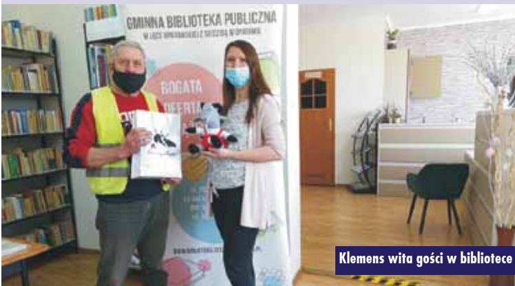
Klemens wita gości w bibliotece

skiej z siedzibą w Opatowie dotarł koziołek Klemens, maskotka z Wieruszowa. Klemens podróżuje pocztą po polskich bibliotekach w ramach akcji „Biblioteczne Podróże Koziołka Klemensa” wymyślonej i zorganizowanej przez Miejsko-Gminną Bibliotekę Publiczną im. W. S. Reymonta w Wieruszowie. Przystanek w Opatowie, to jedno z kilkunastu wyjątkowych miejsc na mapie Polski, do których zawita Klemens wraz ze swoją księgą pamiątkową, gdzie z pomocą bibliotekarzy opisuje swoje podróże.