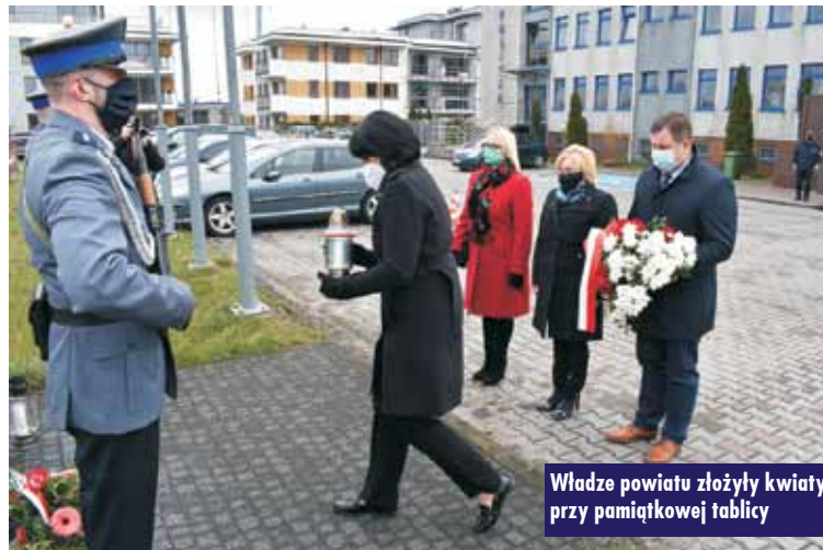
Władze powiatu złożyły kwiaty przy pamiątkowej tablicy

Miejsce ukrycia zwłok ponad 6 tysięcy polskich policjantów było nieznane do wiosny 1990 r. Przeprowadzone w latach 1994–1995