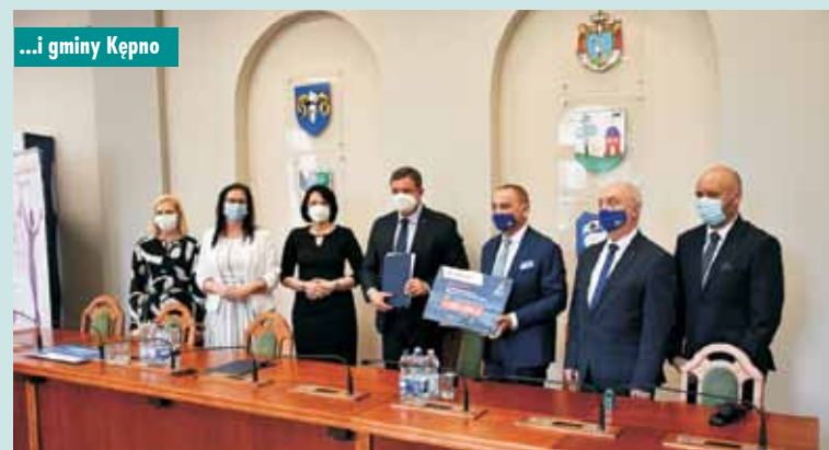
...i gminy Kępno

Po milionie złotych przekazała Gmina Kępno, Baranów, Perzów, Rychtal, Łęka Opatowska a po 300 tysięcy Gmina Trzcina i Gmina