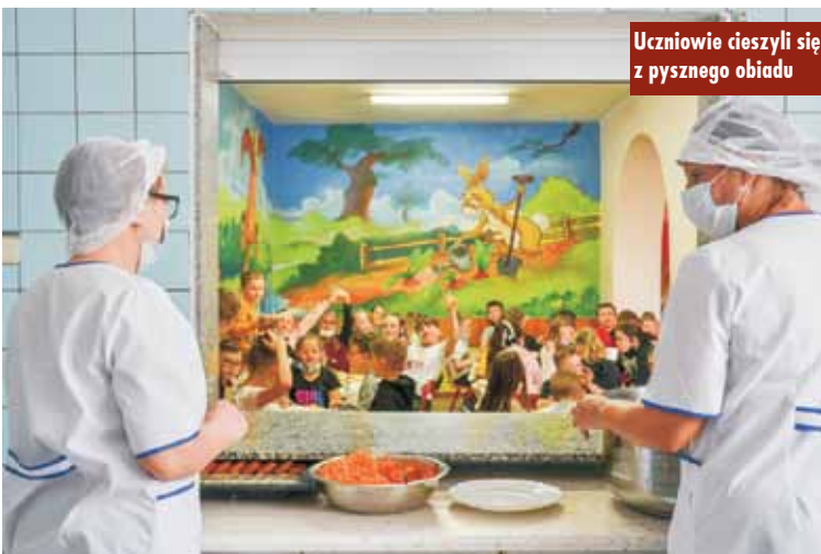
Uczniowie cieszyli się z pysznego obiadu

W poniedziałek, 17 maja br., nastąpił odbiór techniczny kolejnej ważnej inwestycji infrastrukturalnej. W Donaborowie oddano do użytku nową sieć wodociagową i kanalizacyjną