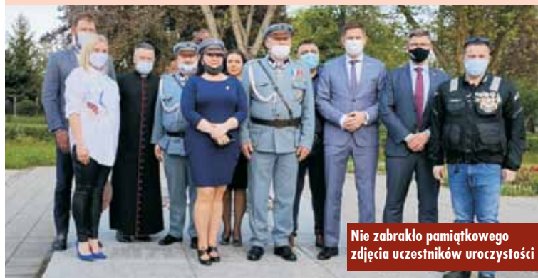
Nie zabrakło pamiątkowego zdjęcia uczestników uroczystości