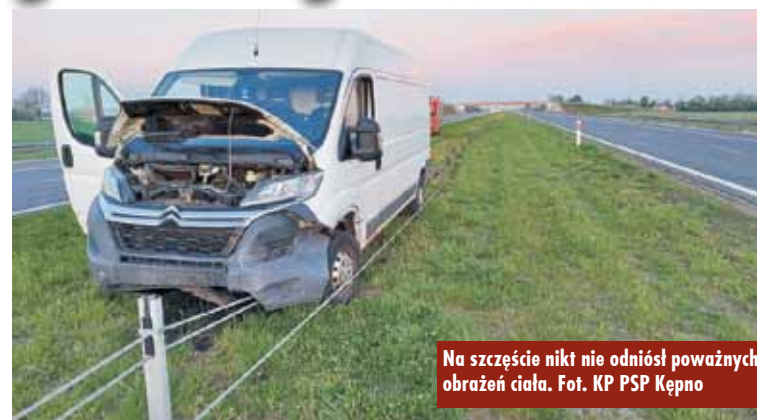
Na szczęście nikt nie odniósł poważnych obrażeń ciała.

12 maja br., przed godziną 5.00, na drodze S8 na wysokości miejscowości Osiny bus uderzył w liny oddzielające pasy jezdni. Na szczęście nie było osób poszkodowanych. - Działania strażaków polegały na zabezpieczeniu miejsca zdarzenia, ograniczeniu wycieków płynów eksploatacyjnych oraz odłączeniu źródła zasilania – mówi mł. kpt. Jakub Sobczak z Komendy Powiatowej Państwowej Straży Pożarnej w Kępnie. W działaniach trwających ponad godzinę udział brały 2 zastępy straży pożarnej. Oprac. KR