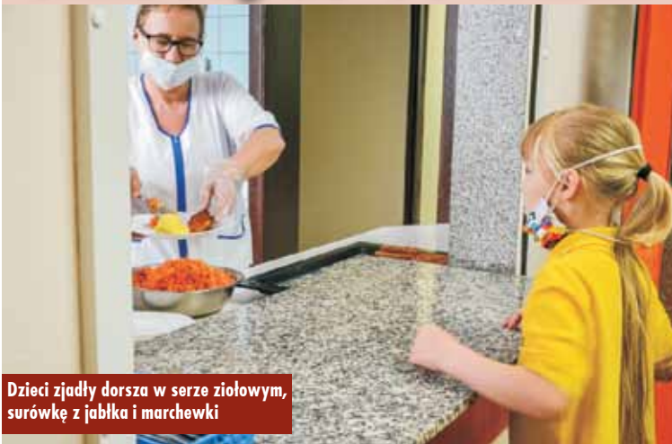
Dzieci zjadły dorsza w serze ziołowym, surówkę z jabłka i marchewki