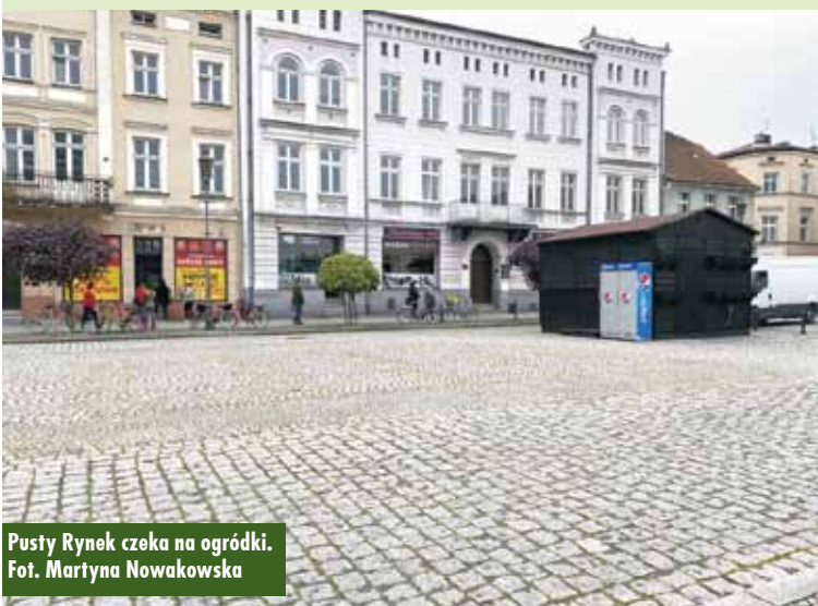
Pusty Rynek czeka na ogródki.

Co zatem jest przyczyną, że kępińskie ogródki gastronomiczne jeszcze się nie otworzyły? Jak twierdzi „po-