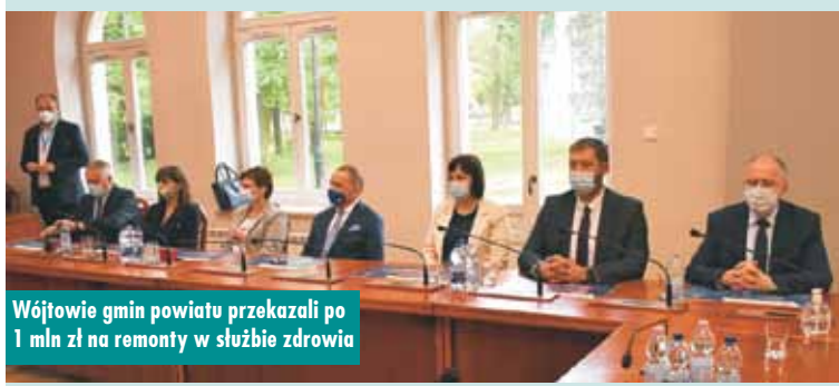
Wóldowie gmin powiatu przekazali po 1 mln zł na remonty w służbie zdrowia

zdobyciu środków na tutejsze inwestycje zdrowotne. Nowoczesny i profesjonalny szpital to dziś nie tylko inwestycje w infrastrukturę i sprzęt, ale również dostępność, jakość i efektywność leczenia. To profesjonalna opieka i zaangażowanie walego personelu szpitala. To empatia dla każdego pacjenta przekraczającego progi szpitala i każdej placówki medycznej. Jestem przekonana, że gdy zostanie przyjęty przez parlament program „Polski Łód” to takich inwestycji nie tylko w służbę zdrowia, ale również w infrastrukturę drogową i kolejową, kulturę będzie jeszcze więcej – zaznaczyła poseł A. Możdżanowska. Oprac. m