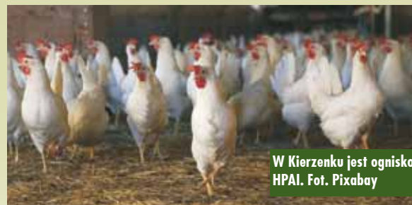
W Kierzenu jest ognisko HPAI.

zasad bioasekuracji podczas obsługi drobiu oraz spełnianie wymogów