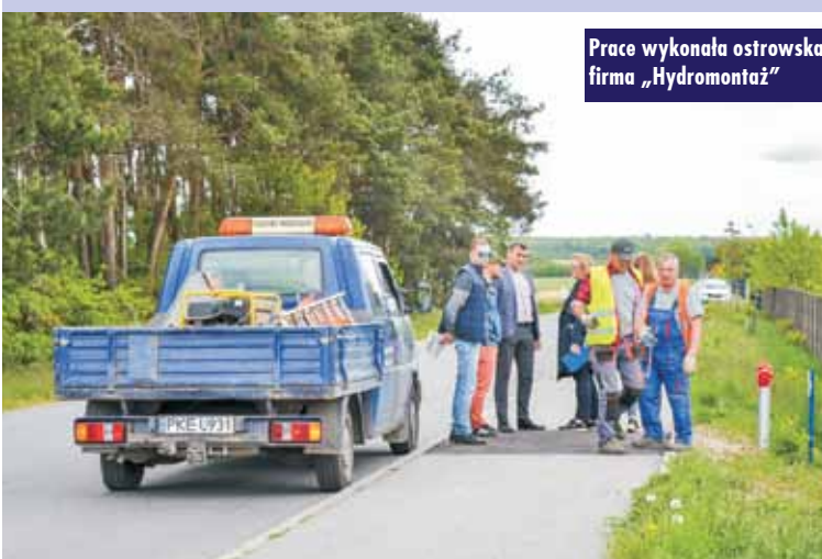
Prace wykonała ostrowska firma „Hydromontaż”