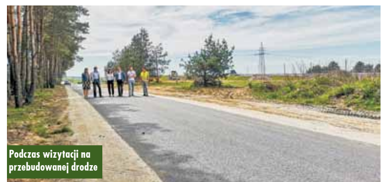
Podczas wizytacji na przebudowanej drodze