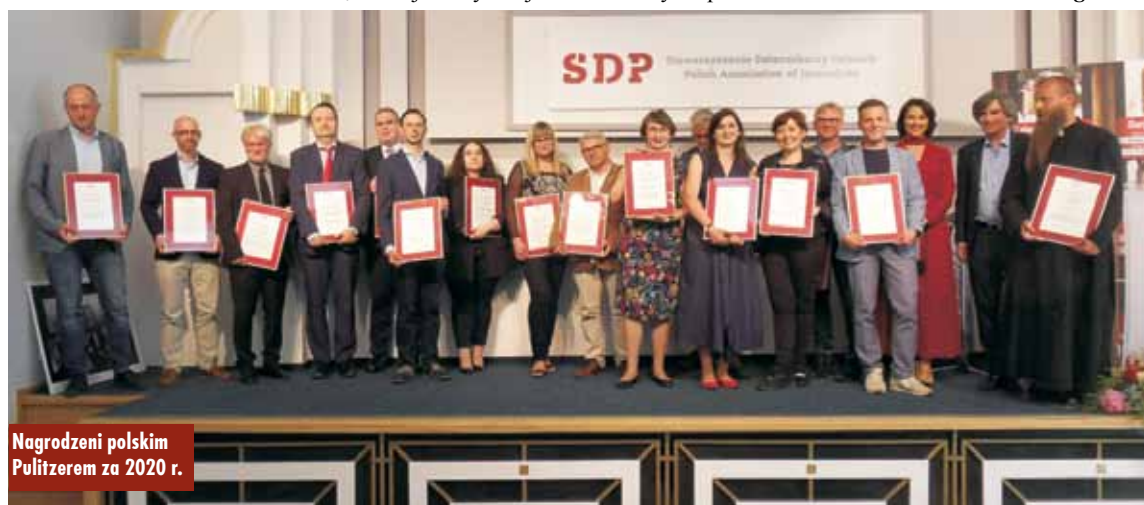
Nagrodzeni polskim Pulitzerem za 2020 r.

Rozdanie nagród w Domu Dziennikarza przy ul. Foksal w Warszawie było transmitowane „na żywo” i można zobaczyć je na stronie sdp.pl/gala28 . Gala zakończyła się poczęstunkiem, na który zaproszono tym razem jedynie laureatów nagród i honorowych gości. Eugeniusz Bendziński