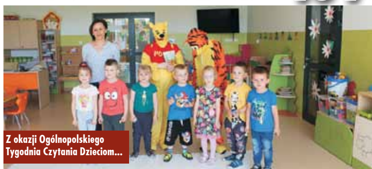
Z okazji Ogólnopolskiego Tygodnia Czytania Dzieciom...

Ogólnopolski Tydzień Czytania Dzieciom to coroczna akcja przeprowadzana na przełomie maja i czerwca przez Fundację „ABCXXI – Cała Polska czyta dzieciom”. Misją akcji jest promocja czytelnictwa wśród najmłodszych oraz wspieranie prawidłowego rozwoju emocjonalnego i psychicznego dzieci. Tegoroczne „okrągłe”, jubileuszowe święto czytania Biblioteka Publiczna w Bralinie zorganizowała w Przedszkolu