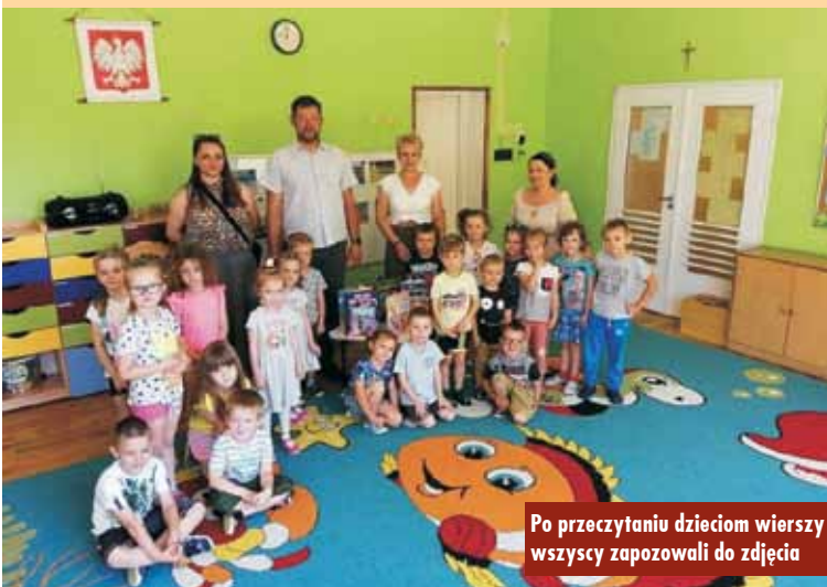
Po przeczytaniu dzieciom wierszy wszyscy zapozowali do zdjęcia