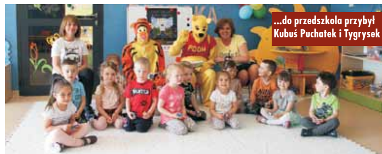
...do przedszkola przybył Kubuś Puchatek i Tygrysek