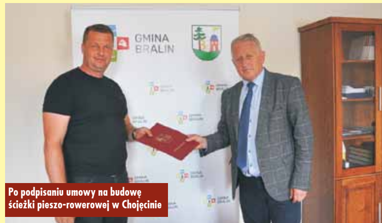
Po podpisaniu umowy na budowę ścieżki pieszo-rowerowej w Chojęcinie

i opraw oświetleniowych LED. Powierzchnie utwardzone łącznie wyniosą 2.875,44 m 2 . - Realizacja projektu wpłynie pozytywnie na stan