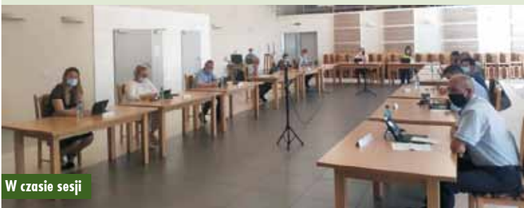
W czasie sesji

porcie na składowisko, rozładunku i unieszkodliwieniu lub utylizacji odpadów zgodnie z obowiązującymi przepisami. Powyższe usługi mogą zostać sfinansowane przez Gminę w wysokości 80% jej wartości, jednak w kwocie nie wyższej niż 3000 zł. Wnioski w tej sprawie można składać do 31 sierpnia 2021 r.