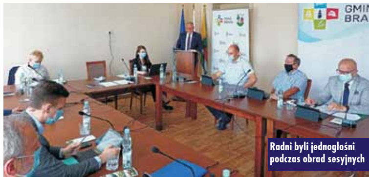
Radni byli jednogłośnie podczas obrad sesyjnych

Wójt gminy Bralin podpisał umowę na realizację inwestycji pn. „Budowa ścieżki pieszo-rowerowej w Chojęcinie, gmina Bralin”