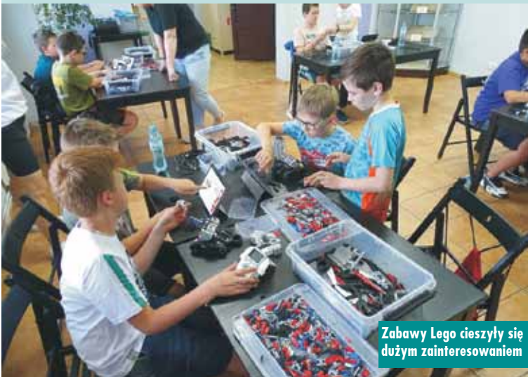
Zabawy Lego cieszyły się dużym zainteresowaniem

artystyczne dla dzieci i młodzieży z elementami biblioterapii”. Warsztaty z robotyki i programowania zorganizowano w dwóch grupach tematycznych: LEGO WeDo dla dzieci młodszych 5-8 lat i LEGO Mindstorms dla starszych dzieci i młodzieży w wieku 9-14 lat. Projekt został dofinansowany z programu „Partnerstwo dla książki” ze środków finansowych Ministra Kultury, Dziedzictwa Na-