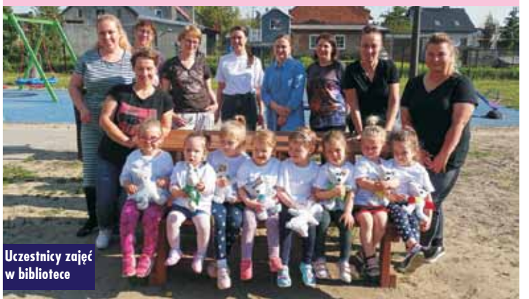
Uczestnicy zajęć w bibliotece