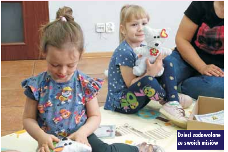
Dzieci zadowolone ze swoich misiów

do których zawsze można się przytulić i zwierzyć do uszka. A, że przyjaciół nigdy nie za wiele, każdy mały uczestnik podczas zajęć zyskał nowego, pluszowego kolegę, którego sam stworzył, ubrał i ozdobił. Po aktywnie spędzonym czasie nadszedł moment relaksu przy dziecięcych masażkach do wiersza „Tu płynie rzeczka” oraz