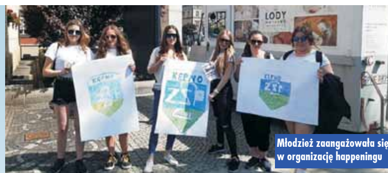
Młodzież zaangażowała się w organizację happeningu