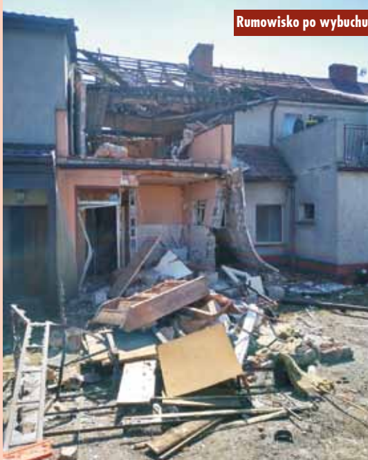
Rumowisko po wybuchu

czym dokonano przeszukania metodą nawoływania i nasłuchiwanie. - Ratownicy sprawdzili sąsiednie lokale, w których nie stwierdzono osób poszkodowanych. W wyniku rozpoznania ustalono liczbę osób przebywających w chwili zdarzenia w budynku i potwierdzono, że wszystkie opuściły