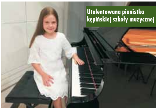
Utalentowana pianistka kępińskiej szkoły muzycznej