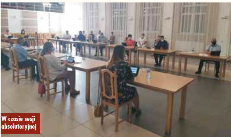
W czasie sesji absolutoryjnej

Drodzy Czytelnicy, „Tygodnik Kępiński” można znaleźć także w internecie. Serdecznie zapraszamy na stronę www.tygodnikkepinski.pl oraz na Facebook pod adres www.facebook.com/tygodnikkepinski