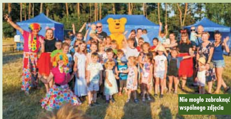
Nie mogło zabraknąć wspólnego zdjęcia

dziadków. Napisałyśmy „z łatwością”, a przecież dobrze wiemy, jak trudno oderwać smakosza od grilla, a piwośza od kega. Nam najbardziej utkwił w pamięci fascynujący spektakl z migoczącymi w zachodzącym słońcu mydlanymi bańkami. A przecież były