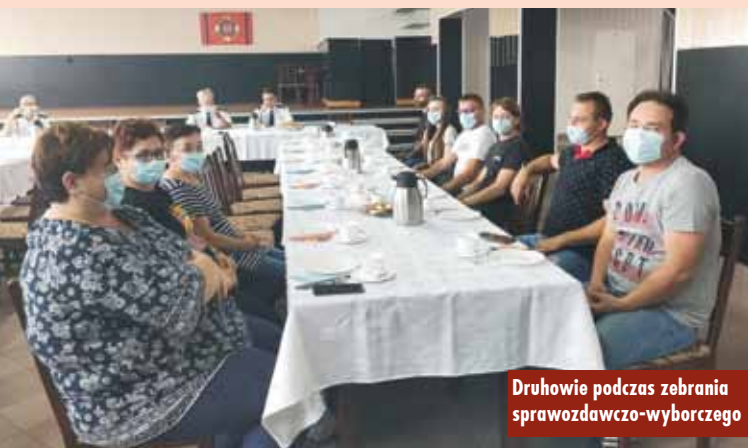
Druhowie podczas zebrania sprawozdawczo-wyborczego