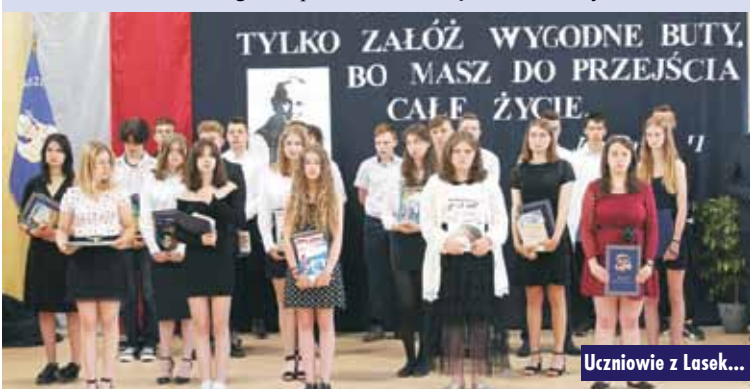
Uczniowie z Lasek...

W roku szkolnym 2020/2021 do Publicznego Przedszkola Samorządowego w Laskach uczęszczało 75 dzieci. Z tej grupy 1 września 2021 r. naukę w klasie pierwszej szkoły podstawowej rozpocznie 19 dzieci.