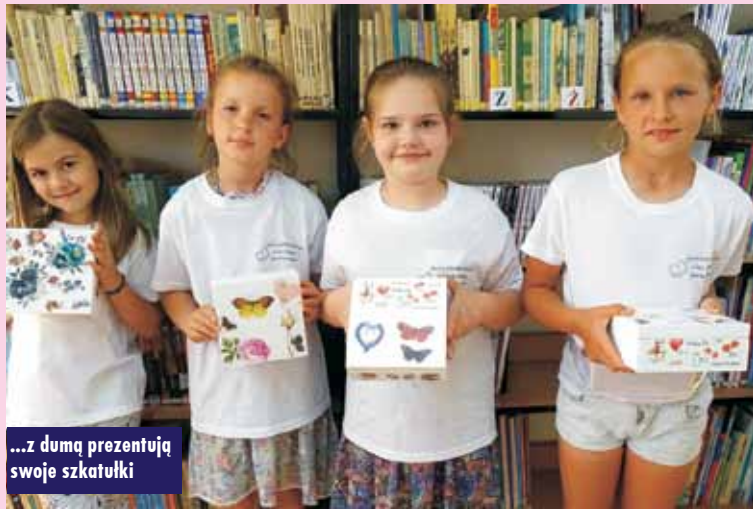
...z dumą prezentują swoje szkatułki

Dzieci bardzo chętnie wzięły udział w zajęciach i przystąpiły do pracy wykonując zdobienia na drewnianym pudełku metodą decoupage.