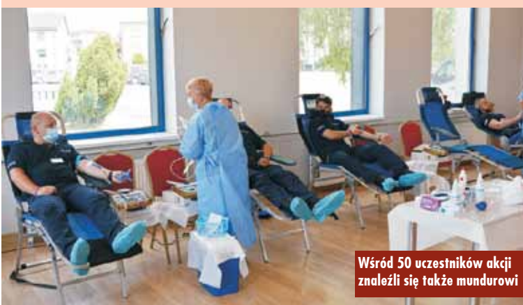
Wśród 50 uczestników akcji znaleźli się także mundurowi

oddać życiodajny płyn. Po przejściu dokładnych badań 6 osobom nie udało się uiszczyć na fotelu krwiodawcy. Pozostałe 50 osób wzięło udział w akcji. W sumie udało się pozyskać 22,5 litra krwi pełnej. Organizatorzy dziękują wszystkim za włączenie się do akcji. Oprac. KR