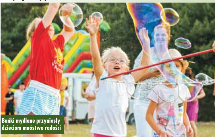
Bańki mydlane przyniosły dzieciom mnóstwo radości