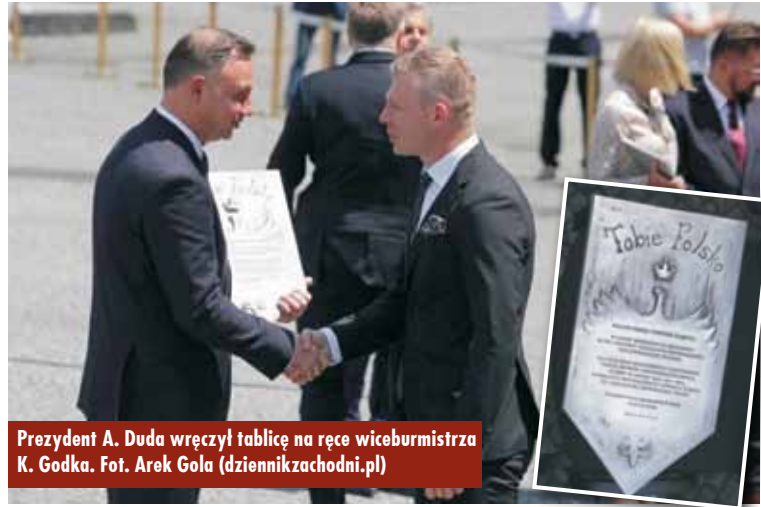
Prezydent A. Duda wręczył tablicę na ręce wiceburmistrza K. Godka.

zostało uhonorowane przez prezydenta RP Andrzeja Dudę pamiątkową tablicą Miejsca Pamięci Powstań Śląskich. Gminę Kępno reprezentował II zastępca burmistrza Krzysztof Godek . W uroczystościach udział wzięły władze województwa: śląskiego, opolskiego i wielkopolskiego, władze samorządowe, a także wojsko oraz służby mundurowe. Oprac. KR