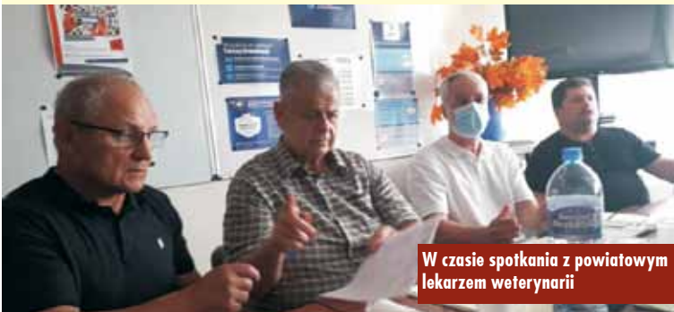
W czasie spotkania z powiatowym lekarzem weterynarii

lekarza weterynarii z instytucjami i przedstawicielami: hodowców, liderów AGRO UNII, wójta gminy Baranów, Starostwa Powiatowego, Wielkopolskiej Izby Rolniczej, Ośrodka Doradztwa Rolniczego w Kępnie.