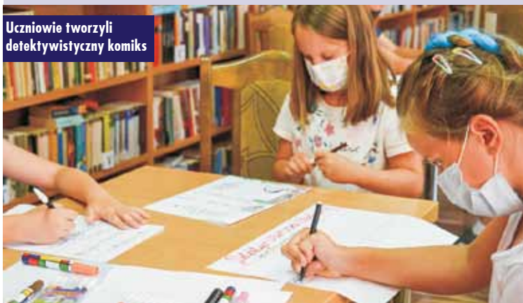
Uczniowie tworzyli detektywistyczny komiks

Warsztaty zostały zrealizowane w ramach zadania „Na tropie zagadek kryminalnych” z programu „Partnerstwo dla książki”, dofinansowanego ze środków Ministra Kultury, Dziedzictwa Narodowego i Sportu pochodzących z Funduszu Promocji Kultury. E. Lesiak