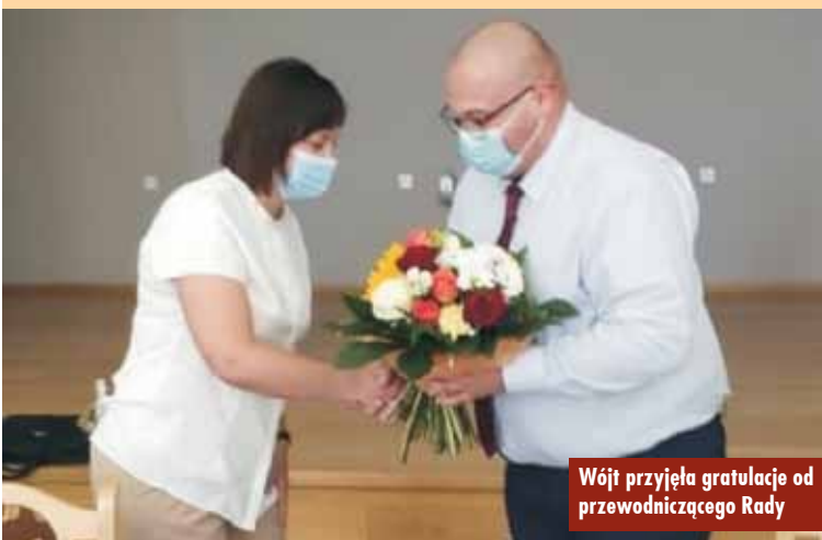
Wójt przyjął gratulacje od przewodniczącego Rady

81,88%. Na koniec roku planowano nadwyżkę w kwocie 2176694,51 zł, ostatecznie wykonanie budżetu zamknęło się nadwyżką w kwocie 7257507,18 zł, wynik finansowy wyniósł 9714091,61 zł.