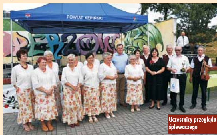
Uczestnicy przeglądu śpiewaczego

Działalność chórów i zespołów śpiewaczych od lat tworzy kulturalną wizytówkę naszego regionu. Dla