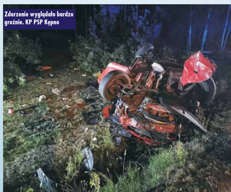
Zdarzenie wyglądało bardzo groźnie. KP PSP Kępno

wskazało około 1,5 promila alkoholu - mówił oficer prasowy KPP Kępno sierż. Rafał Stramowski . Kierowca dodatkowo nie posiadał uprawnień do kierowania pojazdami. Postępowanie w sprawie prowadzi KPP Kępno. KR