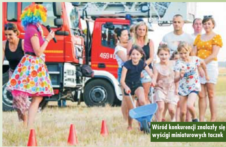
Wśród konkurencji znalazły się wyścigi miniaturowych taczek

Frekwencja wskazuje, że próba wyrwania się z pandemicznej pułapki była udana. Ludzie zagłosowali nogami za normalnością, za dobrą zabawą, za tak, wydawałoby się, prozaicznym sposobem spędzenia niedzieli, jak smakowita karkówka i wspólna zabawa „pod chmurką”. Nie byłoby jednak tego wszystkiego bez wysiłku organizatorów i wykonawców: pracowników Referatu Promocji oraz baranowskiej braci strażackiej. ems