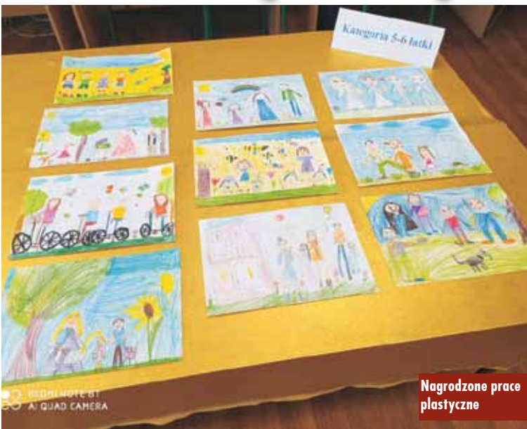
Nagrodzone prace plastyczne