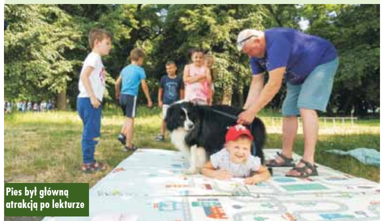
Pies był główną atrakcją po lekturze