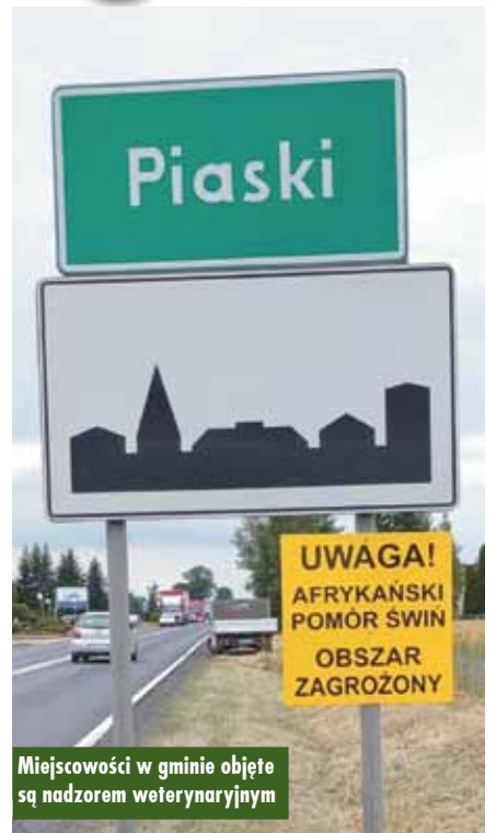
Miejscowości w gminie objęte są nadzorem weterynaryjnym

Afrykański pomór świń jest zakaźną chorobą wirusową dotyczącą świń utrzymywane i dzikie i może mieć poważny wpływ na odnośną populację zwierząt i rentowność hodowli, powodując zakłócenia w przemieszczaniu przesyłek tych zwierząt i pozyskanych od nich lub z nich produktów w Unii oraz w wywozie do państw trzecich.