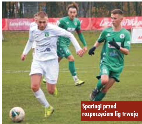
Sparringi przed rozpoczęciem lig trwają

trzech pełnych sezonów lub przez 36. kolejnych miesięcy pomiędzy 12. rokiem życia (lub rozpoczęciem sezonu, podczas którego zawodnik kończył 12. rok życia) i 21. rokiem życia (lub końcem sezonu, podczas którego zawodnik kończył 21. rok życia). Z kolei według regulaminu Pro Junior System w czwartej lidze, za juniora uważany jest każdy zawodnik, który posiada obywatelstwo polskie oraz w roku kalendarzowym, wieńczącym sezon rozgrywkowy kończy 19 rok życia lub