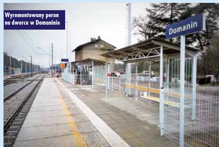
Wyremontowany peron na dworcu w Domaninie

średki unijne i budżetowe, by zwiększyć dostępność do pociągów dla wszystkich podróżnych, w tym osób