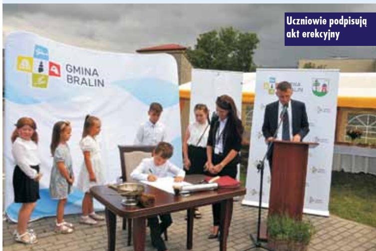
Uczniowie podpisują akt erekcyjny

Gmina Bralin uzyskała dofinansowanie do budowy hali sportowej w Bralinie!