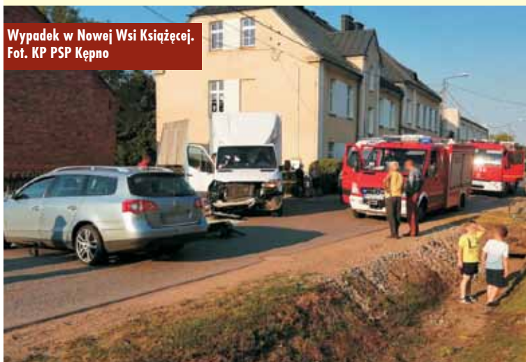
Wypadek w Nowej Wsi Książęcej.

22 lipca br. w Bralinie, w ramach akcji wakacyjnej Lato 2021, odbyło się przedstawienie teatralne dla dzieci pt.: „Pinokio”