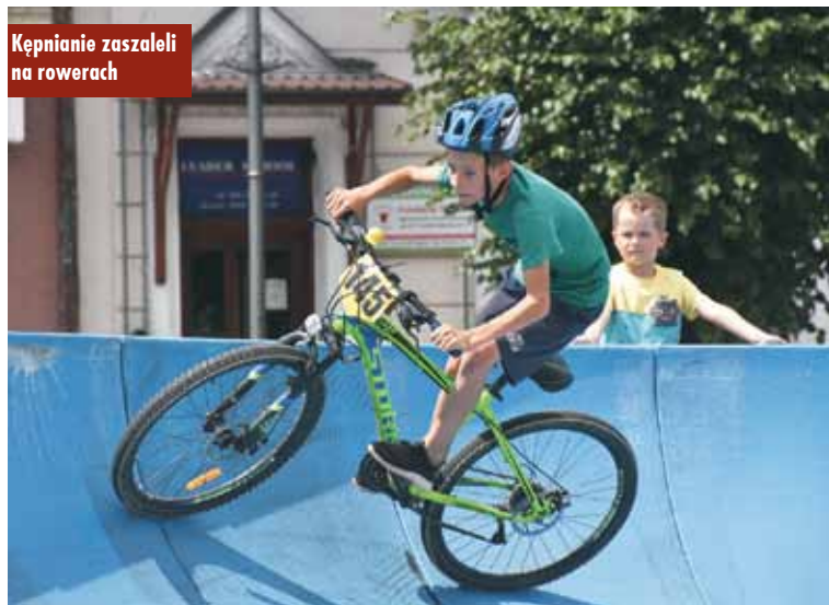
Kępnianie zaszaleli na rowerach

W niedzielę, 11 lipca br., na kępińskim Rynku odbyło się wydarzenie Fundacji Kult organizowane wspólnie z Gminą Kępno pt. „Kępno kocha rower”. Młodzi kępnianie licznie stawili się przy pumtracku, spragnieni rowerowej rywalizacji.