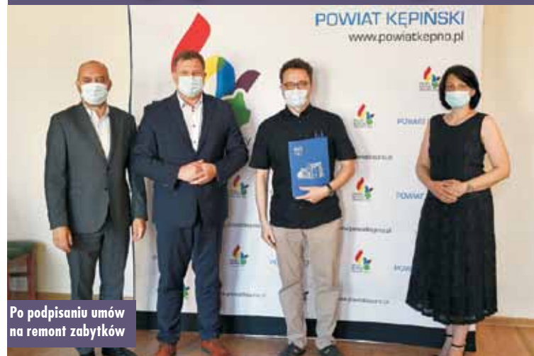
Po podpisaniu umów na remont zabytków

7 lipca 2021 roku w Starostwie Powiatowym w Kępnie podpisane zostały dwie umowy na dofinansowanie prac konserwatorskich prowadzonych przy obiektach zabytkowych wpisanych do rejestru zabytków lub znajdujących się w gminnych ewidencjach zabytków.