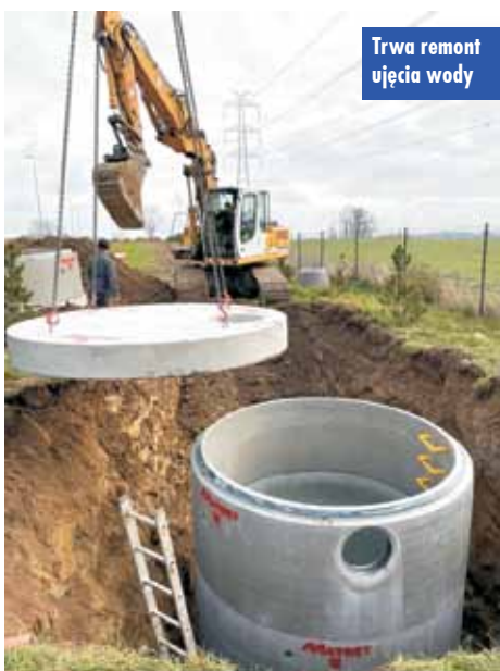
Trwa remont ujęcia wody

realizację zgłoszonych inwestycji, z czego najwyższa możliwa dotacja dla pojedynczego zadania to 50 tys. zł. Samorząd Województwa Wielkopolskiego, chcąc zwrócić uwagę lokalnych samorządów terytorialnych na ważny aspekt, jakim jest mała retencja, umożliwia im pozyskanie wsparcia na realizację rozmaitych zadań związanych z łagodzeniem skutków suszy oraz nawalnych opadów, które coraz częściej nawiedzają nasz re-