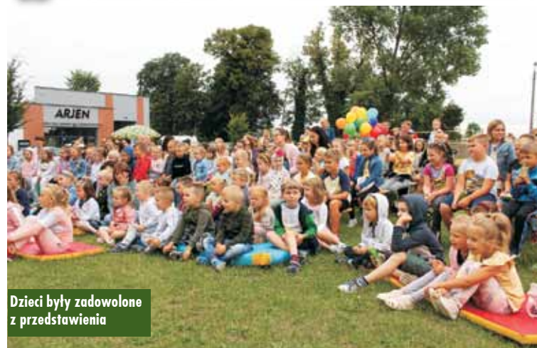
Dzieci były zadowolone z przedstawienia

Aktorzy z Teatru „Błaszany Bębenek” wystąpili z pełnym humorystycznych wątków spektaklem, który bardzo zainteresował małych słuchaczy. Dzieci z radością brały udział w zabawach interaktywnych proponowanych przez wykonawców. Nauczycy się, że kłamstwo ma „krótkie nogi”