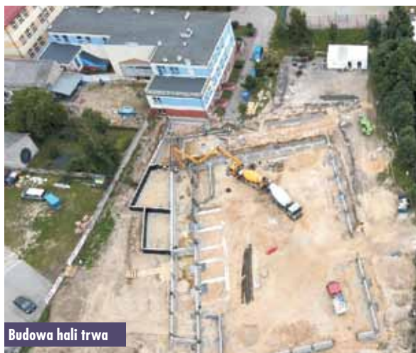
Budowa hali trwa