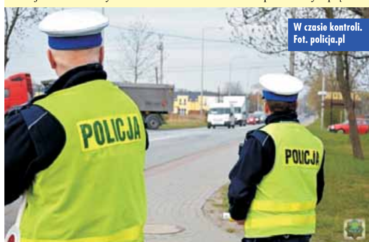
W czasie kontroli.

Drogowego zatrzymali do kontroli pojazd marki Ford, którego 21-letni kierowca przekroczył prędkość