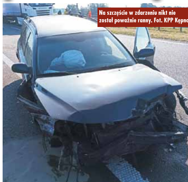
Na szczęście w zdarzeniu nikt nie został poważnie ranny.