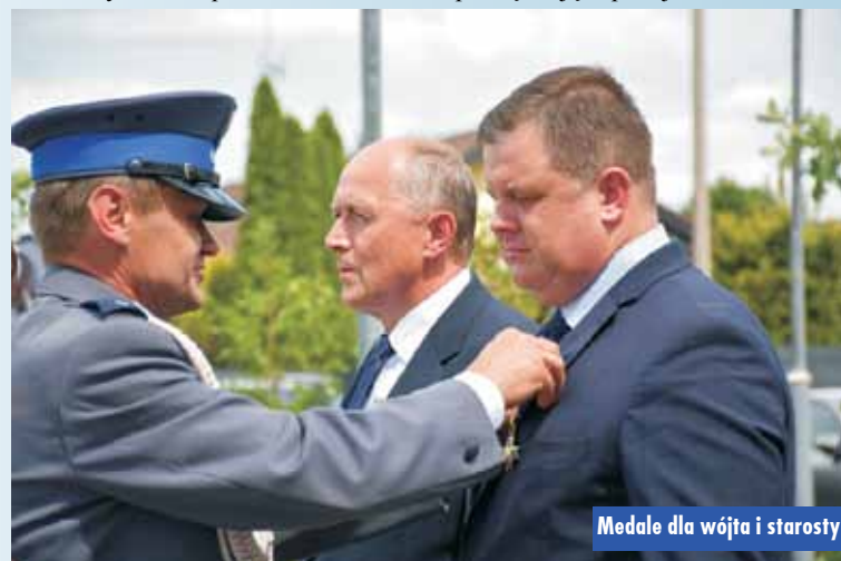
Medale dla wójta i starosty

Na zakończenie uroczystości złożono wiązanek pod pomnikiem upamiętniając policjantów Komen-