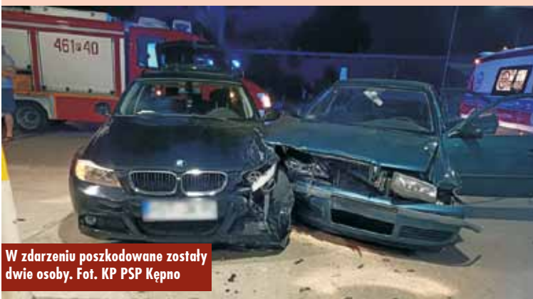
W zdarzeniu poszkodowane zostały dwie osoby.

W powiecie kępińskim od 10 czerwca nie stwierdzono żadnego nowego zakażenia koronawirusem, a od 1 czerwca odnotowano tylko jeden zgon spowodowany na COVID-19