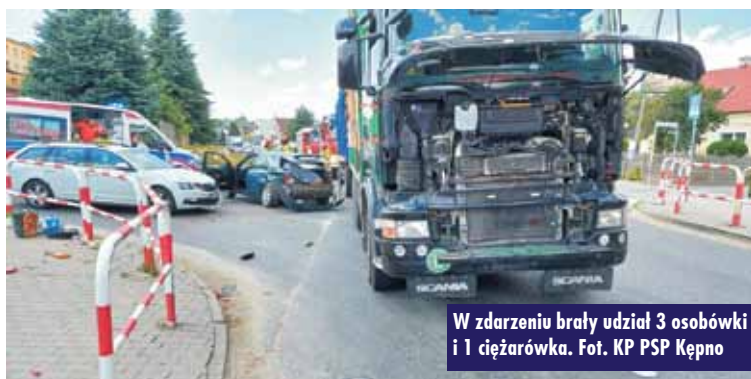
W zdarzeniu brały udział 3 osobówki i 1 ciężarówka.

zdarzeniu została ranna. Na miejsce udały się również 4 zastępy straży pożarnej. - Działania strażaków polegały na zabezpieczeniu miejsca zdarzenia oraz udzieleniu kwalifikowanej pierwszej pomocy uczestnikom zdarzenia do czasu przybycia Zespołu Ratownictwa Medycznego. Jednocześnie w uszkodzonych pojazdach odłączono źródło zasilania i ograniczono wyciek płynów eksploatacyjnych. W trakcie działań ruch na ul. Grabowskiej odbywał się wahadłowo - relacjonuje mł. kpt. Jakub Sobczak z Komendy Powiatowej Państwowej Straży Pożarnej w Kępnie. Oprac. KR