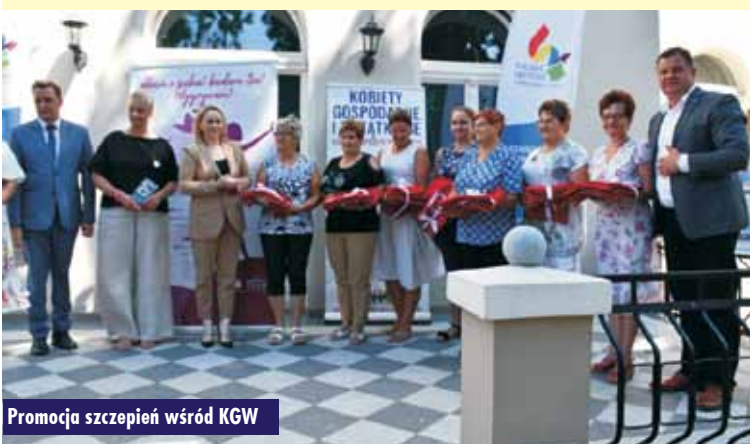
Promocja szczepień wśród KGW

Dodatkowo Koła Gospodyń Wiejskich otrzymają premię za każdą osobę zaszczepioną pierwszą dawką podczas wydarzenia w wysokości 15 zł (za zaszczepienie pierwszą dawką osoby w wieku poniżej 60. roku życia) i 30