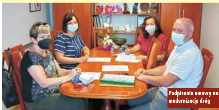
Podpisanie umowy na modernizację dróg

C. Modernizacja poprzez wykonanie nakładki bitumicznej drogi w m. Trębaczów dz. nr 655 – zakres prac obejmuje frezowanie nawierzchni bitumicznej na powierzchni około