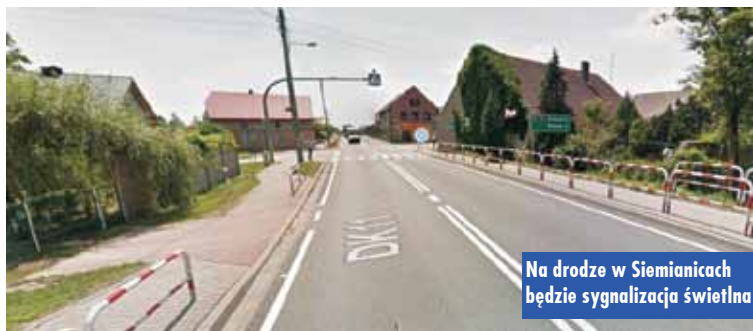
Na drodze w Siemianicach będzie sygnalizacja świetlna

Pierwsze spotkanie emerytów po wielu miesiącach