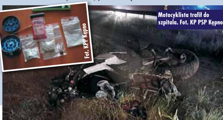
Motocyklista trafił do szpitala.