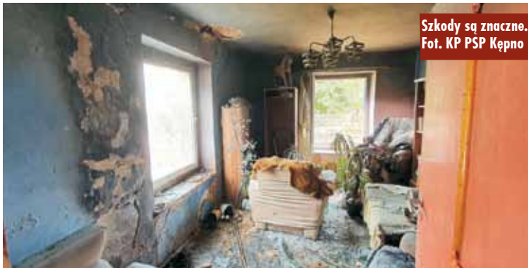
Szkody są znaczne.

udzielono kwalifikowanej pierwszej pomocy do czasu przyjazdu na miejsce zdarzenia Pogotowia Ratunkowego. Przybyły Zespół Ratownictwa Medycznego, po przebadaniu poszkodowanego, stwierdził brak konieczności jego hospitalizacji. Po kontroli pomieszczenia kamerą termowizyjną stwierdzono zarzewia ognia w stropie o konstrukcji