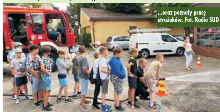
...oraz poznały pracę strażaków.

m.in. pływalni „Qarium”. Uczestnicy odwiedzili ważne instytucje kultury, kępińskie zabytki, a także poznały pracę strażaków i policjantów. Dzieci z radością uczestniczyły w organizowanych wydarzeniach i z pewnością wyniosą z nich wiele wspomnień, a także wiedzy i umiejętności.