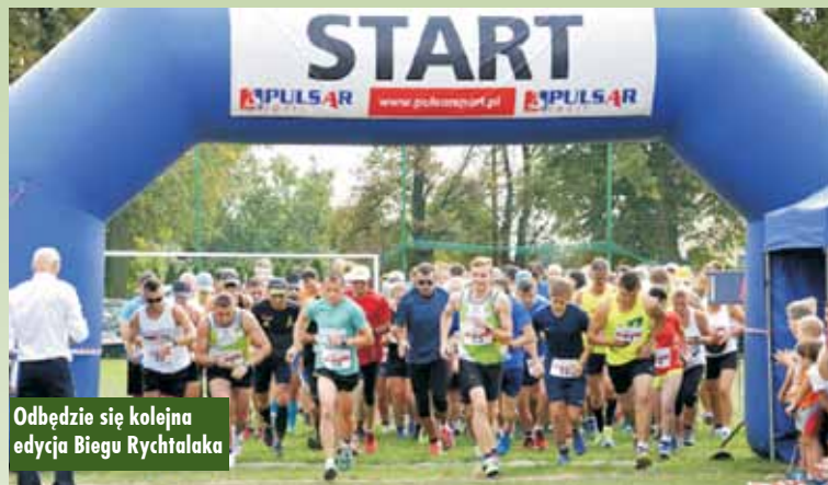
Odbędzie się kolejna edycja Biegu Rychtalaka

Początek o godzinie 16.30 na „Orliku” w Rychtalu. Do czynnego udziału