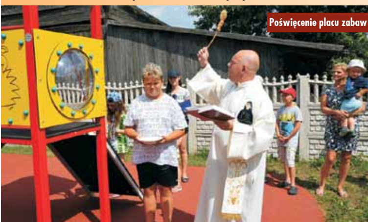
Poświęcenie placu zabaw

dzieci otrzymały kolorowe baloniki oraz słodycze. Spełniło się marzenie najmłodszych mieszkańców oraz lokalnej społeczności. Na otwarcie