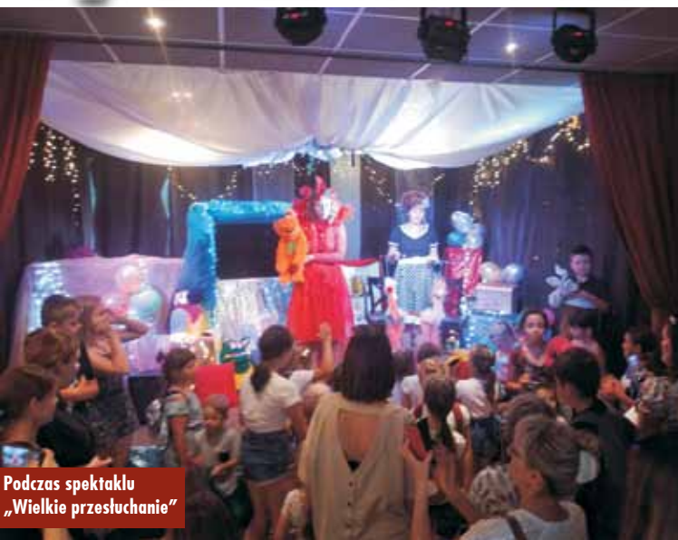
Podczas spektaklu „Wielkie przesłuchanie”

Aktywnie mijają wakacje z Kołem Gospodyń Wiejskich w Chojeńcinie. Koło realizuje trzy projekty.