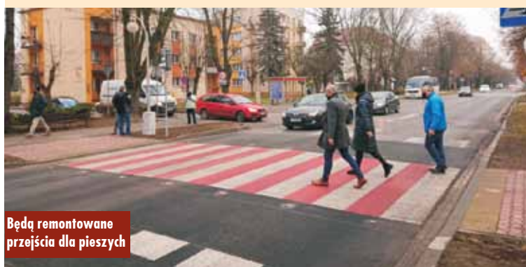
Będą remontowane przejścia dla pieszych

Ponadto Powiat Kępiński otrzymał dofinansowanie na przejścia dla pieszych przy ulicy Sikorskiego w