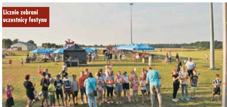
Licznie zebrani uczestnicy festynu

24 lipca 2021 rok przy Domu Ludowym w Wodzieźnie Rada Sołecka wraz z Kołem Gospodyń Wiejskich i Ochotniczą Strażą Pożarną zorganizowała spotkanie dla rodzin