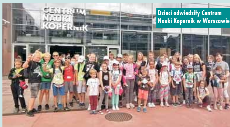
Dzieci odwiedziły Centrum Nauki Kopernik w Warszawie

ki najmłodszy zwiedzili Krakowskie Przedmieście, Kolumnę Zygmunta, Zamek Królewski, Warszawską Syrenkę, Plac Piłsudskiego, Grób Nie-