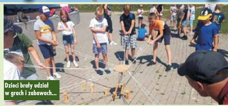
Dzieci brały udział w grach i zabawach...

Koloniści brali udział w wielu zajęciach oraz grach i zabawach na świeżym powietrzu. Program „Zielonych wakacji z profilaktyką” obejmował również korzystanie z obiektów spółki „Projekt Kępno”,