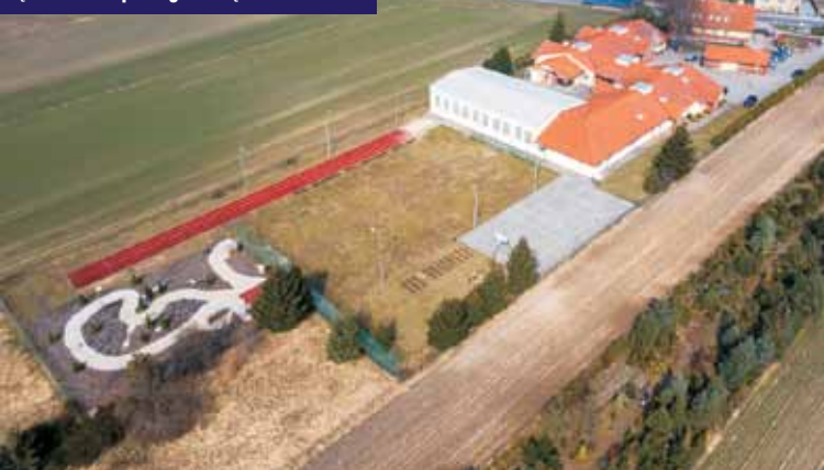
Zgromadzona deszczówka odprowadzana będzie do „Lipowego Zakątka”

Program „Deszczówka” skierowany jest do samorządów terytorialnych z województwa wielkopolskiego. Jego celem jest promowanie działań zapobiegających negatywnym skutkom suszy poprzez retencjonowanie i odpowiednie wykorzystywanie wody opadowej w celu nawadniania terenów zieleni oraz wykonywania systemów magazynowania wody opadowej wraz z instalacją umożliwiającą jej zagospodarowanie. Kwota dofinansowania wynosi maksymalnie 70% poniesionych i udokumentowanych kosztów kwalifikowalnych. Projekt pn. „Zagospodarowanie wód opadowych na terenie Zespołu Szkół w Łęce Mroczeńskiej” zakłada retencjonowanie