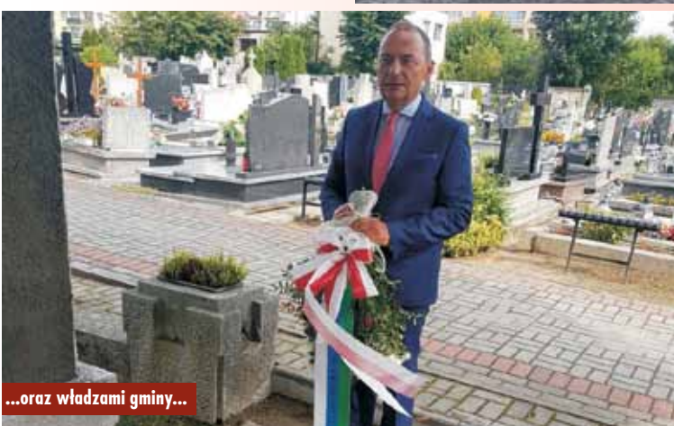
...oraz władzami gminy...

na przez wroga, nawet zniszczona, za każdym razem podnosi się niezłomnością nas wszystkich poprzez pokolenia, poprzez zabory, odzyskanie niepodległości, II wojnę światową, żołnierzy niezłomnych, którzy walczyli po to, żeby mieć wolną Polskę. Nie byłoby tej wolności, gdyby nie tamto bohaterstwo, tamta krew, tamto poświęcenie.