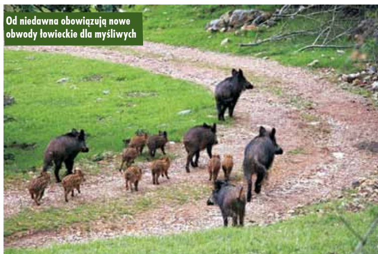
Od niedawna obowiązują nowe obwody łowieckie dla myśliwych

Procedurę wydzierżawiania obwodów łowieckich powierzono właściwym starostom, natomiast wniosek o dzierżawę obwodu rozpatruje właściwy zarząd okręgowy Polskiego Związku Łowieckiego. Uchwała stanowi akt prawa miejscowego i po publikacji w Dzienniku Urzędowym Województwa Wielkopolskiego obowiązywać będzie na terytorium całego województwa. m