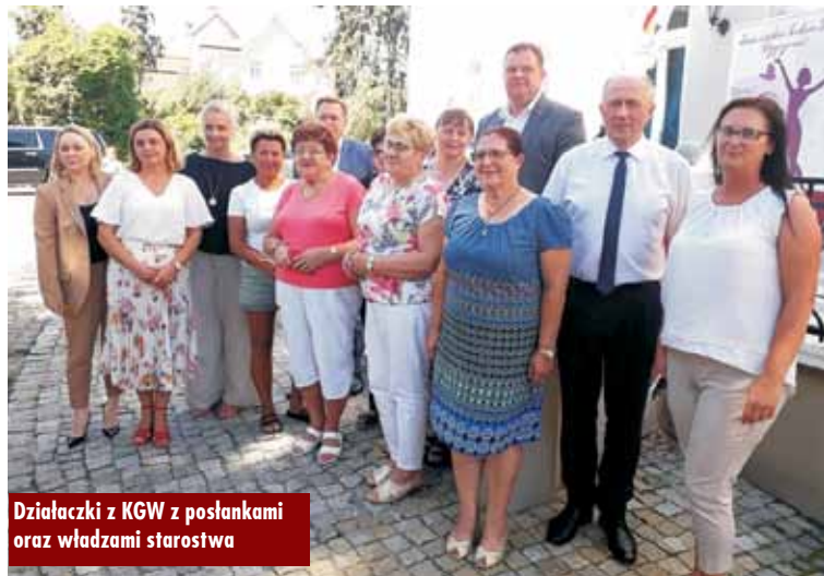
Działaczki z KGW z posłankami oraz władzami starostwa

Spotkanie poświęcone było działalności Kół Gospodyń Wiejskich oraz włączeniu się w akcję promowania szczepień przeciw COVID-19 w Polsce.