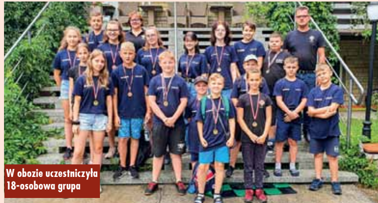
W obozie uczestniczyła 18-osobowa grupa

Program obozu został tak opracowany, żeby nie zostawić czasu na nudę. Młodzież korzystała z uroków pobliskiej plaży, basenu, organizowano piesze wycieczki po najbliższej okolicy, a ponadto każdą wolną chwilę wykorzystywano na rozgrywki