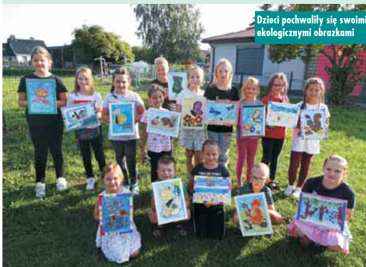
Dzieci pochwałyli się swoimi ekologicznymi obrazkami

nizowane w ramach zadania „Dzieje się w bibliotece – zajęcia edukacyjne i artystyczne dla dzieci i młodzieży z elementami biblioterapii”. Projekt został dofinansowany z programu „Partnerstwo dla książki” ze środków finansowych Ministra Kultury, Dziedzictwa Narodowego i Sportu, pochodzących z Funduszu Promocji