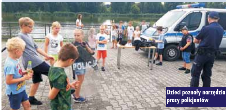
Dzieci poznały narzędzia pracy policjantów

I Piknik Powiatowy „Lato ze Śląskimi Szlagierami” w Olszowie