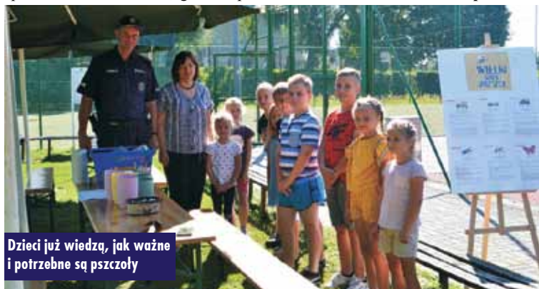
Dzieci już wiedzą, jak ważne i potrzebne są pszczoły

Rozpoczęły się inwestycje drogowe w gminie Perzów