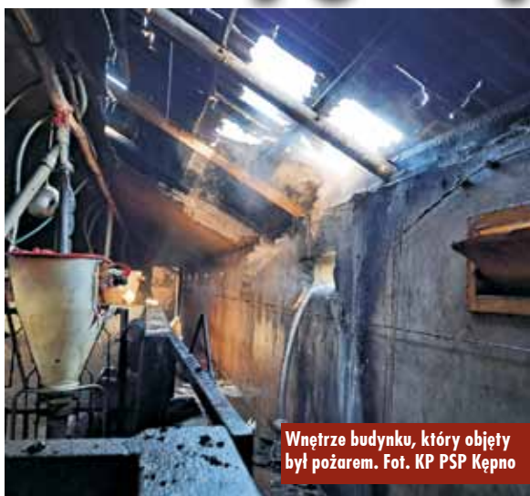
Wnętrze budynku, który objęty był pożarem.

W sobotę, 7 sierpnia br., o godzinie 6.51, do Stanowiska Kierowania Komendanta Powiatowej Państwowej Straży Pożarnej w Kępnie wpłynęło zgłoszenie o pożarze budynku gospodarczego w Świbie. Na miejsce zadysponowano zastępy z Jednostki Ratowniczo-Gaśniczej w Kępnie, OSP Świba, OSP Olszowa i OSP Kępno.