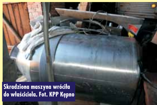
Skradziona maszyna wróciła do właściciela.

Dzięki dużemu zaangażowaniu i skrupulatniej analizie uzyskanych