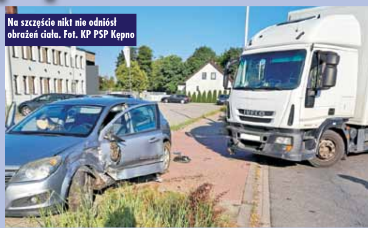
Na szczęście nikt nie odniósł obrażeń ciała.

W działaniach trwających 30 minut udział brały dwa zastępy straży pożarnej. Oprac. KR