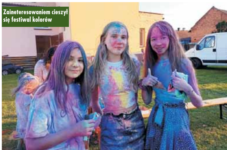
Zainteresowaniem cieszył się festiwal kolorów