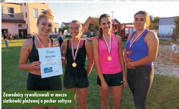
Zawodnicy rywalizowali w meczu siatkówki plażowej o puchar sołtysa

Już w piątek, w późnych godzinach wieczornych, odbył się plenerowy seans filmowy. Sobotnie popołudnie wypełniły zmagania sportowe, podczas których o puchar sołtysa sołectwa Bralin rywalizowały zespoły