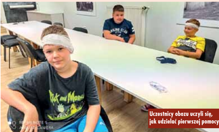
Uczestnicy obozu uczyli się, jak udzielać pierwszej pomocy

Dzieci z gminy Baranów podczas tegorocznych wakacji wypoczywały na koloniach dofinansowanych przez baranowski samorząd. Kwota dofinansowania wynosiła 500 zł na każde dziecko. Środki te pochodziły z Gminnej Komisji Rozwiązywania Problemów Alkoholowych w Baranowie