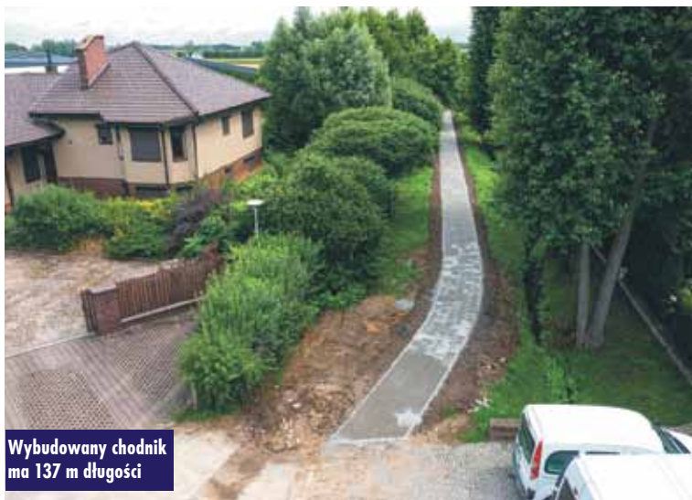
Wybudowany chodnik ma 137 m długości