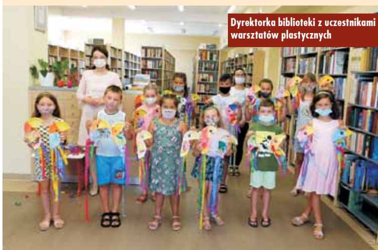
Dyrektorka biblioteki z uczestnikami warsztatów plastycznych

zując wyobraźnię, kreatywność i wrażliwość artystyczną, uczą się samodzielności, wytrwałości i rzetelnej pracy oraz doskonali swoje talenty, zdolności i zamięłowania. Warsztaty dodatkowo zachęcają do twórczego myślenia i ekspresji oraz kształtują wrażliwość estetyczną dziecka. Zajęcia są wzbogacone o elementy biblioterapii. Dzięki uczestnictwu w nich dzieci uczą się samodzielności, ale także pracy grupowej.