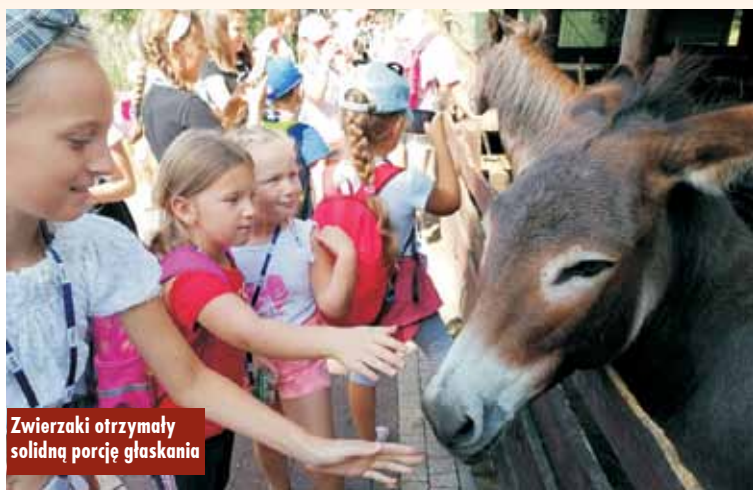
Zwierzaki otrzymały solidną porcję głaskania

Dofinansowanie z budżetu gminy dla Kół Gospodyń Wiejskich w Bralinie i Nosalach