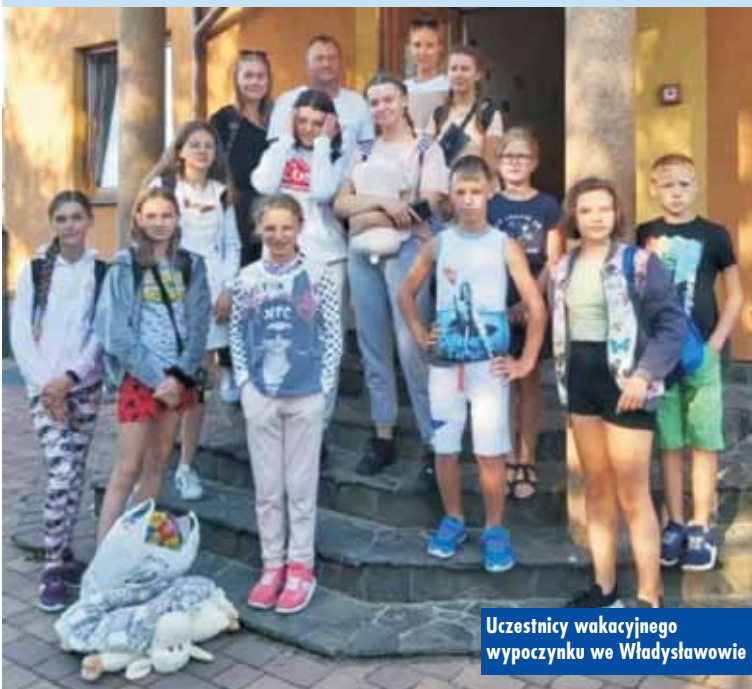
Uczestnicy wakacyjnego wypoczynku we Władysławowie

br. i wypełniony był licznymi atrakcjami. Podczas wypoczynku dzieci uczestniczyły w dwóch wycieczkach, korzystały z bogatej infrastruktury