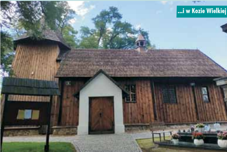
...i w Kozie Wielkiej