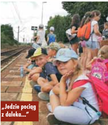
„Jedzie pociąg z daleka...”