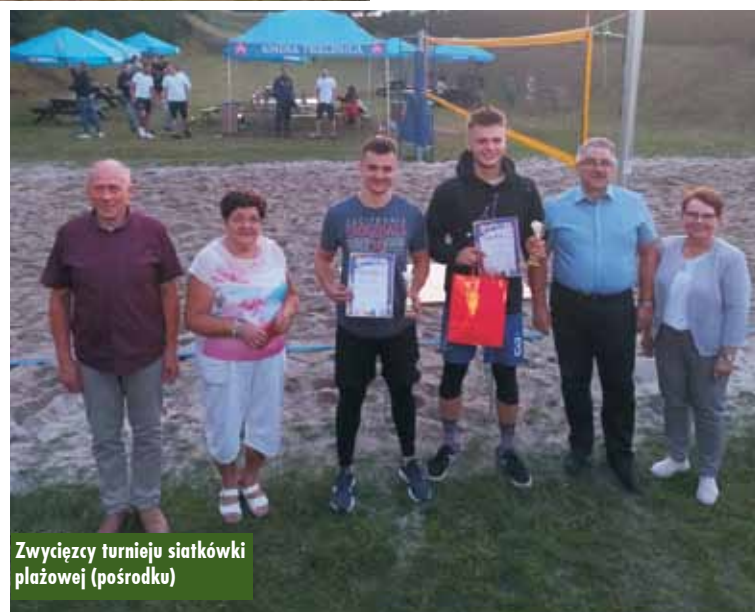
Zwycięzcy turnieju siatkówki plażowej (pośrodku)