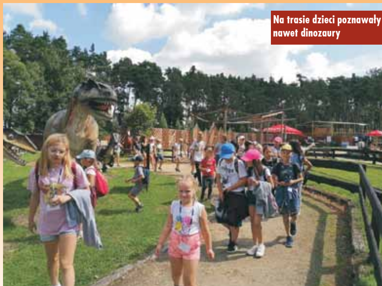
Na trasie dzieci poznawały nawet dinozaury

11 sierpnia br. grupa 30 dzieci z terenu gminy Bralin wzięła udział w jednodniowej wycieczce do Rodzinnego Parku Przygód i Edukacji „Górecznik”. Na miejscu uczestnicy zapoznali się ze ścieżką edukacyjną owadów, grzybów oraz edukacyjno-muzealną, prezentującą rozwój wsi i rybactwa w Dolinie Baryczy. Kolejnym punktem było mini-zoo, zamieszkane przez różne zwierzęta, m.in. kury, bażanty, strusie, surykaty, lemury, lamy, alpaki i kozy. Dzieci korzystały także z wielu atrakcji w parku rozrywki – do dyspozycji miały: arenę trampolin, zjazd pontonowy, park dinozaurów, zjazd tyrolski, mini quady oraz bajkową kolejkę. Mnóstwo pozytywnych emocji wśród dzieci wywołał powrót pociągiem do Kępna. Był to wyjazd pełen przygód i wymienionej zabawy. Oprac. KR