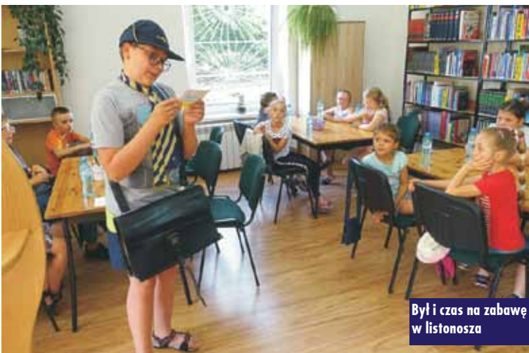
Był i czas na zabawę w listonosza