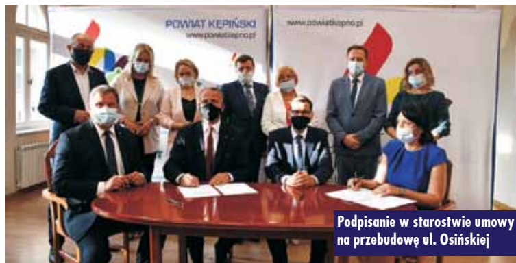
Podpisanie w starostwie umowy na przebudowę ul. Osińskiej