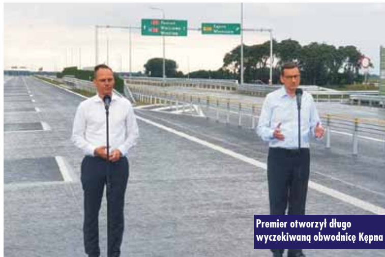
Premier otworzył długo wyczekiwany obwodnicę Kępna

Już godzinę przed planowanym przybyciem premiera na uroczyste otwarcie drogi ekspresowej S11 (odcinek II) omijającej Kępno na węzeł w Olszowie przybyli ministrowie: