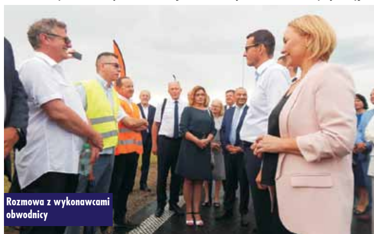
Rozmowa z wykonawcami obwodnicy

obwodnicy Kępna od węzła Kępno Krązkowy do istniejącej drogi krajowej nr 11 w rejonie Baranów. – To niezwykle potrzebna droga, dzięki której południowa część Wielkopolski, na styku z Opolszczyzną, będzie miała znakomite położenie logistyczne i transportowe – podkreślił szef rządu. – Każdy kilometr tej