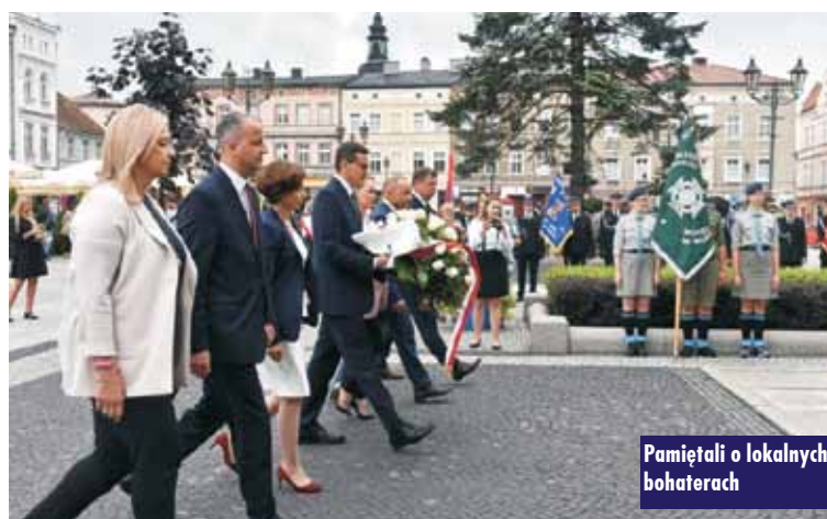
Pamiętali o lokalnych bohaterach

Śląska nad morze. – Zaznaczam, że otwierany odcinek drogi został ukończony prawie miesiąc przed czasem. Pokazuje to ogromną sprawność wykonawczą polskiej firmy Intercor, która ponad dwa lata temu rozpoczęła te inwestycje i dziś ją zakończyła – zauważył R. Weber.