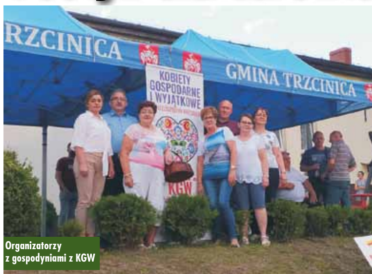
Organizatorzy z gospodyniami z KGW