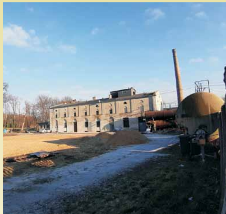
Gorzelnia w Laskach.

Gorzelnia nie działa od kilku lat, jednak nie jest budynkiem opuszczonym, prowadzona jest w nim działalność gospodarcza. Przed obiektem nadal się znajduje kilka metalowych zbiorników, przypuszczalnie na wywar. Jest to budynek piętrowy na planie prostokąta, z licznymi dobudowaniami. Największa parterowa przybudówka od ściany południowej, wybudowana prostopadłe względem gorzelni, była prawdopodobnie kotłownią. Również od ściany szczytowej wschodniej dobudowano niewielki budynek parterowy. Gorzelnia posiada dach dwuspadowy, kryty papą. Elewacja ściany zachodniego