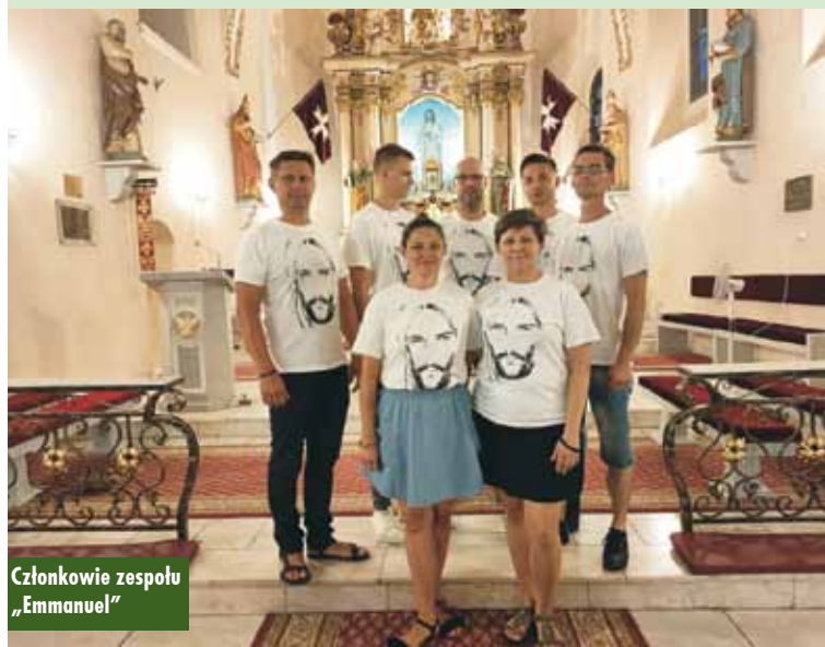
Członkowie zespołu „Emmanuel”