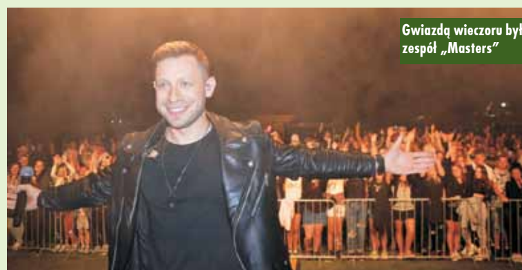
Gwiazdą wieczoru był zespół „Masters”

wysłuchać wspaniałego koncertu w wykonaniu utalentowanej młodzieży. Zwieńczeniem niedzielnej festynu