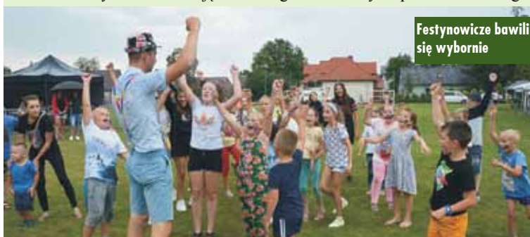
Festynowicze bawili się wybornie

Festyn oprócz zabawy miał na celu promocję szczepień przeciwko COVID-19. Każdy mógł otrzymać szczegółowe informacje na temat szczepień oraz dostępnych szczepionek. Organizatorzy zorganizowali także mobilny punkt spisowy oraz punkt znakowania rowerów. Oprac. m