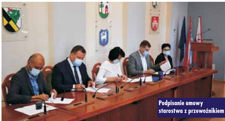
Podpisanie umowy starostwa z przewoźnikiem

Rozkład jazdy znajdziesz na stronie: czkalski.pl/powiat-kepinski/ m