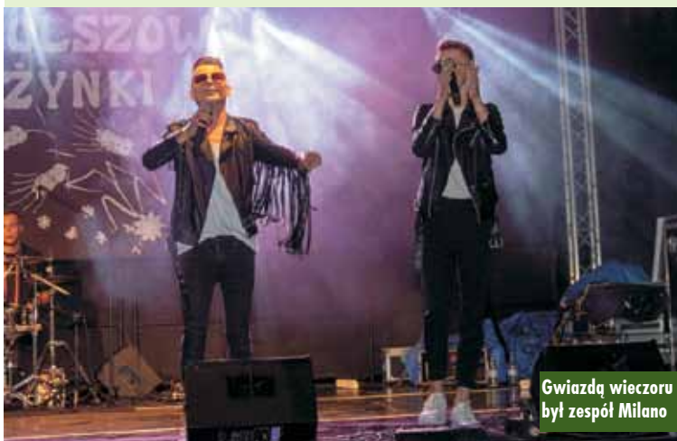
Gwiazdą wieczoru był zespół Milano

nie zebraną publiczność do wspólnej zabawy i śpiewu. Wydarzenie zakończyła zabawa taneczna z zespołem Kanion, trwająca do późnych godzin nocnych. KR