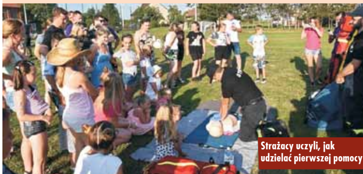
Strażacy uczyli, jak udzielać pierwszej pomocy

Podpisanie umowy z wykonawcą budowy czwartego etapu sieci kanalizacji sanitarnej oraz wodociągowej w Chojeńcinie