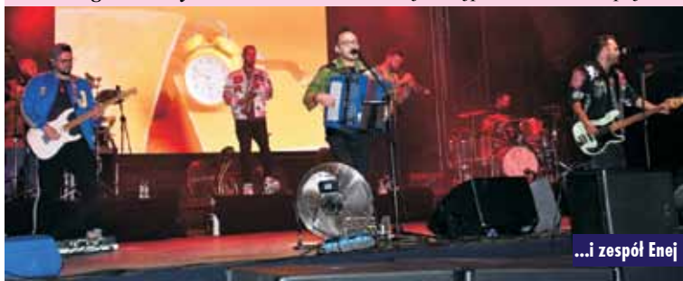
...i zespół Enej