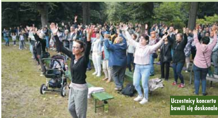
Uczestnicy koncertu bawili się doskonale

Sobotni koncert był zarówno wspaniałym, energetycznym występem artystycznym, jak również głęboką, radosną modlitwą. Oczywiście, na zakończenie nie mogło zabraknąć wspólnego wykonania pieśni: „Już teraz we mnie kwitną Twe ogrody, już teraz we mnie Twe Królestwo