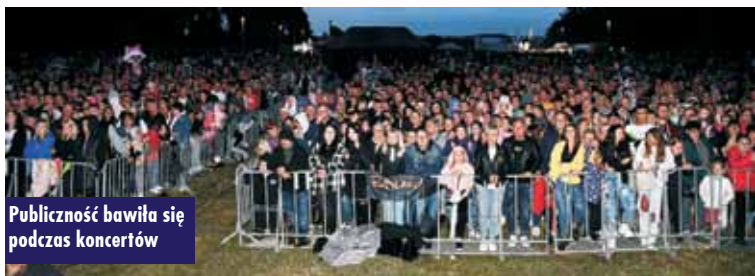
Publicność bawiła się podczas koncertów

zabawiała znana i lubiana gwiazda śląskich szlagierów – zespół „Arkadia Band”. Imprezą towarzyszącą były zawody „Street Workout Summer Games”. Podczas festynu podsumowano też akcję „Kropla życia” i rozlosowano główne nagrody wśród wszystkich honorowych dawców, którzy tego dnia oddali krew w kępińskiej hali. Następnie władze Powiatu Kępińskiego podziękowały wszystkim, którzy włączyli się w walkę z pandemią koronawirusa. Specjalne podziękowania skierowa-