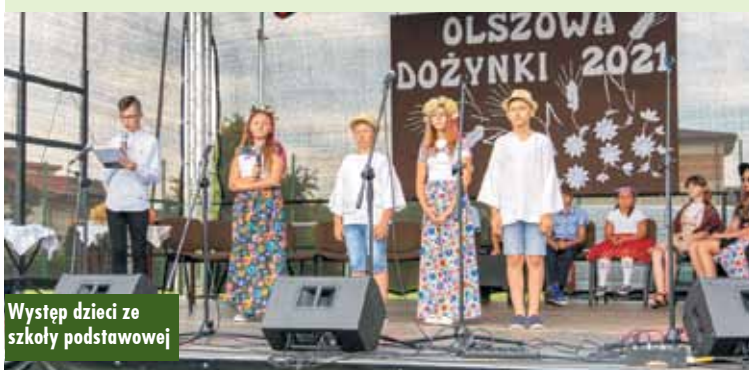
Występ dzieci ze szkoły podstawowej