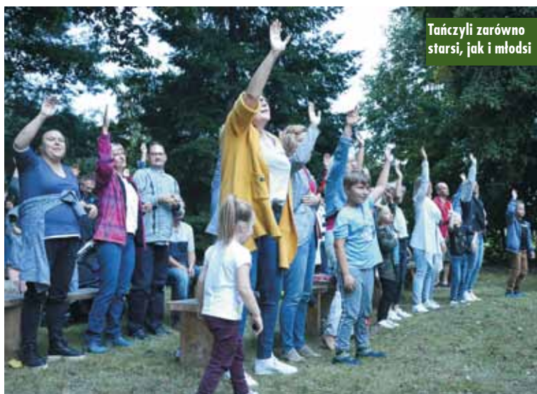
Tańczyli zarówno starsi, jak i młodszy

Wszystkim laureatom gratuluje składa redakcja „Tygodnika Kępińskiego”. m