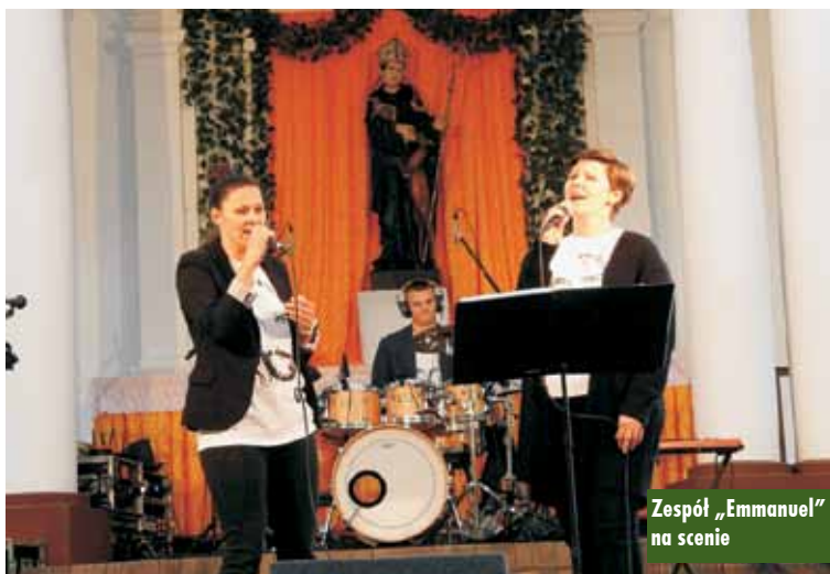
Zespół „Emmanuel” na scenie