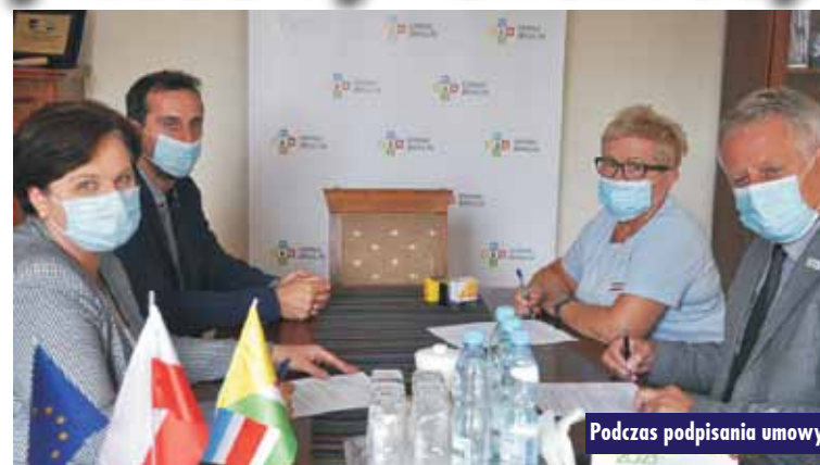
Podczas podpisania umowy