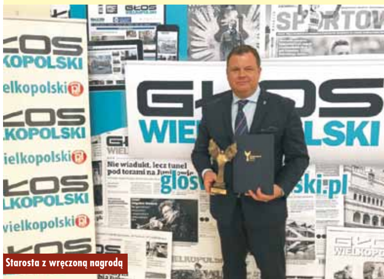
Starosta z wręczoną nagrodą

pięciu kategoriach. O tym, kto stał się laureatem i laureatką, zdecydowali współmieszkańcy i współpracownicy z organizacji lokalnych; społecznych, sportowych, kulturalnych, biznesowych. To oni głosując, docenili Państwa dokonania i aktywność. Tym bardziej cieszą nas Państwa osiągnięcia. Życząc dalszej