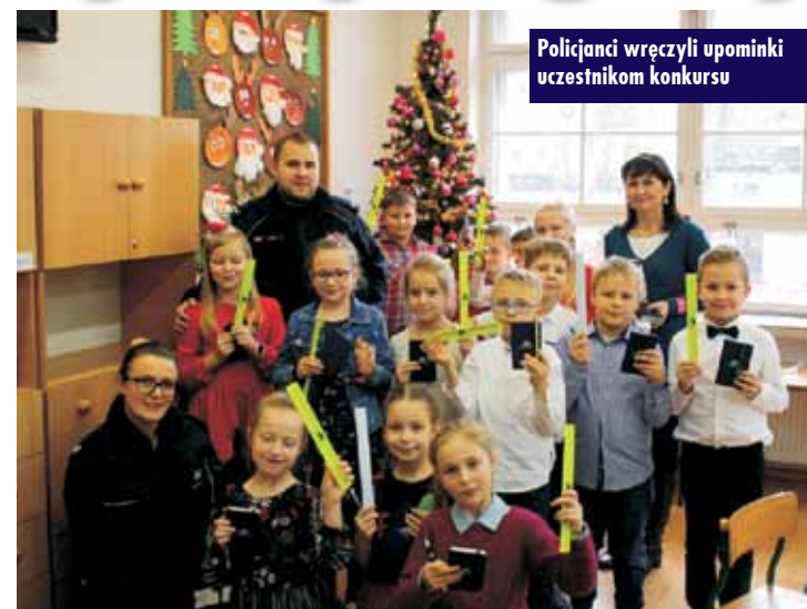
Policjanci wręczyli upominki uczestnikom konkursu

W Nosalach doszło do tragicznego wypadku przy pracy