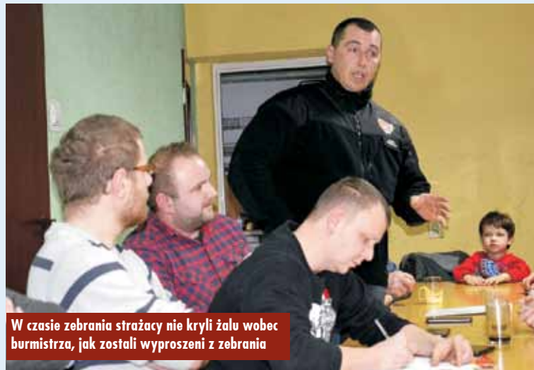
W czasie zebrania strażacy nie kryli żalu wobec burmistrza, jak zostali wyproszeni z zebrania