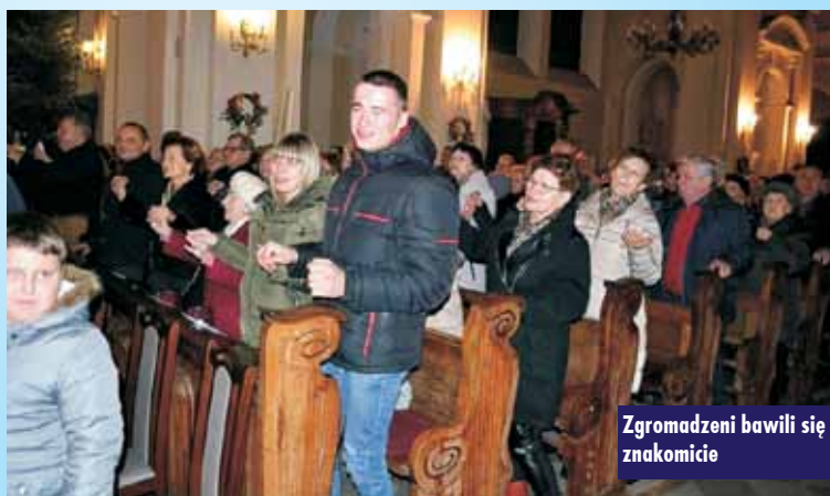
Zgromadzeni bawili się znakomicie

Kępno zdobyło wyróżnienie w konkursie Radia Poznań na „Wielkie Iluminacje 2017”