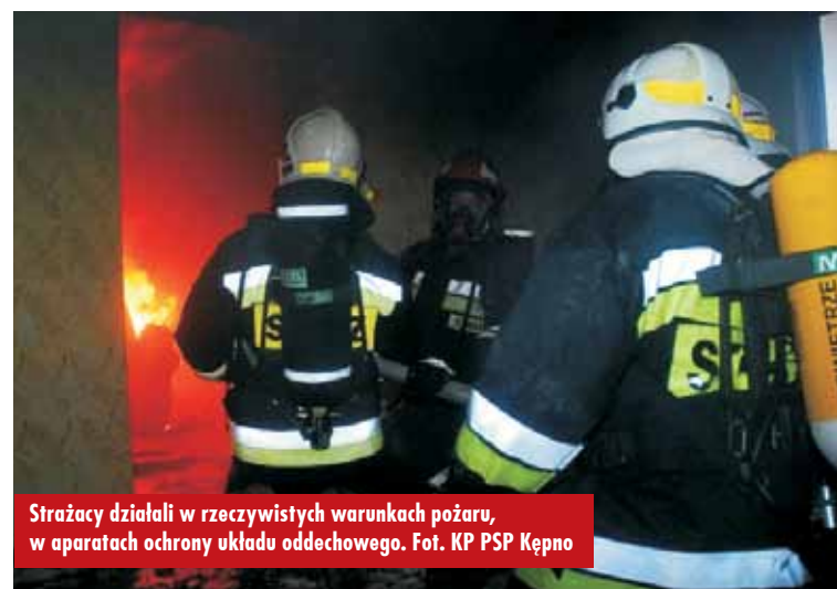
Strażacy działali w rzeczywistych warunkach pożaru, w aparatach ochrony układu oddechowego.

KP PSP Kępno planuje w bieżącym roku zorganizować podobne