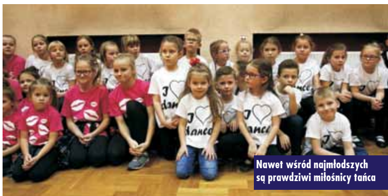
Nawet wśród najmłodszych są prawdziwi miłośnicy tańca