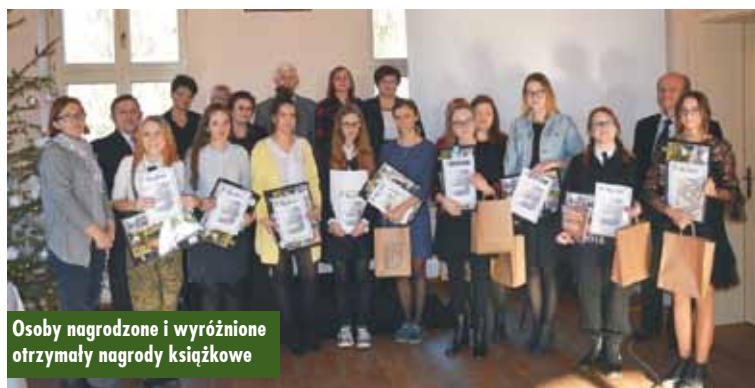
Osoby nagrodzone i wyróżnione otrzymały nagrody książkowe