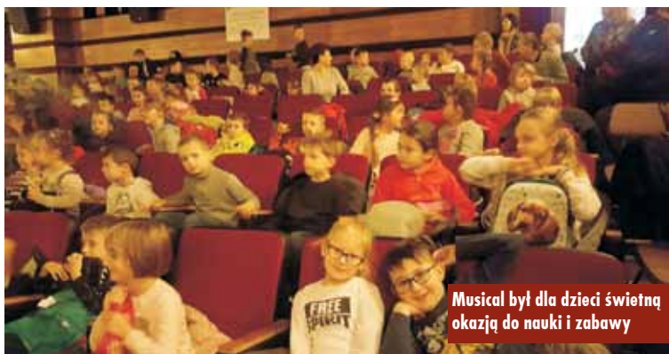
Musical był dla dzieci świetną okazją do nauki i zabawy

Kolarze UKS Sport Bralin po raz ostatni stanęli na linii startu – na szczęście tylko na zakończenie ubiegłego roku