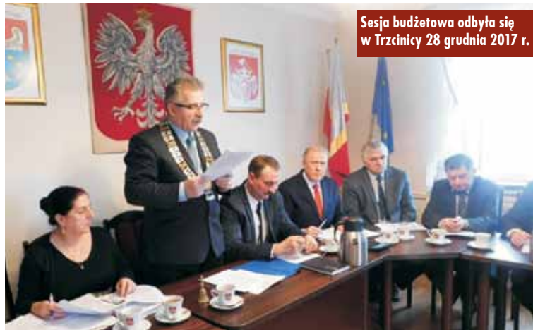
Sesja budżetowa odbyła się w Trzcinnicy 28 grudnia 2017 r.

Na inwestycje w budżecie zapisano kwotę 8.816.730,50 złotych. Wśród zadań znalazła się budowa kanalizacji sanitarnej, w tym rozdzielnic sieci ogólnospławnej oraz budowa systemu zaopatrzenia w wodę wraz z odtworzeniem dróg w miejscowości Trzcinnica - etap I. Wyłoniony został już wykonawca tego zadania, z którym podpisano umowę. Jest to Przedsiębiorstwo Budowlane „M. Wawrzyniak”. Na to zadanie pozyskano 3.242.332,56 złotych środków zewnętrznych z Wielkopolskiego Regionalnego Programu Operacyjnego. Wybudowany zostanie także odcinek wodociągu w miejscowości Granice.