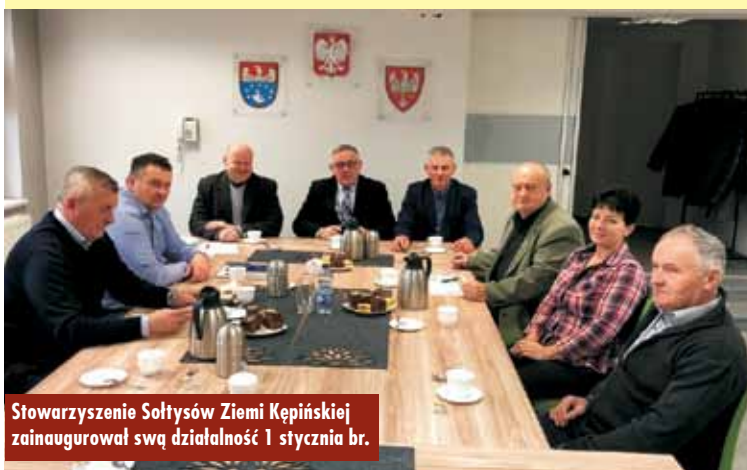
Stowarzyszenie Sołtysów Ziemi Kępińskiej zainaugurowało swą działalność 1 stycznia br.