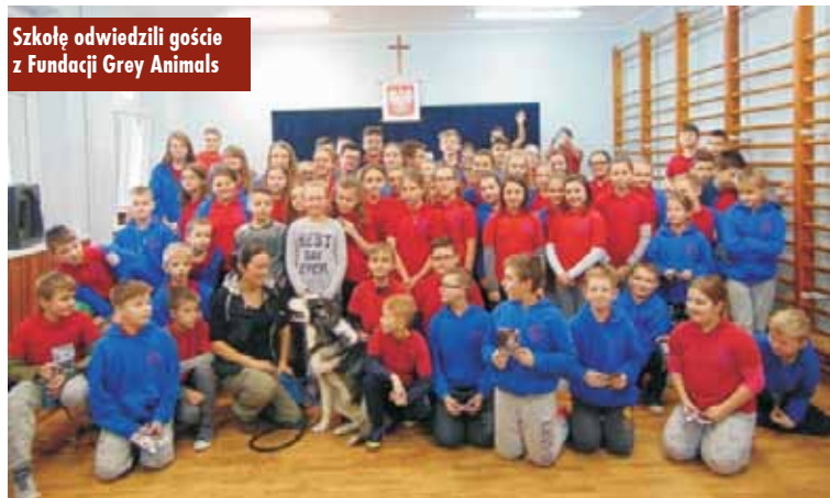
Szkołę odwiedzili goście z Fundacji Grey Animals