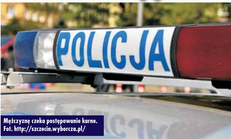
Mężczyznę czeka postępowanie karne.

Przyjechał na komendę, mając aktywny zakaz kierowania pojazdami