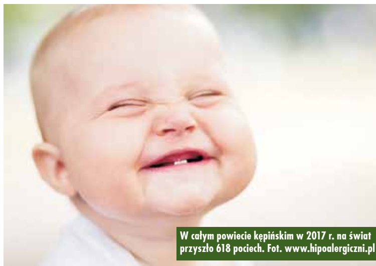
W całym powiecie kępińskim w 2017 r. na świat przyszło 618 pociech.

W powiecie kępińskim w 2017 r. na świat przyszło 618 nowych mieszkańców. To o 8 więcej niż w 2016 r.