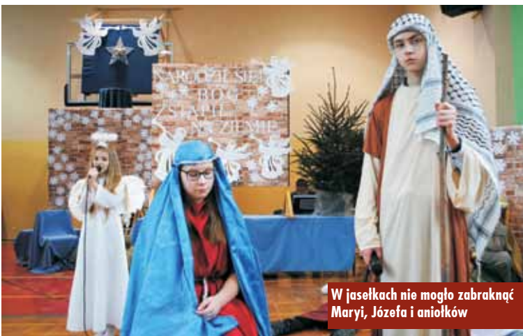
W jasełkach nie mogło zabraknąć Maryi, Józefa i aniołków

W ratuszu podpisano umowę na realizację zadania inwestycyjnego pn. „Budowa dróg na terenie miasta i gminy Kępno”