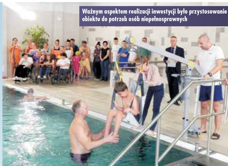
Ważnym aspektem realizacji inwestycji było przystosowanie obiektu do potrzeb osób niepełnosprawnych

bez przeszkód będą mogły z tego basenu korzystać - mówiła. - Wszyscy wiemy, że terapia w wodzie to nie tylko dobra rehabilitacja, ale przede wszystkim dobry rozwój psychoruchowy, zarówno dla dzieci, jak i dla dorosłych.