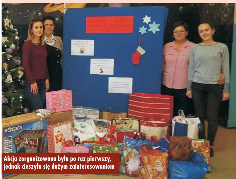
Akcja zorganizowana była po raz pierwszy, jednak cieszyła się dużym zainteresowaniem

Uczniowie na musicalu profilaktycznym pt. „Nowe szaty króla”