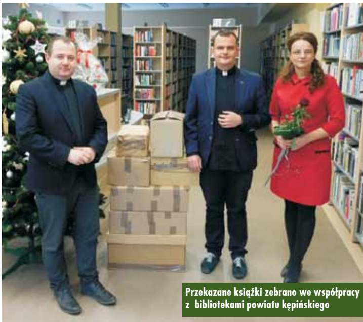
Przekazane książki zebrano we współpracy z bibliotekami powiatu kępińskiego