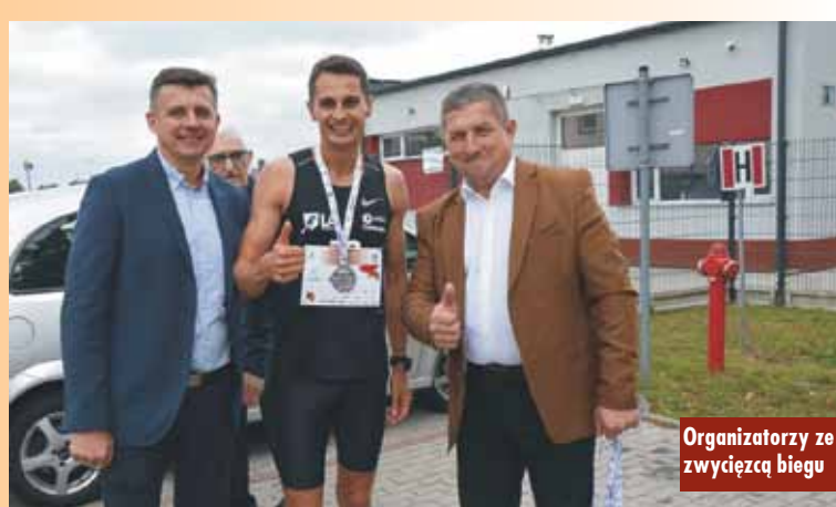
Organizatorzy ze zwycięzcą biegu

Bieg był podzielony na wiele kategorii wiekowych, dlatego podczas dekoracji organizatorzy w towarzystwie grupy sponsorów wręczyli kilkadziesiąt pucharów.