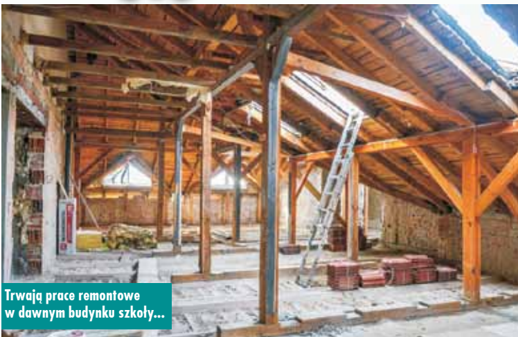
Trwają prace remontowe w dawnym budynku szkoły...

Trwa realizacja zadania pn. „Rewitalizacja Rynku w Baranowie wraz z rozbudową, przebudową i zmianą sposobu użytkowania budynku szkoły na ośrodek kultury z ośrodkiem opieki dziennej nad seniorami”. Wykonawcą inwestycji jest firma BUDONIS. W ramach tego projektu zmodernizowane zostaną obiekty: Urząd Gminy w Baranowie i siedziba Ochotniczej Straży Pożarnej w Baranowie, powstanie również oranżeria i ośrodek kultury z ośrodkiem opieki dziennej nad seniorami.