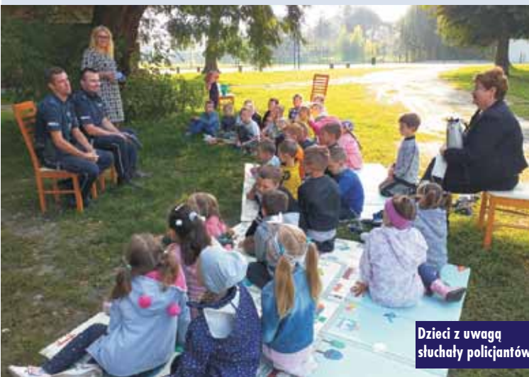
Dzieci z uwagą słuchały policjantów

chali wskazówek i rad, które na pewno ułatwią bezpieczne zachowanie w różnych sytuacjach. Atrakcją wizyty była prezentacja podstawowego wyposażenia policjanta, np.: kajdanki, urządzenie do badania stanu trzeźwości (alkomat), czy Mobilny Terminal Noszony – Bluebird.