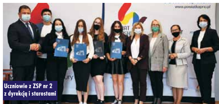
Uczniowie z ZSP nr 2 z dyrektką i starostami

W wyniku zakończonego naboru od 1 września br. naukę w szkołach dla młodzieży prowadzonych