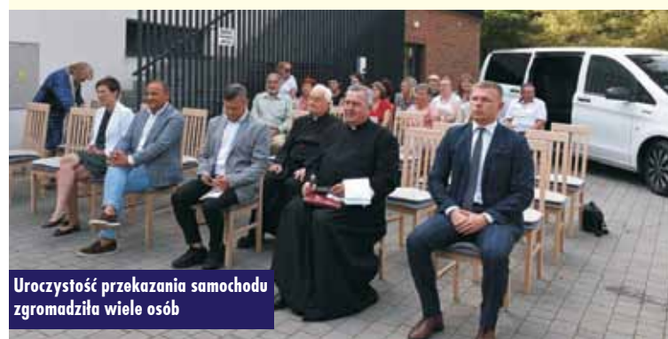
Uroczystość przekazania samochodu zgromadziła wiele osób

samochodu elektrycznego za kwotę 8.610,00 zł.