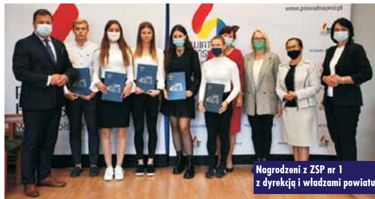
Nagrodzeni z ZSP nr 1 z dyrektką i władzami powiatu

W Zespole Szkół Specjalnych w Słupi pod Kępem 35 dzieci objętych jest wczesnym wspomaganiam.