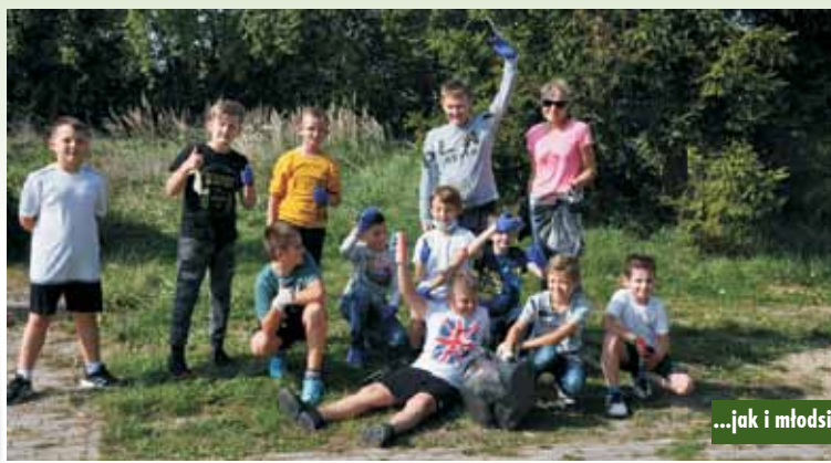
...jak i młodsi