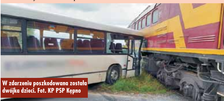
W zdarzeniu poszkodowana została dwójka dzieci.

W powiecie kępińskim od 1 września br. stwierdzono jedno nowe zakażenie koronawirusem SARS-CoV-2, nie odnotowano natomiast żadnego zgonu spowodowanego COVID-19