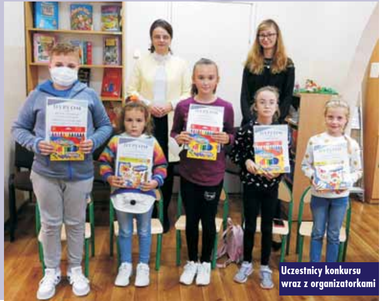
Uczestnicy konkursu wraz z organizatorkami