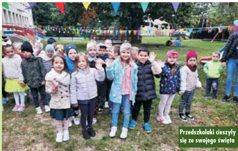
Przedszkolaki cieszyli się ze swojego święta

Inwestycja rozpocznie się po podpisaniu umowy z wykonawcą i potrwa 12 miesięcy. Na chwilę obecną trwa analiza oferty, która została złożona w przetargu. KR