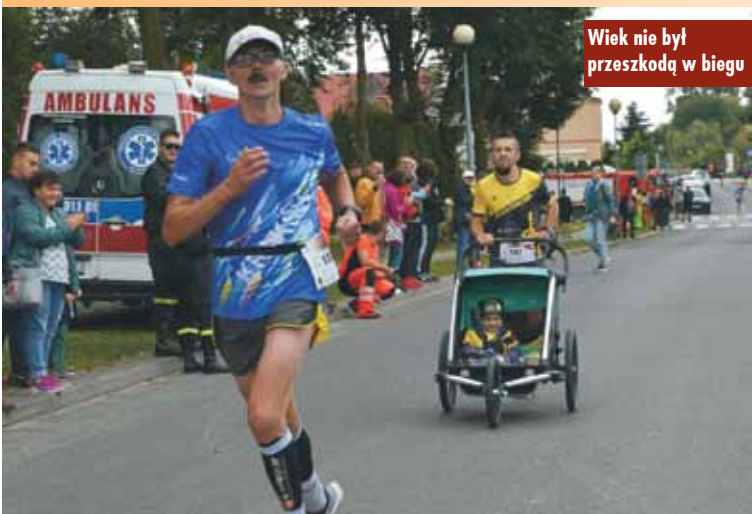
Wiek nie był przeszkodą w biegu