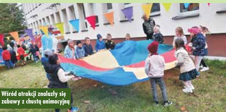
Wśród atrakcji znalazły się zabawy z chustą animacyjną

„Każdy przedszkolak dobrze wie, że kiedy 20 września zbliża się, od najmłodszego aż po starszaka – wszyscy świętują Dzień Przedszkolaka!”