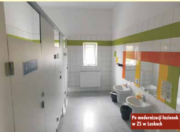
Po modernizacji łazienek w ZS w Laskach

nę na podłogę oraz zakupiono stół do rozgrywek. Przy Domu Ludowym w Smardzach zamontowano pomieszczenie gospodarcze. Zawarta została umowa na wykonanie odcinków wodociągów w Trzcinicy ulica Zamkowa i w Laskach Osiedle Nowe. Termin wykonania prac to 19 listopada 2021. Oprac. m