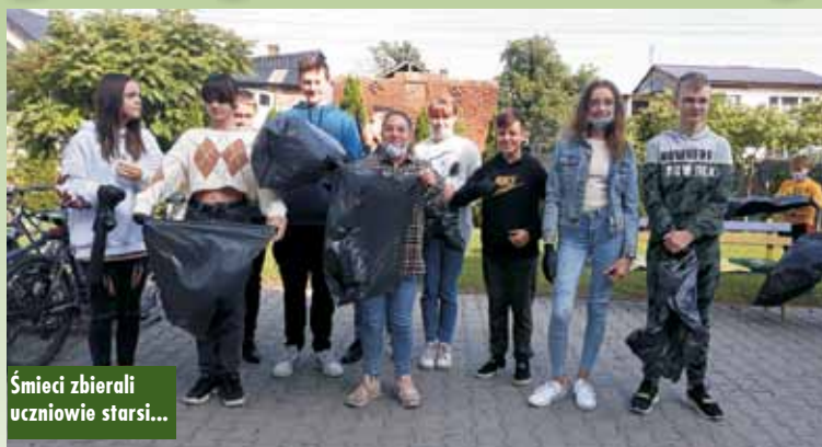
Śmieci zbierali uczniowie starsi...