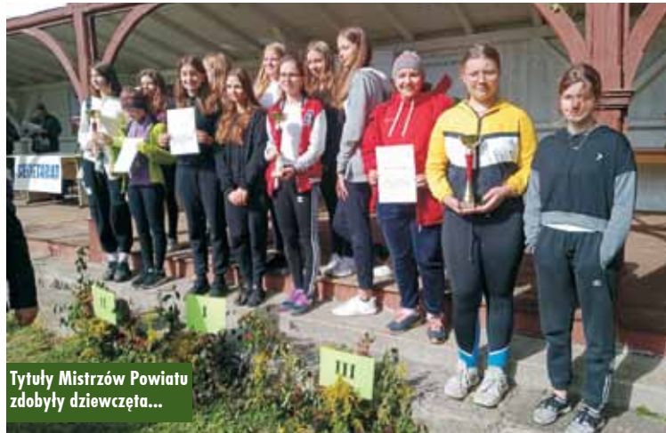
Tytuły Mistrzów Powiatu zdobyły dziewczęta...

zostaną na długo w pamięci zawodników. Zarówno dziewczęta, jak i chłopcy, w rywalizacji drużynowej zdobyli