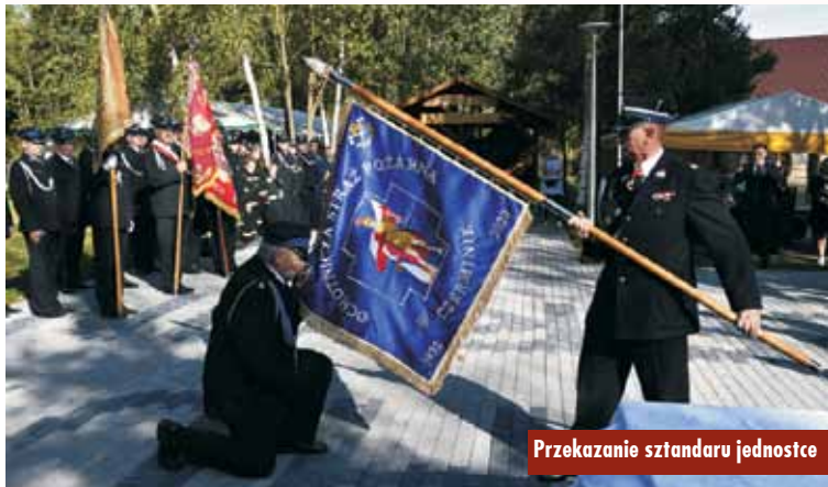
Przekazanie sztandaru jednostce