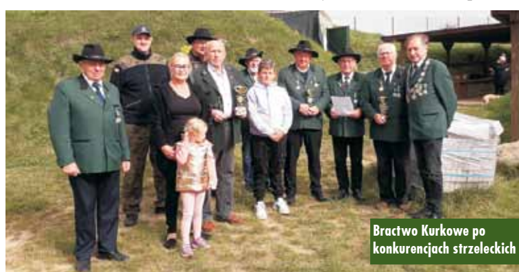
Bractwo Kurkowe po konkurencjach strzeleckich

uczestnikom zawodów i obiecanie rewanżu być może w październiku br.