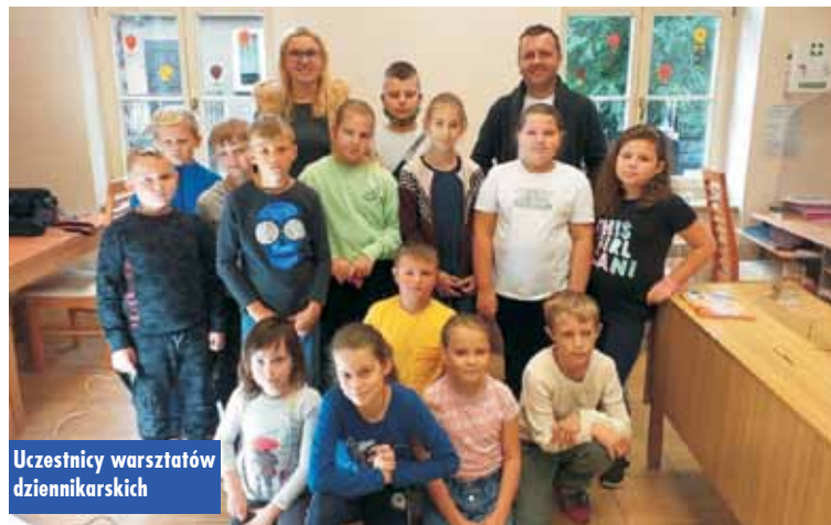
Uczestnicy warsztatów dziennikarskich

zent. Będzie to wspaniała pamiątka. Ponadto zaprosił do studia radia wszystkich uczniów klasy 3 wraz z wychowawczynią. - Dzieci bardzo zadowolone z tej propozycji będą