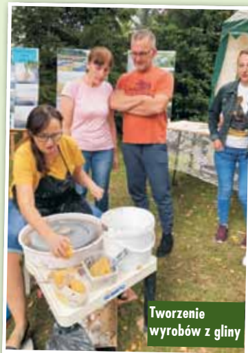
Tworzenie wyrobów z gliny