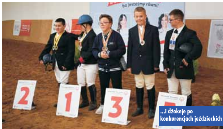
...i dżokeje po konkurencjach jeździeckich