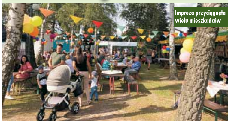
Impreza przyciągnęła wielu mieszkańców

12 września br. na terenie ośrodka wypoczynkowego w Mikorzynie odbył się piknik rodzinny, na który zaprosili: Miasto i Gmina Kępno, Stowarzyszenie „Bractwo Świętego Idziego” w Mikorzynie, Rada Sołectwa, Koło Gospodyń Wiejskich w Mikorzynie, Ochotnicza Straż Pożarna w Mikorzynie, Stowarzyszenie „Mikora”, LZS oraz Szkoła Podstawowa im. Jana Pawła II w Mikorzynie. Wydarzenie zorganizowano w ramach projektu Bractwa Świętego Idziego w Mikorzynie pn. „Seniorzy wchodzą do gry!”, współfinansowanego przez Miasto i Gminę Kępno.