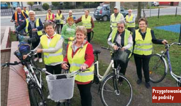
Przygotowanie do podróży