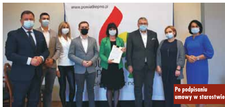
Po podpisaniu umowy w starostwie

Całkowita wartość projektu wynosi ponad 4,1 mln zł, przyznane dofinansowanie w ramach Wielkopolskiego Regionalnego Programu Operacyjnego stanowi kwotę 3.725.908,21 zł.