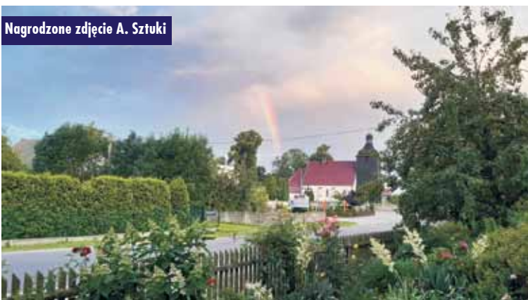
Nagrodzone zdjęcie A. Sztuki