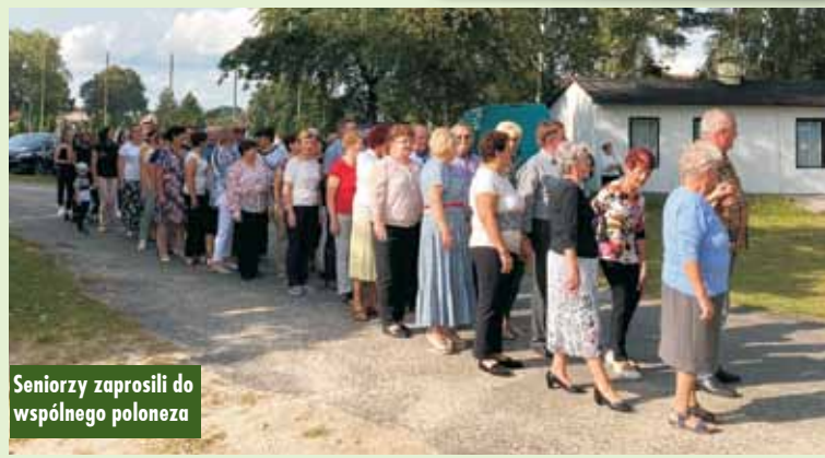
Seniorzy zaprosili do wspólnego poloneza

Festiwal kolorów i samochodowe kino plenerowe w Kępnie