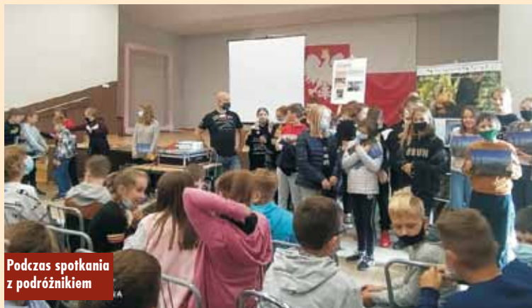
Podczas spotkania z podróżnikiem

opowieści o przeżytych przygodach. Uczniowie mieli okazję nauczyć się języka suahili – poznali podstawowe zwroty powitalne oraz liczby. Podróżnik zachęcił uczestników do podróżowania, aktywnego spędzania czasu i poznawania otaczającej nas przyrody. Tematyka spotkania pozwoliła