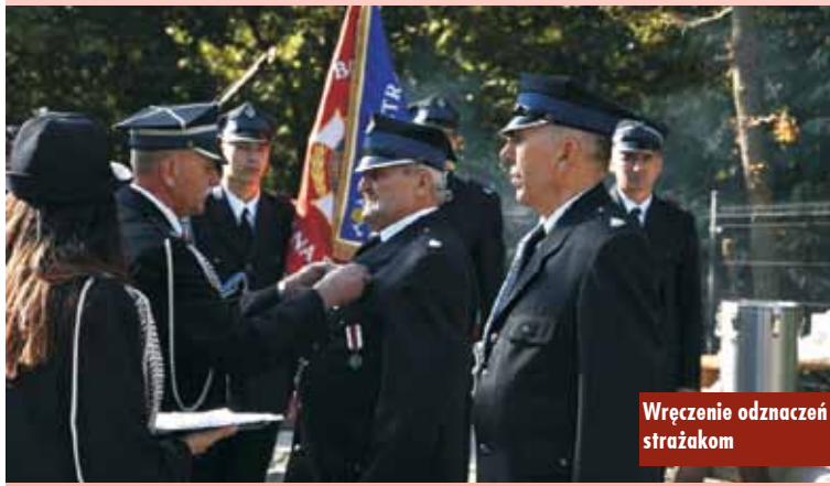
Wręczenie odznaczeń strażakom