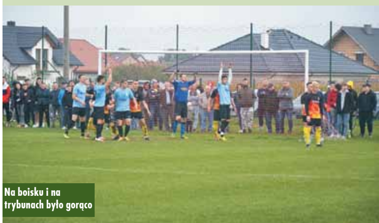
Na boisku i na trybunach było gorąco

pewnością powinni zasługiwać na kibicowski szacunek, bo przecież tutaj stawiali pierwsze piłkarskie kroki. Złe emocje spływały na murawę niczym gaz rozjuszający; prowokując piłkarzy do gry... w kości. Sędzia jakoś sobie z tym radził, ale