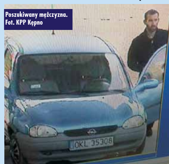
Poszukiwany mężczyzna.

stacjach paliw w Kępnie, po czym odjechał bez uiszczenia zapłaty. Wizerunek sprawcy kradzieży został zarejestrowany przez okoliczne kamery monitoringu. - Wszystkie osoby, które rozpoznają osobę ze zdjęcia, proszone są o kontakt z funkcjonariuszami Komendy Powiatowej Policji w Kępnie osobiście (ul. Jaśminowa 16 Chojęcín – Szum),