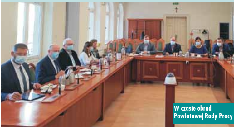
W czasie obrad Powiatowej Rady Pracy