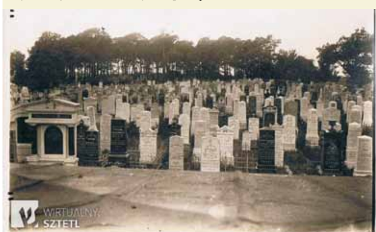
Przedwojenny cmentarz żydowski w Kępnie na tzw. Grzybowie.

wojnie, a druga prawdopodobnie na początku lat osiemdziesiątych. To na szczycie tej drugiej stał Trupek. Po jej rozjechaniu pojawiła się sahara, czyli piaszczyste boisko, na którym chłopcy z okolicy zdobywali piłkarskie umiejętności. Później nazwano tam kamieni – kopać piłkę było ciężko, ale miejsce nadal nadawało się choćby na ognisko. Niezależnie od tego, ile było górek, moi rozmówcy są zgodni co do tego, że gdy cmentarz „wyrównywano”, na powierzchni wyłaniały się setki, a nawet tysiące kości.