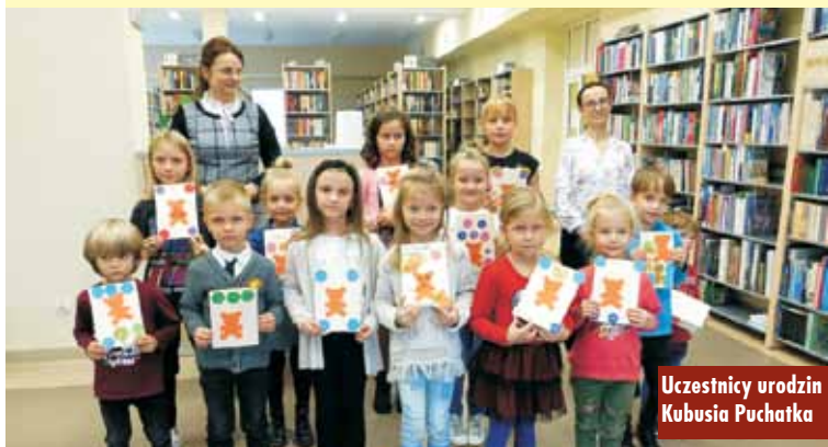
Uczestnicy urodzin Kubusia Puchatka

książkowemu jubilatowi, najmłodszy czytelnicy delektowali się przepyszny tortem z podobizną sympatycznej gromadki ze Stumilowego Lasu. Oczywiście w tym dniu nie mogło zabraknąć przepięknych kartek urodzinowych dla solenizanta. Dzięki wyobraźni i kreatywności najmłod-