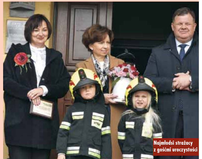
Najmłodszy strażacy z gośćmi uroczystości

niu dodatków do emerytury i świadczeń, z których będą mogli państwo korzystać. W tym wspólnym działaniu rządu i samorządu możemy two-