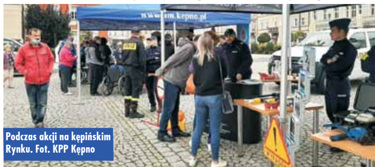
Podczas akcji na kepińskim Rynku.

torzy akcji edukowali mieszkańców na okoliczność zdarzeń drogowych, ze szczególnym uwzględnieniem zasad pierwszej pomocy, przybliżyli też podstawowe zasady bezpieczeństwa