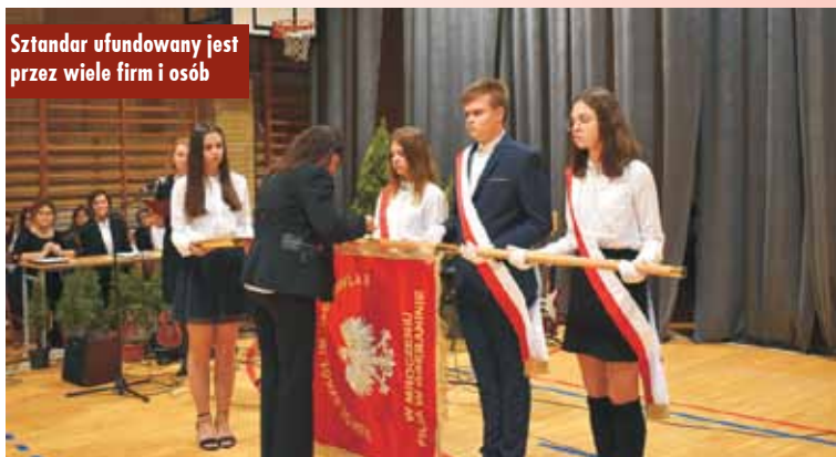
Sztandar ufundowany jest przez wiele firm i osób

ciemniejsze chmury. Jan Paweł II – patron Zespołu Szkół w Mroczeniu – był wielkim przyjacielem młodych ludzi, również nauczycielem. Jego nauki i myśli są uniwersalne i ponadczasowe, co pokazała młodzież szkoły w Mroczeniu w pięknym przekazie słowno-muzycznym, zaprezentowanym po części oficjalnej. Uroczystość zakończyła się w auli szkoły w Mroczeniu, gdzie rodzice przygotowali słodki poczęstunek przy kawie, a goście mogli dokonać wpisu w pamiątkowej księdze.