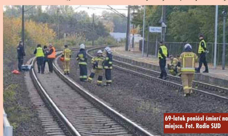
69-latek poniósł śmierć na miejscu.

Pociąg relacji Szczecin – Kraków, z którego wysiadał mężczyzna, został zatrzymany w Łęce Opatowskiej.