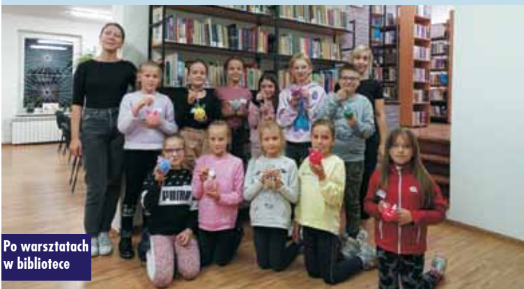
Po warsztatach w bibliotece

Na zakończenie wieczoru odbyło się ognisko - wspólne pieczenie kiełbasek przy wesołych opowieściach i nastrojowej muzyce. Wieczorna pora i bezchmurne niebo to także wspa-