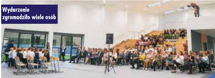
Wydarzenie zgromadziło wiele osób