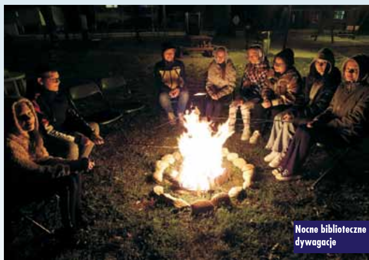
Nocne biblioteczne dywagacje

Następnie dla odświeżenia i wyciszenia, pomimo późnej pory wspólnie uczuliśmy się wypłatać „jesienne liście” ze sznurka techniką makramy - znanej od starożytności sztuki wiązania sznurków bez użycia igieł, drutów lub szydełka. Nasze prace powstałe podczas zajęć wykonane były z ok. 80 sztuk kawałków sznurka w dwóch