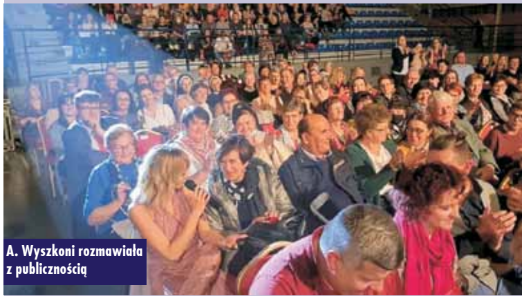
A. Wyszkonii rozmawiała z publicznością

Podczas wydarzenia w Kępnie nie zabrakło największych przebojów wokalistki, jak np. „Czy ten pan i pani”, „Biegnij przed siebie”, „Wiem, że jesteś tam”, „Nie chcę Cię obchodzić”, „Z ciszą pośród czterech ścian”, „Zapytaj mnie o to, kochany”, „W całość uło-