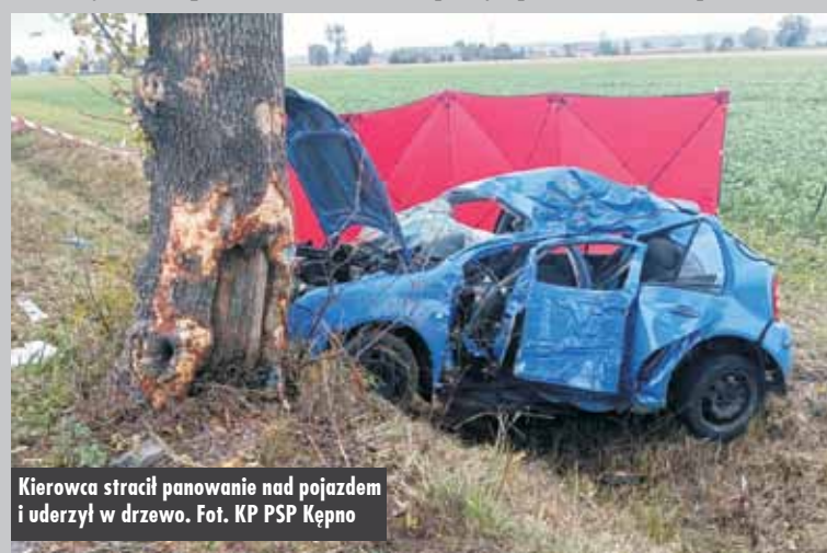
Kierowca stracił panowanie nad pojazdem i uderzył w drzewo.

Na miejscu pracowała Grupa Dochodzeniowo-Sledcza kępińskiej policji pod nadzorem prokuratora.