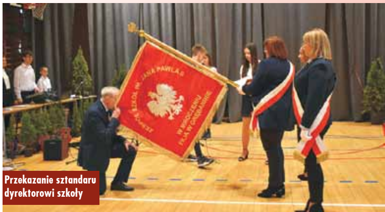
Przekazanie sztandaru dyrektorowi szkoły

Sztandar to symbol jedności i przynależności, powód do dumy i jednocześnie troski o to, by umieszczone na nim słowa i emblematy były żywe w świadomości łączącej się pod nim grupy. Młodzież to nasza nadzieja na lepsze jutro, to uśmiech, który ma rozjaśnić naj-