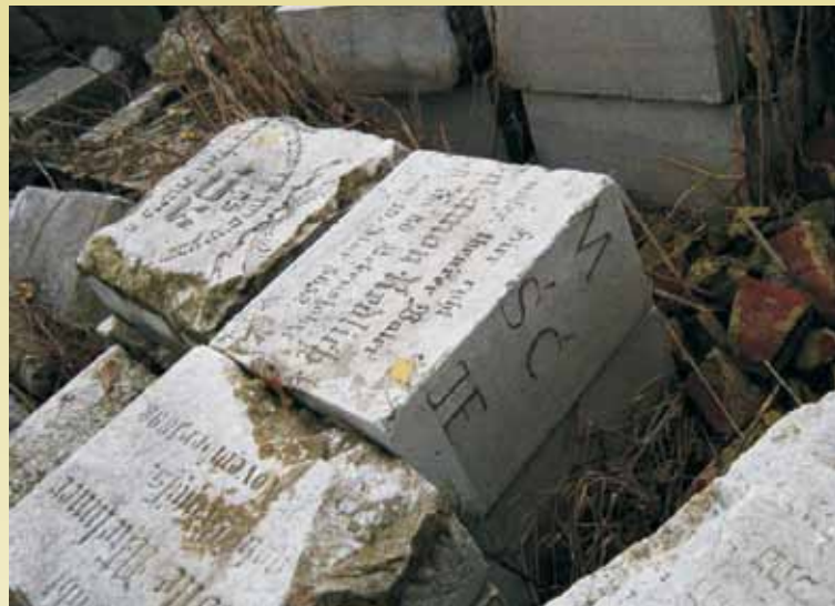
Macewy złożone kolo synagogi. Widać inskrypcje po niemiecku i litery z pomnika „wdzięczności” z Rynku.

wie spędzali w nim zbyt dużo czasu. Otrzymałem tę opowieść od W., który spisał dla mnie swoje wspomnienia o cmentarzu. Zaskoczyła mnie jedna rzecz, gdy wracał do kwestii wygrzebywania w dzieciństwie kości kępińskich Żydów: „To wówczas zostałem uświadomiony przez starszych, doświadczonych kolegów, że można