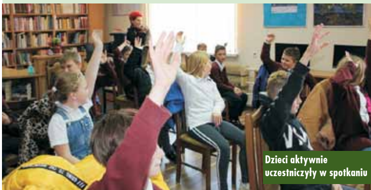
Dzieci aktywnie uczestniczyły w spotkaniu

Dzień Edukacji Narodowej w gminie Baranów