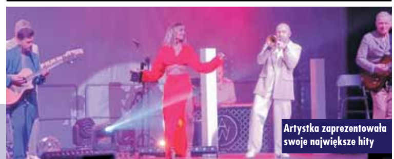
Artystka zaprezentowała swoje największe hity

żysz mnie”, „Oczy szeroko zamknięte”, „Księżyc nad Juratą”, „Lampa i sofa”, „Skrable” czy „Agnieszka”. Artystka porwała publiczność do zabawy i zachęcała do wspólnego śpiewu. Koncert był porywającym