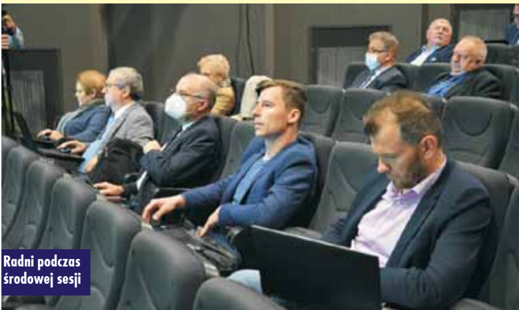
Radni podczas sesji

działań m.in. aplikowania o środki zewnętrzne na realizację inwestycji. W minionym roku radni zwiększali środki finansowe w budżecie z przeznaczeniem na tę inwestycję, nie zgłaszając żadnych uwag. Jeszcze w grudniu 2020 r. radni opowiedzieli się za realizacją inwestycji. Przy jednoznacznym poparciu Rady dla realizacji tej inwestycji wykonana