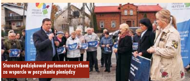
Starosta podziękował parlamentarzystkom za wsparcie w pozyskaniu pieniędzy

Koszt całkowity zadania – 15 000 000 zł, z czego dofinansowanie – 14 250 000 zł, a wkład własny Powiatu Kępińskiego – 750 000 zł. m