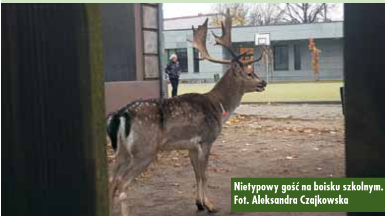
Nietypowy gość na boisku szkolnym.

Na koniec ciekawe pytanie – czy bohater filmu animowanego Walta Disney'a to właściwie jelen czy daniel? Oprac. KR