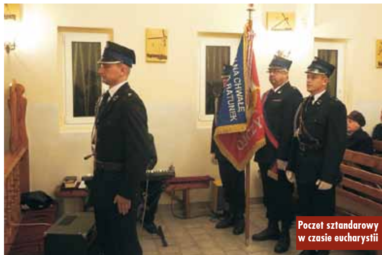
Poczet sztandarowy w czasie eucharystii

Niedzielną potyczka ze Słupią unaoczniała nam, jak mogą wyglądać pozostałe mecze „Zawiszy” w tej rundzie. Chcąc uniknąć katastrofy, rywale będą kopać wilcze doły już na swojej połowie, a Jurasika oblepiać trzema plastrami