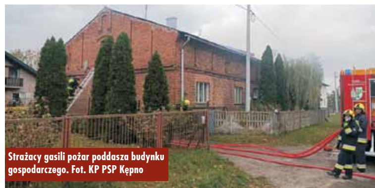
Strażacy gasili pożar poddasza budynku gospodarczego.

gaśnicze wody w natarciu na źródło pożaru oraz dwa w obronie na przyległy budynek mieszkalny. Działania te doprowadziły do lokalizacji pożaru. W celu całkowitego ugaszenia konieczne było usunięcie z wnętrza budynku słomy znajdującej się na poddaszu. Po usunięciu wszystkich materiałów palnych z poddasza oraz rozebraniu spalonej konstrukcji dachu wszystkie wyniesione i nadpalone elementy dokładnie przelano wodą. W trakcie działań właścicielka zgłosiła złe samopoczucie, spowodowane stresem. Strażacy udzielili jej wsparcia psychicznego. Po zakończeniu działań gaśniczych całość sprawdzono przy użyciu kamery termowizyjnej – nie stwierdzono innych innych zarzewi ognia. Budynek przewietrzono – relacjonuje oficer prasowy KP PSP Kępno kpt. Paweł Michalski . Oprac. KR