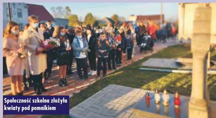
Spółeczność szkolna złożyła kwiaty pod pomnikiem

zespołowa praca plastyczna, której celem było wykonanie portretu patrona lub plakatu przybliżającego jego działalność. Uczniowie, podejmując się tego zadania, wykazali się niezwykłą pomysłowością i oryginalnością w