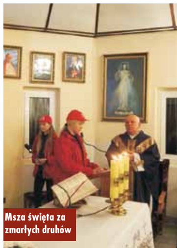
Msza święta za zmarłych druhów