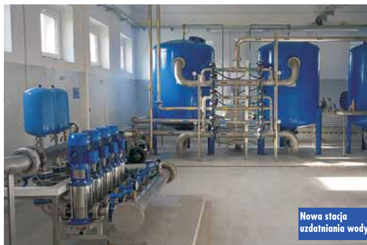
Nowa stacja uzdatniania wody

Zadanie realizowała firma „Hydro - Marko” z Jarocina. Koszt inwestycji wyniósł 1.056.570 złotych. Zadanie było częściowo sfinansowane z Rządowego Funduszu Inwestycji Lokalnych w ramach Funduszu przeciwdziałania COVID-19. Oprac. m