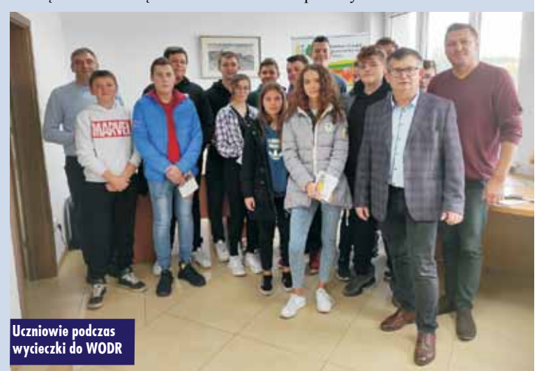
Uczniowie podczas wycieczki do WODR

i innym mieszkańcom obszarów wiejskich w zakresie sporządzania dokumentacji niezbędnej do uzyskania pomocy.