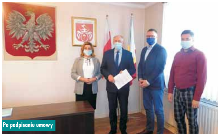
Po podpisaniu umowy