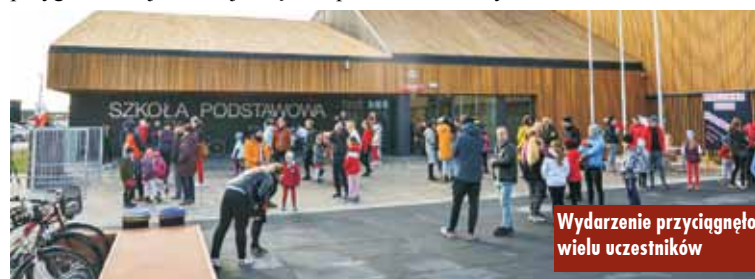
Wydarzenie przyciągnęło wielu uczestników