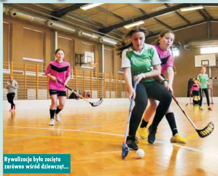
Rywalizacja była zacięta zarówno wśród dziewcząt...

Finał Powiatu w młodszych kategoriach rozegrano 2-3 listopada br. w Łęce Mroczeńskiej. Rewelacyjnie spisał się team z Baranowa. Pod-