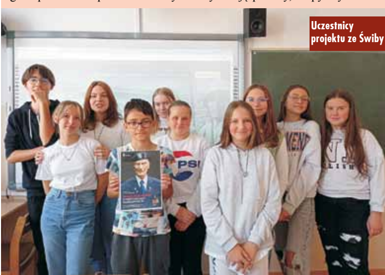
Uczestnicy projektu ze Świby