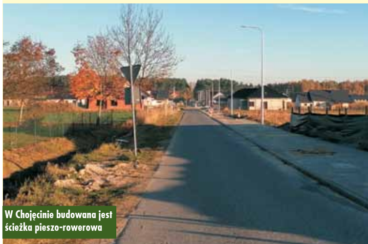
W Chojeńcu budowana jest ścieżka pieszo-rowerowa

zadania drogowe: droga wewnętrzna w Mnichowicach o długości około 260 m (dz. nr 242, od drogi powiatowej 5682P do przepompowni), droga wewnętrzna w Bralinie o długości około 410 m (od drogi wojewódzkiej nr 482 do posesji przy ul. Południowej 1) oraz droga wewnętrzna w Goli. Na realizację tych inwestycji Gmina Bralin pozyskała ze środków Woje-