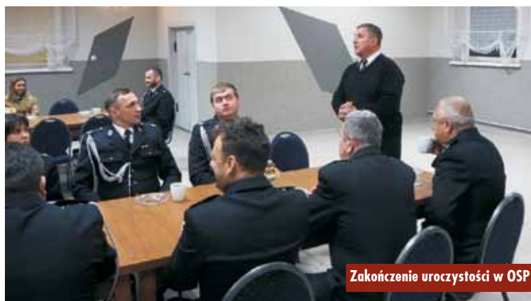
Zakończenie uroczystości w OSP