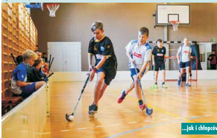
...jak i chłopców

W II Rodzinny Bieg Niepodległości zaangażowała się cała społeczność Szkoły Podstawowej w Baranowie. Rada Rodziców oraz nauczyciele starannie zaplanowali i przygotowali imprezę, a uczniowie wypełnili ją sportowym entuzjazmem. Na trasę wytyczoną obok szkoły, w sobotnie przedpołudnie, ruszyło blisko 200 biegaczy w siedmiu kategoriach