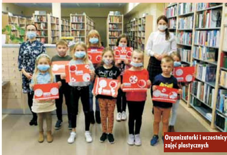
Organizatorki i uczestnicy zajęć plastycznych

Gmina Trzcinica rozstrzygnęła zapytanie ofertowe związane z usługami doradczymi i wdrożeniowymi przy realizacji projektu e-Urząd w gminie Trzcinica i podpisała umowę z wybranym wykonawcą