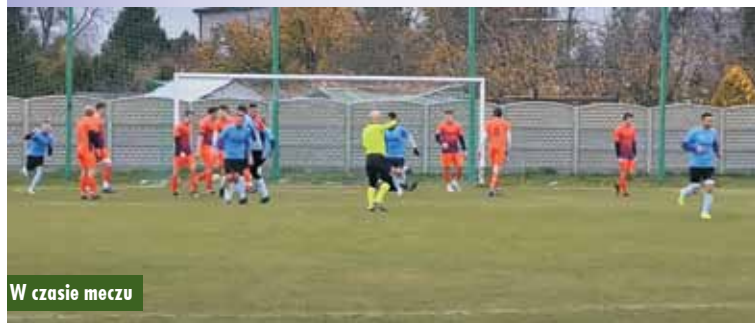
W czasie meczu