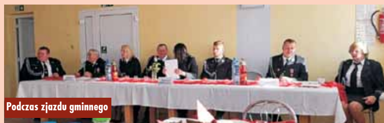
Podczas zjazdu gminnego

i wydarzenia OSP z ostatnich 5 lat. Dokonano również wyboru nowych władz Zarządu Oddziału Gminnego ZOSP RP w Rychtalu na lata 2021-2026, który ukonstytuował się nastę-