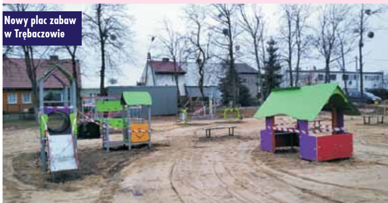
Nowy plac zabaw w Trębaczowie