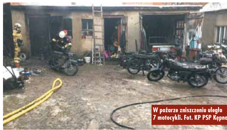
W pożarze zniszczeniu uległo 7 motocykli.

Oprócz budynku zniszczeniu uległo także 7 motocykli, które garażo-