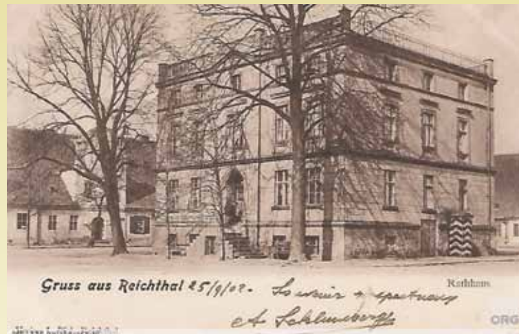
Ratusz w Rychtalu (1902 r.)

Namysłowski sąd wyznaczył rozprawę w tej sprawie na 8 listopada 1882 roku. Dodajmy jednak, że zdaniem „Norddeutsche Allgemeine Zeitung” rozprawa odbyć się miała z