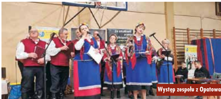
Występ zespołu z Opatowa

20 listopada br. w Ostrzeszowie odbył się konkurs na największą wielkopolską pyrę oraz najsmaczniejsze jadlo z ziemniaka. Organizatorem konkursu był Urząd Marszałkowski Województwa Wielkopolskiego w Poznaniu oraz ZS nr 1 w Ostrzeszowie.