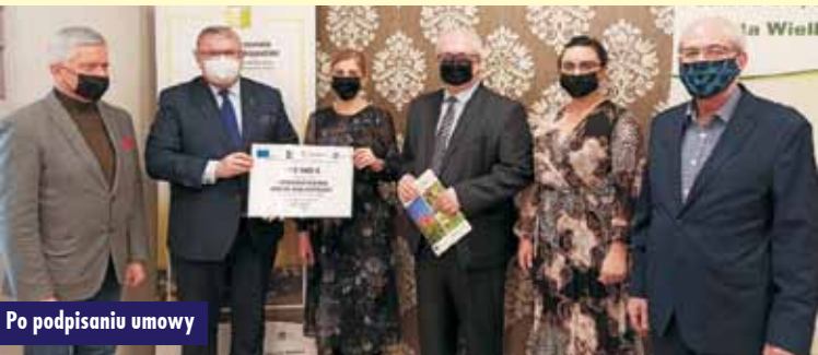
Po podpisaniu umowy

LSR na lata 2016-2023 oraz wydłużenia okresu jej realizacji o 2 lata w ramach Programu Rozwoju Obszarów Wiejskich na lata 2014-2020. Łączna przyznana kwota wyniosła 568 960 EUR, z czego 508 000 Euro zamierzamy przeznaczyć na wsparcie operacji w ramach naborów wniosków z