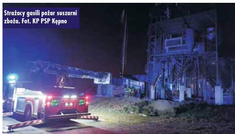
Strażacy gasili pożar suszarni zboża.

brak zagrożenia – relacjonuje oficer prasowy KP PSP Kępno kpt. Paweł Michalski . Oprac. KR