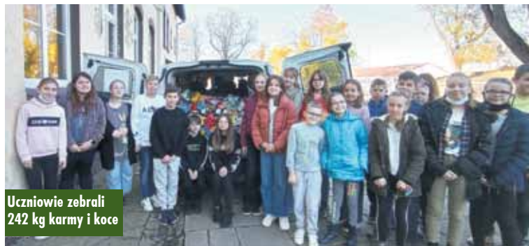
Uczniowie zebrali 242 kg karmy i koce