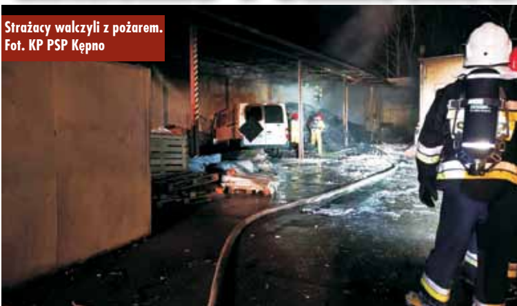
Strażacy walczyli z pożarem.

5 listopada br., o godzinie 17.41, do Stanowiska Kierowania Komen-danta Powiatowego Państwowej Straży Pożarnej w Kępnie wpłynęło zgłoszenie o pożarze wiaty magazynowej w miejscowości Osiny. Do zdarzenia zadysponowano zastępy z Jednostki Ratowniczo-Gaśniczej w Kępnie, OSP Kępno, OSP Szklarka Mielecka, OSP Chojęcín i OSP Bralin.