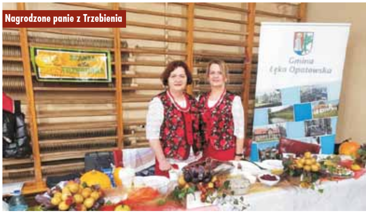
Nagrodzone panie z Trzebień