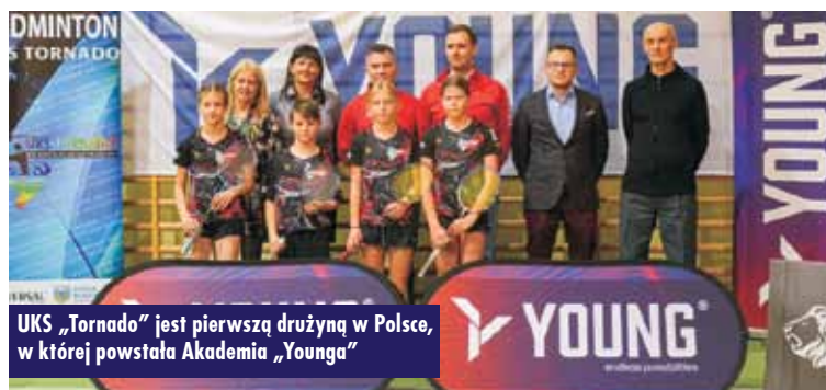
UKS „Tornado” jest pierwszą drużyną w Polsce, w której powstała Akademia „Younga”