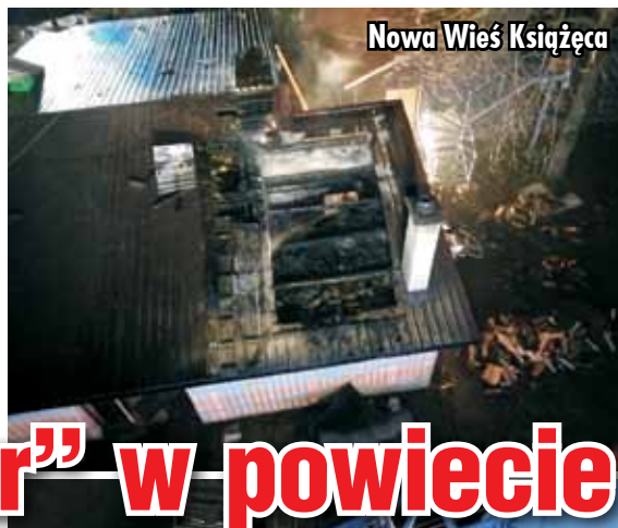
Nowa Wieś Książęca