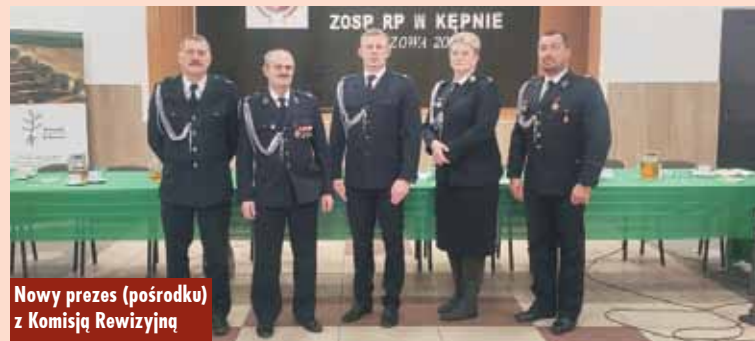
Nowy prezes (pośrodku) z Komisją Rewizyjną

Przedstawicielami do Zarządu Oddziału Powiatowego ZOSP RP w