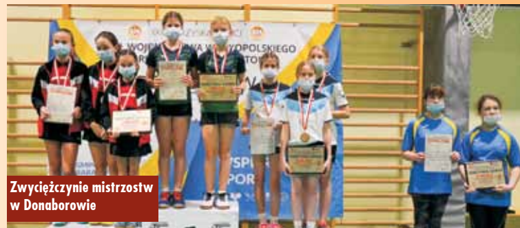
Zwycięzcy mistrzostw w Donaborowie