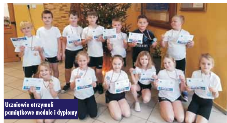
Uczniowie otrzymali pamiątkowe medale i dyplomy