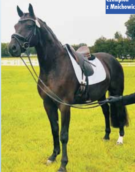
Czempion z Mnichowic

Należy tu podkreślić, że First Impression został wyhodowany przez Tadeusza Puchałę z Mnichowic i zarejestrowany w Polskim