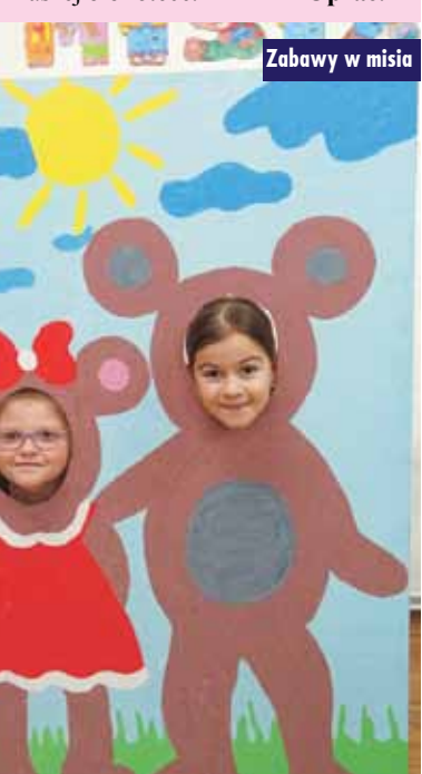
Zabawy w misia

przez siebie „misiowej torby”. Światowy Dzień Pluszowego Misia to również okazja do czytania i poznawania przygód Misia Uszatka, Kubusia Puchatka, Paddingtona czy też Misia Tulisia. Książki o tych misiowych bohaterach znajdziecie w naszej bibliotece. Oprac. m