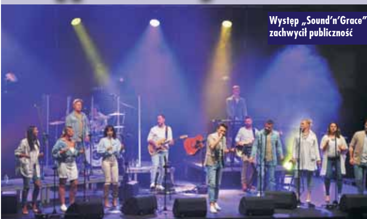
Występ „Sound’n’Grace” zachwylił publiczność

Z okazji 360-lecia lokacji Kępna w hali widowiskowo-sportowej w Kępnie odbył się koncert chóru „Sound’n’Grace”. Artyści zachwylił publiczność i porwali ją do tańca, zabawy i wspólnego śpiewu najbardziej popularnych utworów, takich jak: „100”, „Nadzieja”, „Dach”, „Idealnie” czy „Horyzonty”.