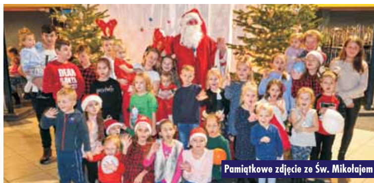
Pamiątkowe zdjęcie ze Św. Mikołajem

co niemiara w otoczeniu naszych dzielnych śnieżynki, elfów, słodczy i czapek mikołajowych. Atrybutami Św. Mikołaja są: siwa broda, pastorał, mitra oraz długa, czerwona szata biskupia. To dzieci wiedziały doskonale. Wszyscy miłusińscy, którzy przyszli na spotkanie ze Św. Mikołajem do mroczńskiego Domu Strażaka, bezbłędnie spełnili warunek, decydujący o otrzymaniu prezentu: gdy wspaniały gość zapytał, czy były grzeczne, chórem opowiedziały „Tak!”. 6 grudnia Św. Mikołaj odwiedził również wiele innych miejsc: szkoły, przedszkola... A do baranowskiego urzędu zawiątała grupa asystentek Św. Mikołaja, które wręczyły cudowne kartki świąteczne. es