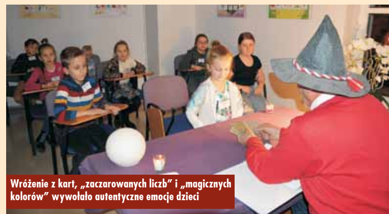
Wróżenie z kart, „zaczarowanych liczb” i „magicznych kolorów” wywołało autentyczne emocje dzieci

Właśnie poszerzanie horyzontów uczniów o wiedzę związaną z polską tradycją i obyczajowością stanowi