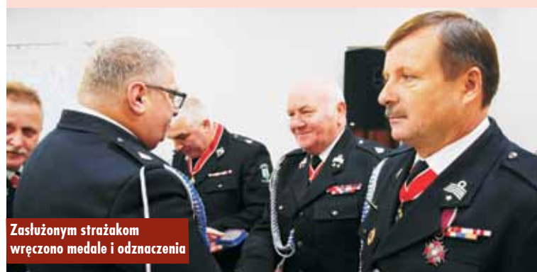
Zasłużonym strażakom wręczono medale i odznaczenia

– Czasy się zmieniają, jest coraz więcej zdarzeń, wśród których są nie tylko pożary, ale też zdarzenia drogowe i szereg innych akcji, do których wzywani są strażacy. Cieszy fakt, że ochotnicze straże pożarne coraz lepiej wyposażone są, również na terenie powiatu kępińskiego. Odbywają się też szkolenia, więc straża-