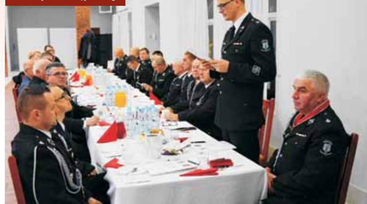
Delegaci z jednostek OSP z terenu powiatu kępińskiego

Wręczono także statuetki dla zasłużonych strażaków. KR