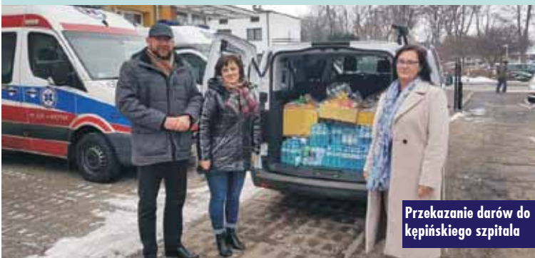
Przekazanie darów do kępińskiego szpitala

8 grudnia br. przekazano do szpitala w Kępnie. Tylko dzięki wspólnemu działaniu możliwe stało się wsparcie rzeczowe pacjentów oddziału COVID-19. Społeczność szkolna serdecznie dziękuje niezawodnym darczyńcom, którzy nie pozostali obojętni wobec osób w trudnej sytuacji zdrowotnej i przyłączyli się do akcji zbiórki artykułów żywnościowych. M. Oscenda