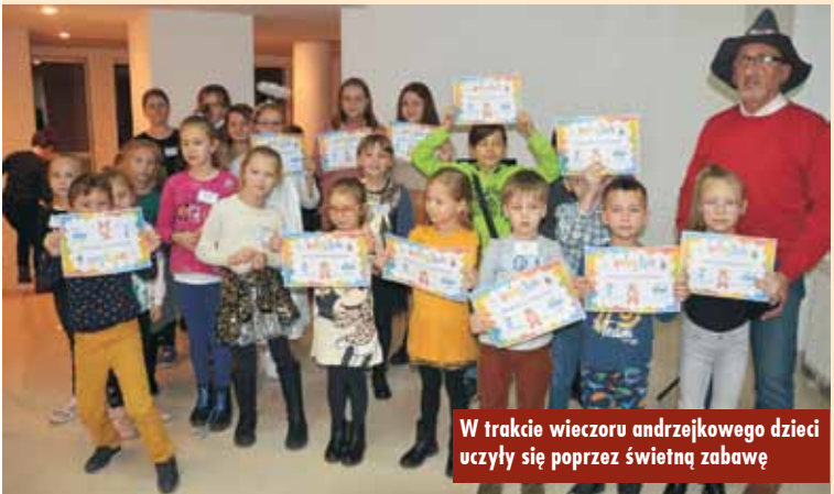
W trakcie wieczoru andrzejkowego dzieci uczyły się poprzez świetną zabawę

programu „Junior”, wspierającego naukę szkolną, jak również pozwalającego poprzez zabawę uczyć się oraz zapamiętywać na zasadzie skojarzeń. Wspólna andrzejkowa