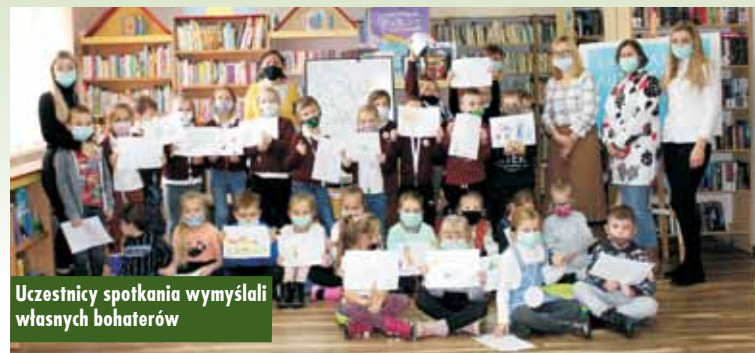
Uczestnicy spotkania wymyślili własnych bohaterów