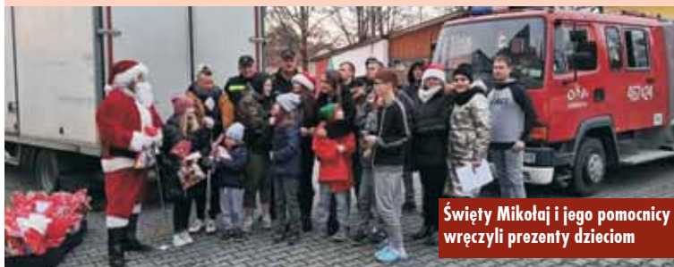
Święty Mikołaj i jego pomocnicy wręczyli prezenty dzieciom