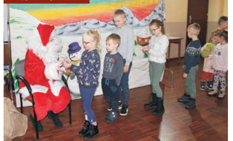
Spektakl zakończył się spotkaniem ze Świętym Mikołajem

KGW zaproponowało ciekawą inicjatywę warsztatową dla mieszkańców