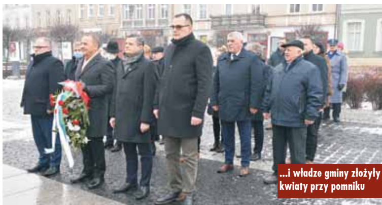
...i władze gminy złożyły kwiaty przy pomniku

ki Bogu, nie byliście jeszcze wtedy na świecie... Przypomnijcie sobie – my, świadkowie tych wydarzeń. Jak wielkim ciosem jest bestialstwo. Wszak dotknęło ono fizycznie dziesiątki tysięcy rannych i internowanych, ale raniło umysły i serca milionów – mówił burmistrz. - Zapamiętaj i mów wyraźnie, mów wprost. Ocal od zapomnienia ofiary. Naucz tych, którzy przyjdą po Tobie, że ich wolność miała swoją cenę, a Polak dla Polaka winien być siostrą lub bratem. Polak dla Polaka nie może być wrogiem. Nikt nas nie unicestwi, chyba, że zrobimy to sami – dodał.