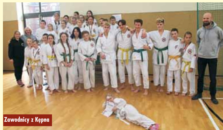
Zawodnicy z Kępna

Klub Ju-Jitsu Mohikan od 13 lat prężnie działa na naszym terenie i prowadzi zajęcia na dwóch salach treningowych w Kępnie. Gromadzi ludzi, których pasją jest rozwijanie siebie poprzez uprawianie wschod-