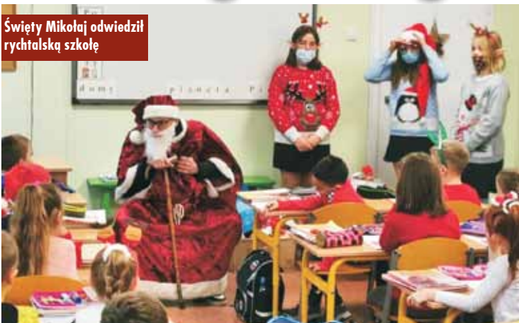
Święty Mikołaj odwiedził rychtańską szkołę

6 grudnia br. do Szkoły Podstawowej w Rychtalu zawiązał Święty Mikołaj. Wielu uczniów uważało dotychczas, że Święty Mikołaj to postać fikcyjna, o której się tylko mówi i którą się wspomina, gdy tradycyjnie w grudniu obdarowujemy prezentami bliskich. Ku zaskoczeniu wielu okazało się jednak, że tak nie jest. Społeczność szkolna zobaczyła na żywo Świętego Mikołaja, który faktycznie istnieje i przekonała się, że to nie bliscy, lecz właśnie on rozdaje prezenty i składa życzenia świąteczne.