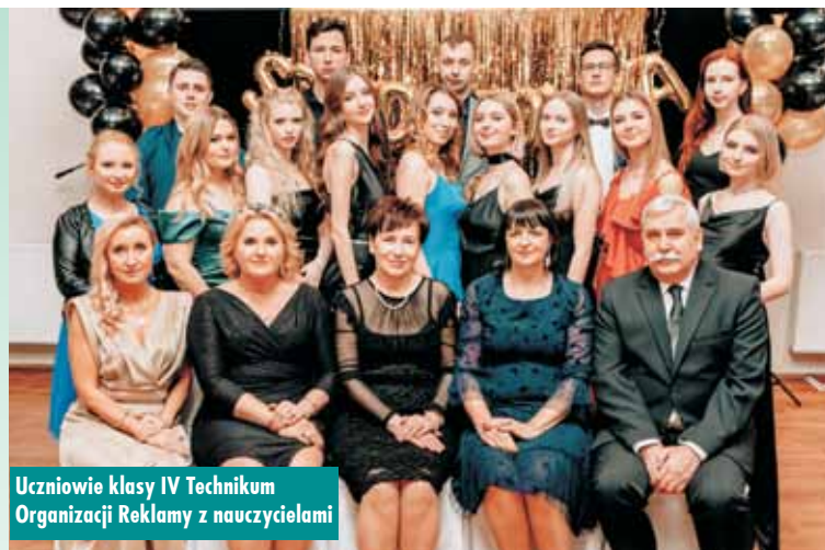
Uczniowie klasy IV Technikum Organizacji Reklamy z nauczycielami