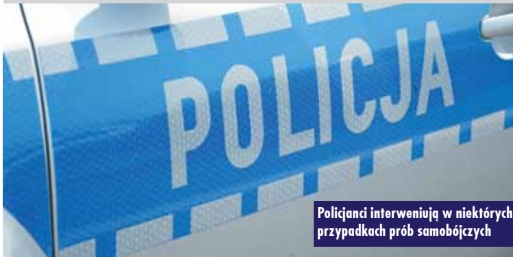
Policjanci interweniują w niektórych przypadkach prób samobójczych

instytucjami pomocowymi na szczeblu gminnym i powiatowym, które są wsparciem dla tych osób. Komenda Powiatowa Policji w Kępnie współpracuje z Powiatowym Centrum Pomocy Rodzinie w ramach realizacji programu „Środowiskowe Centrum Zdrowia Psychicznego dla dzieci i młodzieży”, skierowanego do dzieci i młodzieży z zaburzeniami psychicznymi, i objęcia ich kompleksowym