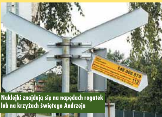
Naklejki znajdują się na napędach rogatki lub na krzyżach świętego Andrzeja

tym naklejkom PLK umieszczonym na przejazdach kolejowo-drogowych.