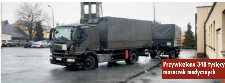
Przywieziono 348 tysięcy maseczek medycznych

dla mieszkańców powiatu kępińskiego. Maseczki zostaną przekazane do wszystkich urzędów gmin z obszaru powiatu, a te rozdysponują je wśród mieszkańców. Oprac. KR