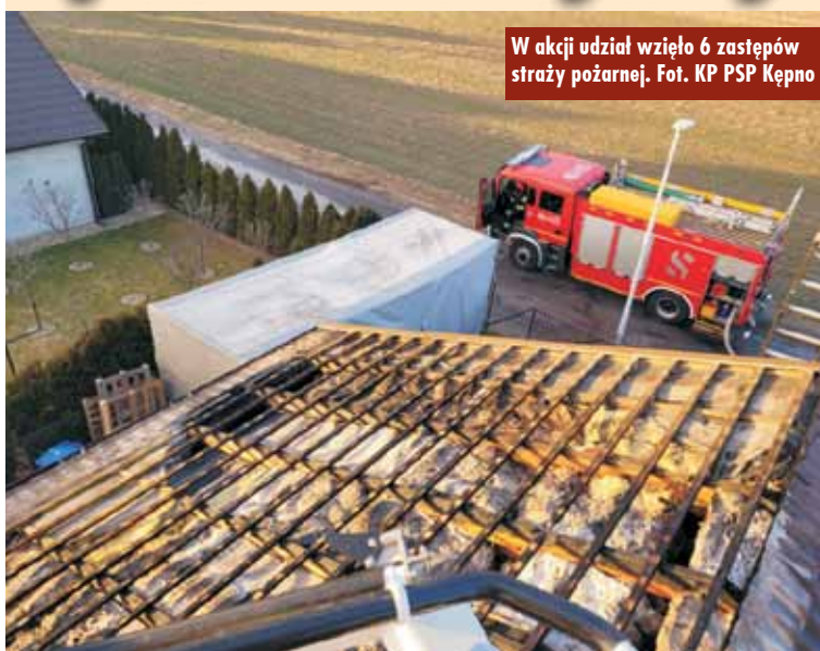
W akcji udział wzięło 6 zastępów straży pożarnej.

5 lutego br., o godzinie 14.35, dyżurny Stanowiska Kierowania Komendanta Powiatowej Państwowej Straży Pożarnej w Kępnie otrzymał zgłoszenie o pożarze budynku produkcyjnego w Krążkowach. Przybyli na miejsce strażacy zastali ukryty pożar poddasza budynku. Spod pokrycia dachowego wydobywał się dym. - Działania strażaków polegały na zabezpieczeniu miejsca zdarzenia oraz częściowej rozbiórce podbitki oraz poszycia dachu, dzięki czemu uzyskano dostęp do miejsca pożaru. Następnie strażacy przystąpili do działań gaśniczych - poinformował mł. kpt. Jakub Sobczak z KP PSP Kępno. W działaniach trwających ponad 3 godziny udział wzięło 6 zastępów straży pożarnej.