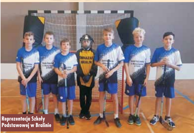
Reprezentacja Szkoły Podstawowej w Bralinie

Mistrzostwa Powiatu w Futsalu zostały rozegrane 11 stycznia br. w hali w Trębaczowie. Na starcie rozgrywek zameldowało się 7 szkół podstawowych z: Bralina, Trębaczowa, Perzowa, Domasłowa, Kępna, Krążkowych i Łęki Opatowskiej. Zespoły zostały podzielone na dwie grupy, w których rozgrywano mecze systemem „każdy z każdym”. Następnie rozegrano dwa półfinały oraz mecze o poszczególne miejsca. Ostatecznie po zaciętej rywalizacji reprezentacja z Bralina ukończyła turniej na trzecim miejscu, wygrywając ostatni mecz po rzutach karnych, a minimalnie przegrywając półfinał w ostatnich sekundach z późniejszym triumfotorem zawodów.