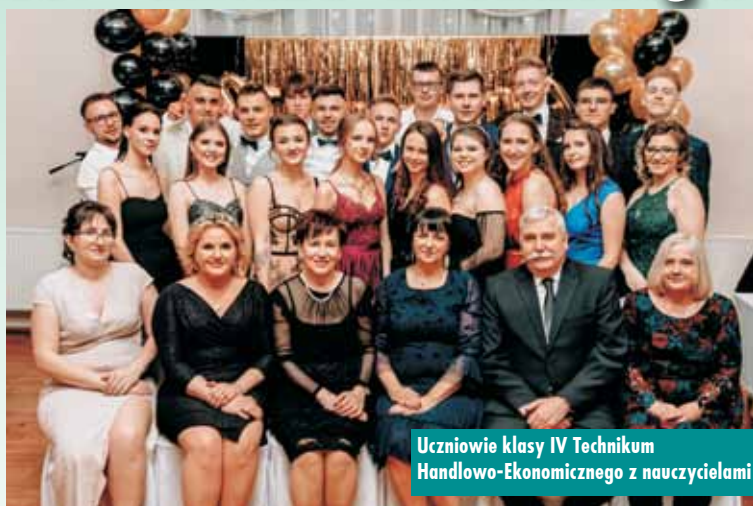
Uczniowie klasy IV Technikum Handlowo-Ekonomicznego z nauczycielami