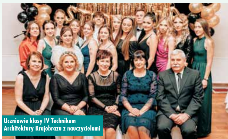
Uczniowie klasy IV Technikum Architektury Krajobrazu z nauczycielami

W Kępnie działa gminny punkt konsultacyjno-informacyjny, zajmujący się kompleksową pomocą związaną z realizacją programu „Czyste powietrze”