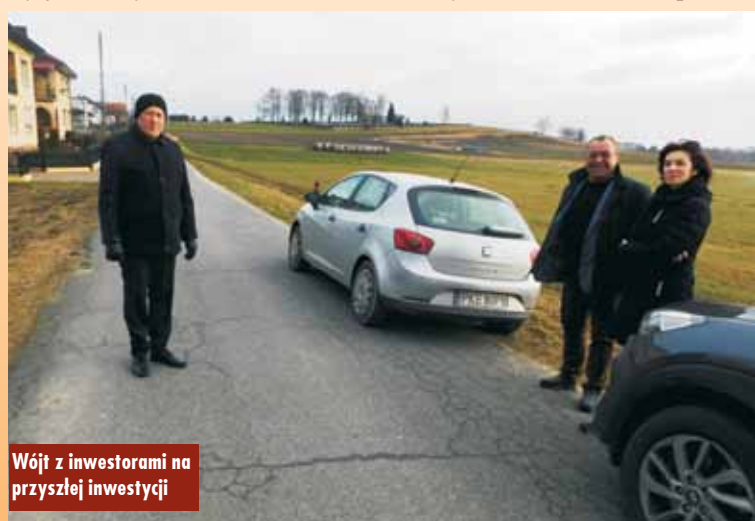
Wójt z inwestorami na przyszłej inwestycji

Pozostałe środki w wysokości 638 964,25 zł pochodzą z budżetu Gminy Trzcinica. Oprac. m