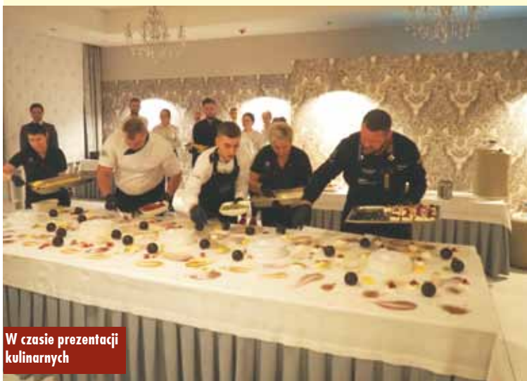
W czasie prezentacji kulinarnych

Powiększył się skład Kępińskiej Rady Sportu