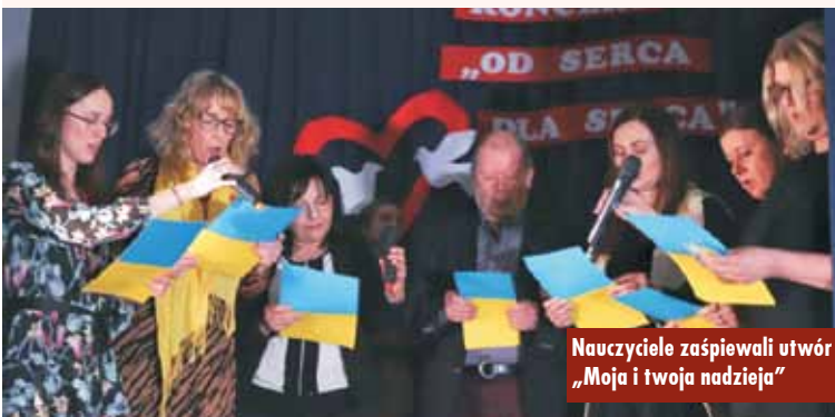
Nauczyciele zaśpiewali utwór „Moja i twoja nadzieja”