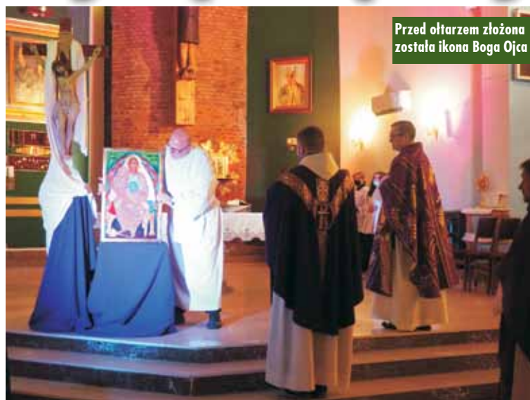
Przed ołtarzem złożona została ikona Boga Ojca

Szefowie kuchni w restauracji „Kamiński” zaprezentowali swoje umiejętności kulinarne na degustacyjnej kolacji