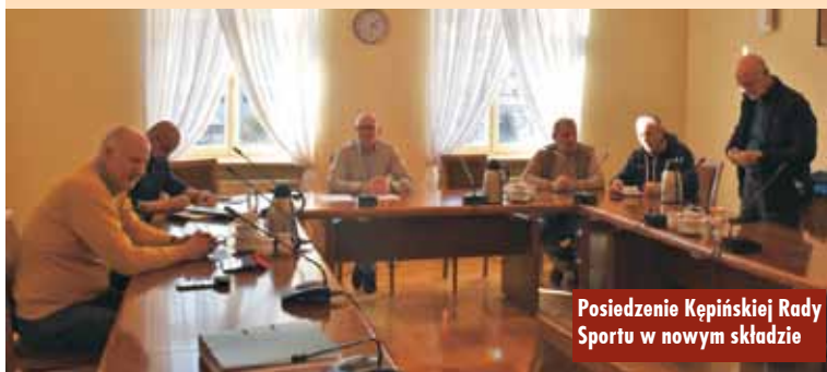
Posiedzenie Kępińskiej Rady Sportu w nowym składzie