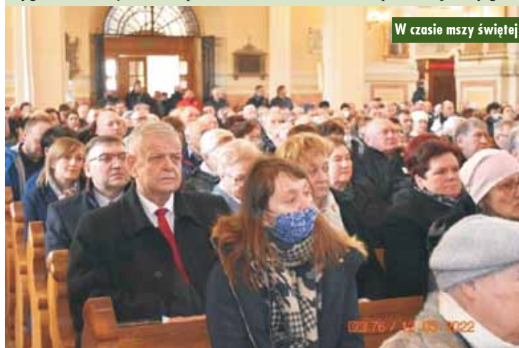
W czasie mszy świętej