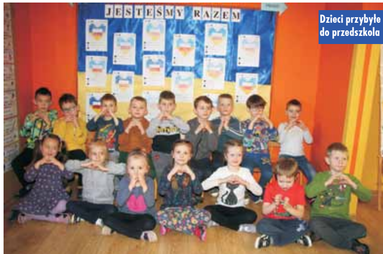
Dzieci przybyłe do przedszkola

matkom z dziećmi. - W zaistniałej sytuacji wojny na Ukrainie pomagamy i w miarę naszych możliwości