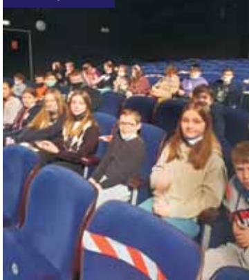
W czasie spektaklu teatralnego

dzała widzów wyśmienita gra aktorów, nastrojowa i liryczna muzyka, a także scenografia w kolorach białoczarnych. Po sztuce, uczniowie udali się do Parku Trampolin „Odszkodnia”, gdzie dali upust swojej aktywności i sprawnościom fizycznym. Wspólny wyjazd klas VII był bardzo udany. Po nauce zdalnej był okazją do integracji, rozmów, wspólnego spędzenia czasu i rozrywki.