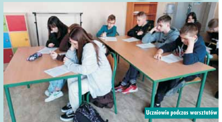
Uczniowie podczas warsztatów

Program „Bycie asertywnym drogą do zdecydowania” skierowany był dla uczniów klas IV i V. Celem programu było ukazanie asertywności jako niezbędnej umiejętności, dzięki której można uniknąć wielu kłopotów (wagarów, kradzieży, ryzykownych zachowań, takich jak picie alkoholu czy palenie papierosów, itp.). Jest to szczególnie ważne dla