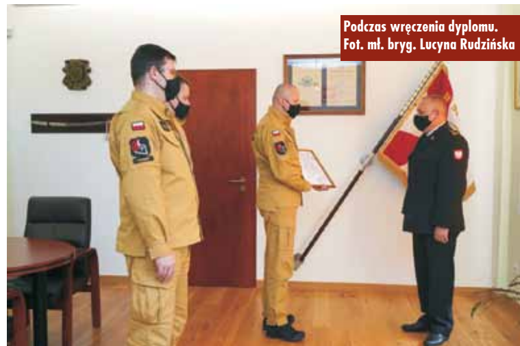
Podczas wręczenia dyplomu.