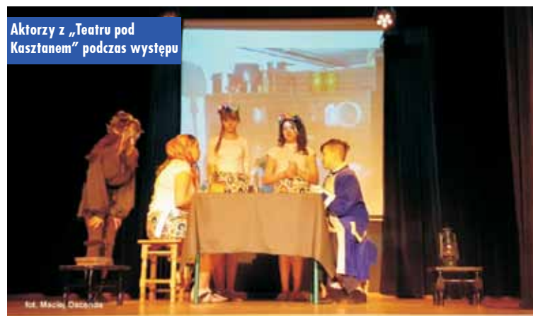
Aktorzy z „Teatru pod Kasztanem” podczas występu