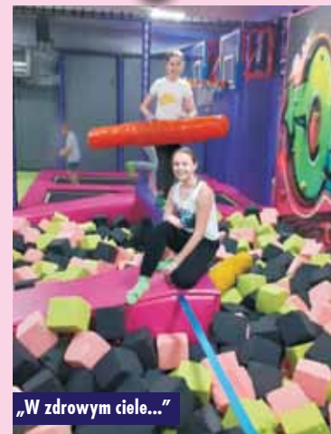
„W zdrowym ciele...”