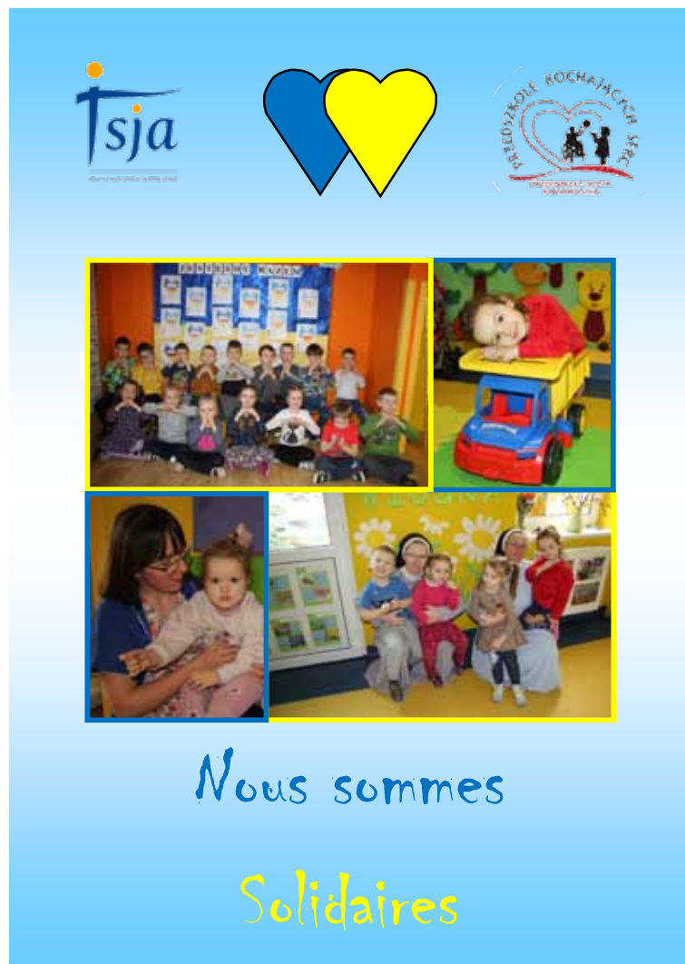
Plakat wykonany przez dzieci z Ukrainy dla rówieśników z Kępna

ukraińskich – uchodźców jest to kwota 665 €. - Ten fakt jest dla mnie niezmiennie wzruszający, że dzieci z in-