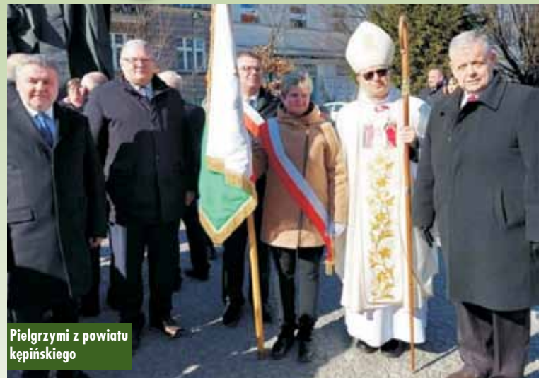
Pielgrzymi z powiatu kępińskiego

W drodze powrotnej ze Stawiszyna delegacja kępińska odwiedziła Pałac Myśliwski Radziwiłłów w Antoni-