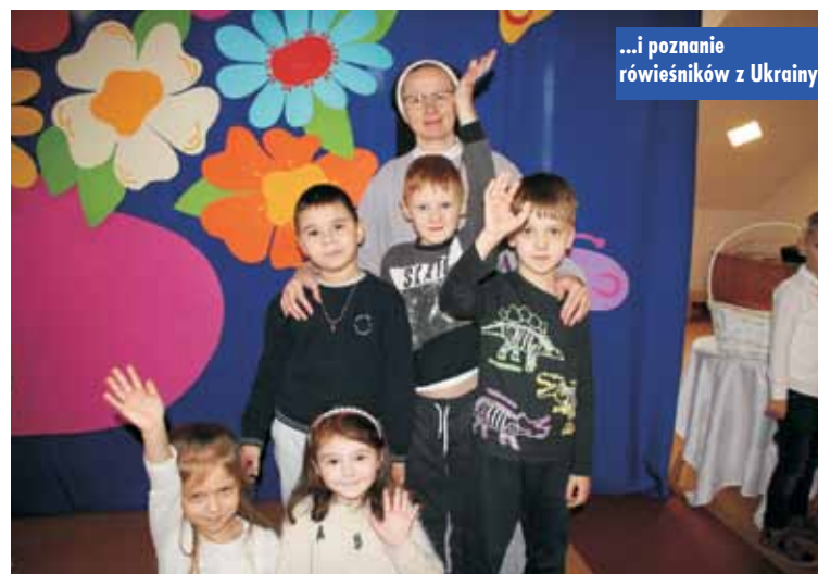
...i poznanie rówieśników z Ukrainy

Dyrektorka przedszkola podkreśla, że nadal będzie przyjmować według potrzeby dzieci uchodźców, których matki do nich się zgłaszają.