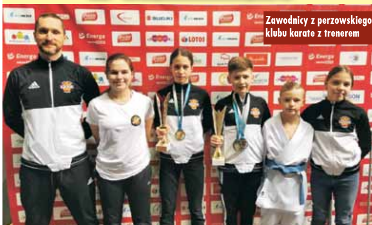
Zawodnicy z perzowskiego klubu karate z trenerem