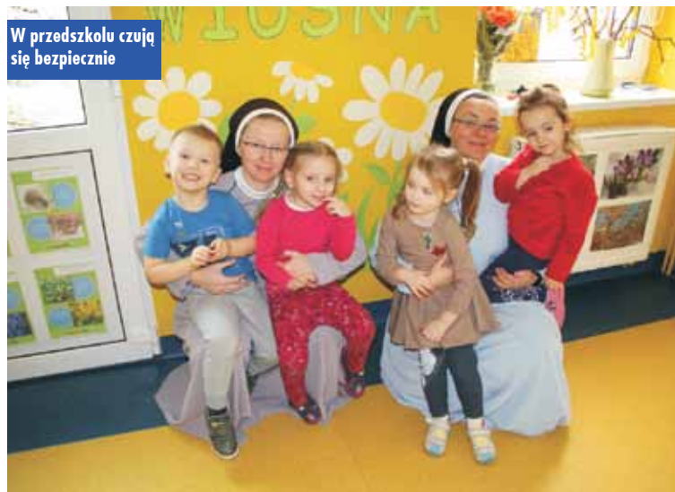
W przedszkolu czują się bezpiecznie

nej zagranicznej szkoły zrobiły takie wyrzeczenie dla nas – to naprawdę wzrusza – stwierdza Boromeuszka.