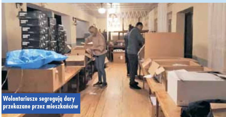
Wolontariusze segregują dary przekazane przez mieszkańców

mieszkańców są na bieżąco sortowane i transportowane. Wolontariusze to Ukraińcy, którzy są bardzo zaangażowani w pomoc swoim rodakom walczącym o ojczyznę, pomagają również w punkcie, sortując przekazane produkty i organizując transport. Duża część przekazanych produktów już dotarła na Ukrainę. Dzięki wspólnym działaniom można skutecznie pomagać. Brawa należą się wszystkim, którzy już włączyli się tę lub każdą inną zbiórkę!