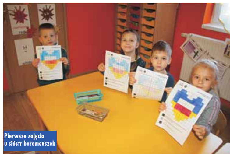
Pierwsze zajęcia u sióstr boromeuszek

był u nas oraz zapewnić zatrudnienie przynajmniej tymczasowo dwóm paniom z Ukrainkom – informuje s.