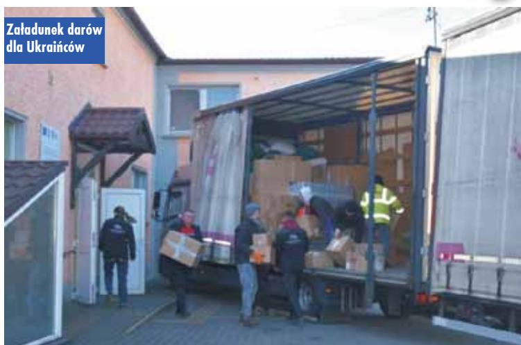
Załadunek darów dla Ukraińców

Zbiórka rozpoczęła się 28 lutego br. Zbierano najpotrzebniejsze artykuły spożywcze, środki czystości, pościel, odzież i wodę. We wszystkich Domach Ludowych do 9 marca można było przekazać pomoc rzeczową, było to koordynowane przez sołtysów poszczególnych sołectw. Podobnie Zespół Szkół w Laskach i Zespół Szkół w Trzcinicy przeprowadziły swoje zbiórki, przekazując zebrane artykuły do Domów Lu-