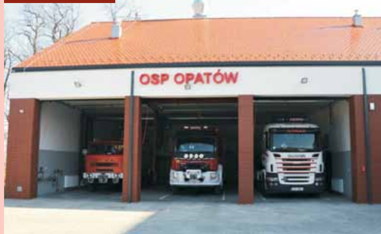
Nowa remiza OSP Opatów

11 marca w Polsce obchodzony jest Dzień Sołtysa