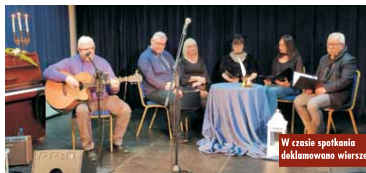
W czasie spotkania deklamowano wiersze