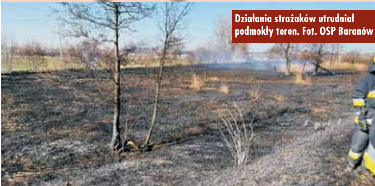
Działania strażaków utrudniał podmokły teren.

12 marca br., o godzinie 12.54, do Stanowiska Kierowania Komendanta Powiatowej Państwowej Straży Pożarnej w Kępnie wpłynęło zgłoszenie o pożarze trzciny na nieużytkach rolnych przy ul. Armii Krajowej w Kępnie.