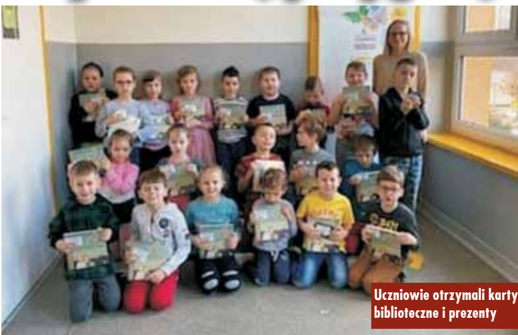
Uczniowie otrzymali karty biblioteczne i prezenty

Pasowanie na czytelnika to oficjalne przyjęcie najmłodszych uczniów do grona czytelników biblioteki szkolnej. Wtedy zaczyna się niesamowita, czytelnicza przygoda dzieci, które mogą już same czytać.