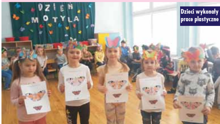
Dzieci wykonywały prace plastyczne