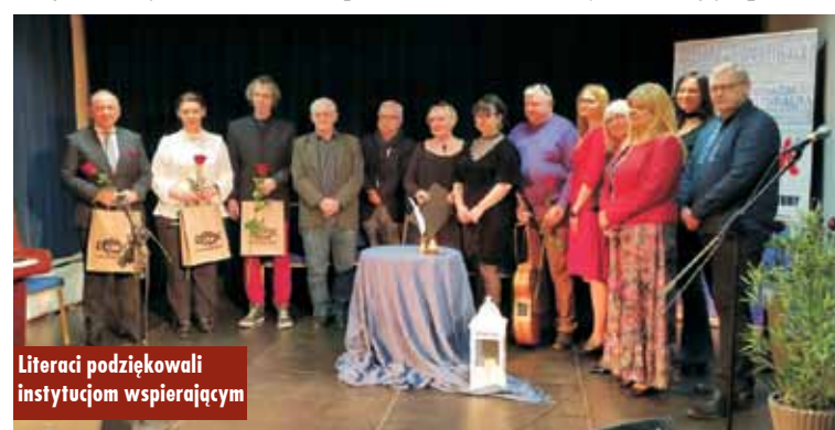
Literaci podziękowali instytucjom wspierającym

- Dzisiejszy wieczór mogę uznać za bardzo udany. Słuchając państwa