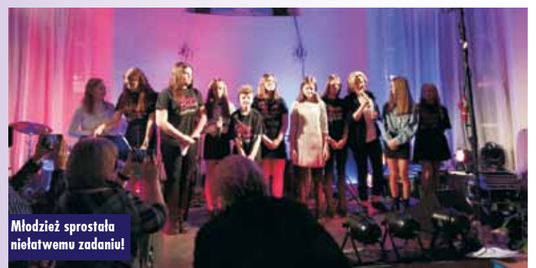
Młodzież sprostała niełatwemu zadaniu!

kompozycji poprzedzona była omówieniem jej historii, a także emocjonalną recytacją tekstu.