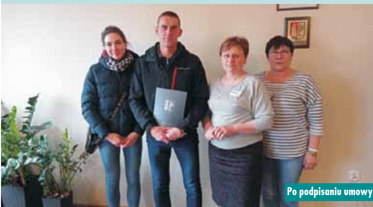
Po podpisaniu umowy

W Urzędzie Gminy podpisano umowy na realizację zadań publicznych. Dofinansowanie otrzymało 5 organizacji na realizację działań w