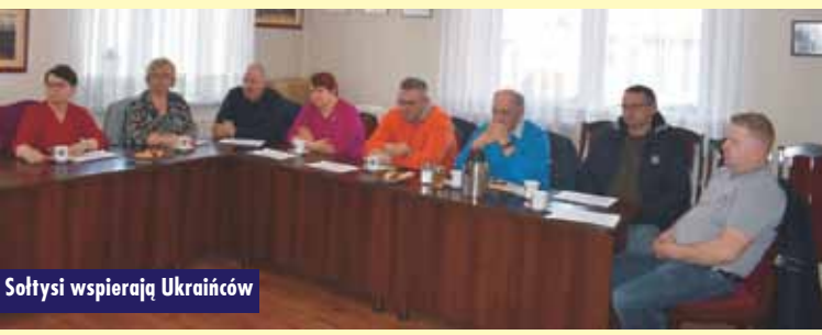
Sołtysi wspierają Ukraińców

Zatrzymany przez policję 46-latek nie posiadał uprawnień do kierowania pojazdami