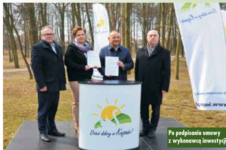
Po podpisaniu umowy z wykonawcą inwestycji

Rewitalizacja Parku Miejskiego zostanie zrealizowana w ciągu najbliższych 12 miesięcy. KR