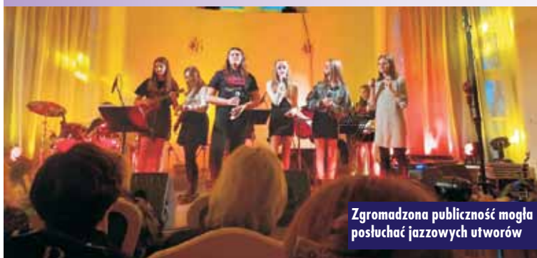
Zgromadzona publiczność mogła posłuchać jazzowych utworów