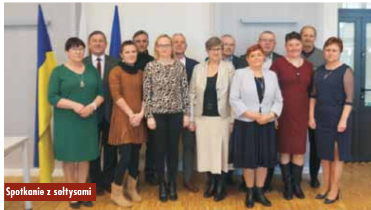
Spotkanie z sołtysami

W niedzielę w gminie Łęka Opatowska odbył się halowy turniej piłki nożnej