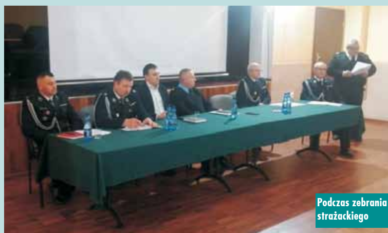
Podczas zebrania strażackiego