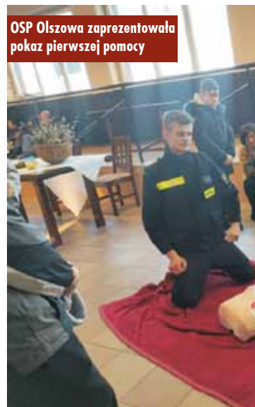
OSP Olszowa zaprezentowała pokaz pierwszej pomocy