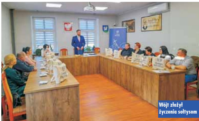
Wójt złożył życzenia sołtysom

Dzień Motyla w Przedszkolu Samorządowym w Rychtalu