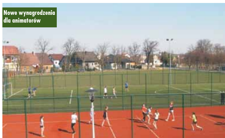
Nowe wynagrodzenia dla animatorów