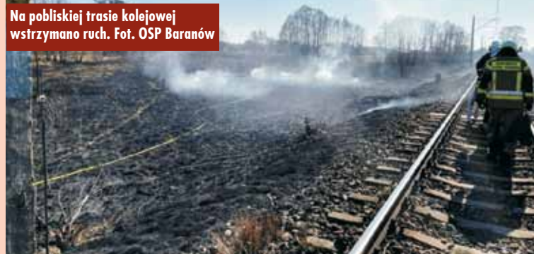
Na pobliskiej trasie kolejowej wstrzymano ruch.

znajdującej się w bliskim sąsiedztwie terenu objętego pożarem.