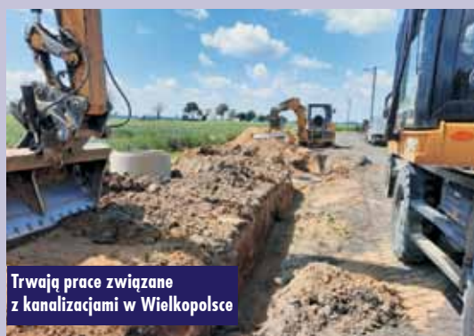
Trwają prace związane z kanalizacją w Wielkopolsce

Nabór realizowany jest w ramach poddziałania „Wsparcie inwestycji związanych z tworzeniem, ulepszeniem lub rozbudową wszystkich rodzajów małej infrastruktury, w tym inwestycji w energię odnawialną i w oszczędzanie energii”. Dofinansowanie przewidziano dla inwestycji na terenach miejscowości do 5 tys. mieszkańców. Ponadto zwiększeniu uległ maksymalny limit środków który obecnie wynosi aż do 5 mln zł na beneficjenta. Wnioskodawcy mogą również ubiegać się o dofinansowanie do 100% kosztów kwalifikowalnych. Ponadto rozszerzono zakres wsparcia o możliwość budowy lub przebudowy podziemnych zbiorników retencyjnych o łącznej pojemności co najmniej 100m³. Nabór wniosków odbędzie się w terminie 1-15 kwietnia 2022 r. Oprac. m