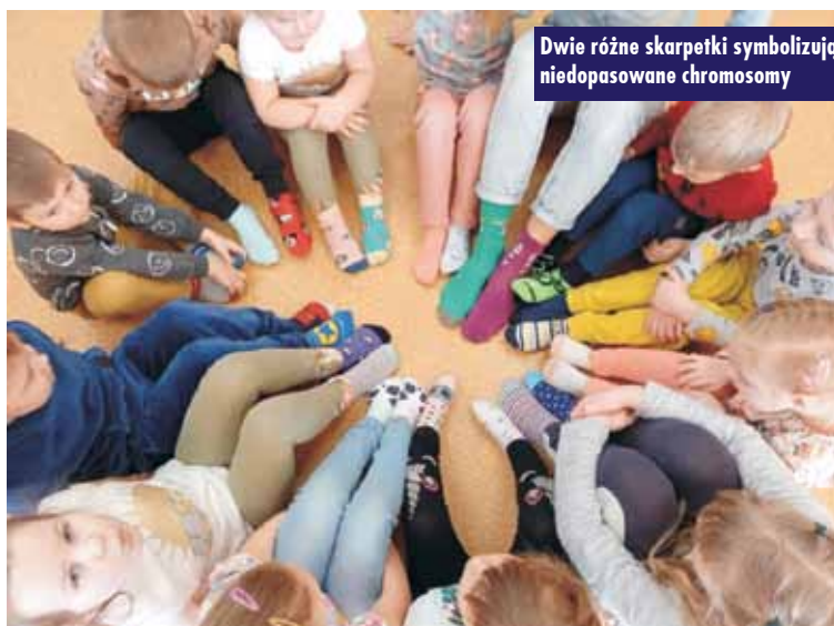
Dwie różne skarpetki symbolizują niedopasowane chromosomy

jak ozdobienie skarpetki czy projektowanie dwóch różnych skarpet. W ten sposób uczniowie pokazali, że