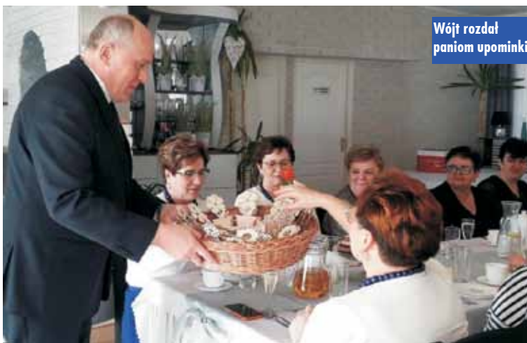
Wójt rozdał paniom upominki