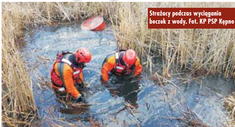
Strażacy podczas wyciągania beczek z wody.

7 marca br., o godzinie 10.56, do Stanowiska Kierowania Komendanta Powiatowej Państwowej Straży Pożarnej w Kępnie wpłynęło zgłoszenie o porzuconych beczkach w stawie. Na miejsce zadysponowano zastępy z Jednostki Ratowniczo-Gaśniczej (JRG) w Kępnie i OSP Perzów.