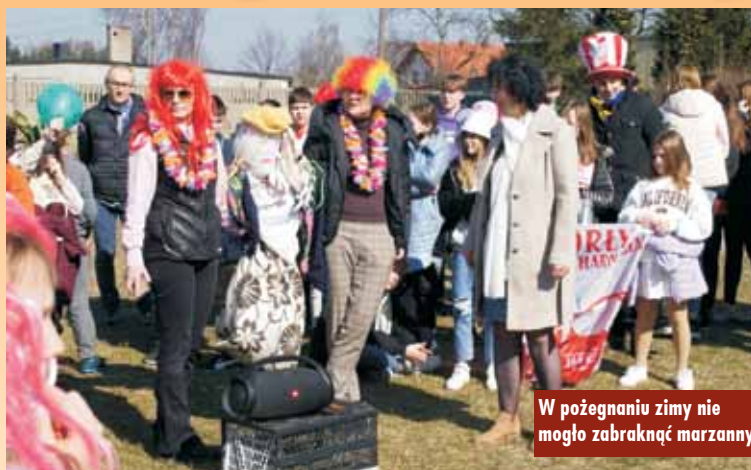
W pożegnaniu zimy nie mogło zabraknąć marzanny

Uczniowie Szkoły Podstawowej im. Mikołaja Kopernika w Bralinie przemaszerowali tego dnia ulicami Bralina, by uroczystie powitać wiosnę. Pogoda była znakomita – było