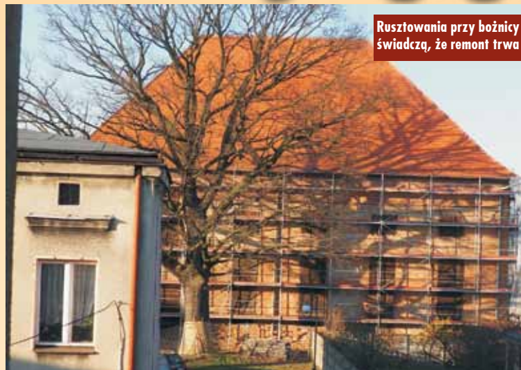
Rusztowania przy bożnicy świadczą, że remont trwa