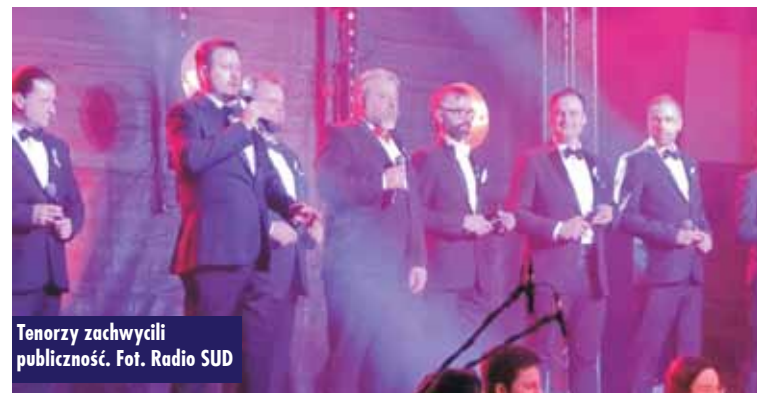
Tenorzy zachwycili publiczność.

Kępińscy policjanci zatrzymali 23-latkę, który kierował samochodem, pomimo wydanego przez Sąd Rejonowy w Kępnie zakazu prowadzenia pojazdów. Ponadto mężczyzna znajdował się pod wpływem środków odurzających oraz posiadał przy sobie środki zabronione