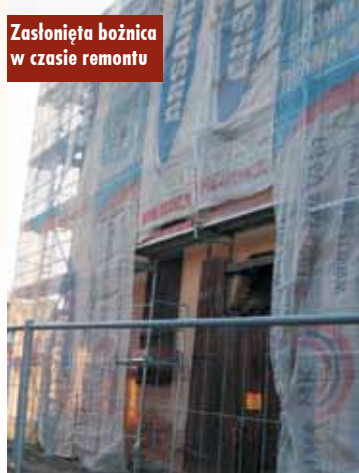
Zastłonięta bożnica w czasie remontu