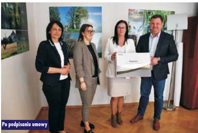
Po podpisaniu umowy