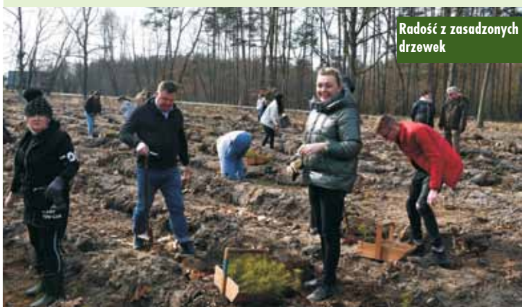
Radość z zasadzonych drzewek

Nowy sprzęt trafił na Oddział Ginekologiczno-Położniczy szpitala w Kępnie