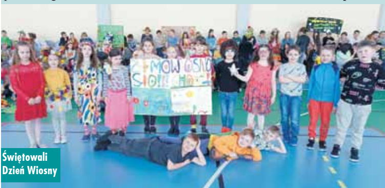
Świętowali Dzień Wiosny