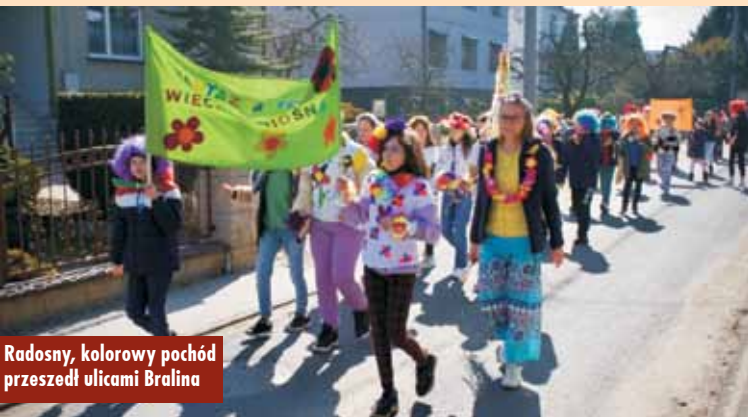
Radosny, kolorowy pochód przeszedł ulicami Bralina

słonecznie i ciepło, a oznaki wiosny spotkać można było na każdym kroku. Kolorowy i głośny pochód z marzanną na czele zawędrował na plac za Świątlicą Środowiskowo-Profilaktyczną „Tęcza” w Bralinie, aby tam zaprezentować swoje przebrania i pożegnać zimę. Rada Rodziców przygotowała słodkie upominki dla wszystkich uczniów, a dla zwycięzców konkursu na najciekawsze klasowe przebranie przewidziano pizzę lub tort.