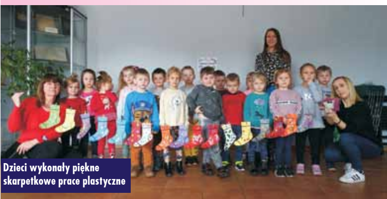
Dzieci wykonały piękne skarpetkowe prace plastyczne