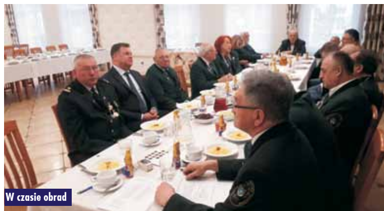
W czasie obrad

i nadal oczekujemy na takiego zawodnika, który przysporzy chwały naszemu regionowi. Sukcesem Bractwa jest współpraca z I LO w Kępnie. Drużyna męska we wrześniu 2022 r. zdobyła mistrzostwo Polski w zawodach sportowo – obronnych.