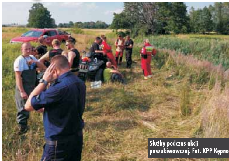
Służby podczas akcji poszukiwawczej.

Poszukiwania zakończyły się 4 lipca br., około godziny 16.00. Wówczas w rejonie rzeki Proсна pod Kostowem odnaleziono ciało 71-latki. Na miejscu pracowała