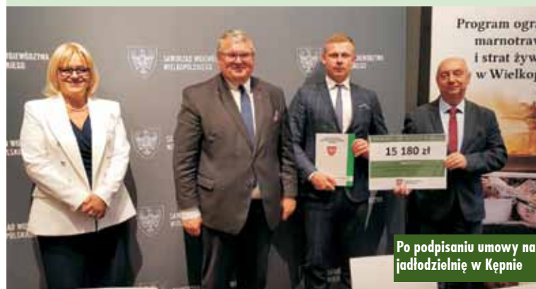
Po podpisaniu umowy na jadłodzielnię w Kępnie

cjatyw mieszkańców województwa wielkopolskiego na rzecz ograniczania marnotrawstwa i strat żywności w Wielkopolsce oraz wzrostu świadomości konsumentów na temat ra-