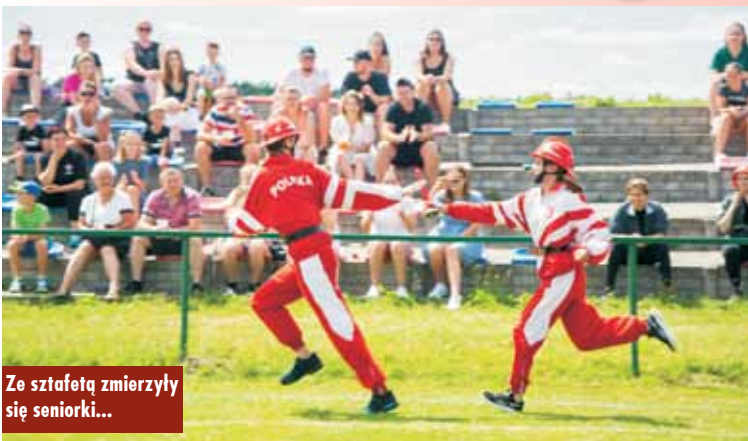
Ze sztafetą zmierzyły się seniorzy...

Gospodarzem tegorocznych Gminnych Zawodów Sportowo-Pożarniczych była OSP Słupia pod Kępem. Nad prawidłowym przebiegiem zawodów czuwała komisja sędziowska. Warto zaznaczyć, że oprócz szybkości w wykonywaniu zadań, liczyła się również precyzja, gdyż za błędne wykonanie naliczane były punkty karne. Jako pierwsze w konkurencjach zmierzyły się kobiece drużyny pożarnicze z OSP Donaborów, Jankowy i Słupia pod Kępem. Potem przyszedł czas na męskie drużyny pożarnicze z OSP Baranów, Donaborów, Grębanin, Jankowy, Jo-