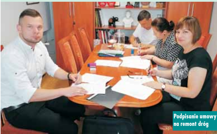
Podpisanie umowy na remont dróg

Postępowanie przeprowadzone było z fakultatywnymi negocjacjami, zastosowanymi w celu uzyskania jak najkorzystniejszej oferty cenowej.