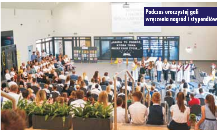
Podczas uroczystej gali wręczenia nagród i stypendiów