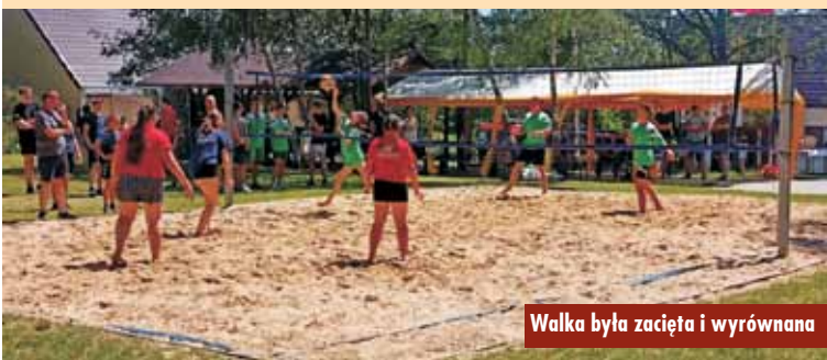
Walka była zacięta i wyrównana

siatkowej plażowej. Jednostki z terenu gminy Bralin odpowiedziały na zaproszenie OSP Czermin pozytywnie.