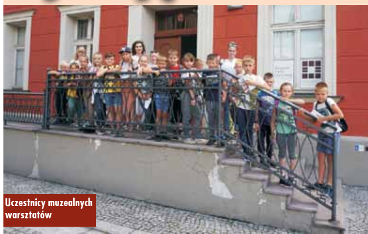
Uczestnicy muzealnych warsztatów

7 lipca br. odbyły się w muzeum zajęcia pt. „Wycinanki ludowe” podczas, których wykonywane były papierowe dzieła sztuki. Uczestnicy poznali różnorodne wycinanki – od łowickich, rawskich, kurpiowskich po sieradzkie czy lubelskie. Tworzenie ich wszystkich wymaga niezwykłej precyzji, cierpliwości i z pewnością sprawności, ale dzieci udowodniły, że nie brakuje w nich chęci wycinania. Podczas prezentacji omówione zostały najczęściej wycinane przedstawienia jak drzewa kwiatowe, postacie kobiece oraz motywy koguta. Na warsztatach odbiorcy nauczyli się także odrysowywać trzy rodzaje wycinanek: leluję kurpiowską, lalki kołbielskie i różgę rawską. Oprac. m