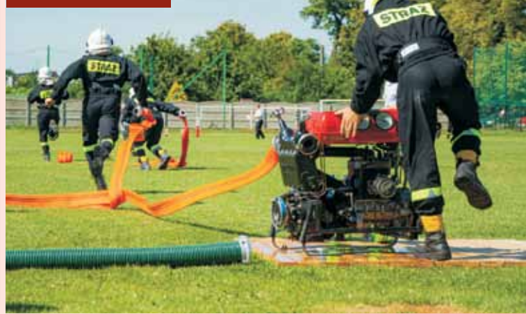
Drużyny rywalizowały także podczas ćwiczenia bojowego

Wójt gminy Baranów przyznała stypendia i nagrody wyróżniającym się uczniom szkół podstawowych. Uroczysta gala miała miejsce 24 lipca br. w Szkole Podstawowej w Baranowie