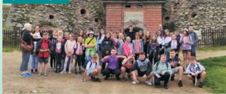
Pamiątkowe zdjęcie z wycieczki na Dolny Śląsk