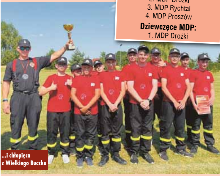
...i chłopięca z Wielkiego Buczku

„Człowiek uczy się na błędach - tym razem zabrakło decyzji i pewności siebie”