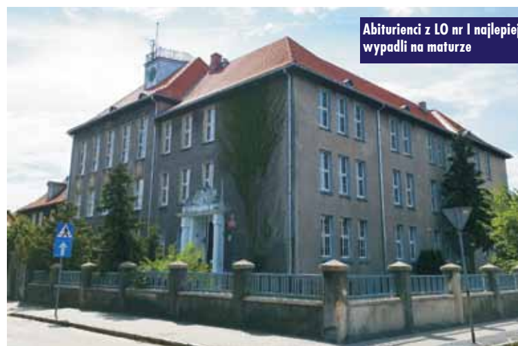
Abiturienti z LO nr 1 najlepiej wypadli na maturze

dzko wysoki procent uczniów, którzy chcą zdawać maturę, utrzymuje się w naszym powiecie od wielu lat. W liceach wyniósł on 100%, a w technikach 97,0% - informuje Andrzej Józwiak naczelnik wydziału oświaty