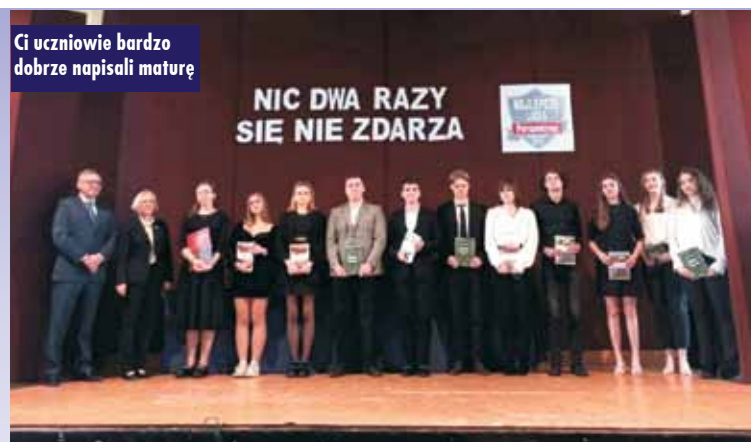
Ci uczniowie bardzo dobrze napisali maturę

w ramach programu, robią pierwszy krok do wzrostu świadomości mieszkańców, racjonalnego kupowania oraz ograniczenia marnowania nadwyżek żywności, będących w