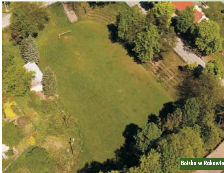
Boisko w Rakowie

uzyskało 36 zadań na łączną kwotę niespełna 350 tys. zł.