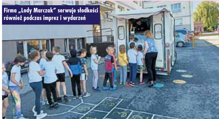
Firma „Lody Marczak” serwuje słodkości również podczas imprez i wydarzeń

znajduje się na kępińskim Rynku, wciąż przyciąga tłumy mieszkańców, a „Lody Marczak” znane są również w Szczecinie, gdzie od 2012 r. z dużym