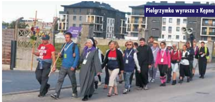
Pielgrzymka wyrusza z Kępna

12 lipca br., po rannej mszy świętej, grupa pokutna, a po niej wują intencje, potrzeby duchowne, a wśród młodych, chęć spróbowania