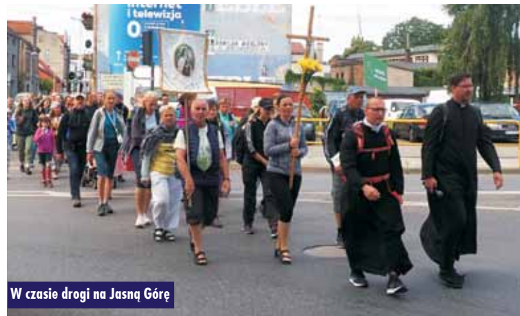
W czasie drogi na Jasną Górę

grupa wielebna kontynuowała swoją podróż na Jasną Górę. Podczas zbiórki, po eucharystii w kościele św. Marcina, uczestnicy chętnie podzielili się swoimi przemyśleniami dotyczącymi pielgrzymowania. Warto pielgrzymować, żeby znaleźć drogę do Pana Boga, żeby mieć możliwość oderwania się od rzeczywistości, wyciszenia się. - Pielgrzymka jest doświadczeniem innej rzeczywistości, kiedy możemy odkryć siebie, poznać Pana Boga, nowych ludzi. To jest najbardziej wartościowe – stwierdza jeden z pątników. Pielgrzymów do dalszej drogi moty-