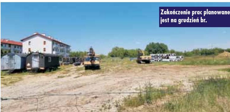
Zakończenie prac planowane jest na grudzień br.