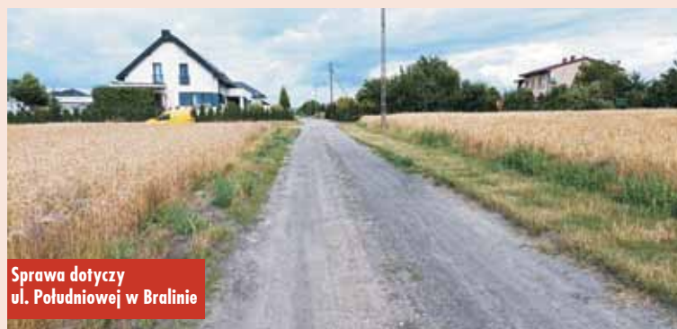
Sprawa dotyczy ul. Południowej w Bralinie

Czytelnicy Biblioteki Publicznej w Bralinie, seniorzy Klubu Senior+ w Bralinie oraz młodzież ze Szkolnego Koła Krajoznawczo-Turystycznego przy Szkole Podstawowej im. Mikołaja Kopernika w Bralinie wzięli udział w wycieczce do Wadowic