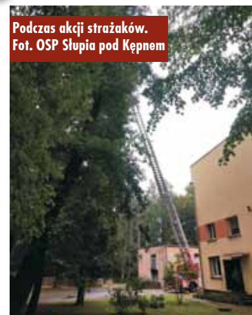
Podczas akcji strażaków.

Po dotarciu stwierdzono, że nad budynkiem znajduje się mocno pochylone drzewo, stwarzające zagrożenie. - Działania strażaków polegały na zabezpieczeniu miejsca zdarzenia, następnie, po sprawieniu drabiny mechanicznej SD-30, przy pomocy mechanicznej pilarki do drewna,