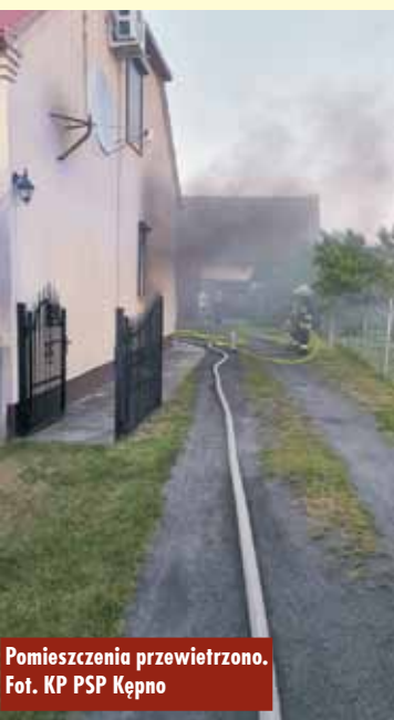
Pomieszczenia przewietrzono.

22 czerwca br., tuż po godzinie 21.00, do Stanowiska Kierowania Komendanta Powiatowego Państwowej Straży Pożarnej w Kępnie wpłynęło zgłoszenie o pożarze w budynku mieszkalnym w Bralinie. Przybyli na miejsce strażacy zastali pożar w pomieszczeniu kotłowni. Wszyscy domownicy opuścili budynek przed przybyciem jednostek ochrony przeciwpożarowej. - Działania strażaków polegały na zabezpieczeniu miejsca zdarzenia, odłączeniu zasilania w energię elektryczną oraz podaniu dwóch prądów wody na źródło pożaru. Po ugaszeniu pożaru pomieszczenie przewietrzono oraz sprawdzono pod kątem obecności tlenu węgla oraz potencjalnych zarzewi ognia – relacjonuje mł. kpt. Jakub Sobczak z KP PSP Kępno. W działania trwające godzinę zaangażowanych było 5 zastępów straży pożarnej. Oprac. KR