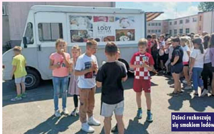
Dzieci rozkoszują się smakiem lodów