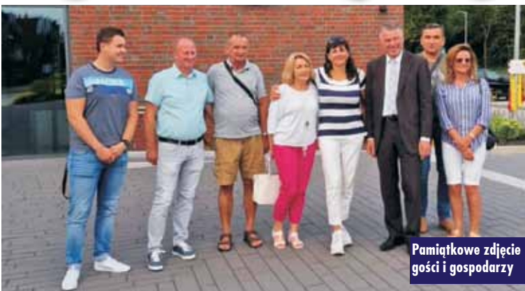
Pamiątkowe zdjęcie gości i gospodarzy