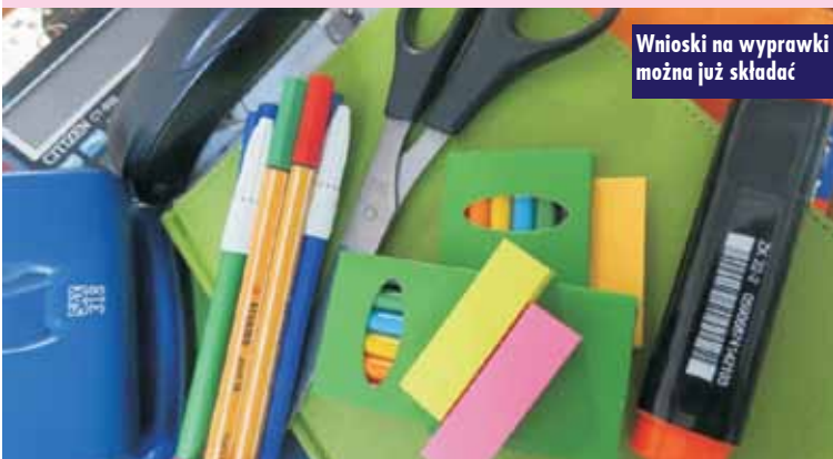
Wnioski na wyprawki można już składać

Pierwszych kilkaset tysięcy świadczeń zostało już przyznanych. Wypłata środków nastąpi 18 lipca 2022 r. W kolejnych dniach będą sukcesywnie kierowane kolejne informacje o przyznaniu wsparcia. W sytuacji, gdy sprawa będzie wymagała przeprowadzenia postępowania wyjaśniającego do rodzica zostanie