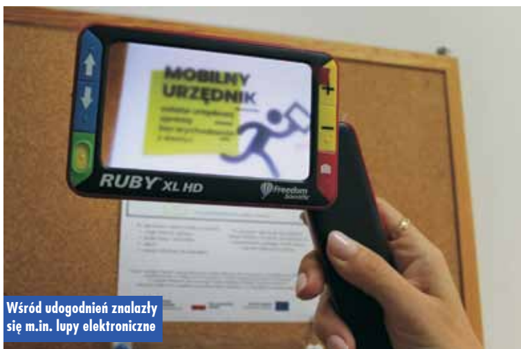
Wśród udogodnień znalazły się m.in. lupy elektroniczne