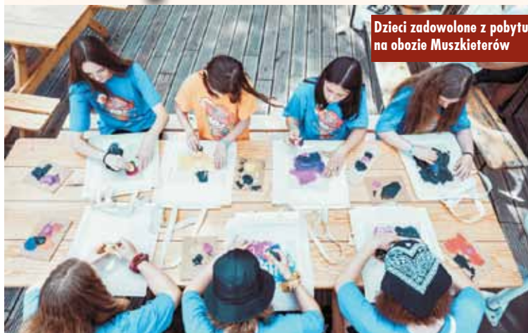
Dzieci zadowolone z pobytu na obozie Muszkieterów

W tym roku na kolonie do Julinka pod Warszawą pojedzie 600 dzieci z całej Polski, w tym około 50, które przyjechały do naszego kraju z objętej wojną Ukrainy. Wśród wypoczywających znajdzie się 98 dzieci z województwa wielkopolskiego. Z kępińskiego Intermarche wytypowano 6 dzieci, podobnie z Brikomarche. W sumie w okresie od 3 lipca do 27 sierpnia zaplanowano osiem turnusów. W ciągu ostatnich czterech edycji akcji fundacja udzieliła wsparcia podopiecznym z ponad 5000 organizacji i wysłała na wakacje ponad 3500 dzieci. Dla wielu z nich był to pierwszy wakacyjny wyjazd poza miejsce zamieszkania.