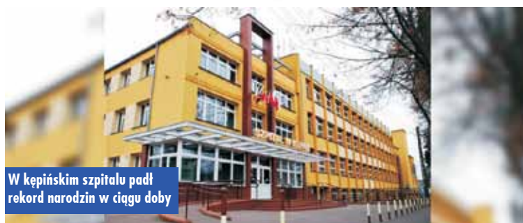
W kępińskim szpitalu padł rekord narodzin w ciągu doby

Oddział Ginekologiczno-Położniczy w kępińskim szpitalu wreszcie doczekał się remontu, który ruszył w ostatnich dniach. Można zauważyć pierwsze zmiany – nowe drzwi wejściowe. Prawdopodobnie już od nowego roku pacjentki będą witane w progach unowocześnionego oddziału.