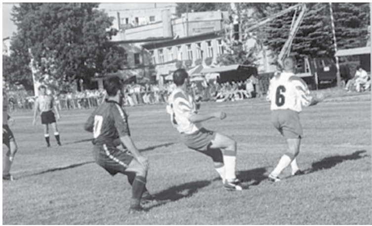
Historia meczów Piasta Błaszki z Polonią Kępno sięga początku lat 50. 29 lipca 1998 r. na Stadionie Miejskim w Kępnie rozegrano spotkanie, którego stawka była inna niż wszystkie. Biało-niebiescy odpadając z dalszej rywalizacji, zaprzepaścili szansę na grę z drugoligowym Naprzodem Rydułtowy