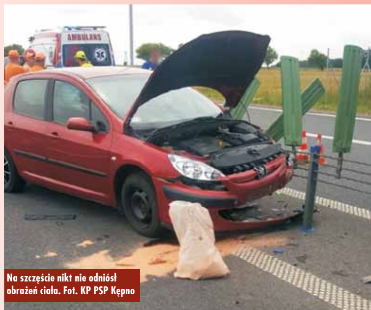
Na szczęście nikt nie odniósł obrażeń ciała.