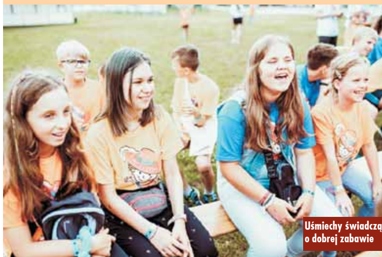
Uśmiechy świadczą o dobrej zabawie

Wyjazdy są w pełni finansowane przez Fundację Muszkieterów, którą tworzą właściciele sklepów Intermarche i Bricomarche oraz dzięki klientom sklepów tych sieci, którzy zapewnili fundacyjne skarbonki ustawione przy kasach lub zakupili torby oznaczone logo fundacji. Właściciele sklepów współpracują z takimi organizacjami jak: Miejskie Ośrodki Pomocy Społecznej, Powiatowe Centra Pomocy Rodzinie, Gminne Ośrodki Pomocy, Domy Dziecka, Szkoły Podstawowe oraz inne organizacje pozarządowe. To właśnie oni najlepiej znają lokalne potrzeby. - Rok szkolny jest dla dzieci pełen wyzwań i ciężkiej pracy, dlatego tak ważny jest wakacyjny wypoczynek. Zasługują na niego każdy, bez względu na sytuację rodzinną, czy materialną. Akcja „Wakacje z Muszkieterami” powstała po to, by najmłodsi mogli bez troski się bawić, wypoczywać na świeżym powietrzu i nawiązywać