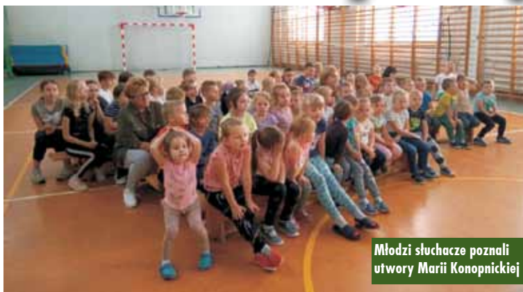
Młodzi słuchacze poznali utwory Marii Konopnickiej