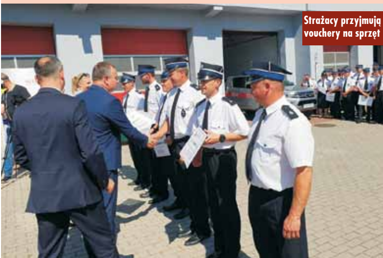
Strażacy przyjmują wouchery na sprzęt

13 lipca br. na terenie Komendy Miejskiej PSP w Koninie odbyła się uroczystość wręczenia promes jednostkom Państwowej Straży Pożarnej oraz Ochotniczej Straży Pożarnej z terenu Wielkopolski. Dotacje pochodzące z WFOŚiGW w Poznaniu oraz Komendy Wojewódzkiej PSP w Poznaniu, dzięki wsparciu ministra Jana Dziedziczaka oraz wszystkich parlamentarzystów Prawa i Sprawiedliwości okręgu kalisko-leszczyńskiego, trafią również do jednostek z naszego terenu: OSP Opatów, OSP Mikorzyn, OSP Wodziezna, OSP Perzów, OSP Słupia pod Kępem i OSP Wielki Buczek. - Przebywając w okręgu, bardzo często spotykam się z druhami i druhami OSP oraz PSP. Widzę, z jakim oddaniem traktują swoją służbę. Rząd przy współpracy instytucji wspierających jednostki chce podziękować za ich gotowość niesienia pomocy drugiemu człowiekowi – stwierdza J. Dziedziczak. Oprac. m