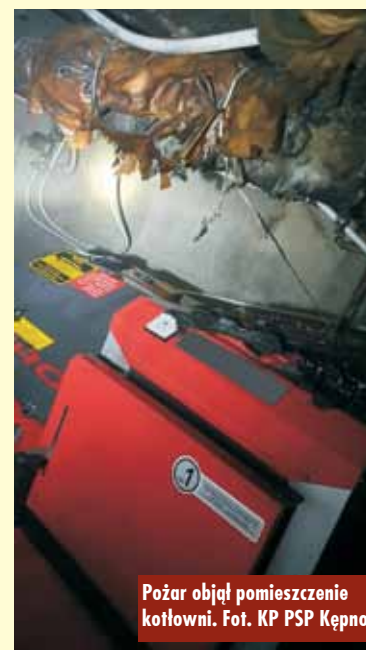
Pożar objął pomieszczenie kotłowni.

22 czerwca br., tuż po godzinie 21.00, do Stanowiska Kierowania Komendanta Powiatowego Państwowej Straży Pożarnej w Kępnie wpłynęło zgłoszenie o pożarze w budynku mieszkalnym w Bralinie. Przybyli na miejsce strażacy zastali pożar w pomieszczeniu kotłowni. Wszyscy domownicy opuścili budynek przed przybyciem jednostek ochrony przeciwpożarowej. - Działania strażaków polegały na zabezpieczeniu miejsca zdarzenia, odłączeniu zasilania w energię elektryczną oraz podaniu dwóch prądów wody na źródło pożaru. Po ugaszeniu pożaru pomieszczenie przewietrzono oraz sprawdzono pod kątem obecności tlenu węgla oraz potencjalnych zarzewi ognia – relacjonuje mł. kpt. Jakub Sobczak z KP PSP Kępno. W działania trwające godzinę zaangażowanych było 5 zastępów straży pożarnej. Oprac. KR