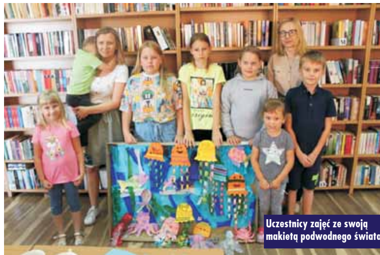
Uczestnicy zajęć ze swoją makietą podwodnego świata