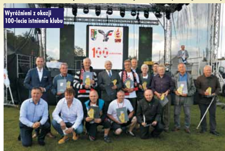
Wyróżnieni z okazji 100-lecia istnienia klubu

sezonu 2010/2011 kiedy to Płomień na koniec sezonu uplasował się na 8. miejscu w tabeli. Tegoroczny bilans końcowy Płomienia to: 12 zwycięstw, 6 remisów i 10 porażek. Ciekawostką jest że w obu rundach wyglądało to identycznie, a więc kolejno 6 zwy-