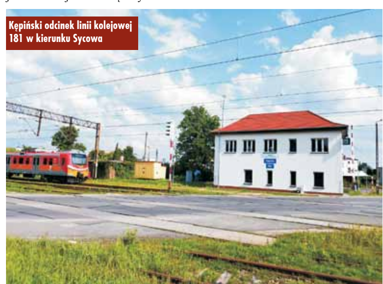
Kępiński odcinek linii kolejowej 181 w kierunku Sycowa

jowy Plan Odbudowy. Modernizacja linii Kępno-Oleśnica o szacowanej wartości 723 mln zł jest jedną z 25 inwestycji kolejowych wpisanych do Krajowego Planu Odbudowy. Wszystkie muszą zostać zakończone do sierpnia 2026 r. Źródłem ich finansowania będzie specjalny fundusz utworzony dla wzmocnienia europejskiej gospodarki w reakcji na kryzys wywołany pandemią COVID-19. Komisja Europejska zatwierdziła polski KPO 1 czerwca br., uzależniając jednak wypłaty dotacji i pożyczek od działań w obszarze sądownictwa. Jednak zdaniem ekspertów inwestycja nie jest zagrożona brakiem finansowania.