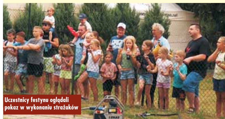
Uczestnicy festynu oglądali pokaz w wykonaniu strażaków