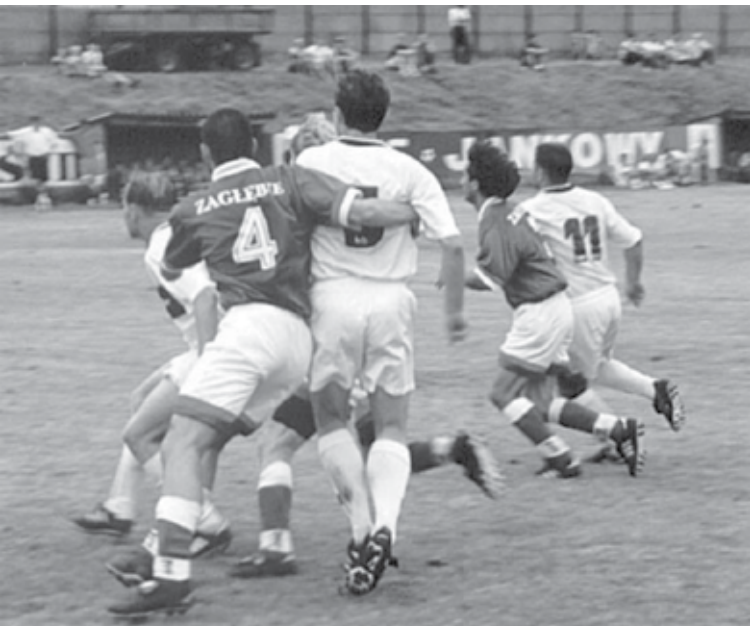
W meczu walki Zagłębie Sosnowiec zrewanżowała się za bolesną klęskę sprzed niespełna dwóch miesięcy