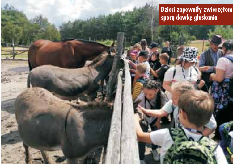
Dzieci zapewniły zwierzętom sporą dawkę głaskania