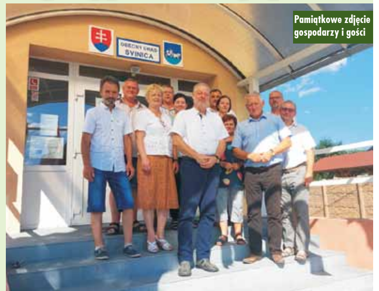
Pamiątkowe zdjęcie gospodarzy i gości

Biblioteka Publiczna w Bralinie zorganizowała konkurs plastyczny dla uczniów szkół podstawowych