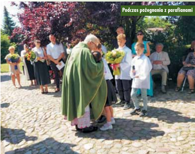
Podczas pożegnania z parafianami