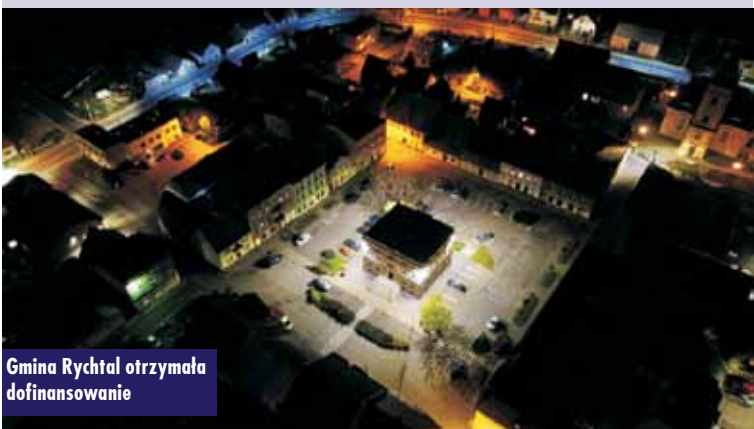
Gmina Rychtal otrzymała dofinansowanie