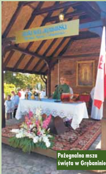
Pożegnalna msza święta w Grębaninie