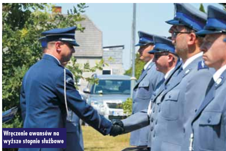
Wręczenie awansów na wyższe stopnie służbowe

komendanta wojewódzkiego Policji w Poznaniu insp. S. Piekut odczytał list skierowany do funkcjonariuszy i pracowników cywilnych, podpisany przez komendanta wojewódzkiego Policji w Poznaniu nadinsp. Piotra Mąkę . - Jesteście częścią największej formacji mundurowej, strzegącej bezpieczeństwa i porządku publicznego na terenie województwa wielkopolskiego. Bycie policjantem to zaszczyt i zobowiązanie. Policyjna służba wymaga poświęceń i odwagi. W swoich codziennych zadaniach strzeżecie bezpieczeństwa obywateli i przestrzegania prawa – czytał, dziękując mundurowym za służbę, jak również kultywowanie historii policji. Pogratulował też zdobytych awansów i wyróżnień, a także wyników komendy. Natomiast komendant powiatowy Policji w Kępnie mł. insp. M. Józefiak złożył życzenia i podziękowania wszystkim funkcjonariuszom i pracownikom policji oraz podkreślił wagę pomocy ze strony samorządów. Wskazywał też, jak ważną rolę pełnią policjanci dla społeczeństwa. - Jesteśmy nowoczesną, profesjonalną i stale rozwijającą się formacją, ukierunkowaną na niesienie pomocy społeczeństwu. Dostosowujemy się do zagrożeń związanych z przestępczością kryminalną, gospodarczą, realizujemy zadania prewencyjne, sprawujemy nadzór nad drogami. (...) Istotnym elementem jest czas reakcji na zgłoszenie,