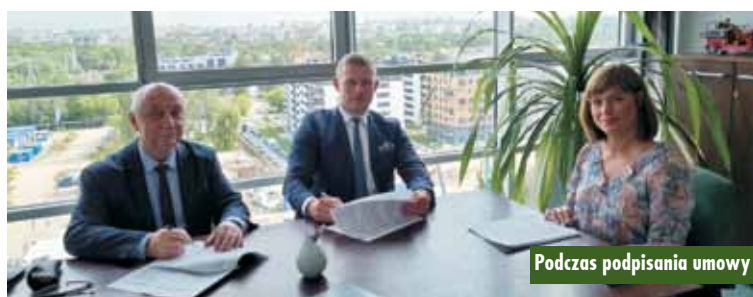
Podczas podpisania umowy