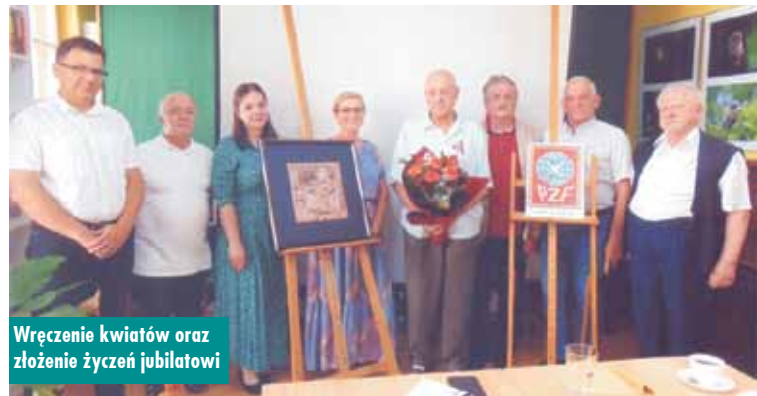
Wręczenie kwiatów oraz złożenie życzeń jubilatowi

Trzech mężczyzn w kominiarkach dokonało rozboju w kamienicy przy ul. Sikorskiego