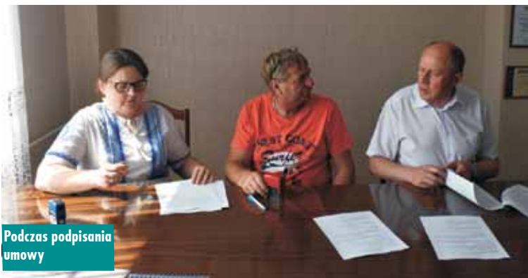
Podczas podpisywania umowy

GŁOS TRZCINICY lipiec 2022, nr 30 (1247)