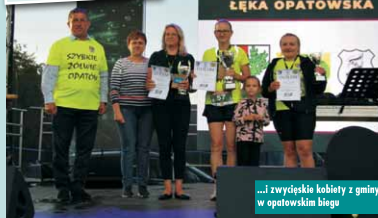
...i zwycięskie kobiety z gminy w opatowskim biegu

Dni Gminy Łęka Opatowska zgromadziły wielu mieszkańców oraz gości