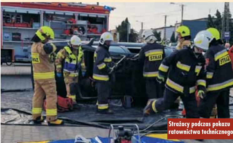
Strażacy podczas pokazu ratownictwa technicznego