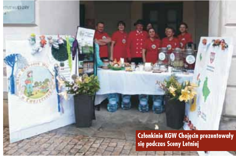
Członkinie KGW Chojęcina prezentowały się podczas Sceny Letniej

Wyjazd ten nie byłby możliwy, gdyby nie wsparcie ze strony Urzędu Gminy Bralin we współpracy z firmą „Transporter Travel”. Oprac. KR