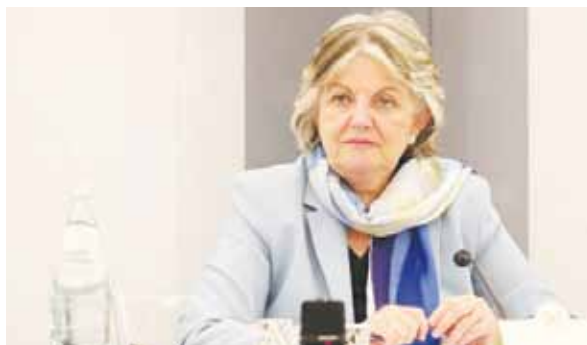
Elisa Ferreira, komisarz ds. spójności i reform

Inne kluczowe filary modernizacji, które otrzymają wsparcie, to potencjał badawczo-innowacyjny oraz rozwój rozwiązań cyfro-