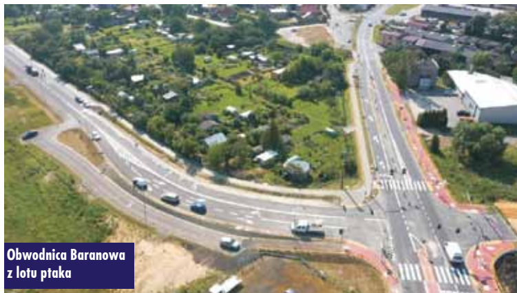
Obwodnica Baranowa z lotu ptaka

Ta wiadomość z całą pewnością ucieszy milusińskich z Łęki Mroczeńskiej. Wkrótce powstaną tam plac zabaw oraz miejsce rekreacyjne