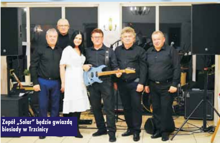
Zespół „Solar” będzie gwiazdą biesiady w Trzcinicy

11 lipca 2022 roku zawarta została umowa pomiędzy Gminą Trzcinica a firmą K@ROL M MUSIC