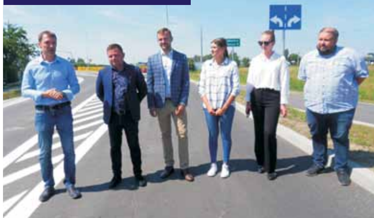
Pracownicy grupy „Strabag” odpowiedzialni za budowę obwodnicy