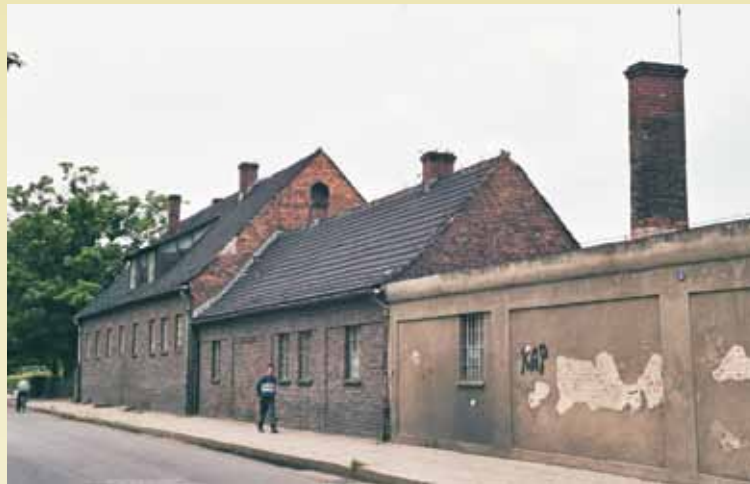
Stolarnia i warsztat - widok od ul. Dworcowej

ceramiczną. Stolarka okien i drzwi drewniana. W oknach kraty lub maszynowe metalowe okiennice. Drzwi do piwnicy stalowe - pancerne. Budynek założony jest na planie wydłużonego prostokąta. czterospadowym stromym dachem. Elewacje ceglano-nietynkowane, wykonane w duchu oszczędnego modernizmu. Brak tu detali architektonicznych. Kompozycję elewacji uzyskano dzięki różnorodnym otworom. Lico elewacji wskazuje na pospieszną – wojenną realizację. Budynek wyposażony jest w instalację elektryczną, wodną, kanalizacyjną, telefoniczną.