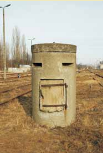
Typowy dla czasów wojny jednoosobowy posterunek wartowniczo-obsługowy zlokalizowany w pobliżu lokomotywowni i nastawni

BASA (Bahn-Selbstanschluss-Anlage) to niemiecki system łączności uruchomiony na niemieckiej kolei (Deutsche Reichsbahn) w 1928 roku. Oparty był on na opracowanym przez firmę Siemens & Halske sprzęcie w nowej na owe czasy technologii terminalowej. W latach trzydziestych ubiegłego wieku elementy tego systemu zostały połączone w jedną całość umożliwiając skoordynowanie całej niemieckiej sieci przewozów kolejowych. Podczas drugiej wojny światowej sieć objęła całą okupowaną Europę, tworząc jeden z najlepszych systemów łączności. Był to pierwszy w historii Europy automatyczny system łączności o zasięgu kontynentalnym. Posiadanie takich możliwości w zakresie centralnego sterowania ruchem kolejowym stwarzało ogromne możliwości logistyczne szybkiego przemieszczania wojsk oraz odpowiedniego reagowania na potrzeby gospodarki