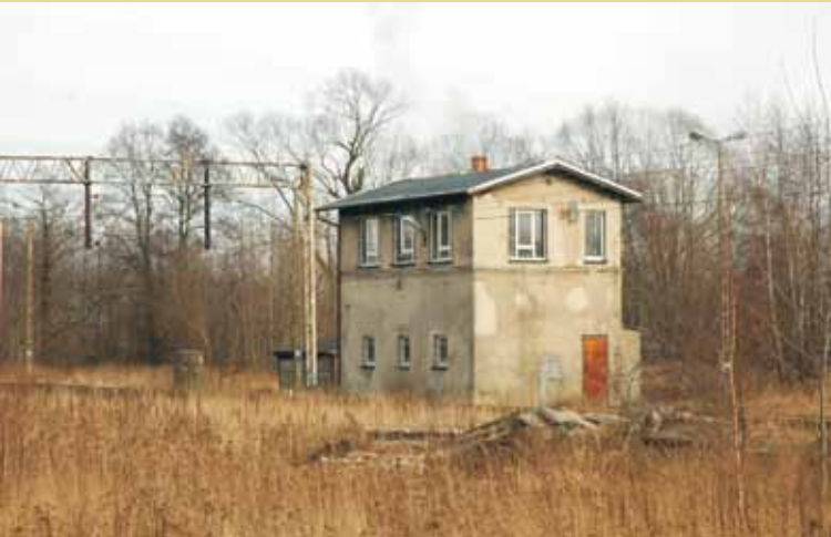
Nastawnia wykonawcza z lat 40. XX w. przy parowozowni, widoczny w pobliżu jednoosobowy posterunek wartowniczy

polskie oddziały zdołały jedynie wysadzić wiadukt na linii kluczborskiej i uszkodzić tor na stacji Kępno Zachodnie. Po objęciu władzy przez niemieckich okupantów szybko usunięto uszkodzenia. Kolej podjęła