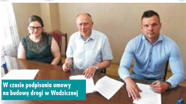
W czasie podpisania umowy na budowę drogi w Wodźnicznej