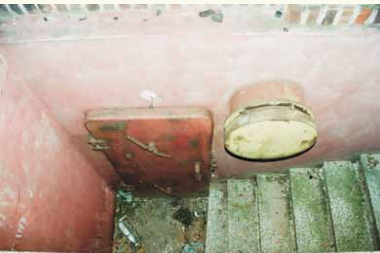
Wejście do schronu pod budynkiem, widoczne oryginalne drzwi gazoszczelne i element instalacji wentylacyjnej

pracę, a w związku z likwidacją dotychczasowych granic wzrosła ilość obsługiwanych pociągów na poszczególnych liniach. Przystąpiono również do modernizacji urządzeń obsługi kolei. Rozpoczęły się intensywne prace budowlane, podczas których