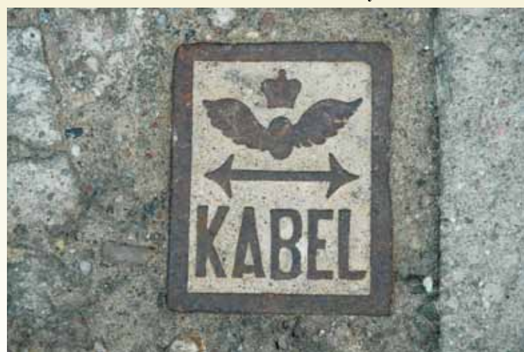
Tabliczka żeliwna z oznaczeniem miejsca przebiegu kabla dla kolei

niczony, z przybudówką jednokondygnacyjną od południa. Elewacje otynkowane, pozbawione detali (występuje jedynie gzyms podokienny) o zróżnicowanych prostokątnych otworach.