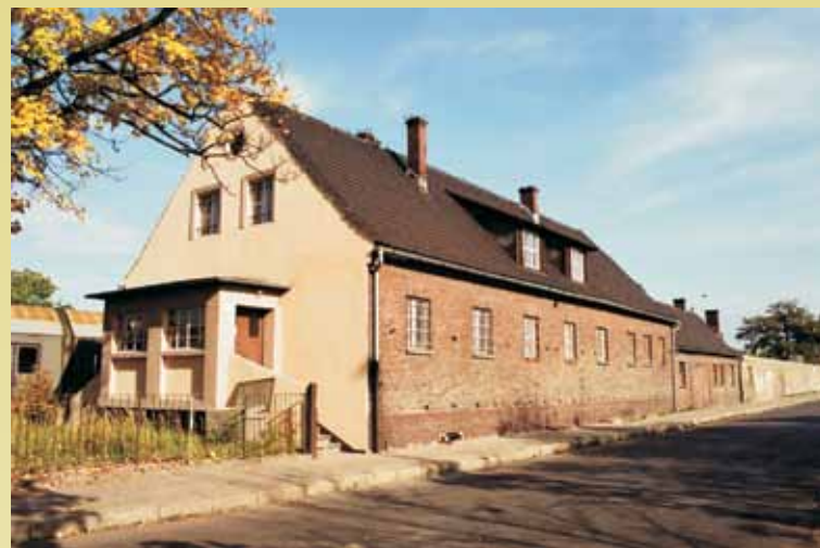
Stolarnia i warsztat

Po wojnie Polska zyskała w ten sposób sprawnie działającą sieć łączności kolejowej, w szczególności na terenach Wielkopolski wcielonych na początku wojny do Rzeszy. Niemiecki skrót BASA jako określenie węzła zastąpiono odpowiednikiem polskim KATS (Kolejowa Automatyczna Telefoniczna Stacja). Co ciekawe pracownicy kolejowi w potocznym języku określali elementy tej łączności słowem „bazowa”. W większości nieświadomi byli pochodzenia tej nazwy, że nie od słowa „baza”, ale od podobnie brzmiącego „BASA”. Podkreślić należy, że urządzenia centrali po rozbudowie do systemu czterocyfrowego eksploatowane były aż do 2000 roku. Budynek BASA, a następnie komunikacji kolejowej, jest obiektem ceglany o nietynkowanych elewacjach. Posiada dach o konstrukcji drewnianej, kryty dachówką