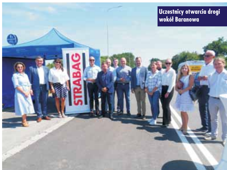
Uczestnicy otwarcia drogi wokół Baranowa