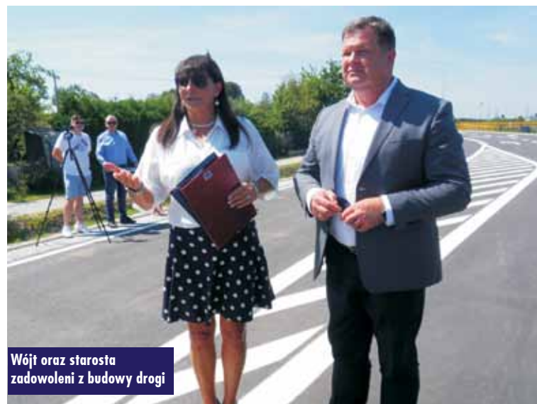
Wójt oraz starosta zadowoleni z budowy drogi

Współfinansującym powstanie drogi był Rządowy Fundusz Rozwoju Dróg, stąd wojewoda wielkopolskie Michał Zieliński , nie mogąc uczestniczyć w otwarciu tej arterii,