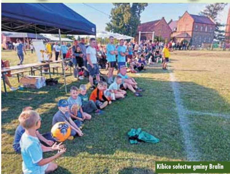
Kibice sołectw gminy Bralin

31 lipca już po raz drugi odbyły się piłkarskie zmagania sołectw z terenu gminy Bralin. Głównym celem turnieju była integracja sołectw, aktywizacja społeczeństwa lokalnego, propagowanie kultury fizycznej, a przede wszystkim dobra zabawa. W zawodach wzięło udział 10 drużyn. Pierwsze miejsce zajęło sołectwo Bralin, drugie - Czermin i trzecie sołectwo Tabor Mały/Weronikopole