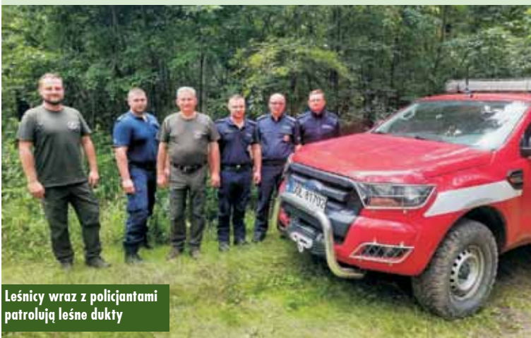
Leśnicy wraz z policjantami patrolują leśne dukty

Policji w Laskach, wraz z funkcjonariuszami Straży Leśnej Nadleśnictwa