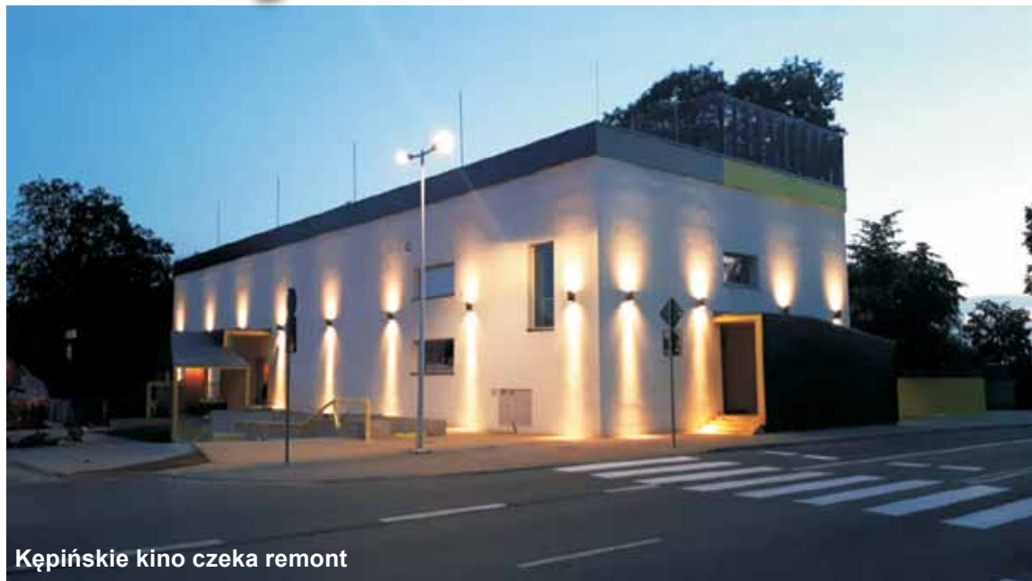
Kępińskie kino czeka remont

Dotacja została pozyskana w ramach tegorocznej edycji programu „Kulisy kultury”, który umożliwia uzyskanie wsparcia finansowego na poprawę i rozwój infrastruktury kulturalnej.