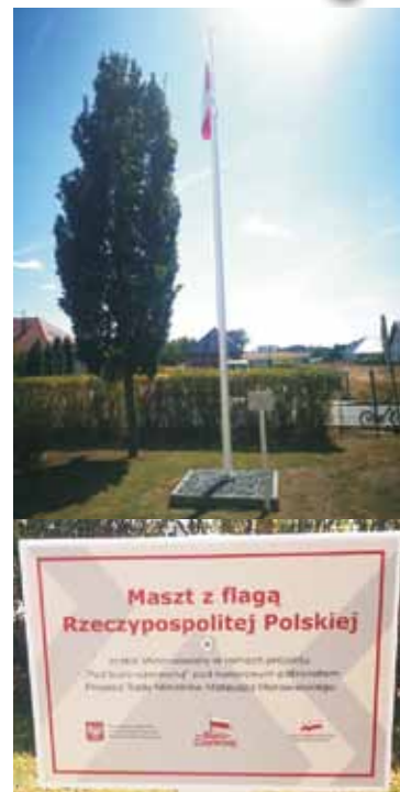
Więcej informacji o projekcie: https://www.gov.pl/web/bialoczerwona

Już niebawem zagospodarowany zostanie teren rekreacyjny w Domasławie