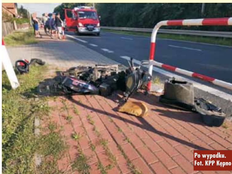
Po wypadku.

Kolejny wypadek z udziałem samochodu osobowego oraz motocykla – tym razem na drodze łączącej miejscowości Słupia pod Bralinem oraz Pisarzowice