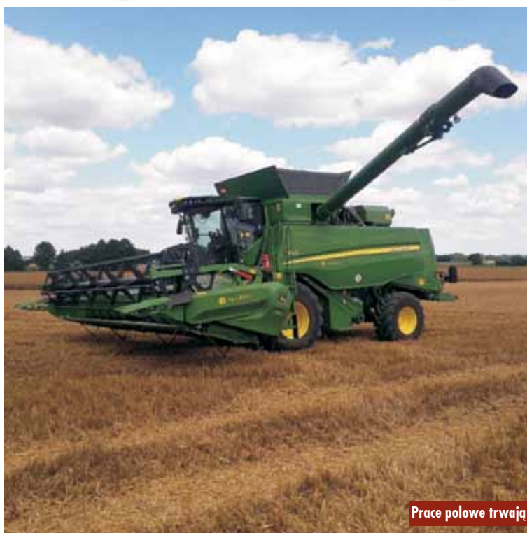
Prace polowe trwają

Dominującą rośliną zbożową jest pszenżyto ozime, jednak w ostatnim czasie zauważalnie wzrosła uprawa słonecznika. Plony zbóż i rzepaku są zadowalające, a na lepszych stanowiskach nieco powyżej normy, często dość mocno zróżnicowane w zależności od stopnia zasobności i jakości gleb, a także stosowanej intensywności uprawy.