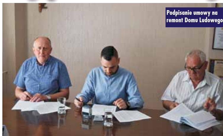
Podpisanie umowy na remont Domu Ludowego