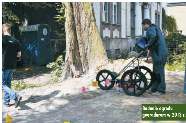
Badanie ogrodu georadarem w 2013 r.