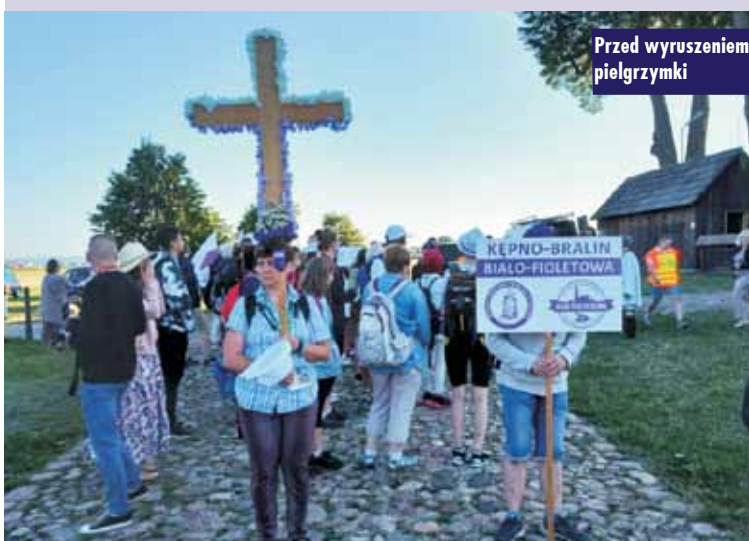
Przed wyruszeniem pielgrzymki