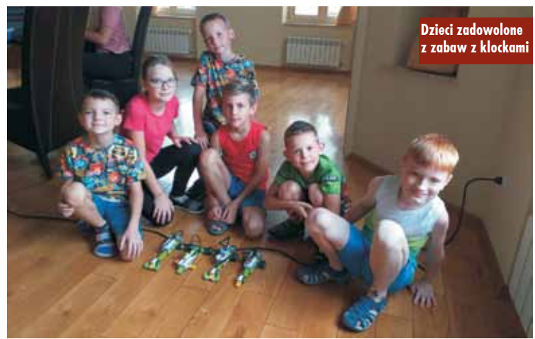
Dzieci zadowolone z zabaw z klockami

oraz w Łęce Opatowskiej przez instruktorów z Wieruszowskiego Domu Kultury.