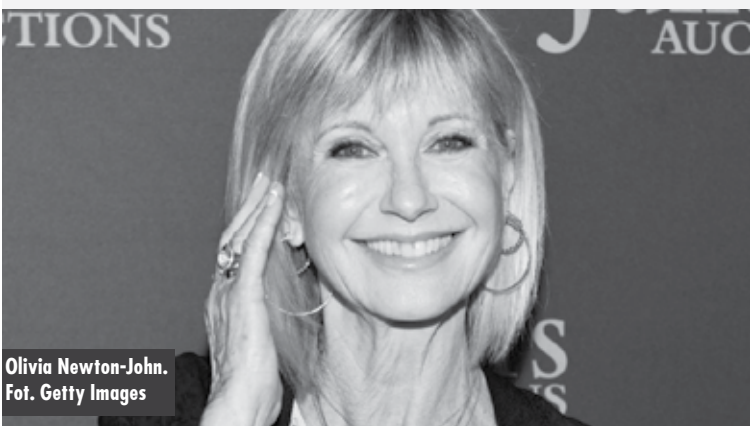
Olivia Newton-John.